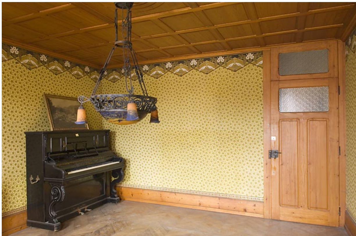
Ancienne salle à manger, vue depuis la fenêtre ouvrant sur la rue des Remparts. 25, Jougne, 16 rue de l' Eglise