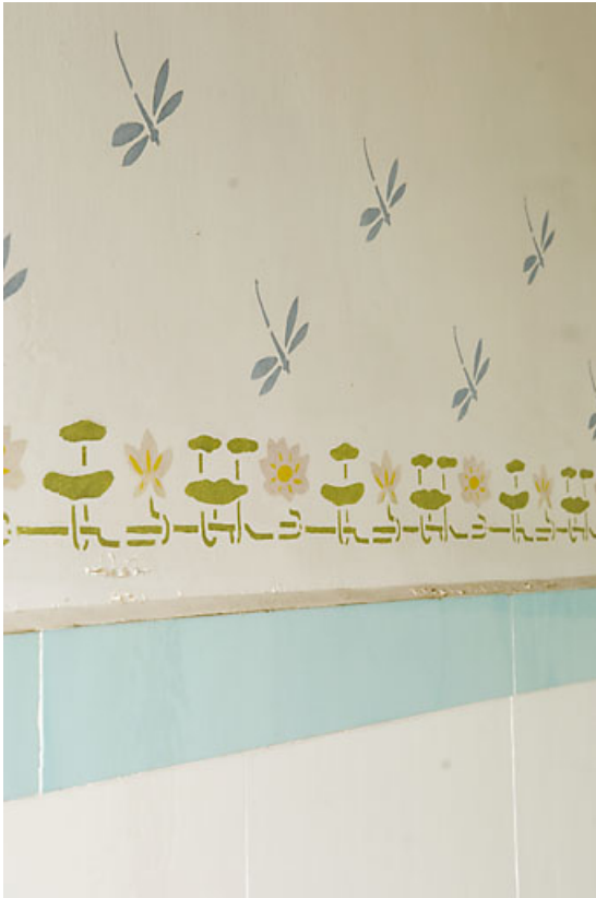
Ancienne salle de bains, détail du décor aux libellules.