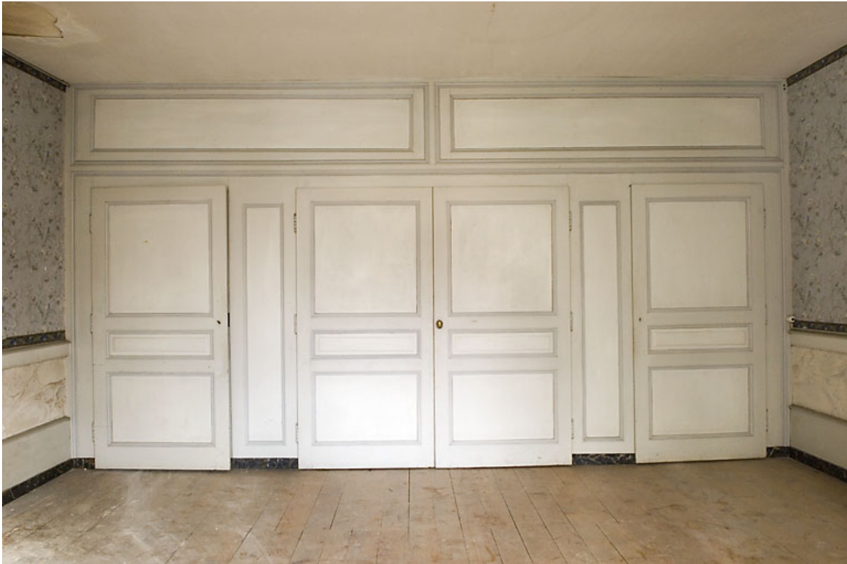
Chambre avec alcôve fermée.