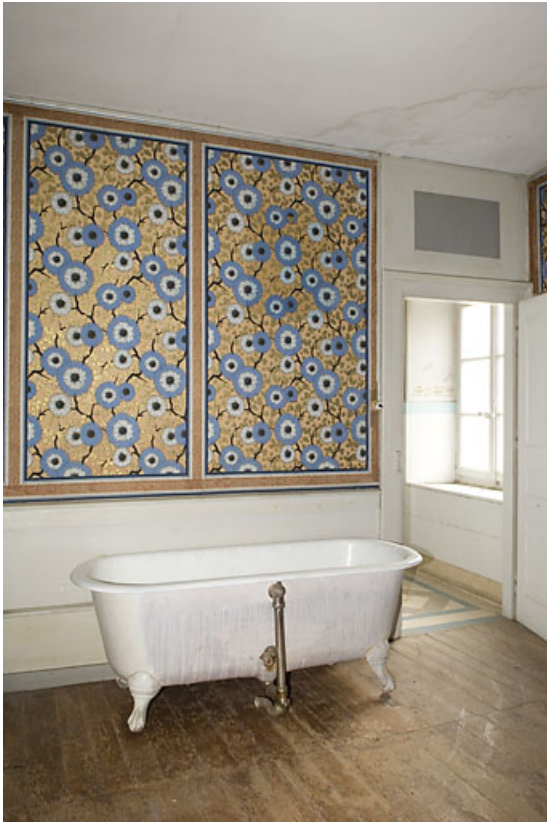
Chambre dont les baies ouvrent sur la rue de l'Eglise.