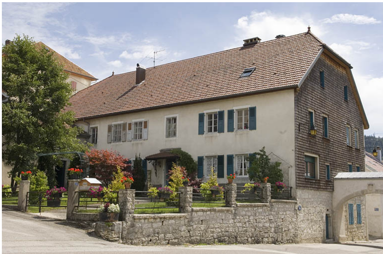
Façade antérieure et façade latérale droite.