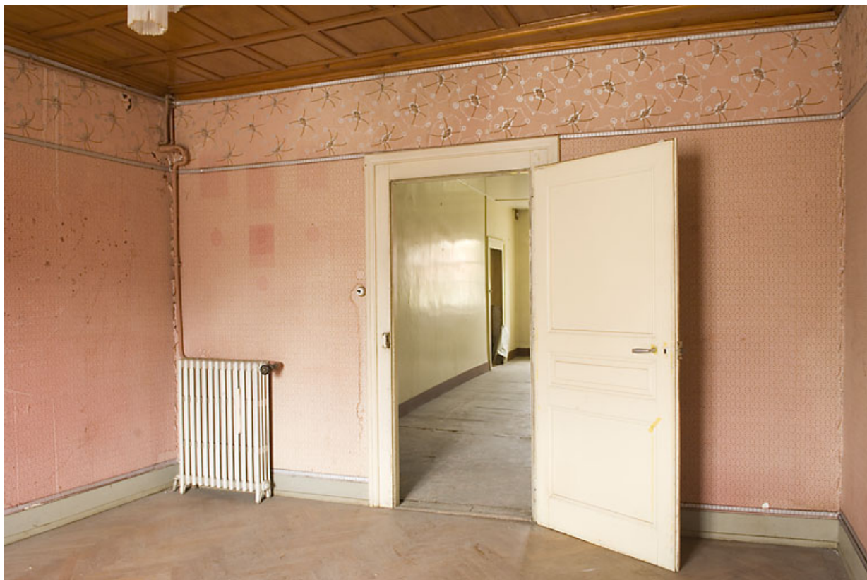
Chambre à côté de la cuisine, côté rue des Remparts, porte ouvrant sur le couloir. 25, Jougne, 16 rue de l' Eglise