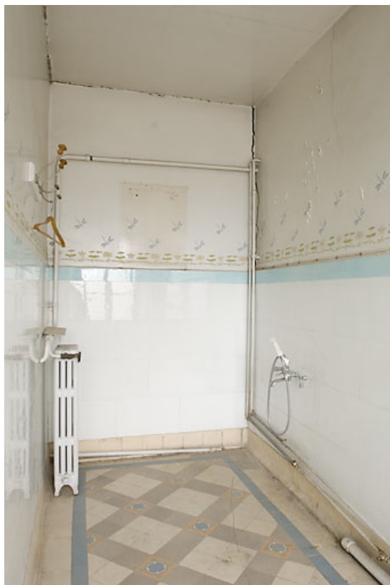
Ancienne salle de bains, dont la baie ouvre sur la rue des Remparts. 25, Jougne, 16 rue de l' Eglise