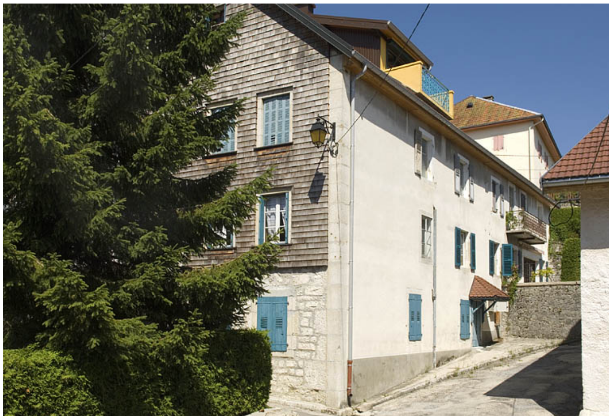
Façade latérale droite et façade postérieure.