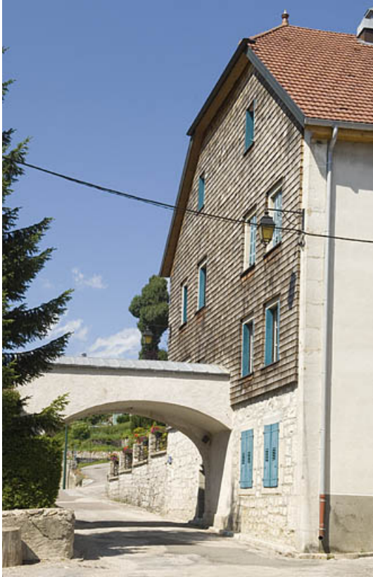
Façade latérale, côté rue de l'Eglise.