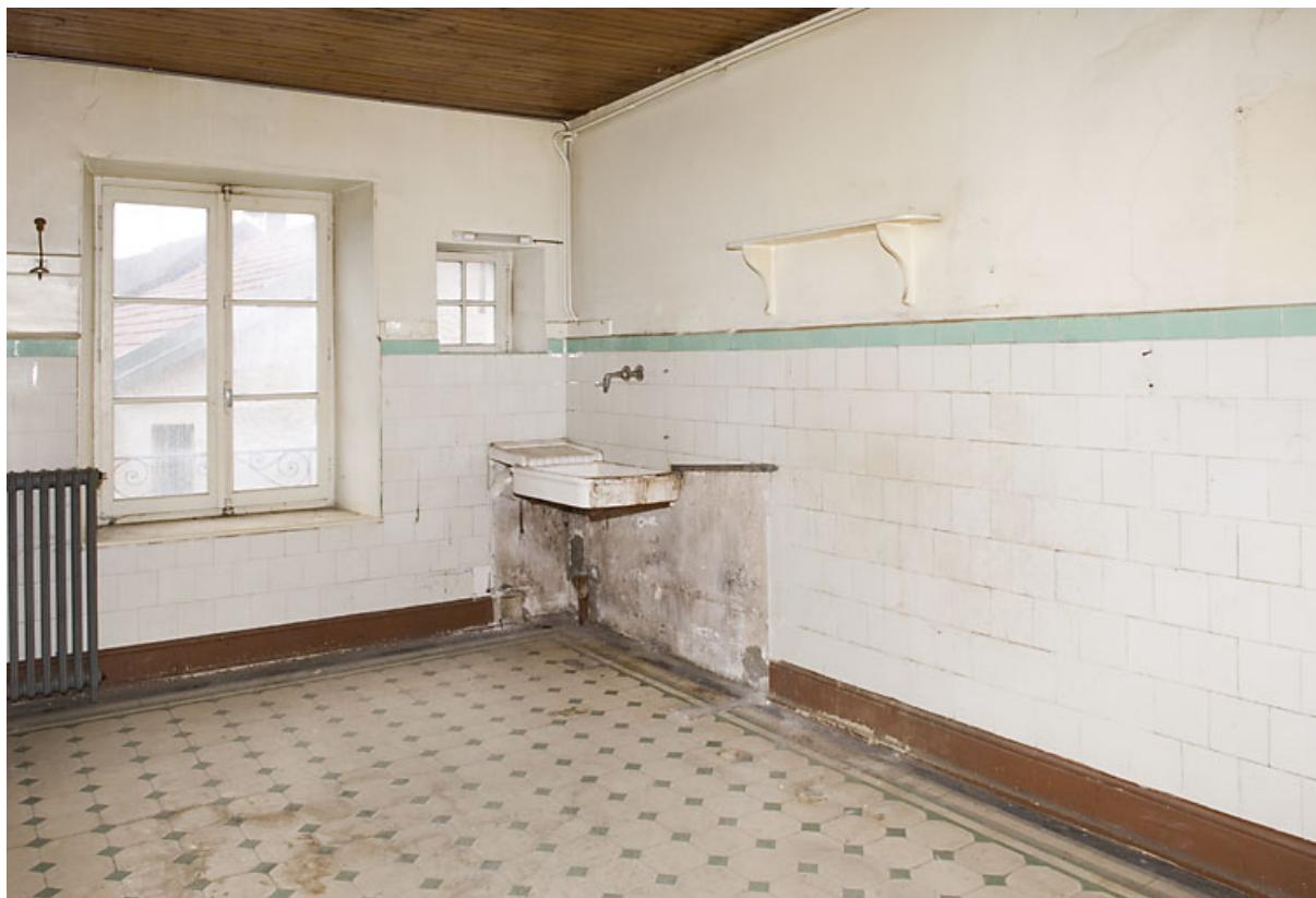
Ancienne cuisine, avec évier en pierre, donnant sur la rue des Remparts. 25, Jougne, 16 rue de l' Eglise