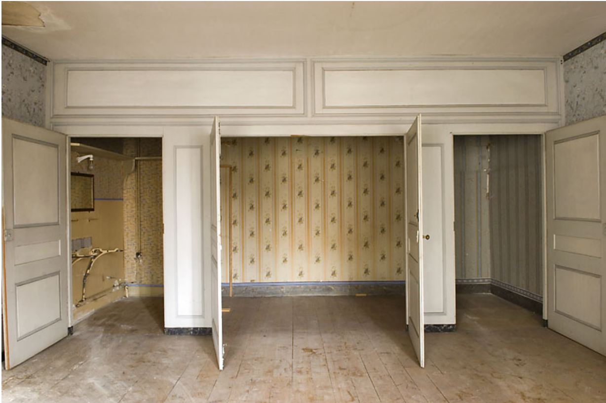
Chambre avec alcôve ouverte.