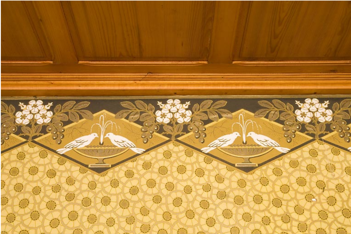
Ancienne salle à manger, détail du papier peint.