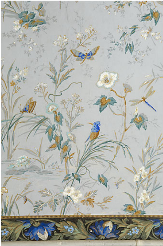
chambre avec alcôve, détail du papier peint.