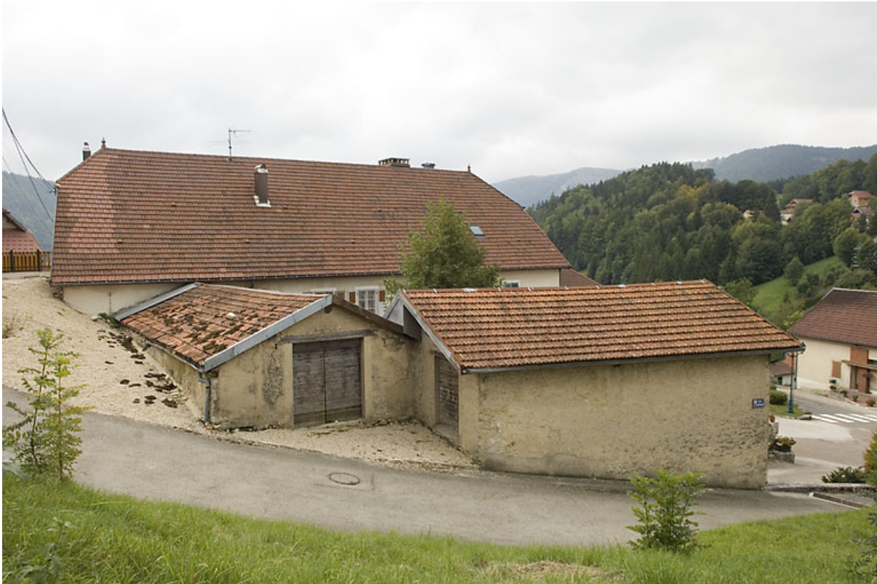
Vue des communs depuis la rue du Château.