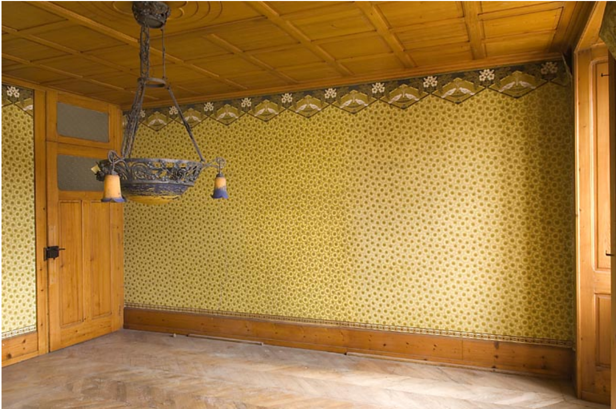
Ancienne salle à manger, vue en direction de la porte conduisant au couloir. 25, Jougne, 16 rue de l' Eglise