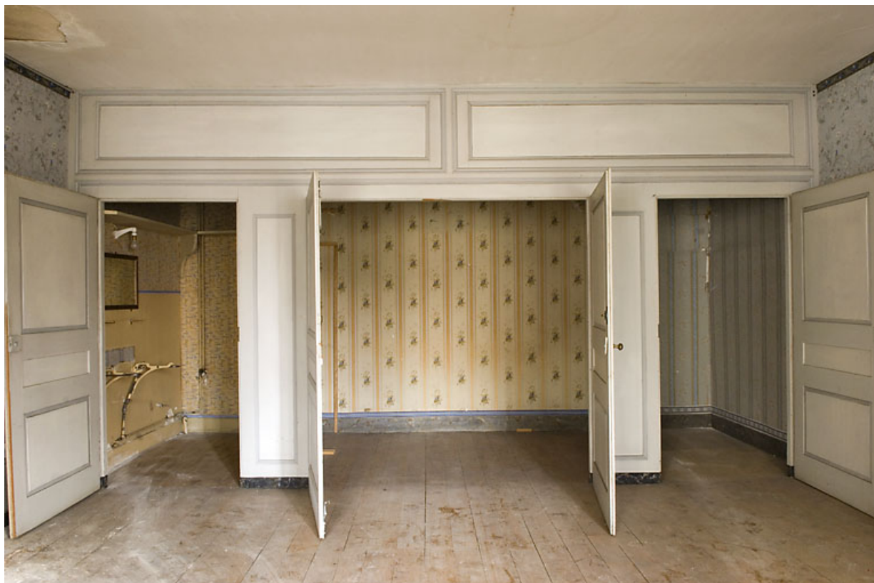
Chambre avec alcôve ouverte.