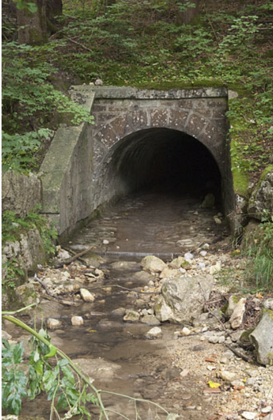
L'entrée du pont, aqueduc du Vaubillon (n°6), aux Tavins. 25, Jougne