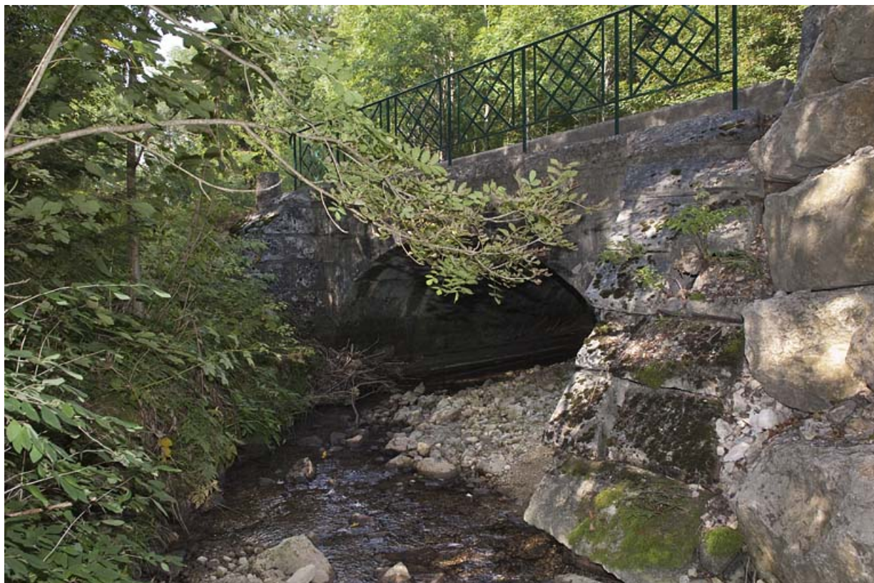
Pont sur la Jougnena ( n°3), vue depuis l'aval. 25, Jougne