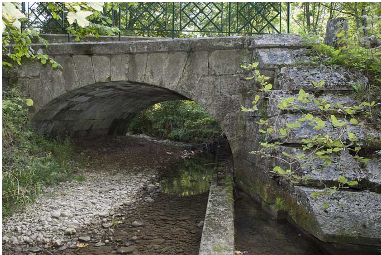
Pont sur la Jougnana (n°3), vue depuis l'amont. 25, Jougne