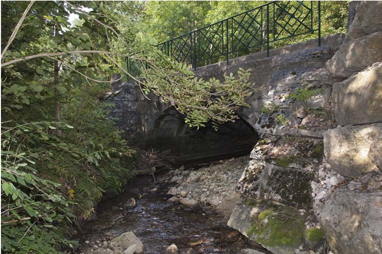
Pont sur la Jougnena ( n°3), vue depuis l'aval. 25, Jougne