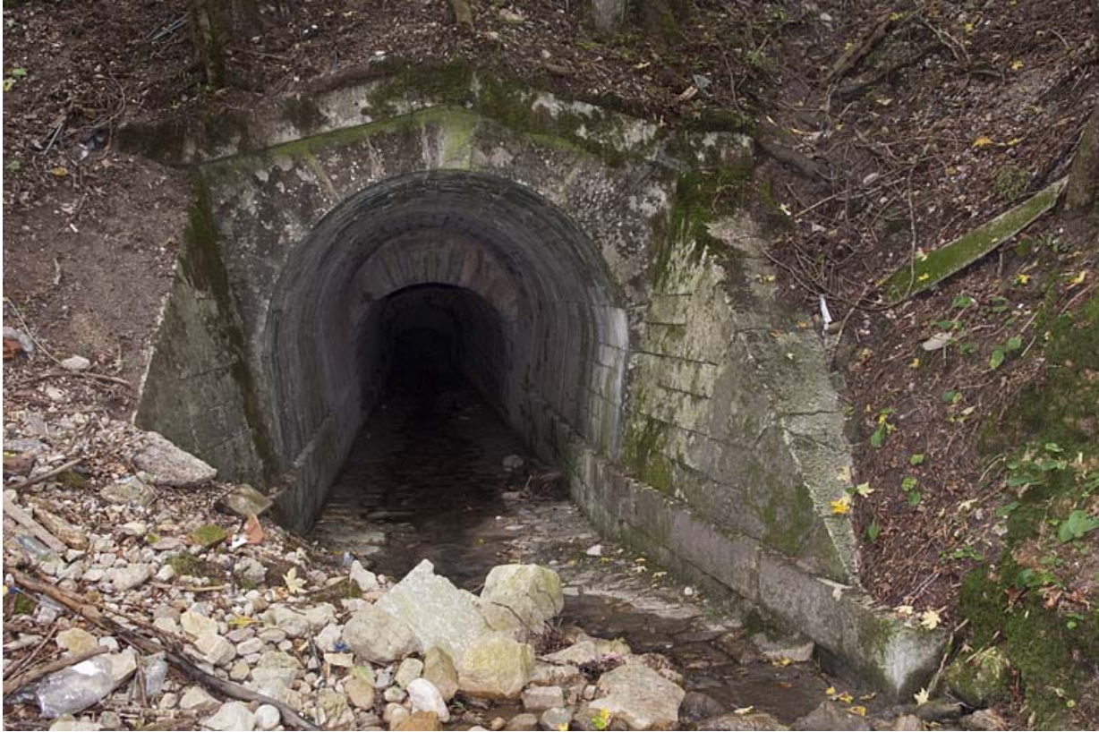
Sortie du pont, aqueduc du Vaubillon (n°6) à La Ferrière. 25, Jougne