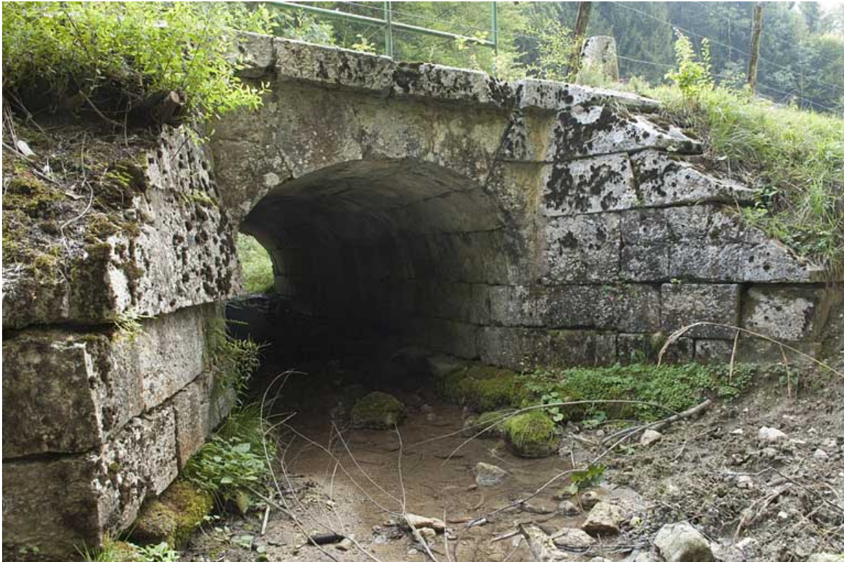
Pont du ruisseau de la Goulette (n° 18), vu depuis l'aval. 25, Jougne