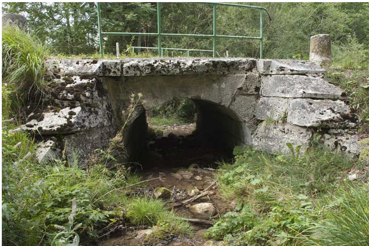
Pont du ruisseau de la Goulette ( n°18), vue depuis l'amont. 25, Jougne