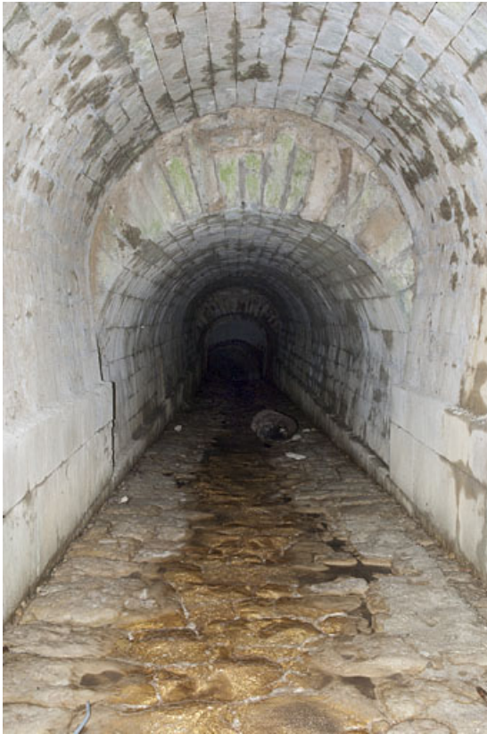
Détail de la voûte du pont, aqueduc du Vaubillon (n°6). 25, Jougne