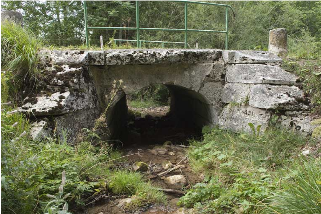
Pont du ruisseau de la Goulette ( n°18), vue depuis l'amont. 25, Jougne