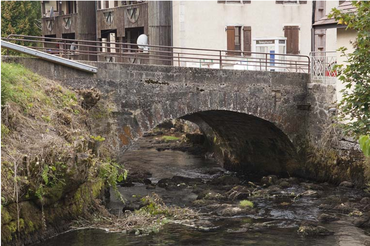
Pont sur la Jougnena (n°13), vue depuis l'amont.