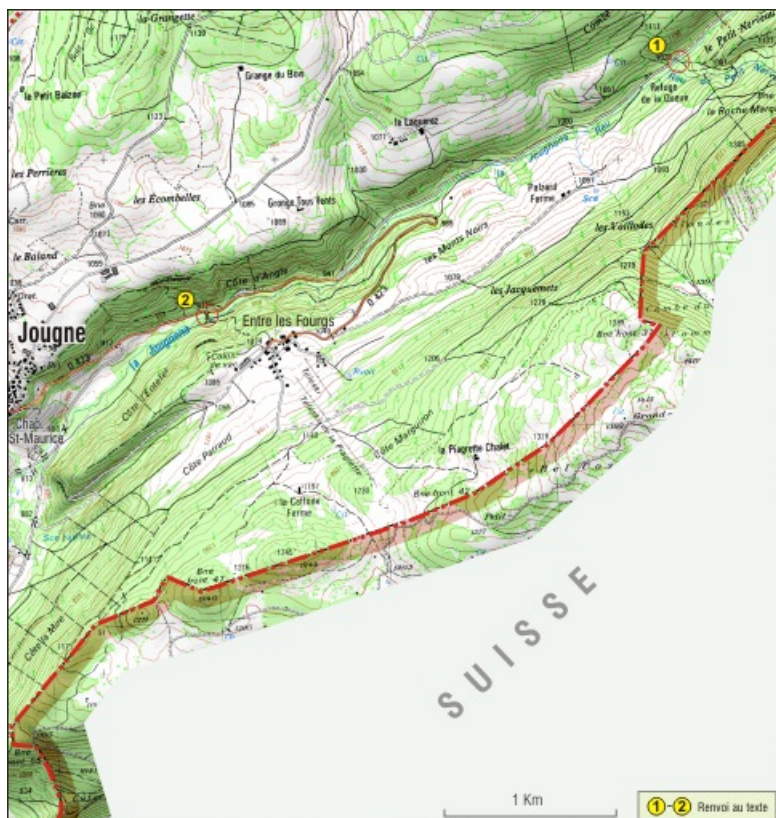
ensemble ponts partie nord-est 25, Jougne

Extrait de la carte IGN, échelle 1/25 000 ; SCAN 25 (c) IGN - 2008, Licence n° 2008CISE29-68.