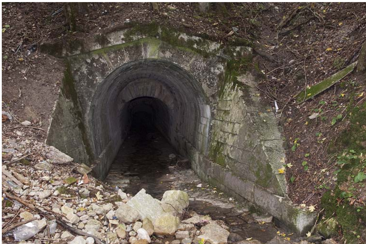
Sortie du pont, aqueduc du Vaubillon (n°6) à La Ferrière. 25, Jougne