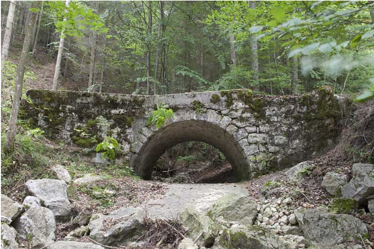
Pont sur le ruisseau de la Grange des Pauvres (n°7), vue depuis l'aval. 25, Jougne