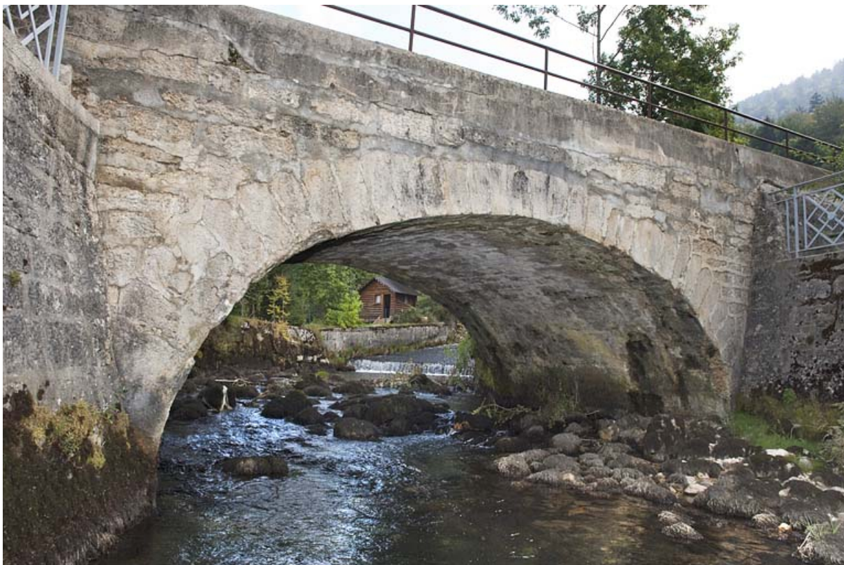
Pont sur la Jougna (n°13), vue depuis l'aval. 25, Jougne