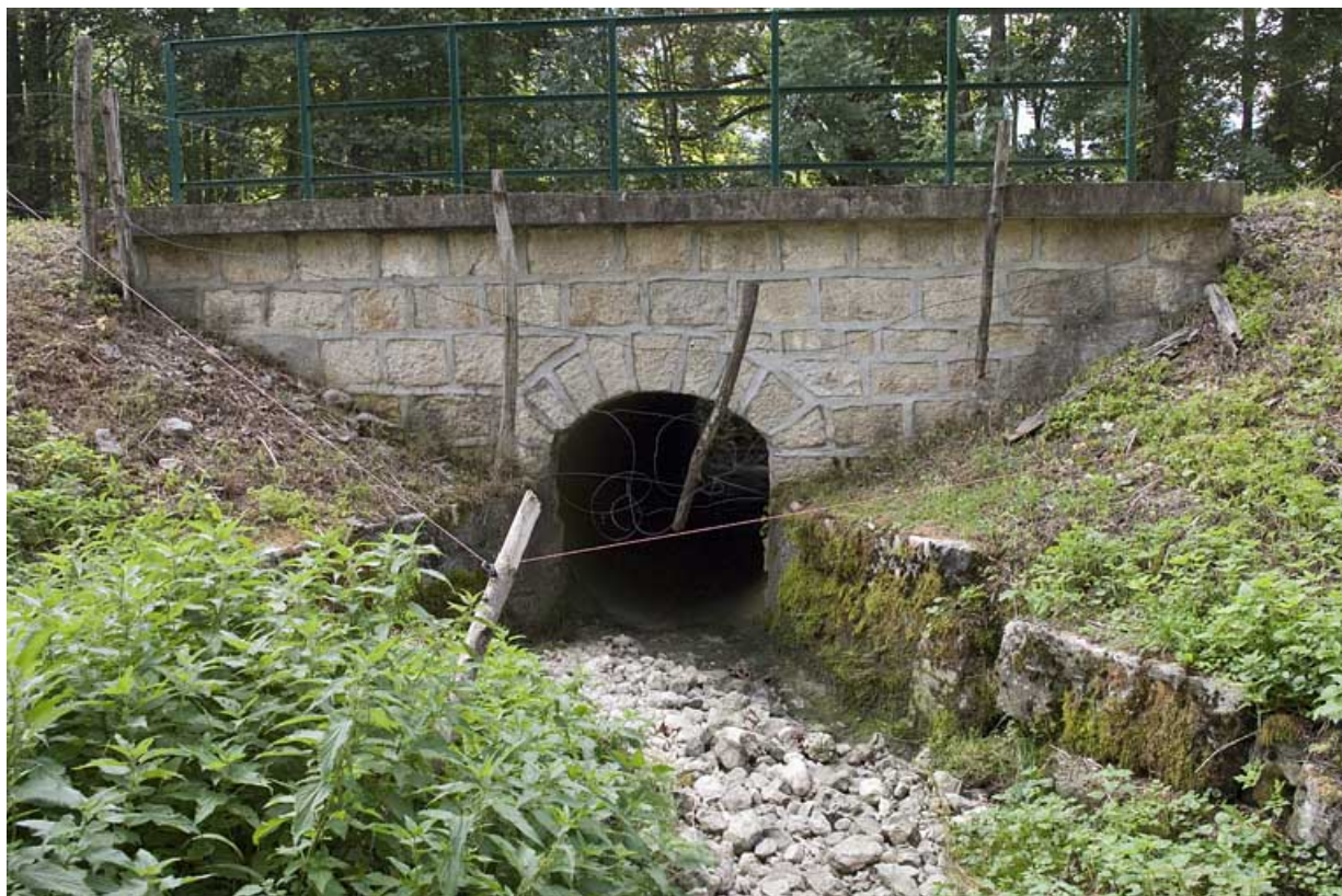
Pont sur la Servante (n°5), vue depuis l'amont. 25, Jougne