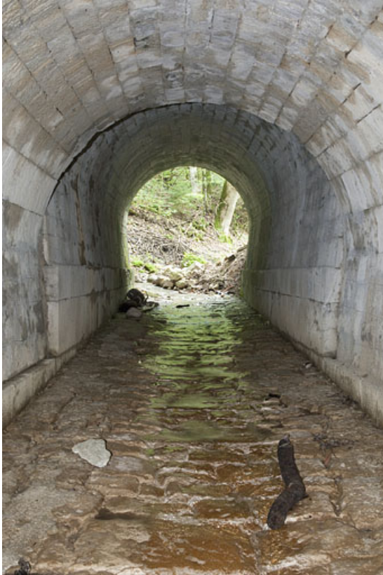
Intérieur du pont, aqueduc (n°6) en direction des Tavins. 25, Jougne