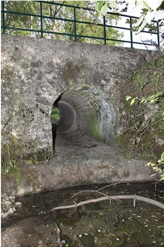
Pont sur la Servante (n°5), vue depuis l'aval. 25, Jougne