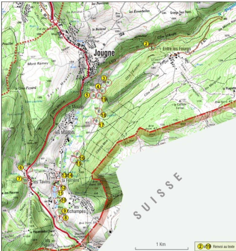
ensemble ponts partie ouest et sud 25, Jougne