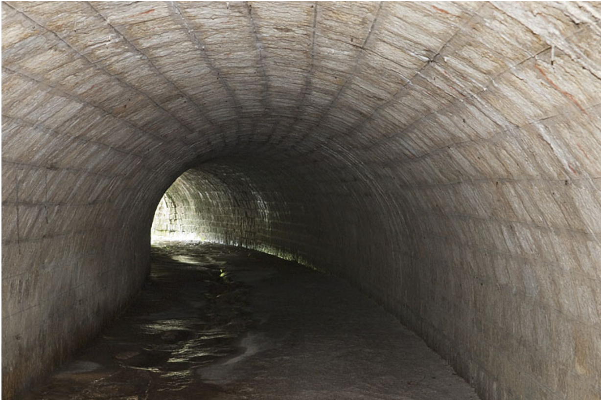
Intérieur du pont, aqueduc du Vaubillon (n°6) en direction de La Ferrière. 25, Jougne