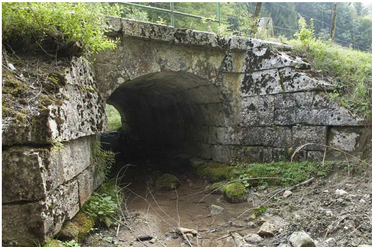
Pont du ruisseau de la Goulette (n° 18), vu depuis l'aval. 25, Jougne