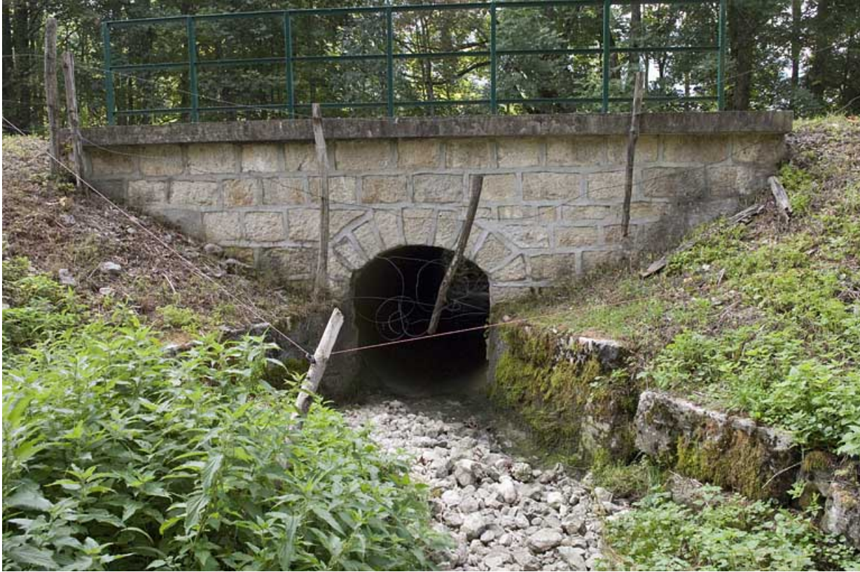
Pont sur la Servante (n°5), vue depuis l'amont. 25, Jougne