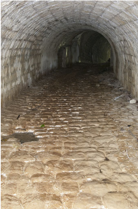
Intérieur du pont,aqueduc du Vaubillon (n°6), détail du pavage. 25, Jougne