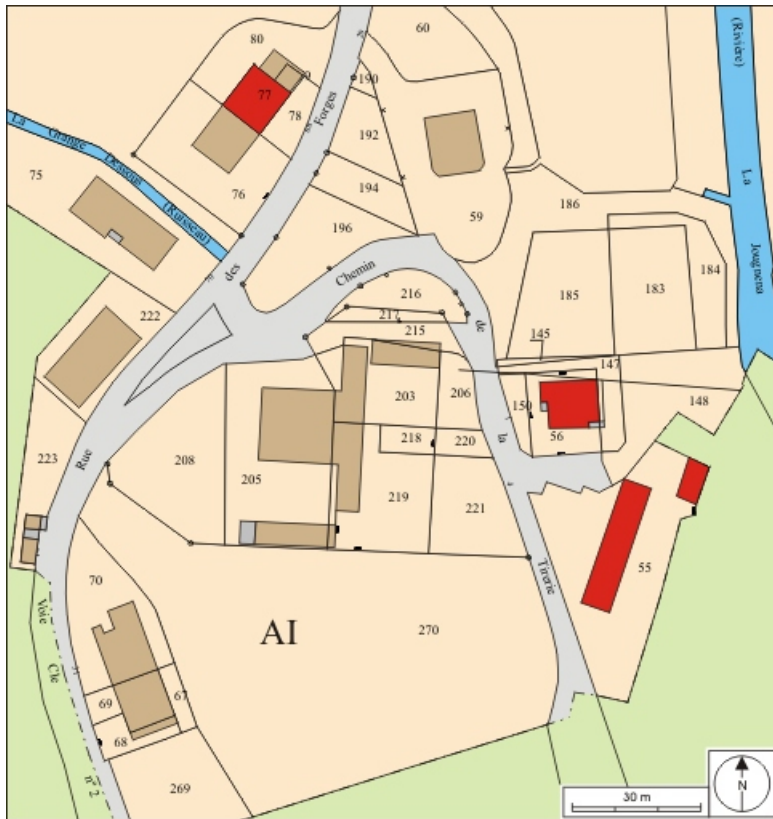
Plan masse et de situation. Extrait du plan cadastral, 2008, section AI, échelle 1/1 000. 25, Jougne, 1 rue de la Tonnellerie, lieudit : la Ferrière