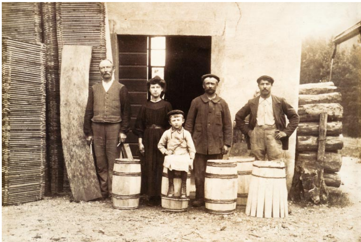
[Les tonneliers], [1er quart 20e siècle ?].

25, Jougne, 1 rue de la Tirerie, lieudit : la Ferrière