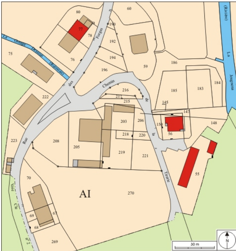
Plan masse et de situation. Extrait du plan cadastral, 2008, section AI, échelle 1/1 000. 25, Jougne, 1 rue de la Tonnellerie, lieu-dit : la Ferrière