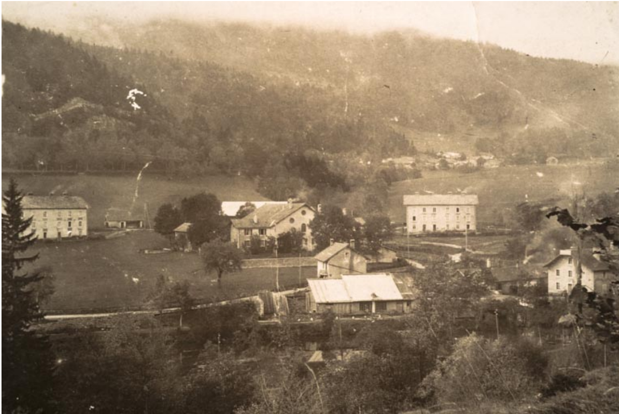
Vue générale après l'incendie de 1913

25, Jougne, 1 rue de la Tirerie, lieudit : la Ferrière