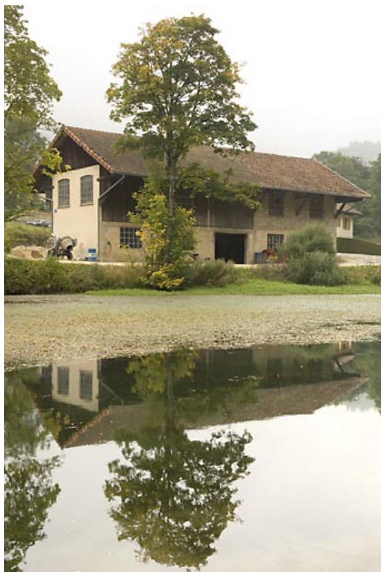
Vue de la tonnellerie du côté de la Jougne. 25, Jougne, 1 rue de la Tirerie, lieudit : la Ferrière