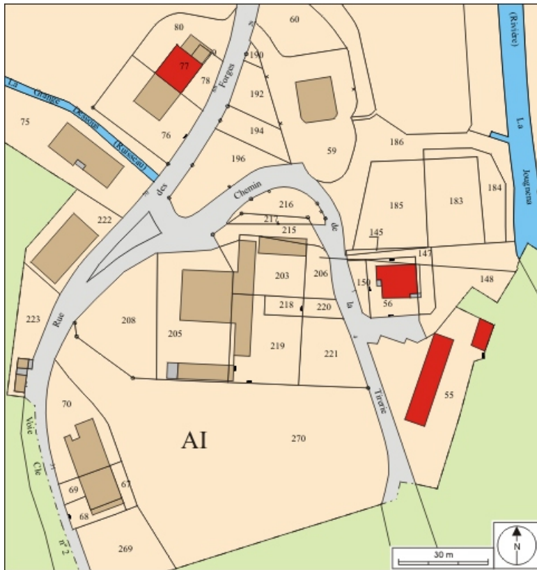
Plan masse et de situation. Extrait du plan cadastral, 2008, section AI, échelle 1/1 000. 25, Jougne, 1 rue de la Tonnellerie, lieudit : la Ferrière