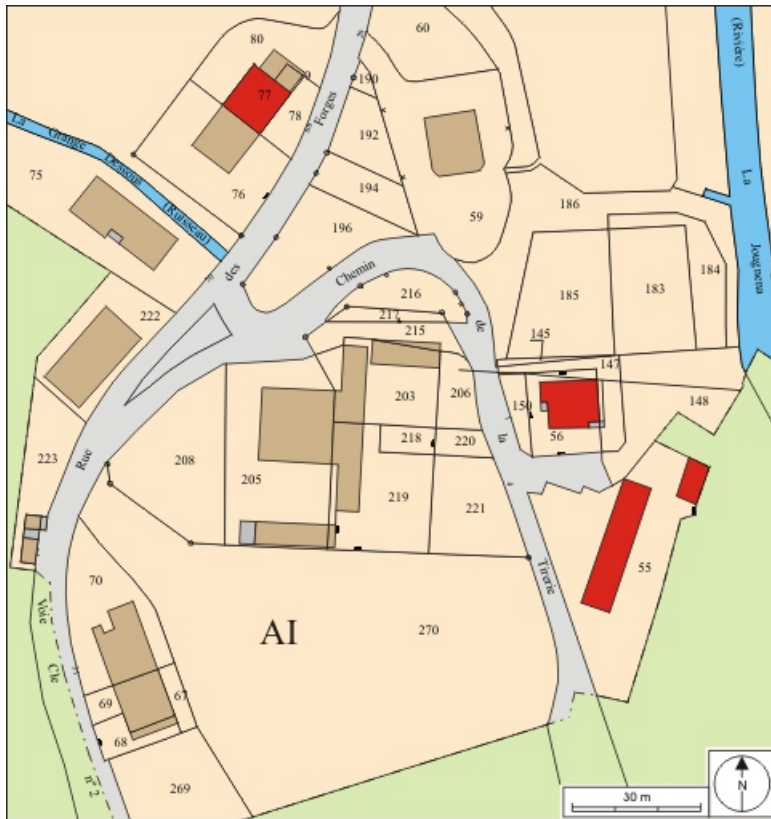
Plan masse et de situation. Extrait du plan cadastral, 2008, section AI, échelle 1/1 000. 25, Jougne, 1 rue de la Tonnellerie, lieu-dit : la Ferrière