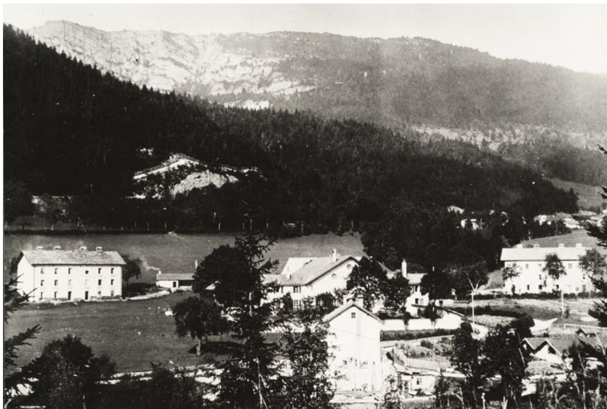
Vue générale après l'incendie de 1913

25, Jougne, 1 rue de la Tirerie, lieudit : la Ferrière