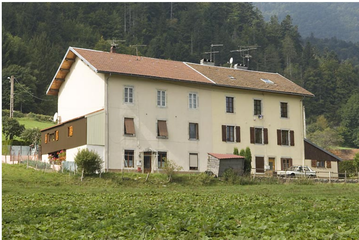
Immeuble à logements, façade postérieure.

25, Jougne, 1 rue de la Tirerie, lieudit : la Ferrière