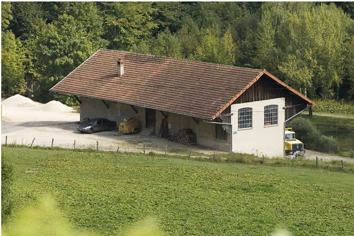
Vue générale de la tonnellerie depuis la rue des Forges.

25, Jougne, 1 rue de la Tirerie, lieudit : la Ferrière