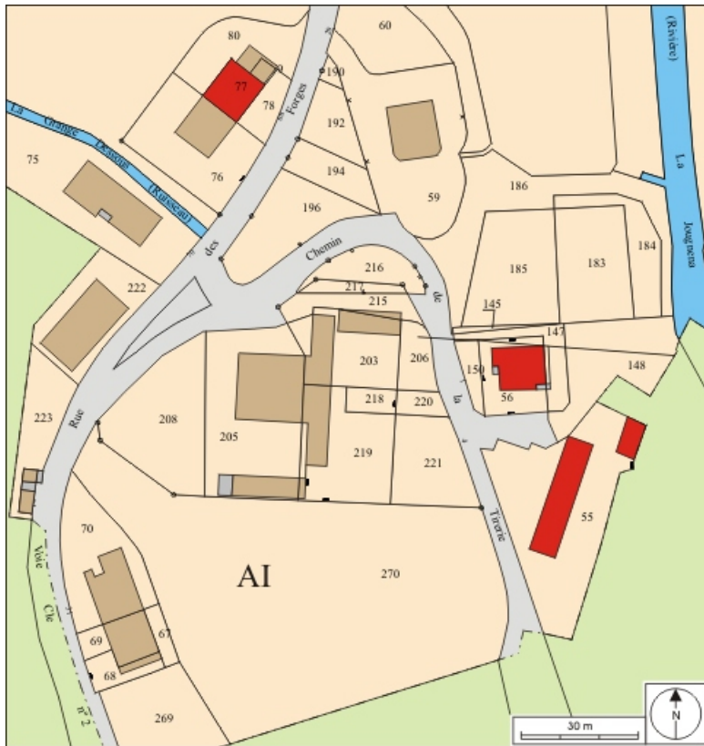
Plan masse et de situation. Extrait du plan cadastral, 2008, section AI, échelle 1/1 000. 25, Jougne, 1 rue de la Tirerie, lieudit : la Ferrière