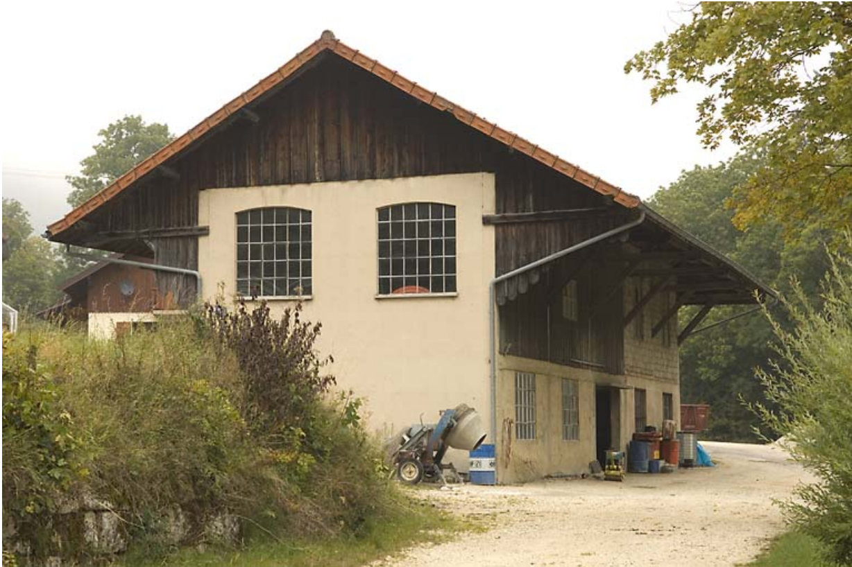
Vue rapprochée de la tonnellerie du côté de la Jougne.

25, Jougne, 1 rue de la Tirerie, lieudit : la Ferrière