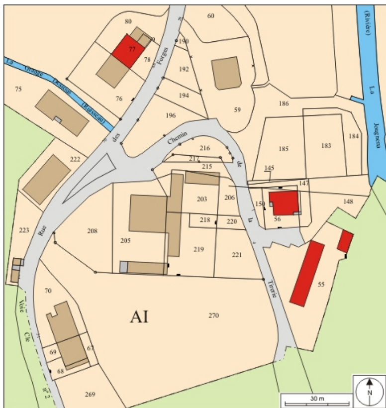
Plan masse et de situation. Extrait du plan cadastral, 2008, section AI, échelle 1/1 000. 25, Jougne, 1 rue de la Tirerie, lieudit : la Ferrière