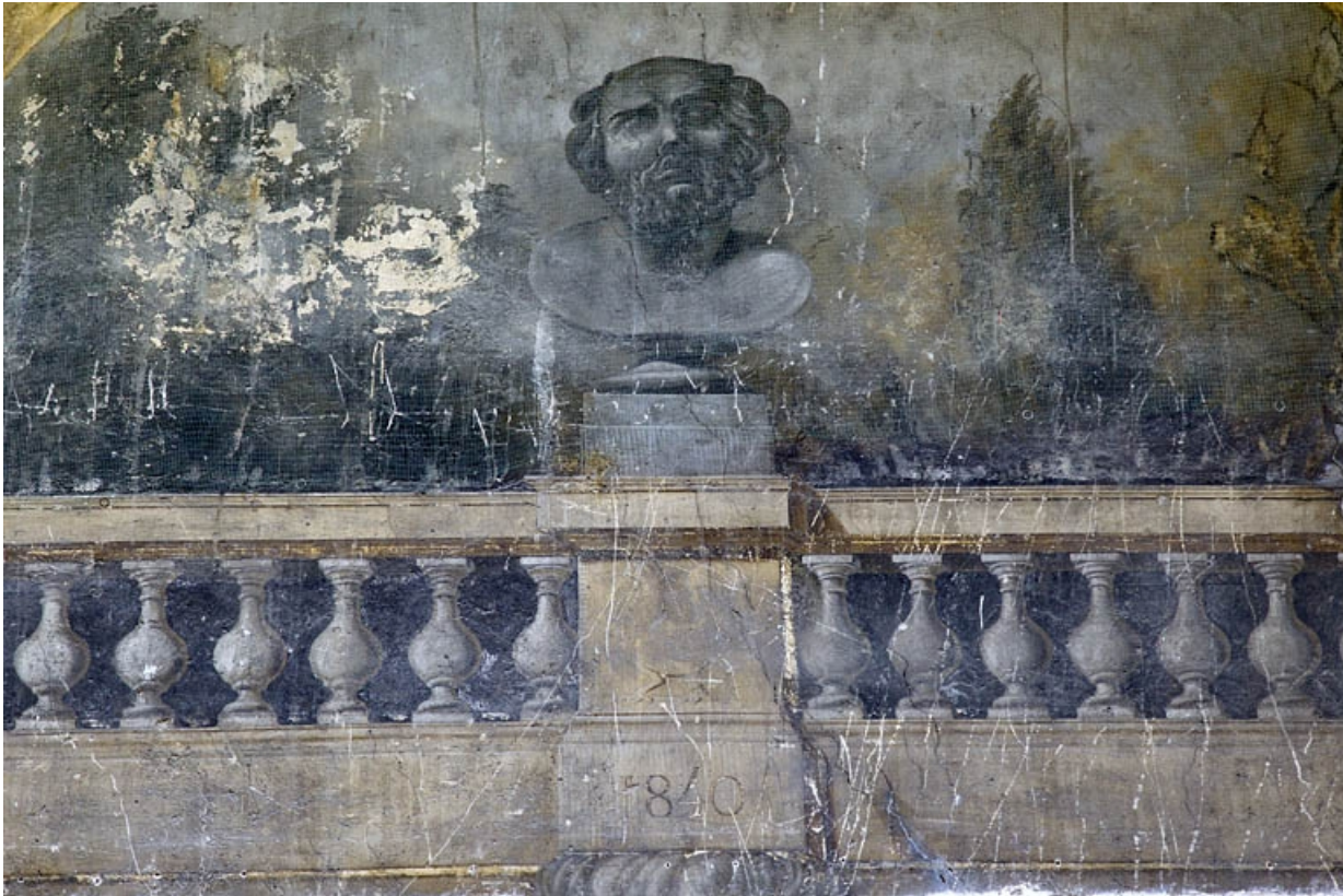
Maison de l'architecte Marnotte : peinture murale située sur le mur à droite de la cour : détail du personnage en buste. 25, Besançon