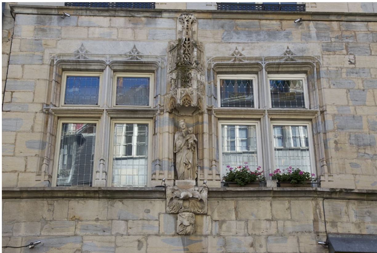
Maison de ville de l'abbaye de la Charité, façade antérieure : détail de la niche. 25, Besançon