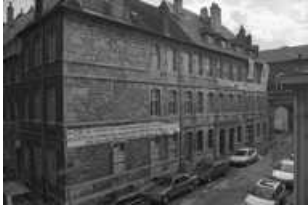
Hôtel et immeuble : logis secondaire donnant place Pâris : vue de l'angle gauche. 25, Besançon