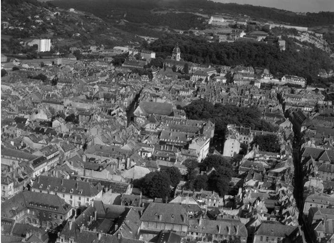
Vue aérienne du centre-ville en 1964. A l'arrière-plan, la cathédrale Saint-Jean et la citadelle. 25, Besançon