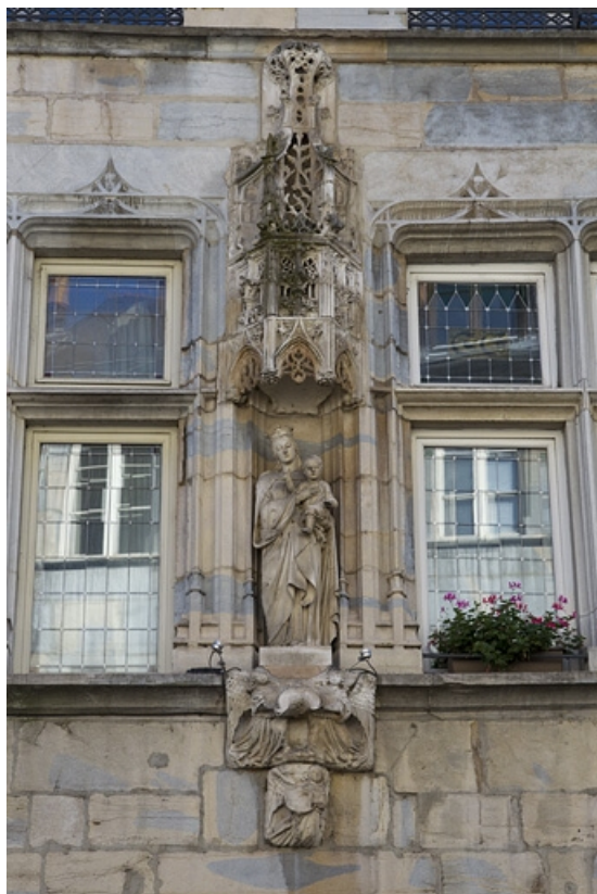
Maison de ville de l'abbaye de la Charité, façade antérieure : détail de la niche, vue rapprochée. 25, Besançon