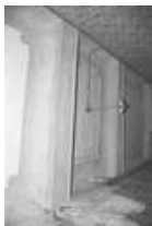
Immeuble, intérieur : détail du plafond d'une pièce du premier étage.