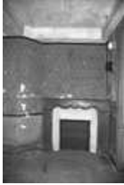
Immeuble : intérieur, détail d'une cheminée du premier étage, de face. 25, Besançon