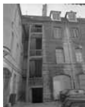
Hôtel et immeuble : détail de l'escalier droit sur cour et d'une partie du logis secondaire.