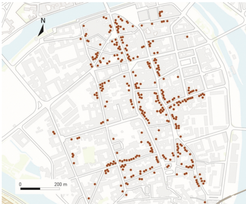
Carte de répartition des escaliers à cage ouverte entre la fin du XVIIe et le XIXe siècle.