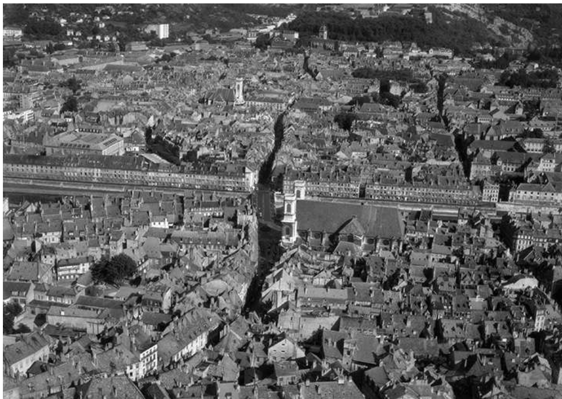
Vue aérienne du centre-ville en 1964 (Grande Rue, quai Vauban au centre). 25, Besançon