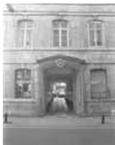
Hôtel et immeuble : façade antérieure du logis principal, détail du portail d'entrée.