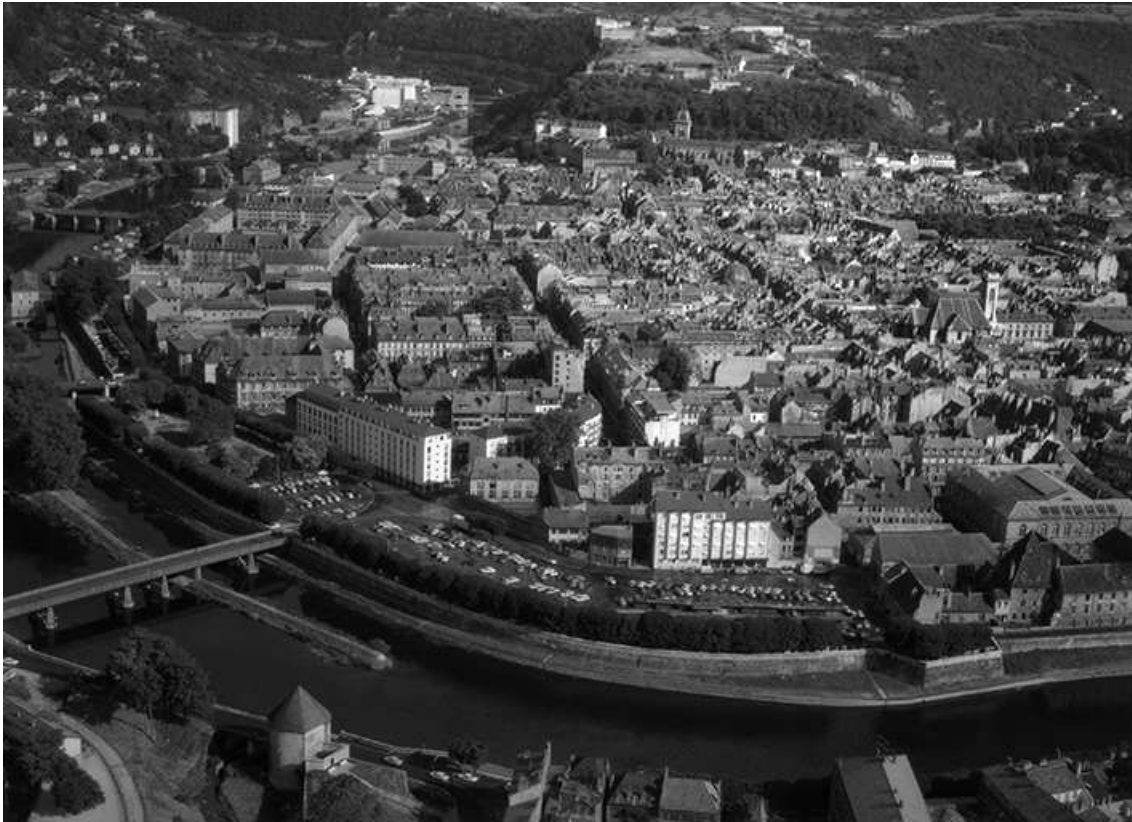
Vue aérienne du centre-ville depuis le quartier Battant en 1964. 25, Besançon