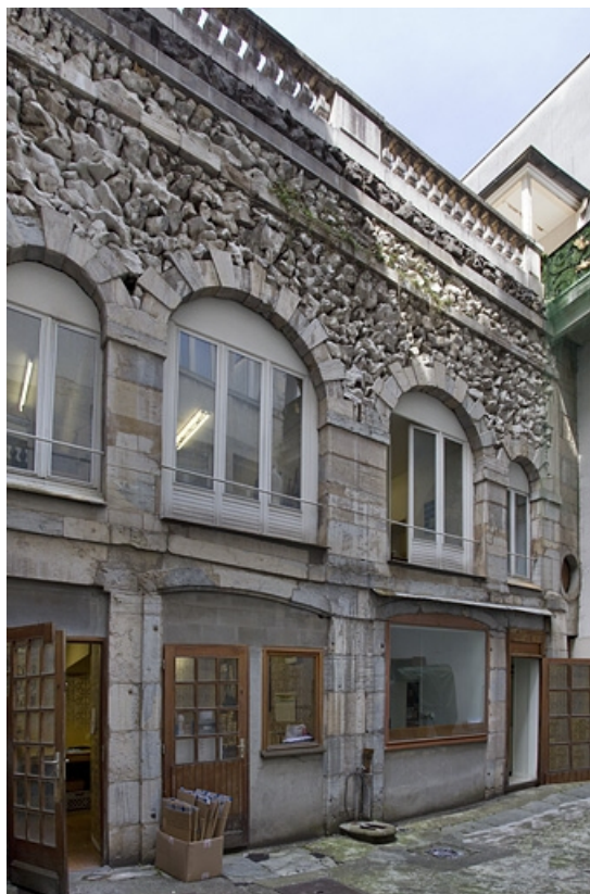
Maison de l'architecte Marnotte : vue du bâtiment des remises et écurie : de trois quarts gauche. 25, Besançon