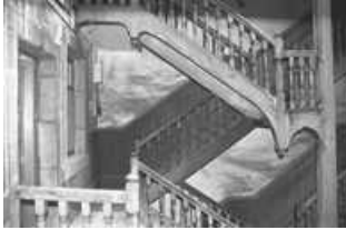
Immeuble : détail du deuxième étage de l'escalier sur cour. 25, Besançon