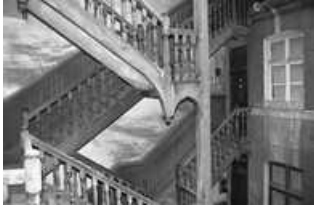
Immeuble : détail du premier étage de l'escalier sur cour. 25, Besançon