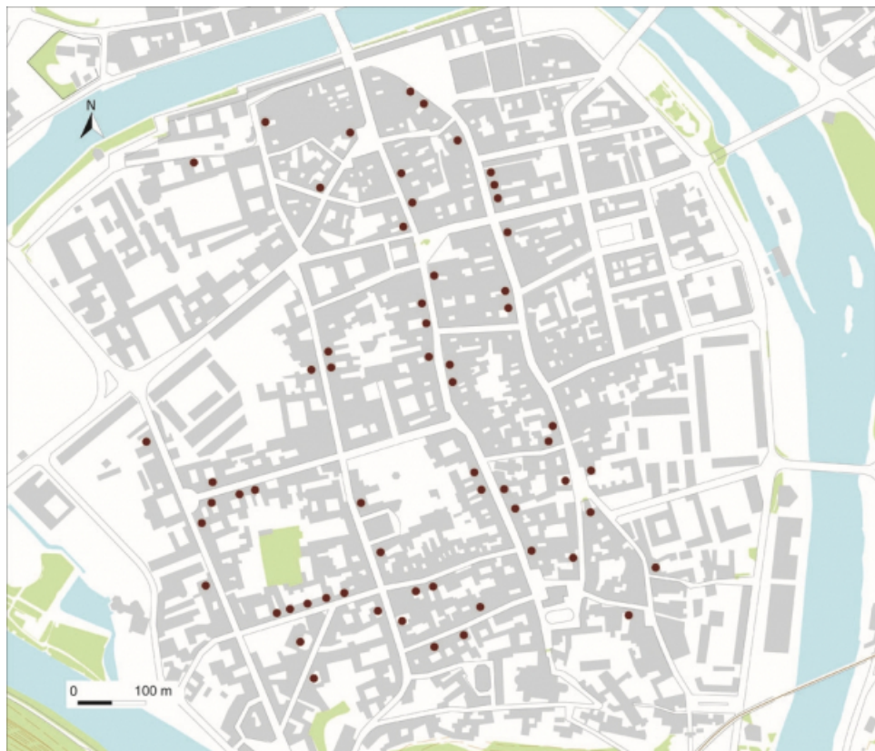
Carte de répartition des hôtels du XVIII e siècle. Source : couche "patrimoine" du système d'information géographique de la ville. 25, Besançon