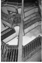
Immeuble : détail de l'escalier sur cour : de face.