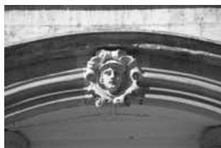
Hôtel et immeuble : détail de la sculpture du portail d'entrée.