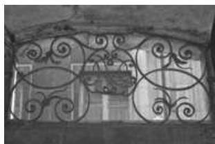
Immeuble : détail de la ferronnerie de l'imposte de la porte d'entrée.