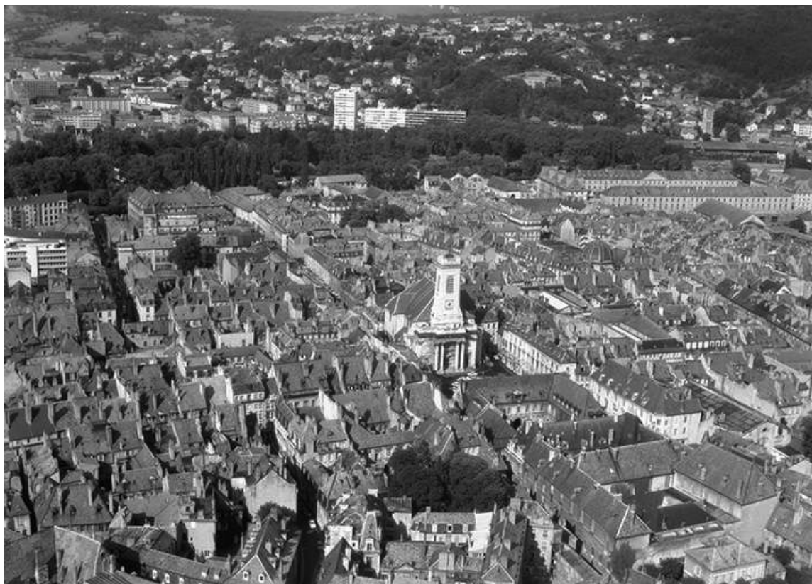
Vue aérienne du centre-ville en 1964. Au centre, l'église Saint-Pierre. 25, Besançon