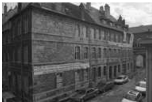
Hôtel et immeuble : logis secondaire donnant place Pâris : vue de l'angle gauche. 25, Besançon