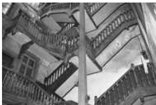
Immeuble : détail de l'escalier sur cour : vue allongée.