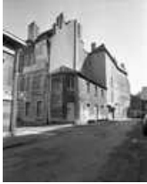
Maison : vue de trois quarts gauche.