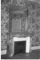
Immeuble : intérieur : détail d'une cheminée avec glace du premier étage. 25, Besançon