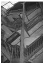
Immeuble : détail de l'escalier sur cour : de trois quarts droit.