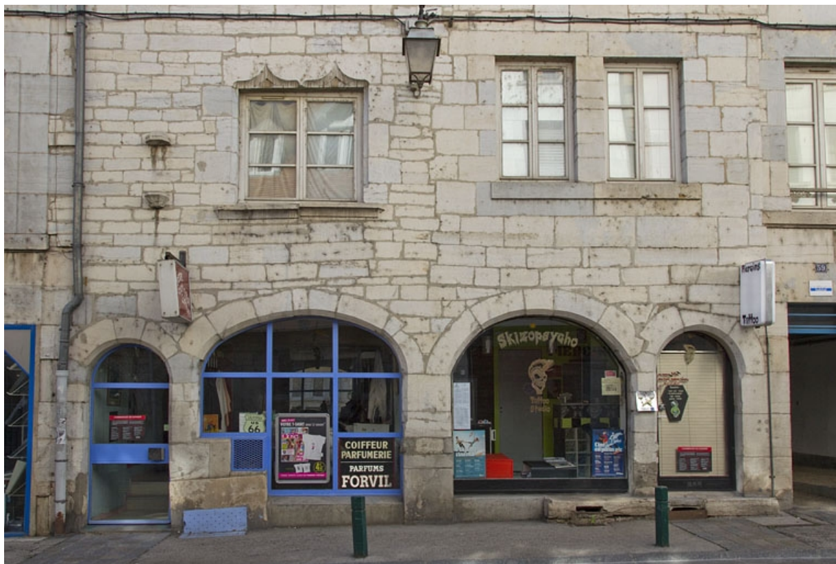
Vue d'ensemble du rez-de-chaussée de deux maisons du XVI e siècle. 25, Besançon