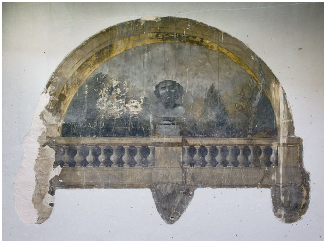
Maison de l'architecte Marnotte : peinture murale située sur le mur à droite de la cour : vue d'ensemble. 25, Besançon