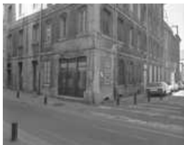
Immeuble : vue d'ensemble depuis l'angle des rues Jean Petit et Courbet. 25, Besançon