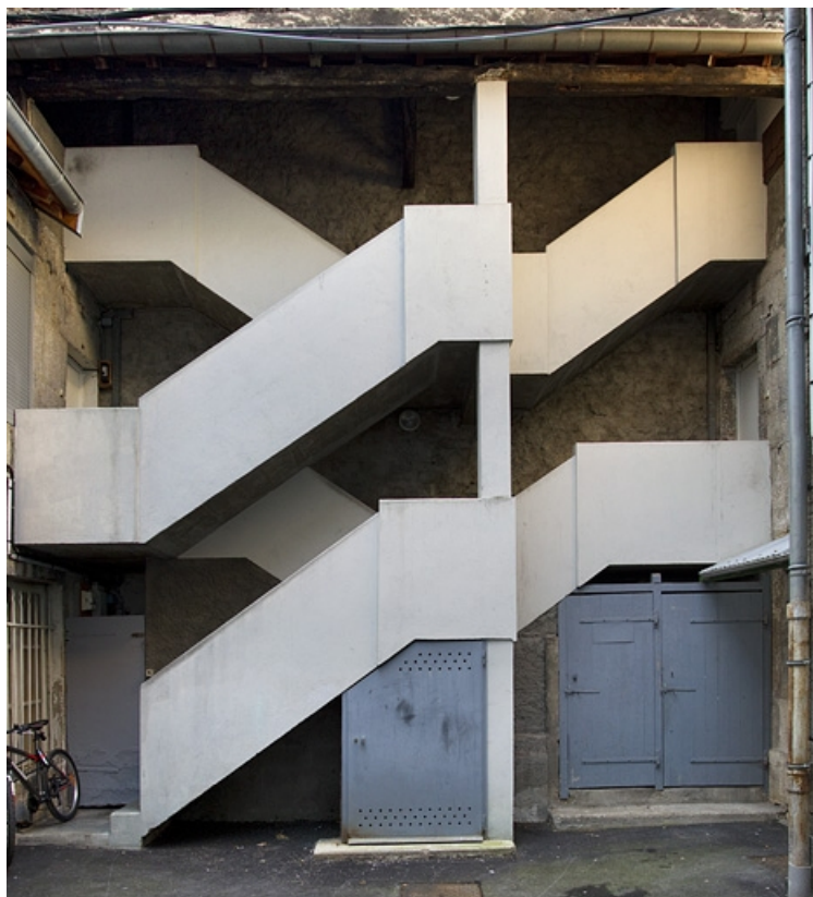
Maison : vue d'ensemble d'un escalier à cage ouverte restauré à la fin du XXe siècle. 25, Besançon