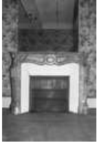
Immeuble : intérieur, détail d'une cheminée avec glace, vue rapprochée. 25, Besançon