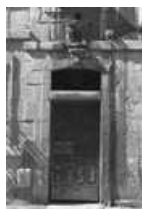
Immeuble : détail de la porte d'entrée.