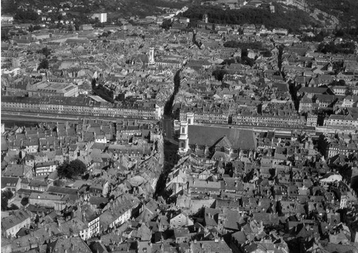
Vue aérienne du centre-ville en 1964 (Grande Rue, quai Vauban au centre). 25, Besançon