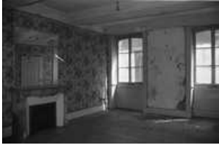
Immeuble : intérieur, détail d'une pièce du premier étage. 25, Besançon