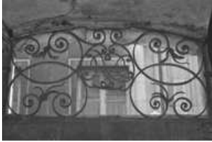
Immeuble : détail de la ferronnerie de l'imposte de la porte d'entrée. 25, Besançon