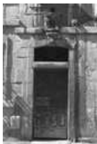
Immeuble : détail de la porte d'entrée.