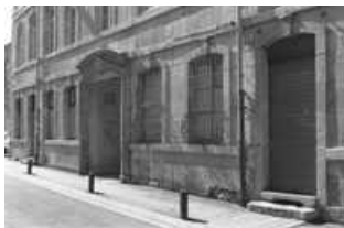
Hôtel et immeuble : rez de chaussée de la façade antérieure du logis principal, vue de trois quarts droit. 25, Besançon