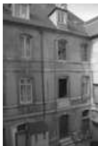
Hôtel et immeuble : détail de la façade sur cour du logis secondaire donnant place Pâris. 25, Besançon