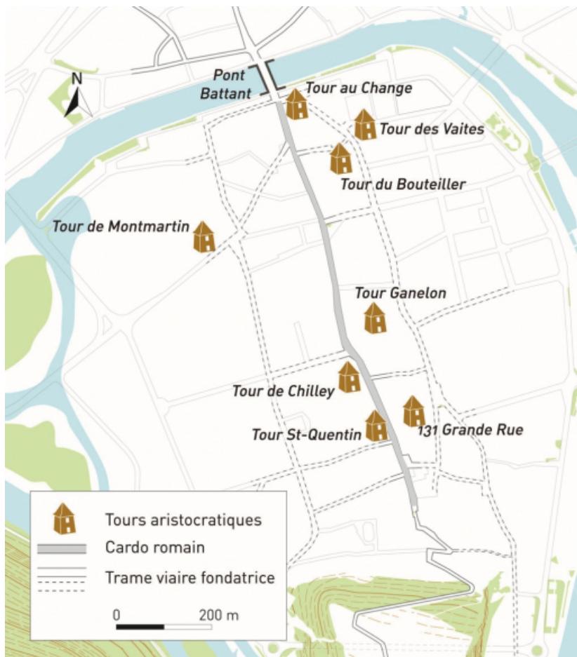
Carte de répartition des maisons-tours aristocratiques médiévales. 25, Besançon