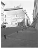
Hôtel et immeuble : vue d'ensemble de trois quarts gauche. 25, Besançon