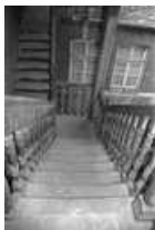
Immeuble : détail d'une volée de l'escalier sur cour.