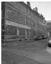
Hôtel et immeuble : logis secondaire donnant place Pâris : vue éloignée de trois quarts gauche. 25, Besançon