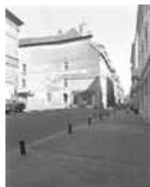
Hôtel et immeuble : vue d'ensemble de trois quarts gauche.