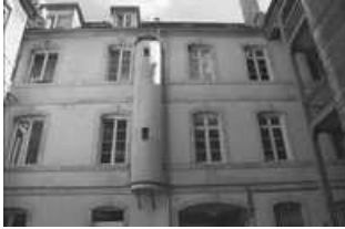
Hôtel et immeuble : façade postérieure du logis principal : détail des étages. 25, Besançon