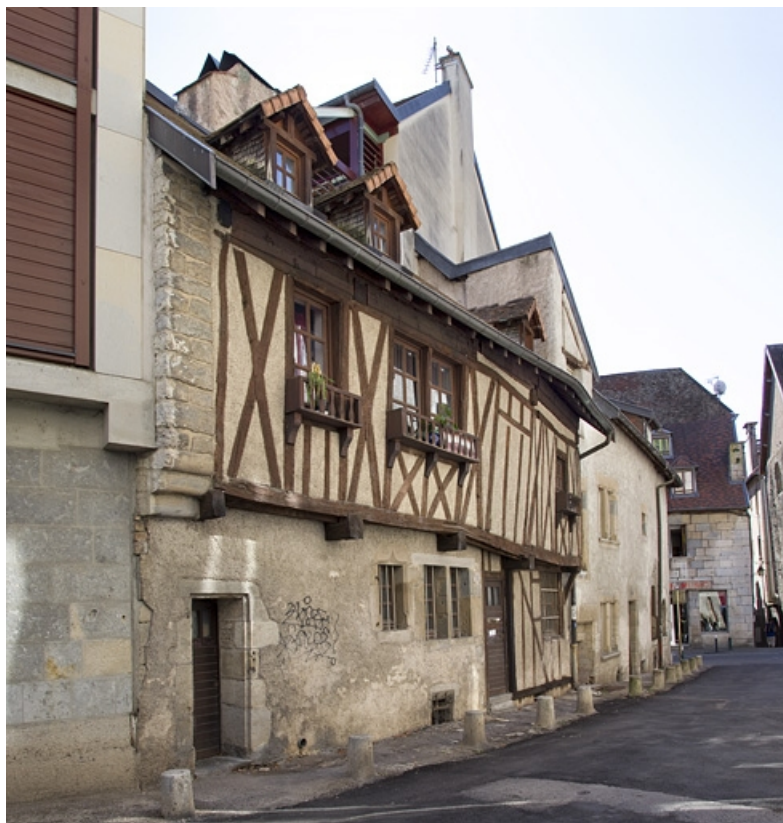
Maison : vue d'ensemble de la façade antérieure à pans de bois, de trois quarts gauche. 25, Besançon