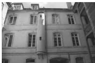
Hôtel et immeuble : façade postérieure du logis principal : détail des étages.