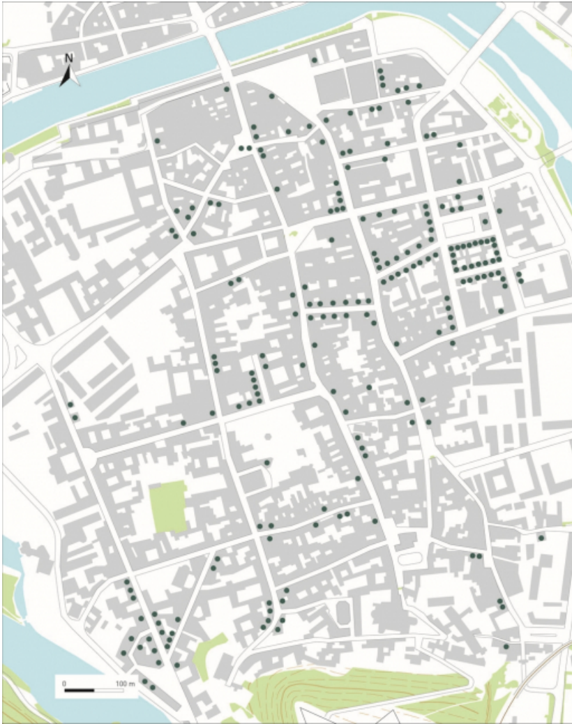
Carte de répartition des immeubles du XIXe siècle.