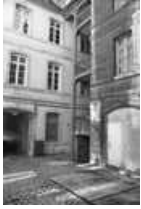
Hôtel et immeuble : escalier droit sur cour : de trois quarts droit.