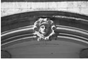
Hôtel et immeuble : détail de la sculpture du portail d'entrée. 25, Besançon