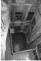
Immeuble : détail de la cour depuis le haut de l'escalier extérieur. 25, Besançon