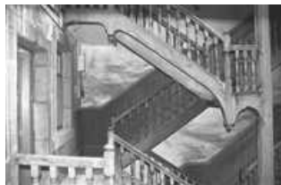
Immeuble : détail du deuxième étage de l'escalier sur cour.