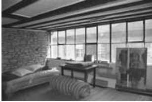
Immeuble, intérieur : détail d'un ancien atelier d'horloger, dans la surélévation du bâtiment sur rue. 25, Besançon