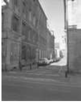
Immeuble : vue de la façade donnant rue Jean Petit : de trois quarts gauche. 25, Besançon