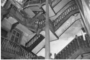
Immeuble : détail de l'escalier sur cour : vue allongée.