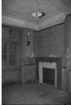
Immeuble, intérieur : détail d'une cheminée du premier étage, de trois quarts gauche. 25, Besançon