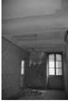
Immeuble, intérieur : détail d'une pièce du premier étage avec une fenêtre. 25, Besançon