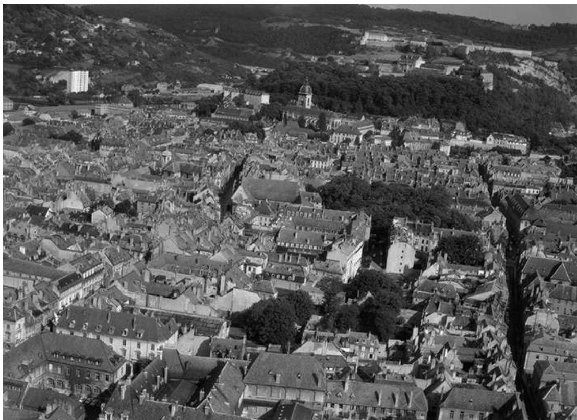
Vue aérienne du centre-ville en 1964. A l'arrière-plan, la cathédrale Saint-Jean et la citadelle. 25, Besançon