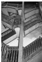
Immeuble : détail de l'escalier sur cour : de face.