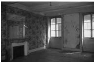
Immeuble : intérieur, détail d'une pièce du premier étage.