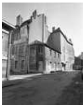
Maison : vue de trois quarts gauche.