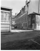
Hôtel et immeuble : vue du logis secondaire donnant rue Jean Petit : de trois quarts droit. 25, Besançon