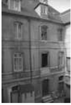
Hôtel et immeuble : détail de la façade sur cour du logis secondaire donnant place Pâris. 25, Besançon