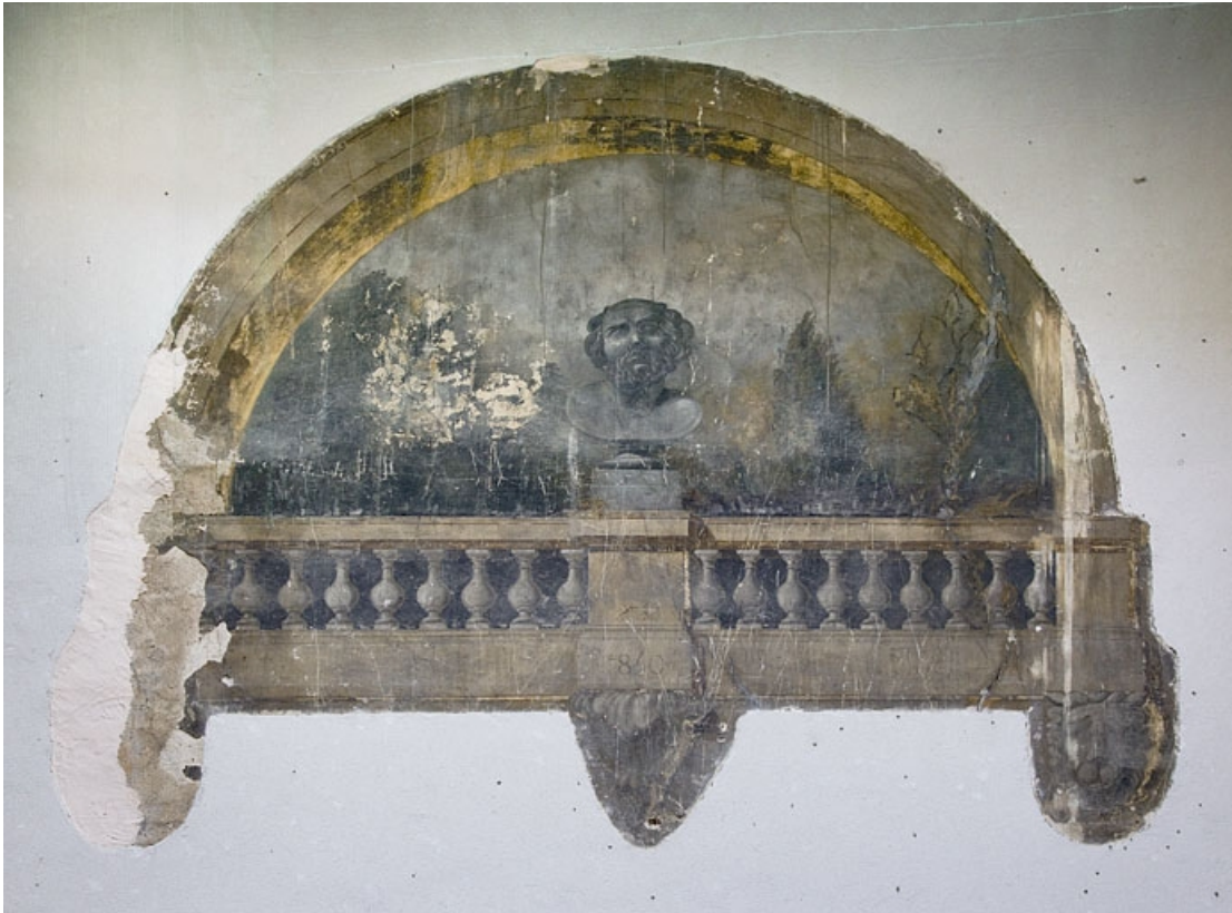
Maison de l'architecte Marnotte : peinture murale située sur le mur à droite de la cour : vue d'ensemble. 25, Besançon