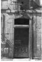
Immeuble : détail de la porte d'entrée.