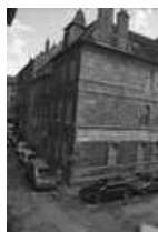
Hôtel et immeuble : logis secondaire donnant place Pâris : vue d'ensemble de trois quarts gauche. 25, Besançon