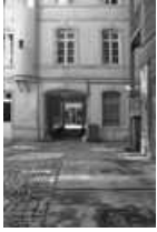
Hôtel et immeuble : façade postérieure du logis principal sur cour : détail partie droite. 25, Besançon