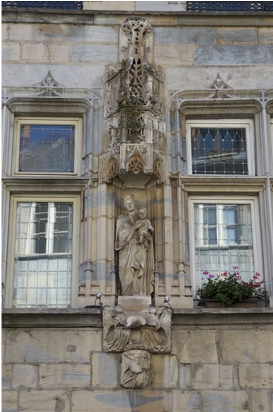
Maison de ville de l'abbaye de la Charité, façade antérieure : détail de la niche, vue rapprochée. 25, Besançon