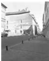
Hôtel et immeuble : vue d'ensemble de trois quarts gauche.