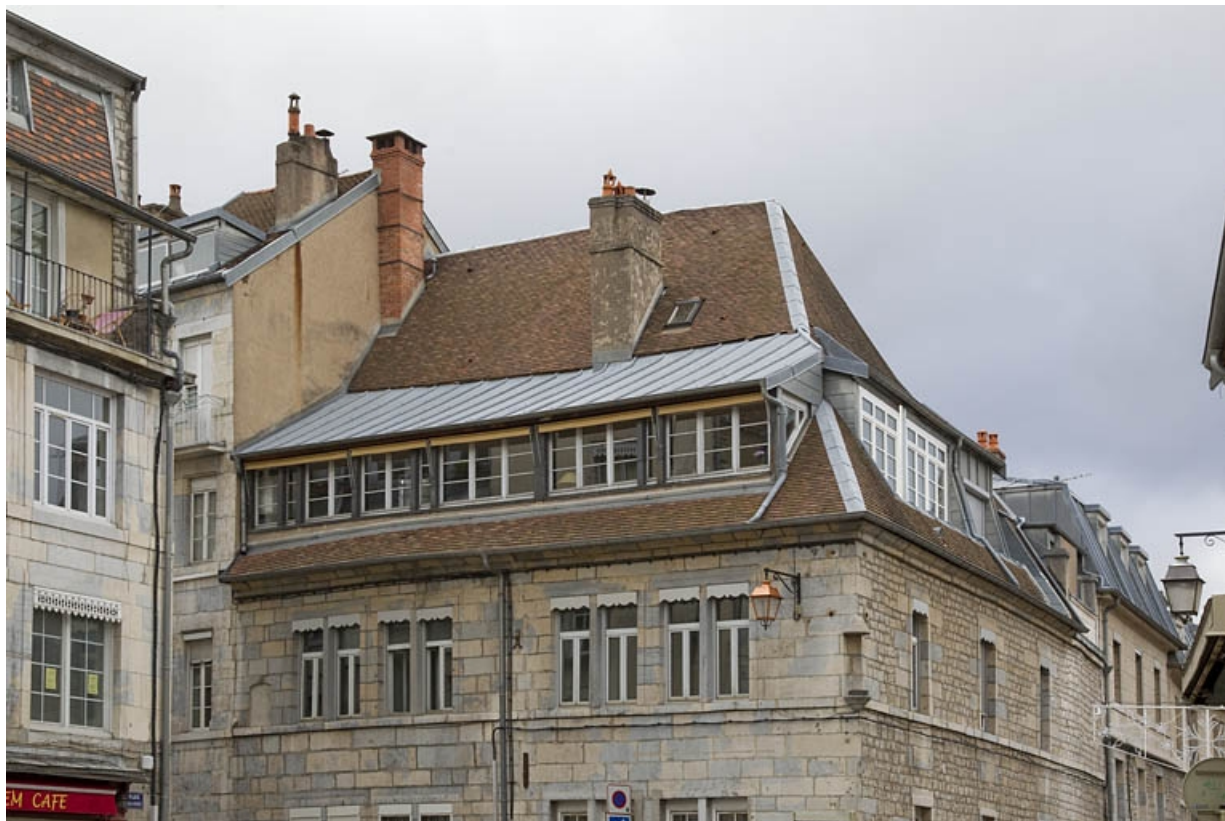
Détail de la surélévation donnant sur la place Jean Gigoux, probable emplacement d'un atelier d'horloger. 25, Besançon