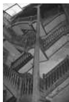
Immeuble : détail de l'escalier sur cour : de trois quarts droit.