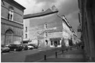
Hôtel et immeuble : vue de la façade latérale gauche, sur la rue Pâris. 25, Besançon