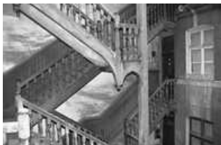
Immeuble : détail du premier étage de l'escalier sur cour.