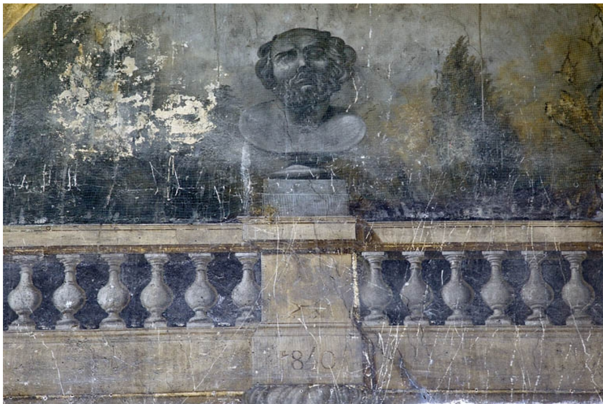
Maison de l'architecte Marnotte : peinture murale située sur le mur à droite de la cour : détail du personnage en buste. 25, Besançon