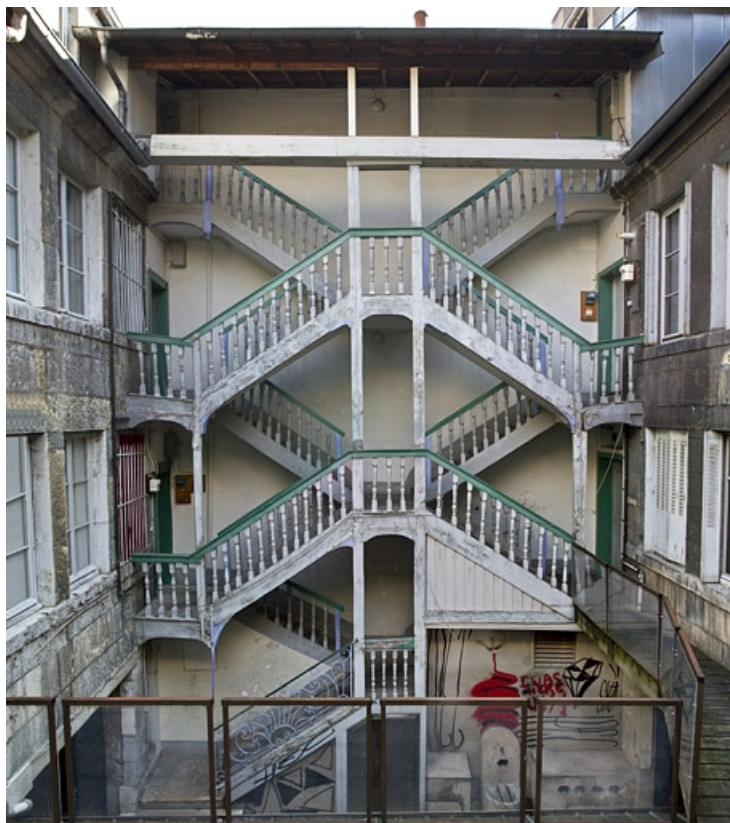
Maison : vue d'ensemble de l'escalier à cage ouverte. 25, Besançon