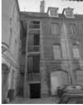
Hôtel et immeuble : détail de l'escalier droit sur cour et d'une partie du logis secondaire. 25, Besançon