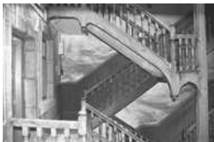
Immeuble : détail du deuxième étage de l'escalier sur cour.