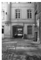
Hôtel et immeuble : façade postérieure du logis principal sur cour : détail partie droite. 25, Besançon