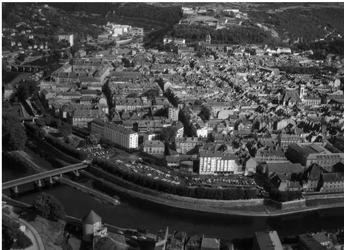
Vue aérienne du centre-ville depuis le quartier Battant en 1964. 25, Besançon