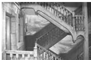
Immeuble : détail du deuxième étage de l'escalier sur cour.