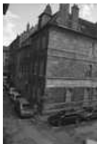
Hôtel et immeuble : logis secondaire donnant place Pâris : vue d'ensemble de trois quarts gauche. 25, Besançon