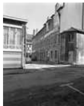
Hôtel et immeuble : vue du logis secondaire donnant rue Jean Petit : de trois quarts droit. 25, Besançon