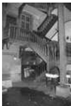
Immeuble : détail de l'escalier sur cour et de la porte d'accès à la cour.