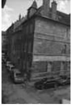
Hôtel et immeuble : logis secondaire donnant place Pâris : vue d'ensemble de trois quarts gauche. 25, Besançon