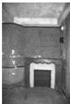
Immeuble : intérieur, détail d'une cheminée du premier étage, de face.