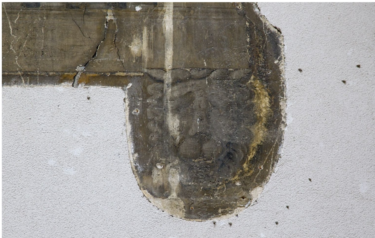
Maison de l'architecte Marnotte : peinture murale située sur le mur à droite de la cour : détail de la tête de lion, partie inférieure droite.