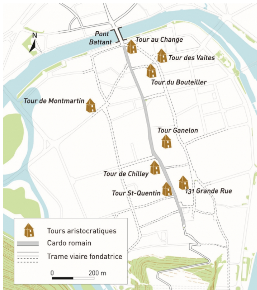
Carte de répartition des maisons-tours aristocratiques médiévales. 25, Besançon