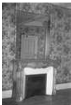
Immeuble : intérieur : détail d'une cheminée avec glace du premier étage.