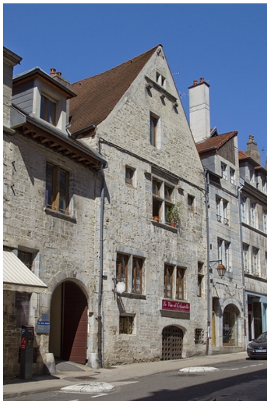
Maison : vue d'ensemble de trois quarts gauche. 25, Besançon