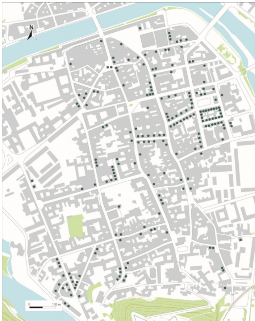
Carte de répartition des immeubles du XIXe siècle.