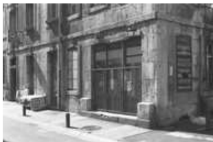
Immeuble : détail de l'angle de l'immeuble entre la rue Courbet et la rue Jean Petit. 25, Besançon