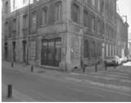
Immeuble : vue d'ensemble depuis l'angle des rues Jean Petit et Courbet. 25, Besançon