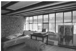
Immeuble, intérieur : détail d'un ancien atelier d'horloger, dans la surélévation du bâtiment sur rue. 25, Besançon