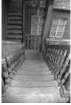
Immeuble : détail d'une volée de l'escalier sur cour.