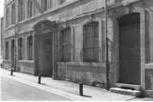
Hôtel et immeuble : rez de chaussée de la façade antérieure du logis principal, vue de trois quarts droit. 25, Besançon