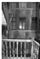
Immeuble : détail de la façade sur cour du logis secondaire.