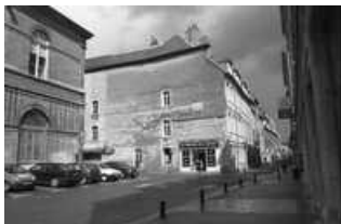
Hôtel et immeuble : vue de la façade latérale gauche, sur la rue Pâris. 25, Besançon