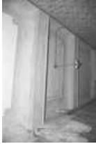
Immeuble, intérieur : détail du plafond d'une pièce du premier étage. 25, Besançon