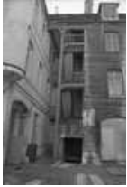
Hôtel et immeuble : détail de l'escalier droit sur cour.