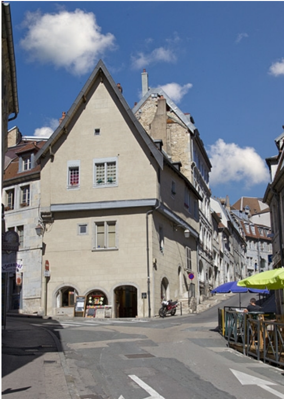
Maison : vue d'ensemble.