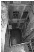
Immeuble : détail de la cour depuis le haut de l'escalier extérieur.