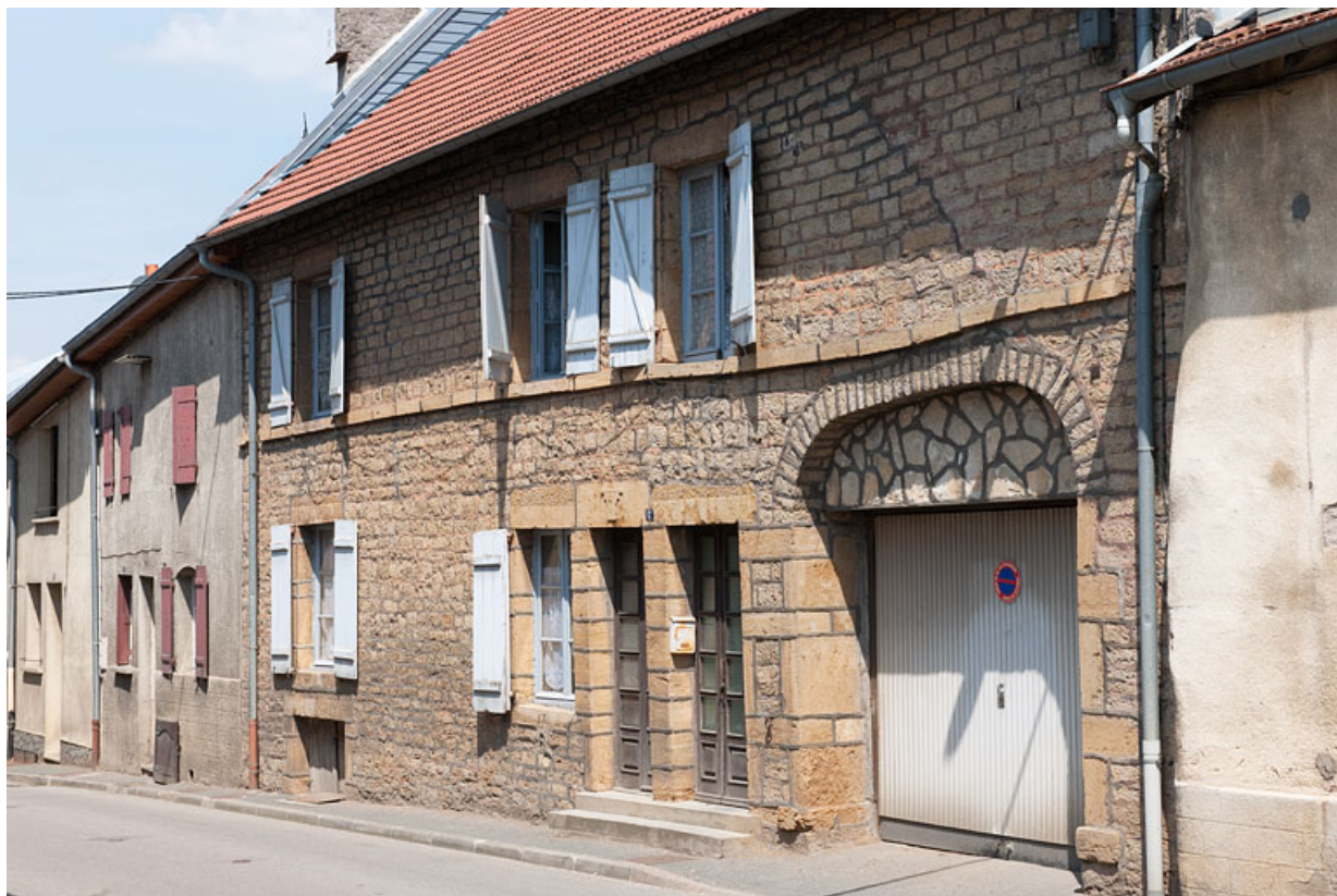
Façade antérieure, vue de trois quart droit. 25, Rougemont, 17 Grande Rue