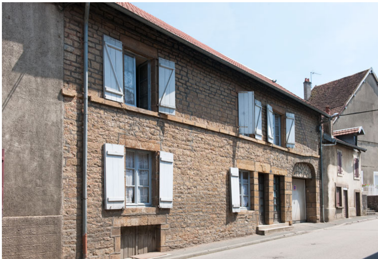
Façade antérieure, vue de trois quart gauche. 25, Rougemont, 17 Grande Rue