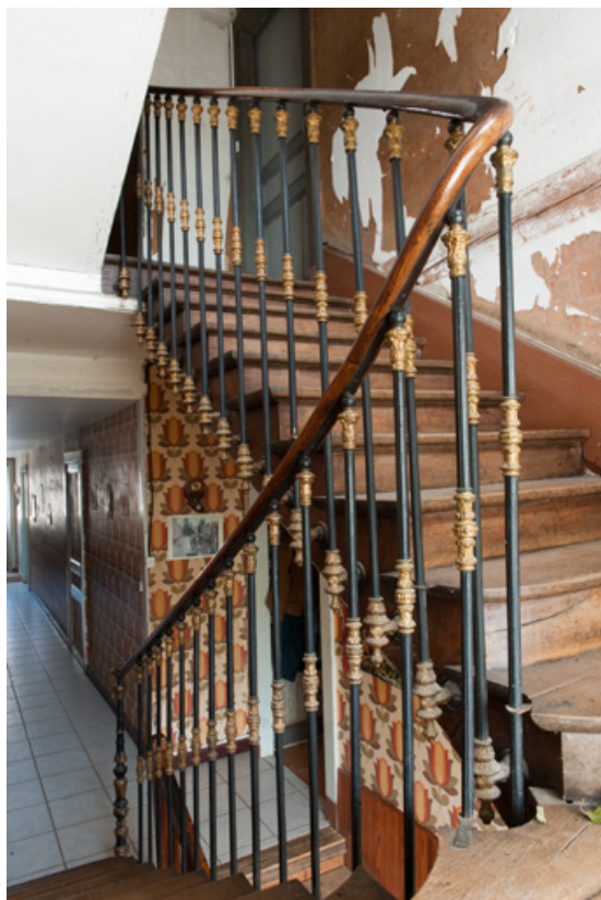
Intérieur du logis (côté rue) : escalier menant à l'étage des chambres. 25, Rougemont, 13 avenue de la Gare