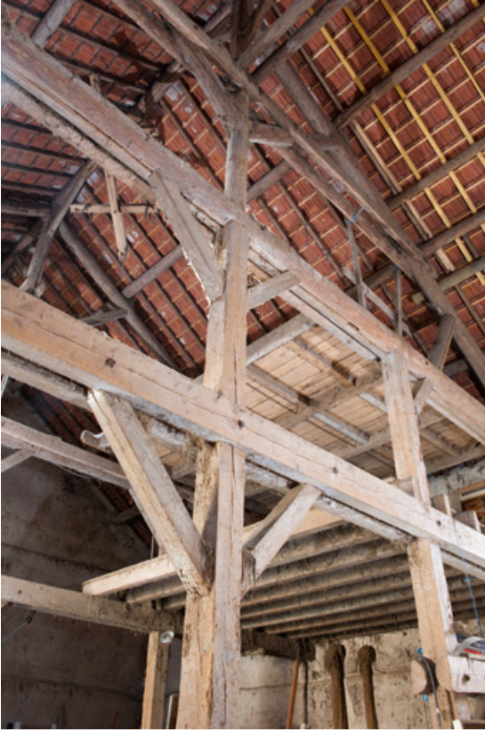
Grange : vue de la charpente.