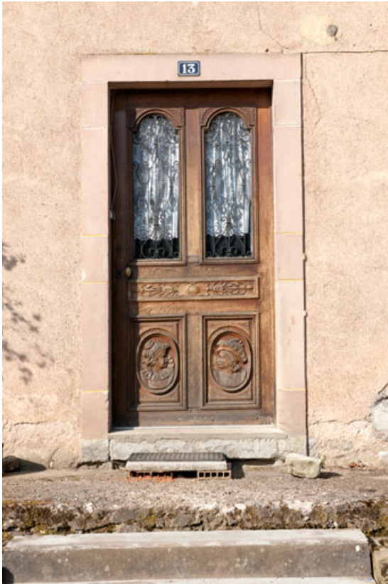
Logis (côté rue) : porte d'entrée.