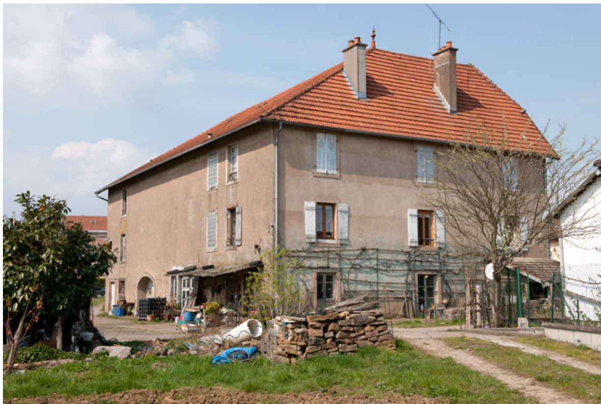
Façade postérieure vue de trois quarts gauche.