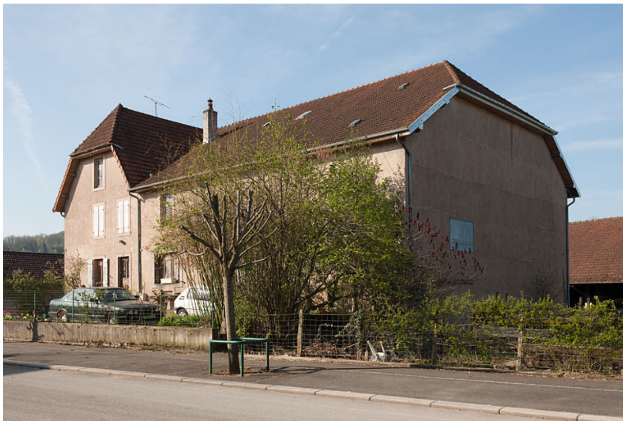
Façade antérieure, vue de trois quarts droit.