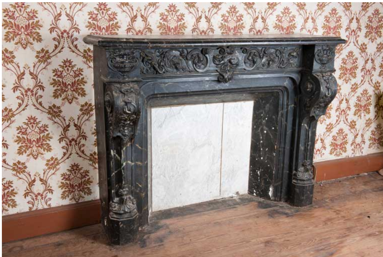
Intérieur du logis (côté rue) : fausse cheminée de l'ancienne salle à manger. 25, Rougemont, 13 avenue de la Gare