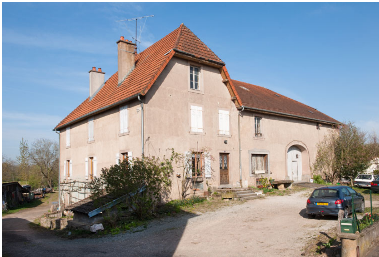
Façade antérieure, vue de trois quarts gauche. 25, Rougemont, 13 avenue de la Gare