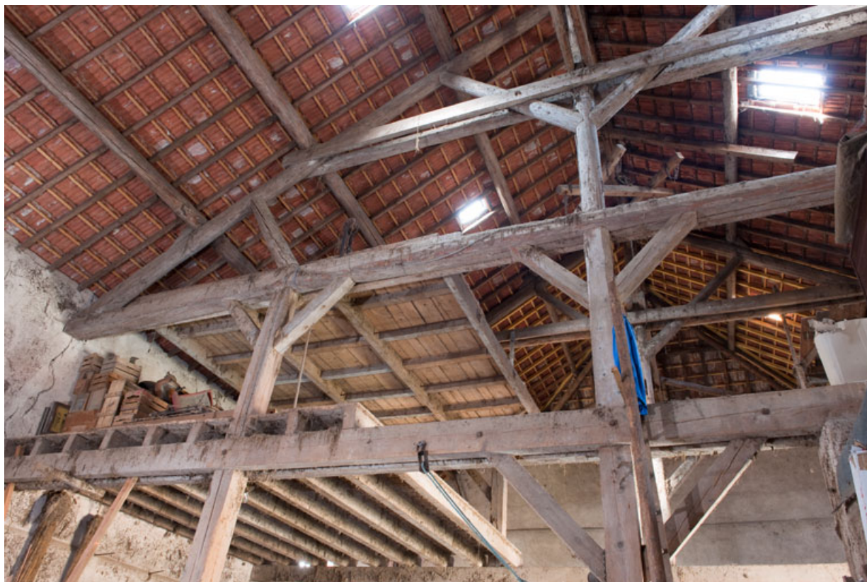
Grange : vue de la charpente et du pont roulant.