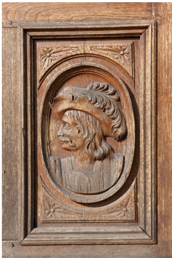
Logis (côté rue) : un des panneaux sculptés de la porte d'entrée.