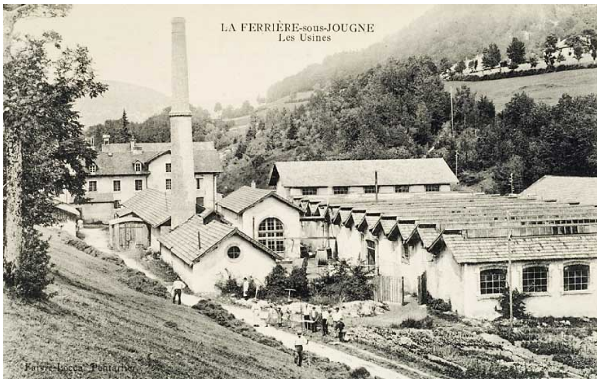
241-LA FERRIERE-sous-JOUGNE. Les Usines 25, Jougne, 1 rue de la Tirerie, lieudit : la Ferrière