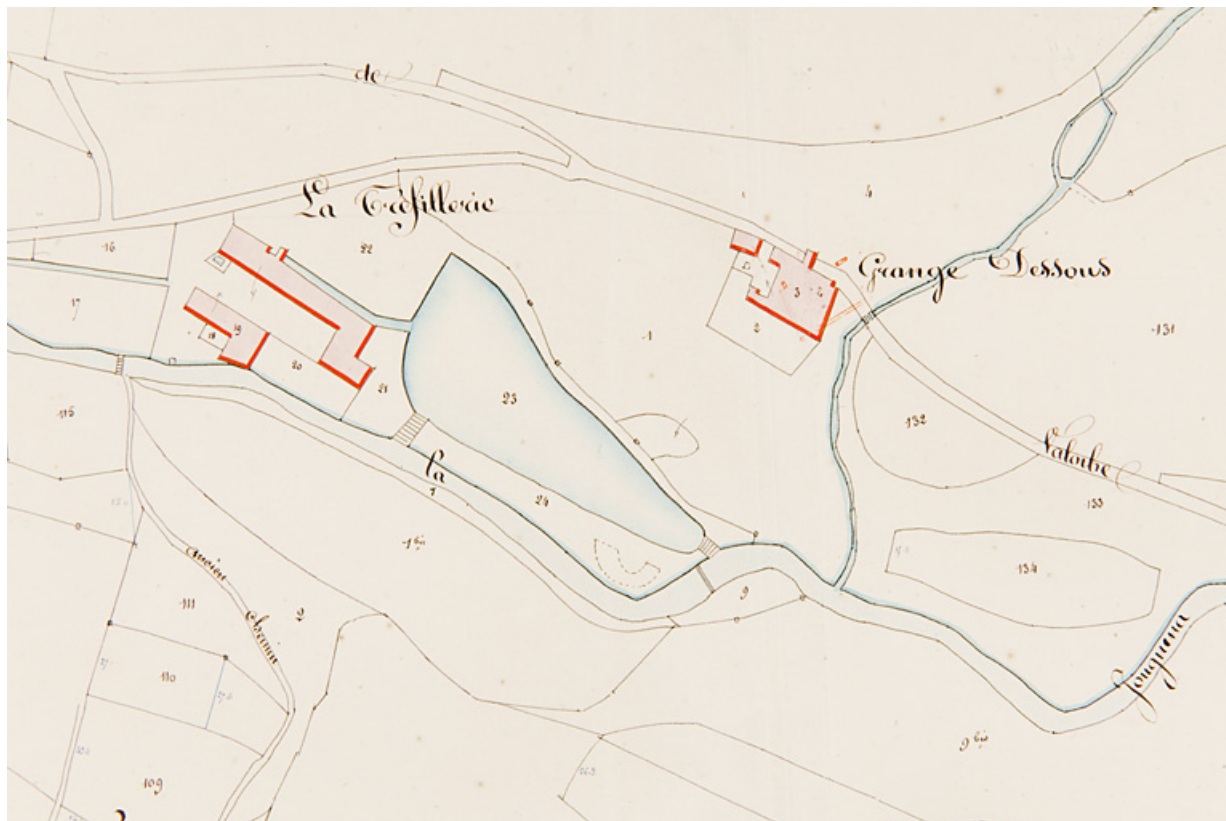
Section C de la Ferrière en trois feuilles, 2e feuille [plan cadastral : détail de la partie centrale en haut, Grange Dessous et "Tréfilerie"], 1839.