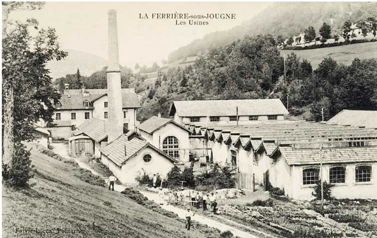
241-LA FERRIERE-sous-JOUGNE. Les Usines 25, Jougne, 1 rue de la Tirerie, lieudit : la Ferrière