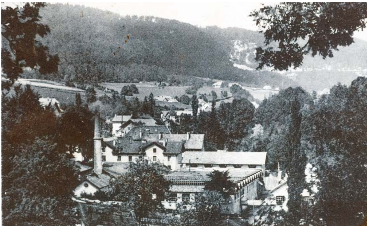
[Vue d'ensemble de l'usine, depuis l'ouest], [milieu 20e siècle].

25, Jougne, 1 rue de la Tirerie, lieudit : la Ferrière