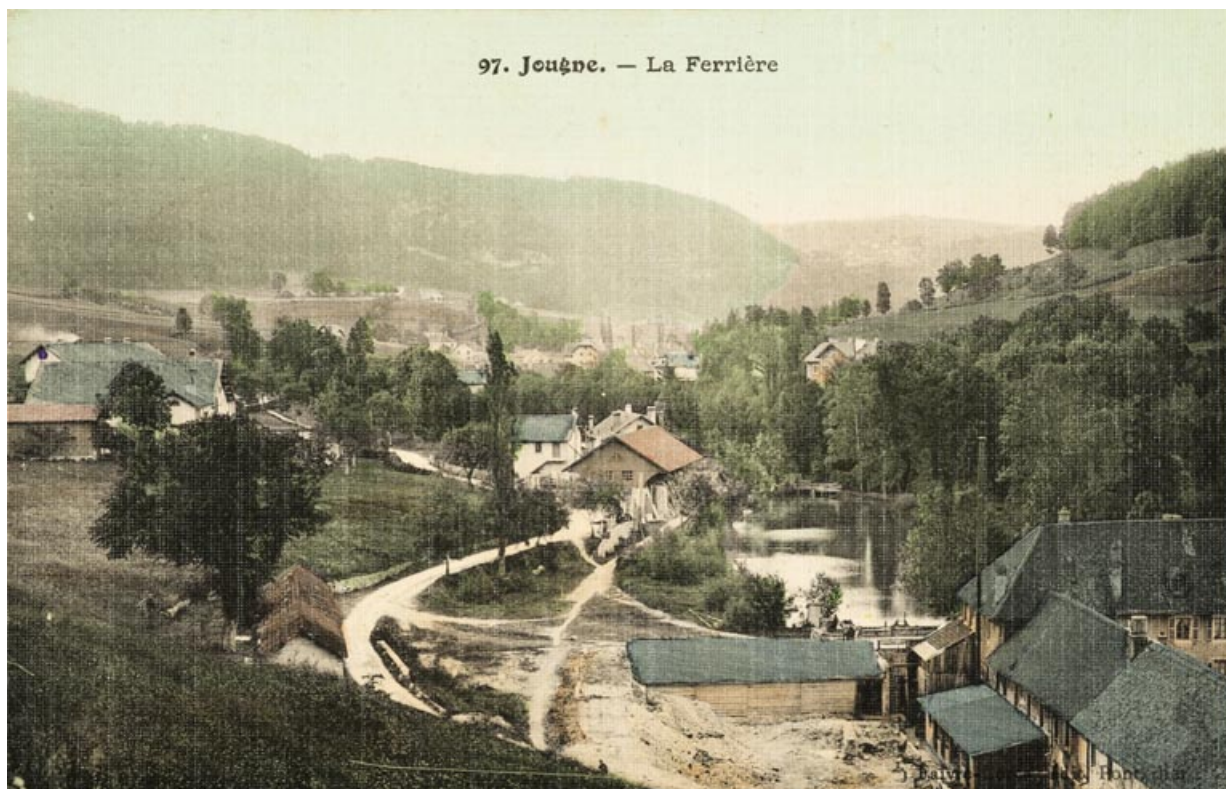
97. Jougne. - La Ferrière [scierie, étang et tréfilerie Vandel], 1ère moitié 20e siècle ?

25, Jougne, 1 rue de la Tirerie, lieudit : la Ferrière