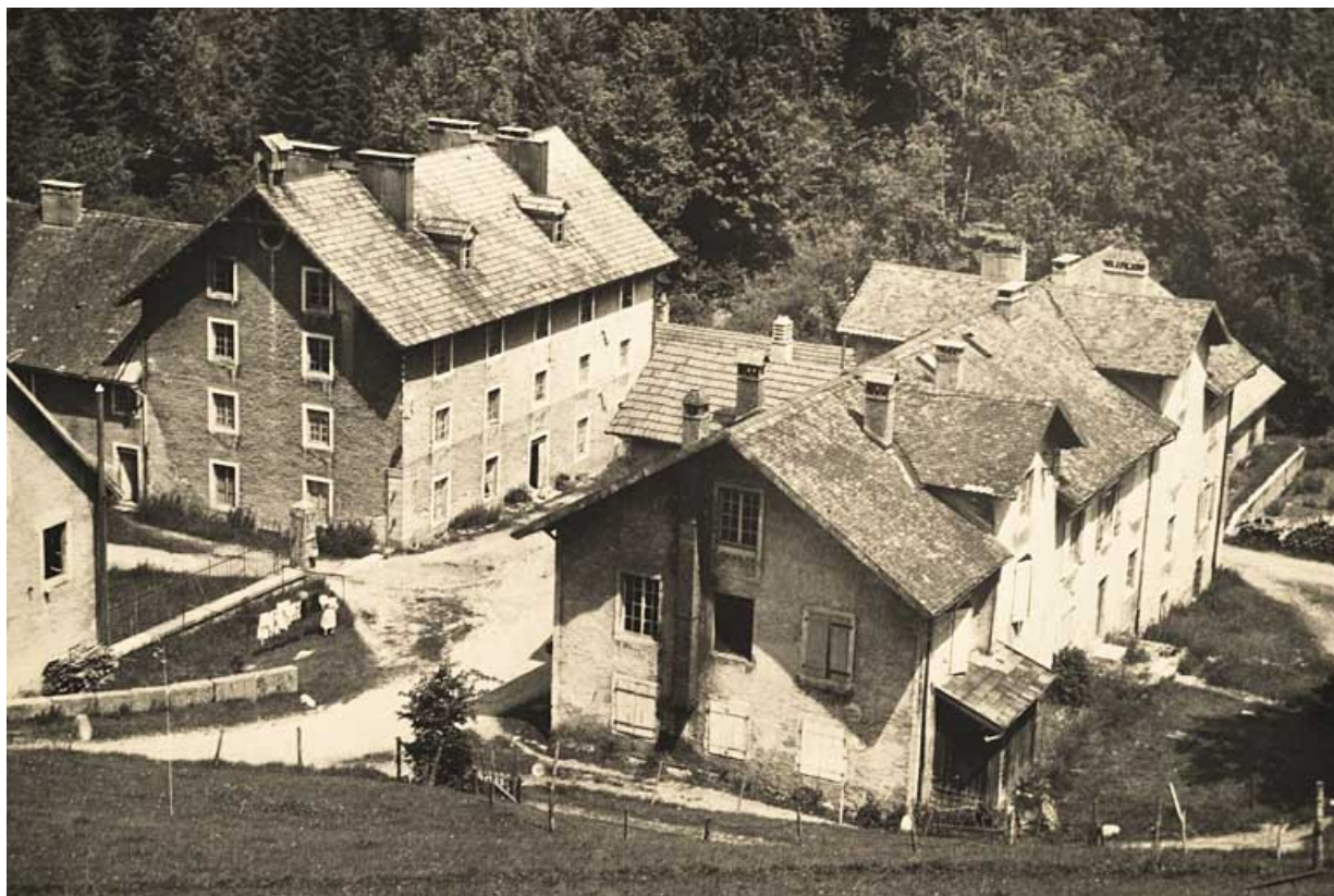
[Vue plongeante sur des bâtiments de l'usine, depuis l'ouest], [milieu 20e siècle ?].

25, Jougne, 1 rue de la Tirerie, lieudit : la Ferrière