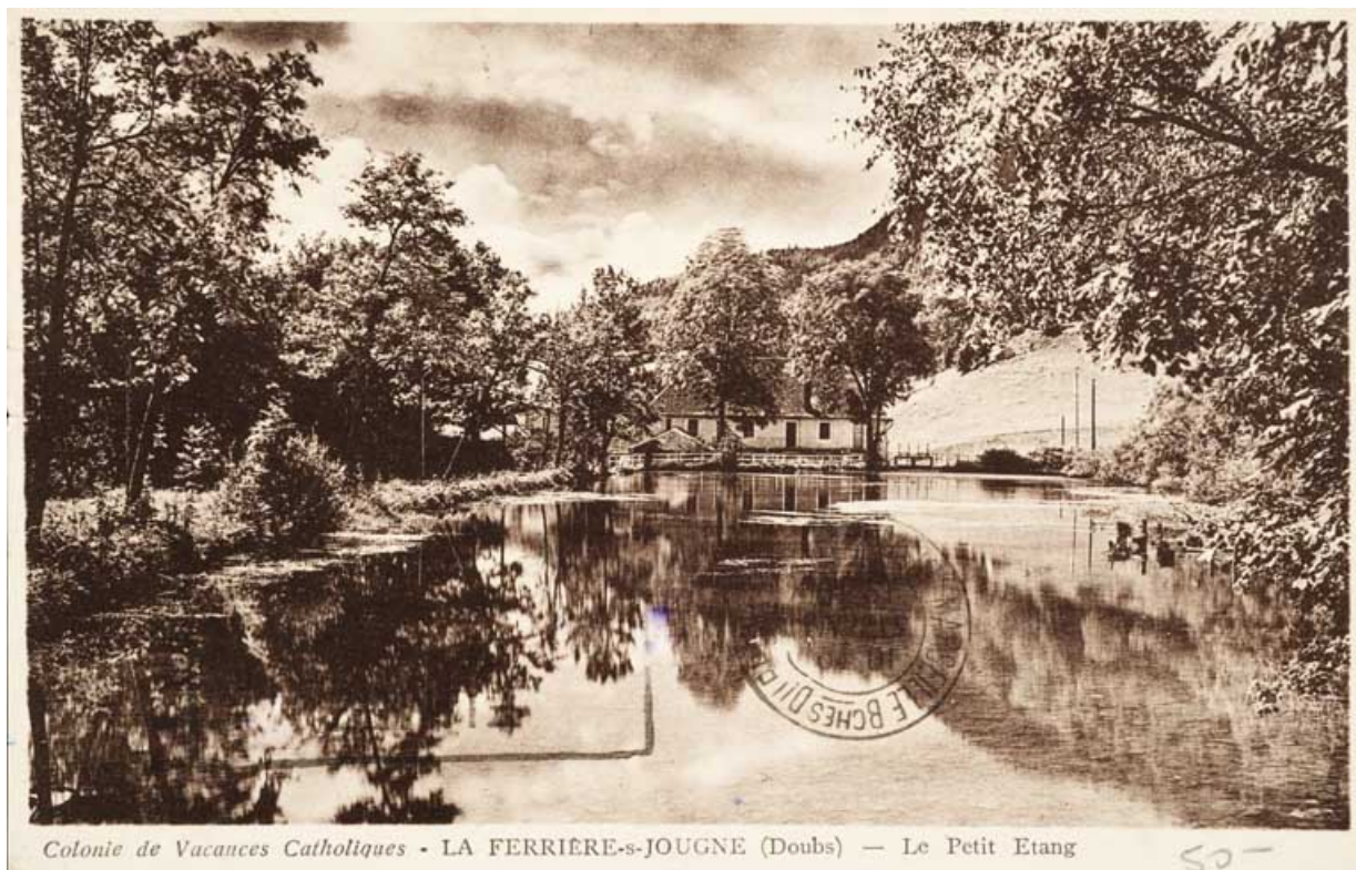
Colonie de Vacances Catholiques. La Ferrière-sous-Jougne (Doubs) - Le Petit Etang, [3e quart 20e siècle].

25, Jougne, 1 rue de la Tirerie, lieudit : la Ferrière