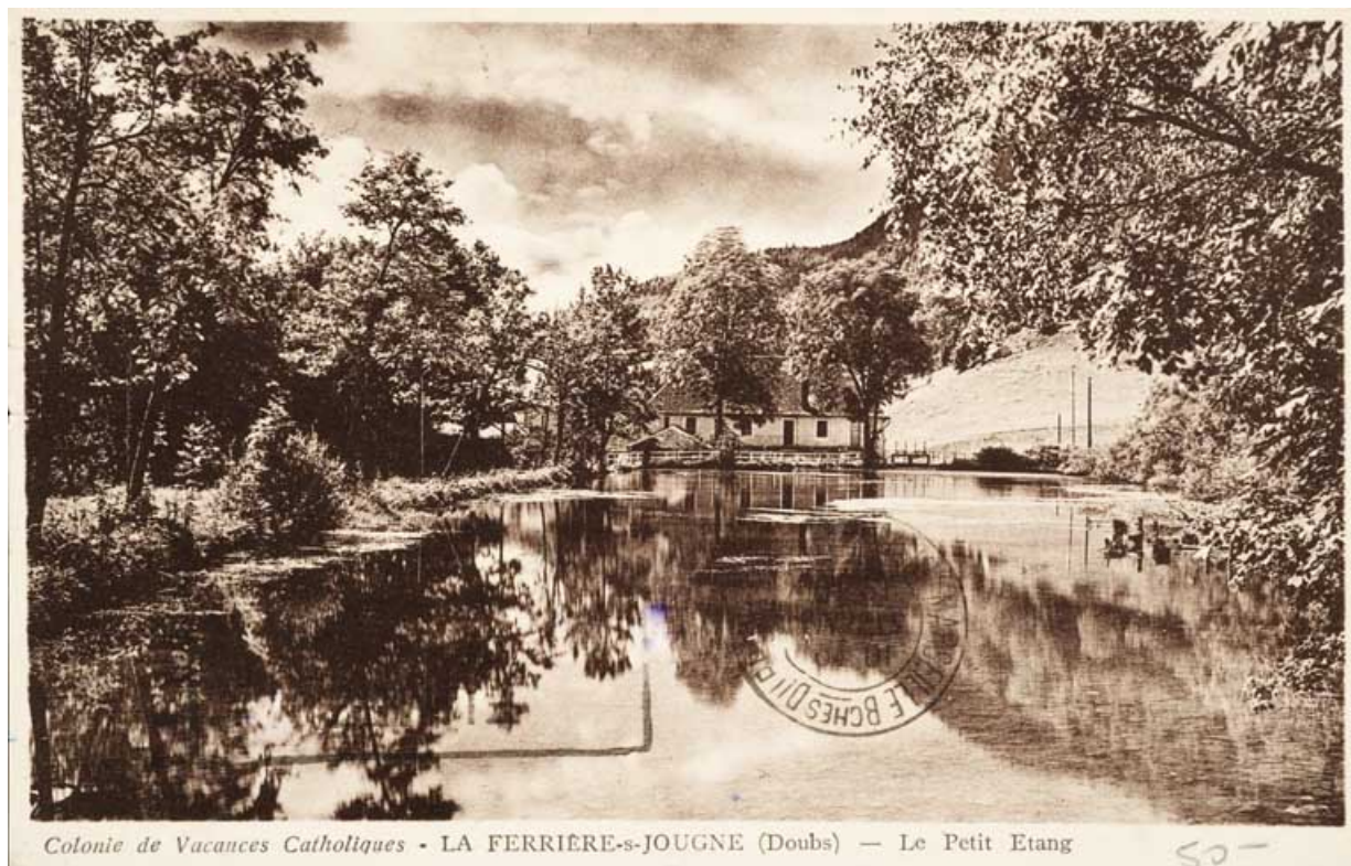
Colonie de Vacances Catholiques. La Ferrière-sous-Jougne (Doubs) - Le Petit Etang, [3e quart 20e siècle].

25, Jougne, 1 rue de la Tirerie, lieudit : la Ferrière