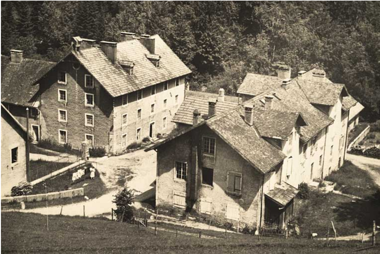
[Vue plongeante sur des bâtiments de l'usine, depuis l'ouest], [milieu 20e siècle ?].

25, Jougne, 1 rue de la Tirerie, lieudit : la Ferrière