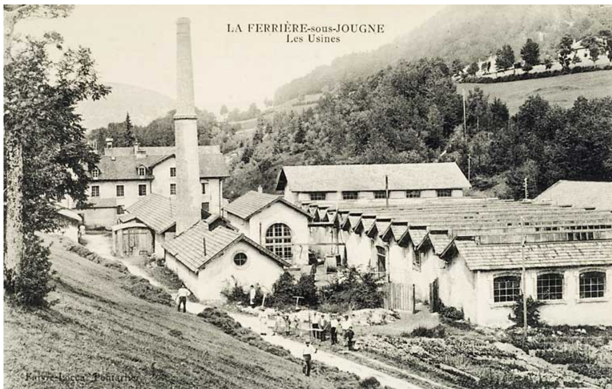
241-LA FERRIERE-sous-JOUGNE. Les Usines 25, Jougne, 1 rue de la Tirerie, lieudit : la Ferrière