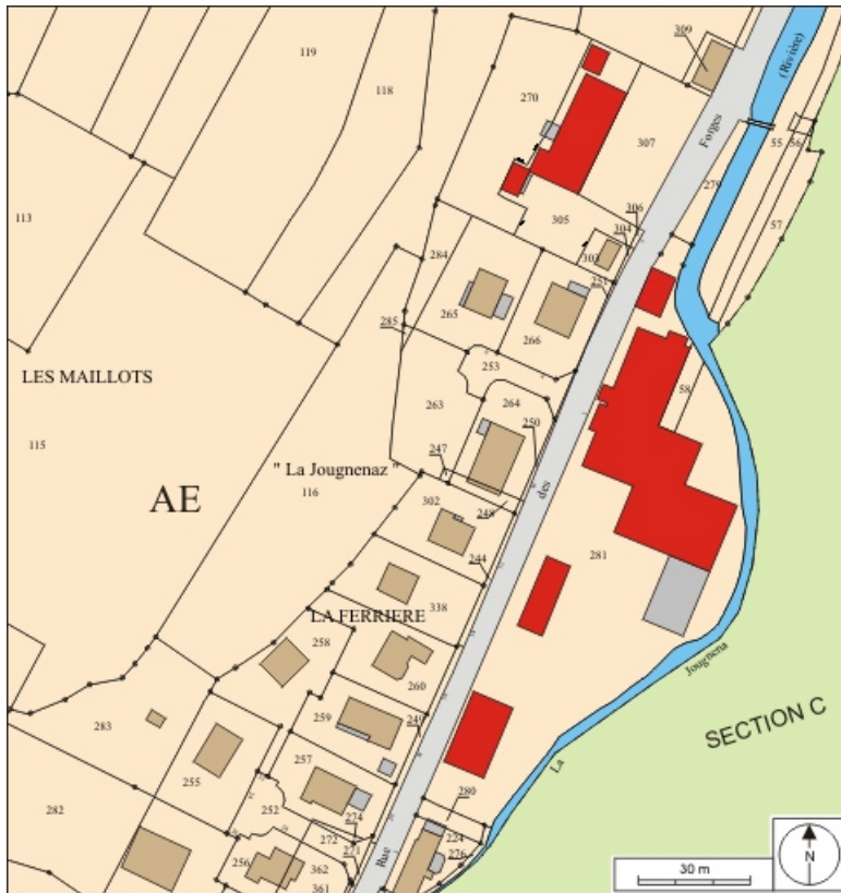
Plan masse et de situation. Extrait du plan cadastral, 2008, section AE, échelle 1/1 000. 25, Jougne rue des Forges, lieudit : la Ferrière