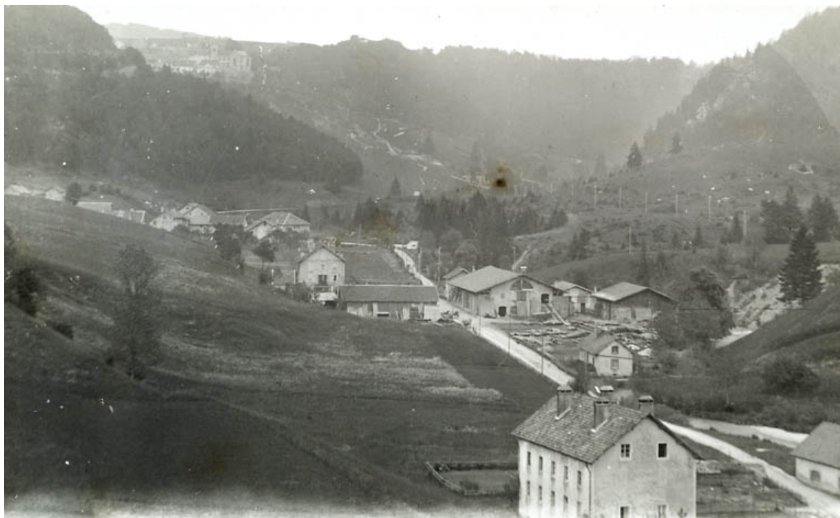
[Vue d'ensemble, depuis le sud], [1ère moitié 20e siècle]. 25, Jougne rue des Forges, lieudit : la Ferrière