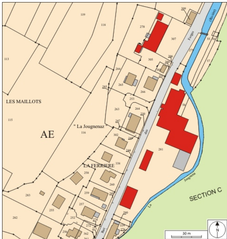
Plan masse et de situation. Extrait du plan cadastral, 2008, section AE, échelle 1/1 000. 25, Jougne rue des Forges, lieudit : la Ferrière