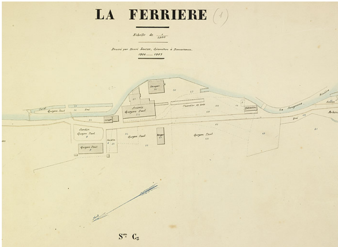
La Ferrière [1ère feuille. Détail : partie centrale, haut], 1906-1907.

25, Jougne rue des Forges, lieudit : la Ferrière