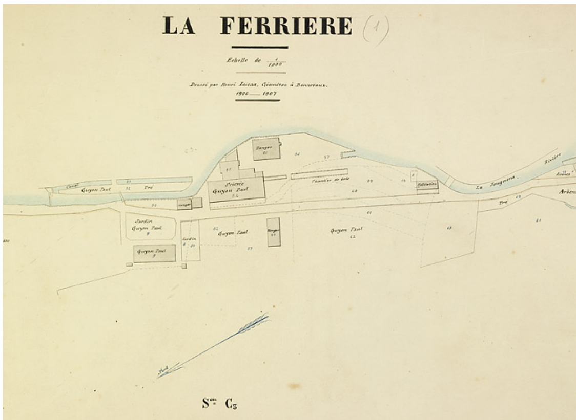
La Ferrière [1ère feuille. Détail : partie centrale, haut], 1906-1907.

25, Jougne rue des Forges, lieudit : la Ferrière