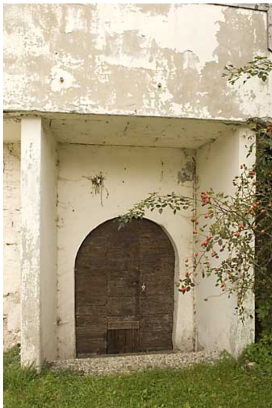
Partie nord : porte au rez-de-chaussée de la maison.

25, Jougne rue des Forges, lieudit : la Ferrière