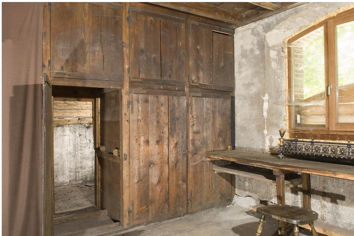
Usine, magasin industriel : table et placards. 25, Jougne rue des Forges, lieudit : les Maillots