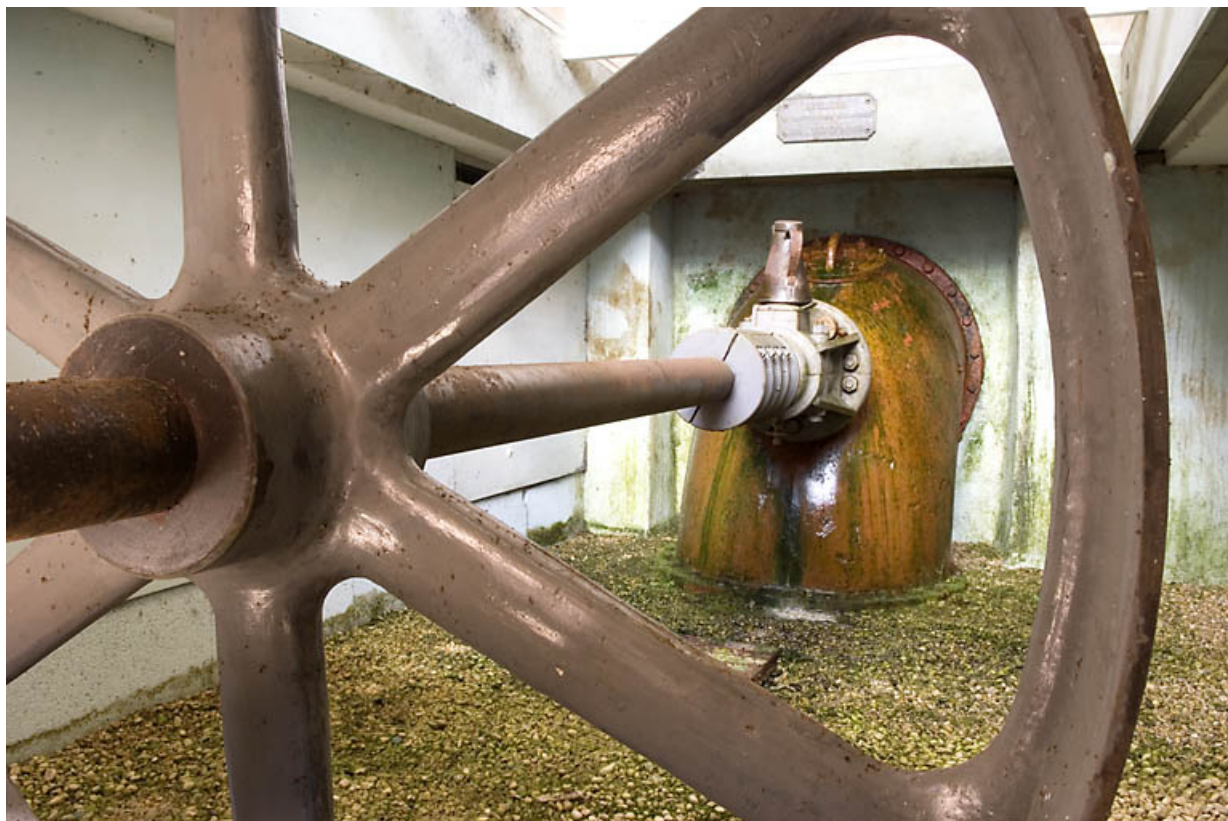
Usine : axe de transmission et volant.

25, Jougne rue des Forges, lieudit : les Maillots