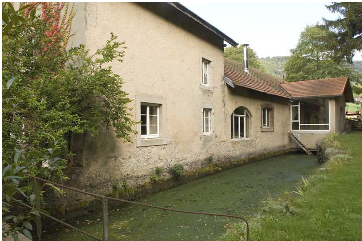
Canal de fuite, depuis l'aval (avec de gauche à droite, maison, usine et bâtiment d'eau). 25, Jougne rue des Forges, lieudit : les Maillots