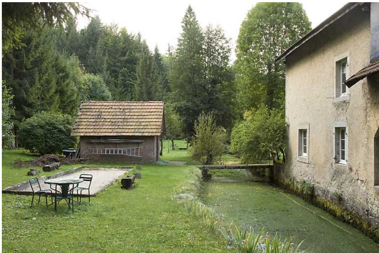
Canal de fuite, depuis l'amont, entre remise (à gauche) et maison (à droite). 25, Jougne rue des Forges, lieudit : les Maillots