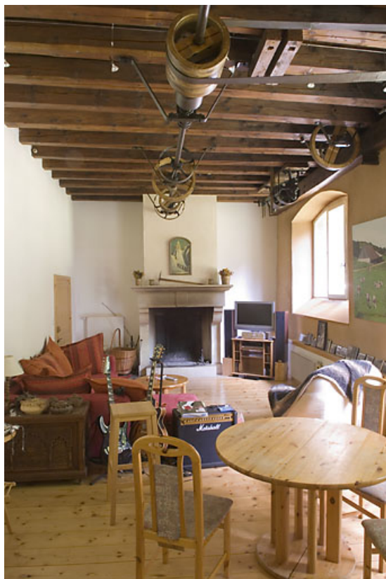
Usine : atelier transformé en salon, avec transmission.

25, Jougne rue des Forges, lieudit : les Maillots