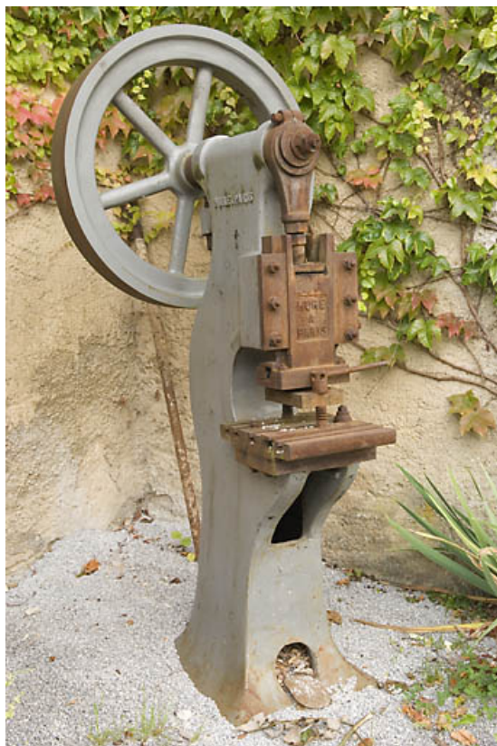
Usine : presse Hure, à Paris.

25, Jougne rue des Forges, lieudit : les Maillots