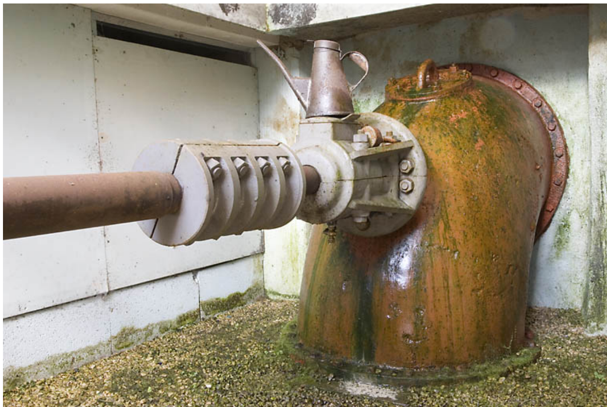
Usine : axe de transmission, sortant d'une conduite forcée.

25, Jougne rue des Forges, lieudit : les Maillots