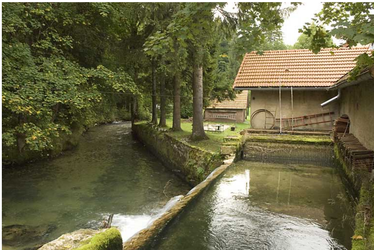
Canal d'aménée (avec déversoir à gauche) et bâtiment d'eau.

25, Jougne rue des Forges, lieudit : les Maillots