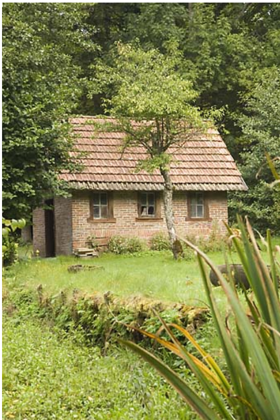
Remise : vue d'ensemble, depuis le sud.

25, Jougne rue des Forges, lieudit : les Maillots