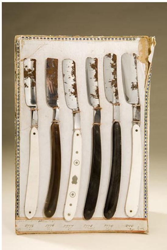
Présentoir de rasoirs droits à main ou "coupe-choux" (musée de Jougne). 25, Jougne