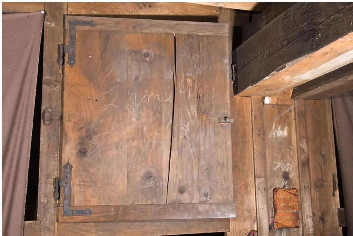
Usine, magasin industriel : placard avec inscriptions.

25, Jougne rue des Forges, lieudit : les Maillots