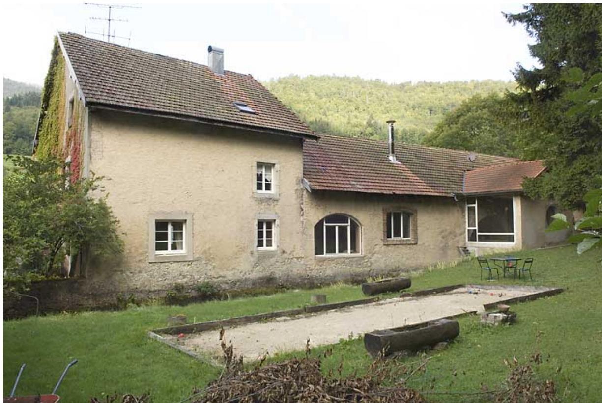
Façade postérieure, de trois quarts gauche. 25, Jougne rue des Forges, lieudit : les Maillots