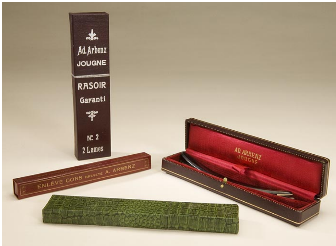
Rasoir droit à main et enlève-cor Arbenz (musée de Jougne). 25, Jougne