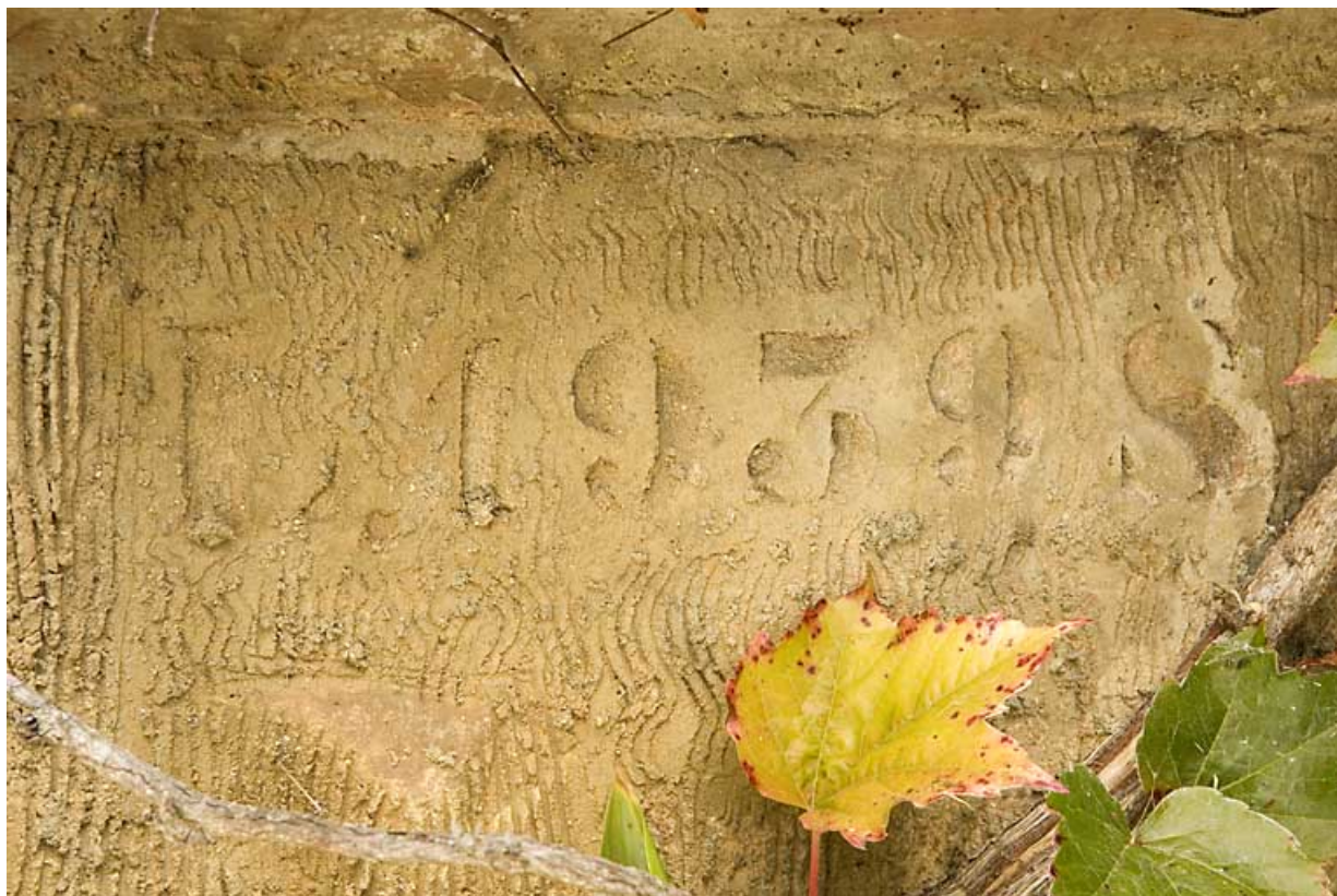
Maison, façade latérale droite : date 1939 sous la fenêtre.

25, Jougne rue des Forges, lieudit : les Maillots