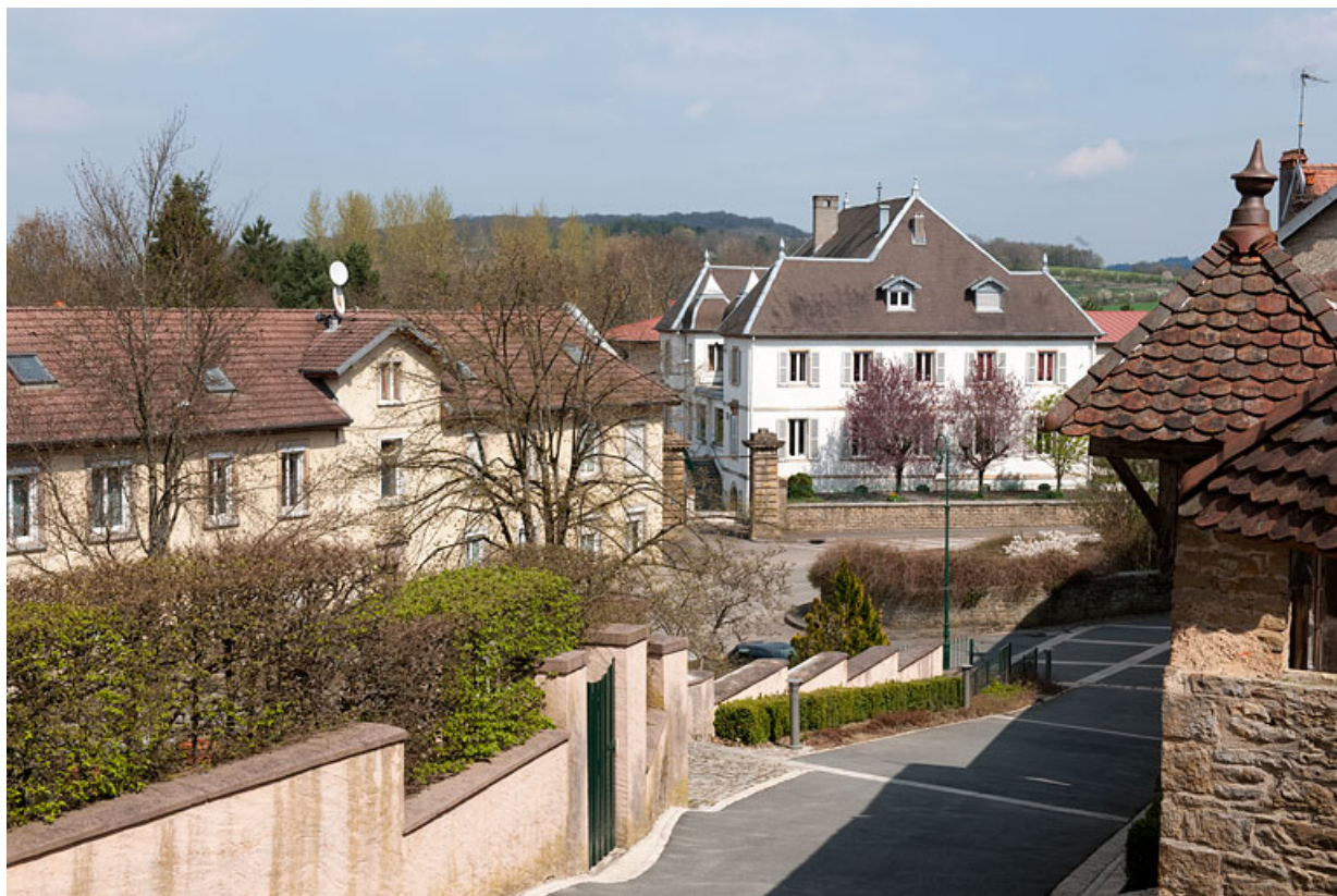
Vue générale depuis le bas de la Petite Côte. 25, Rougemont, 11 rue du Vieux Moulin