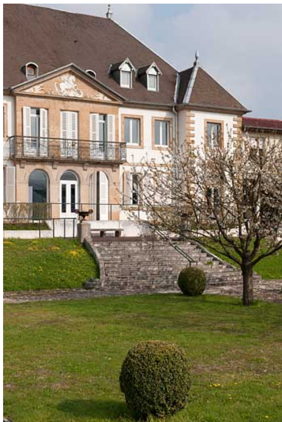
Vue rapprochée de la façade antérieure depuis le jardin.