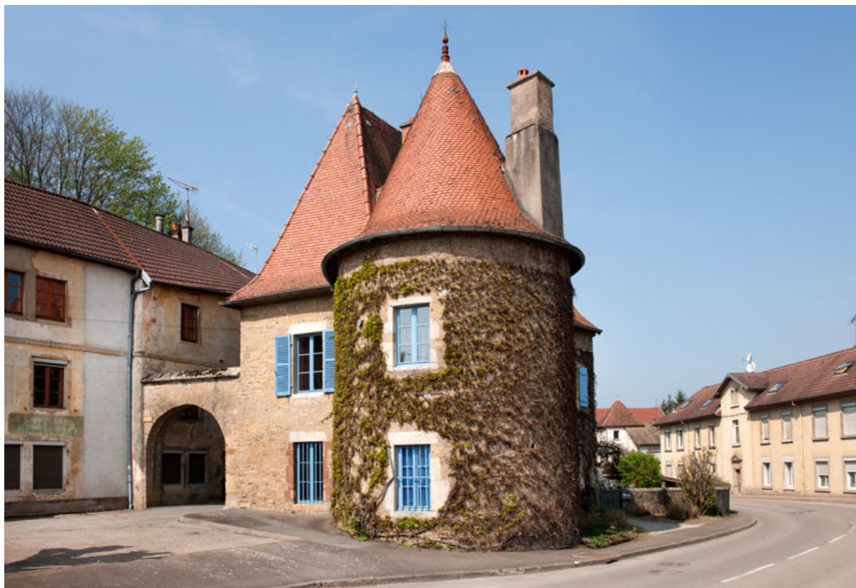
Vue d'ensemble de la porte du Vieux Moulin, de la maison du Vieux Moulin et de l'ancien pavillon d'isolement. 25, Rougemont, 11 rue du Vieux Moulin