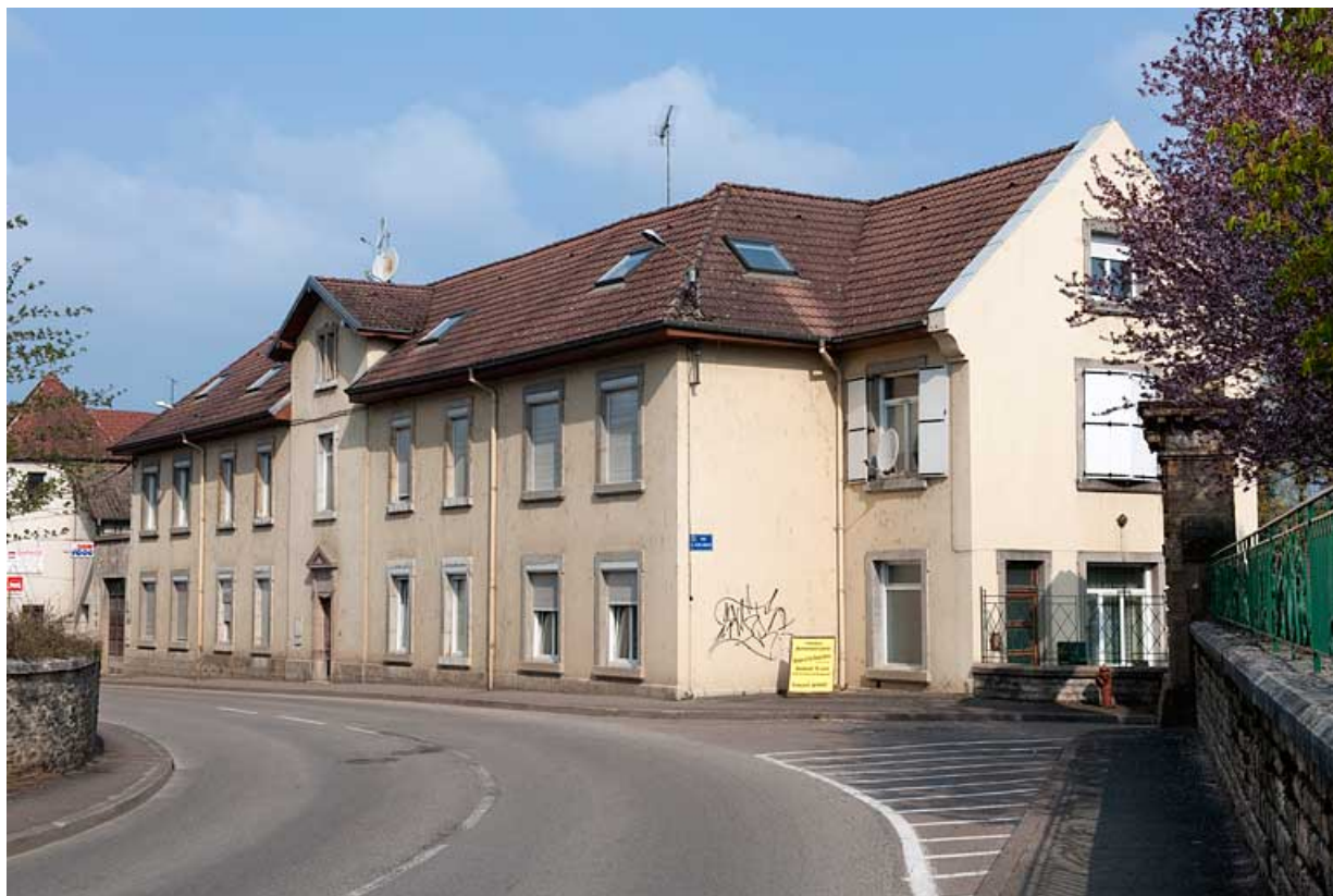
Vue générale de l'ancien pavillon d'isolement.