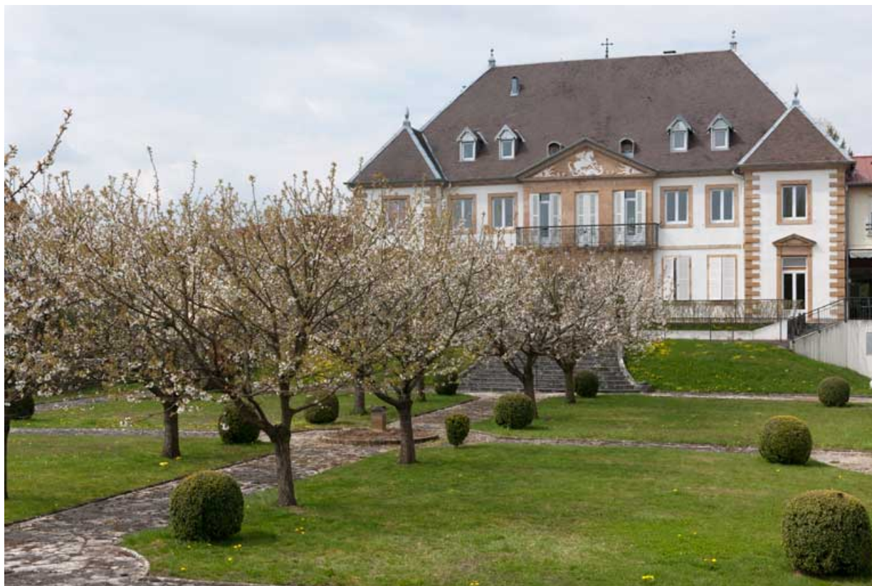
Vue d'ensemble de la façade antérieure et du jardin.