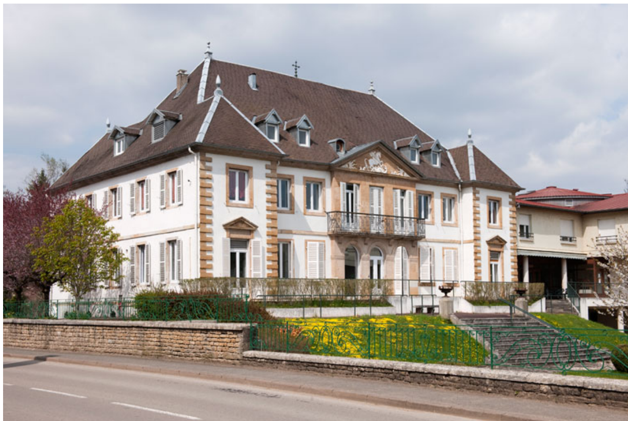
Façade antérieure et face latérale gauche depuis la rue du Vieux Moulin. 25, Rougemont, 11 rue du Vieux Moulin