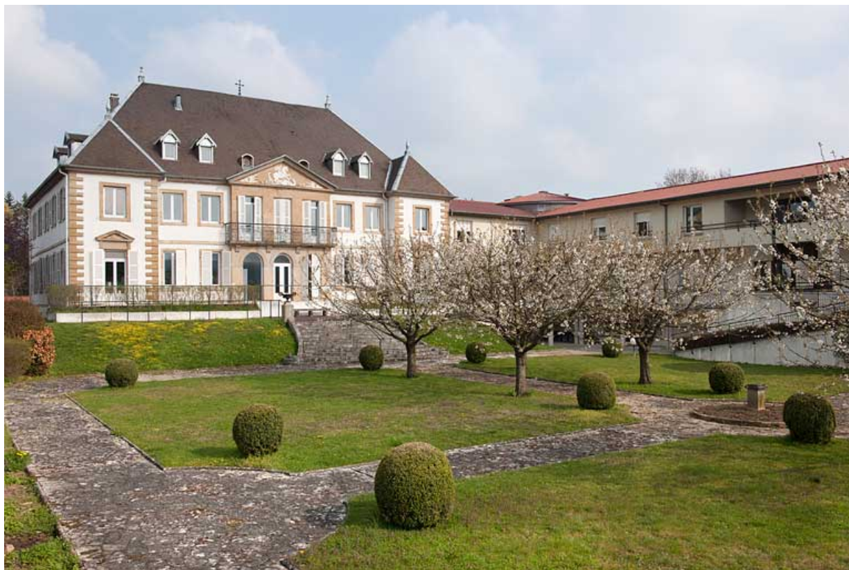
Vue d'ensemble du château, du jardin et de l'aile en retours.