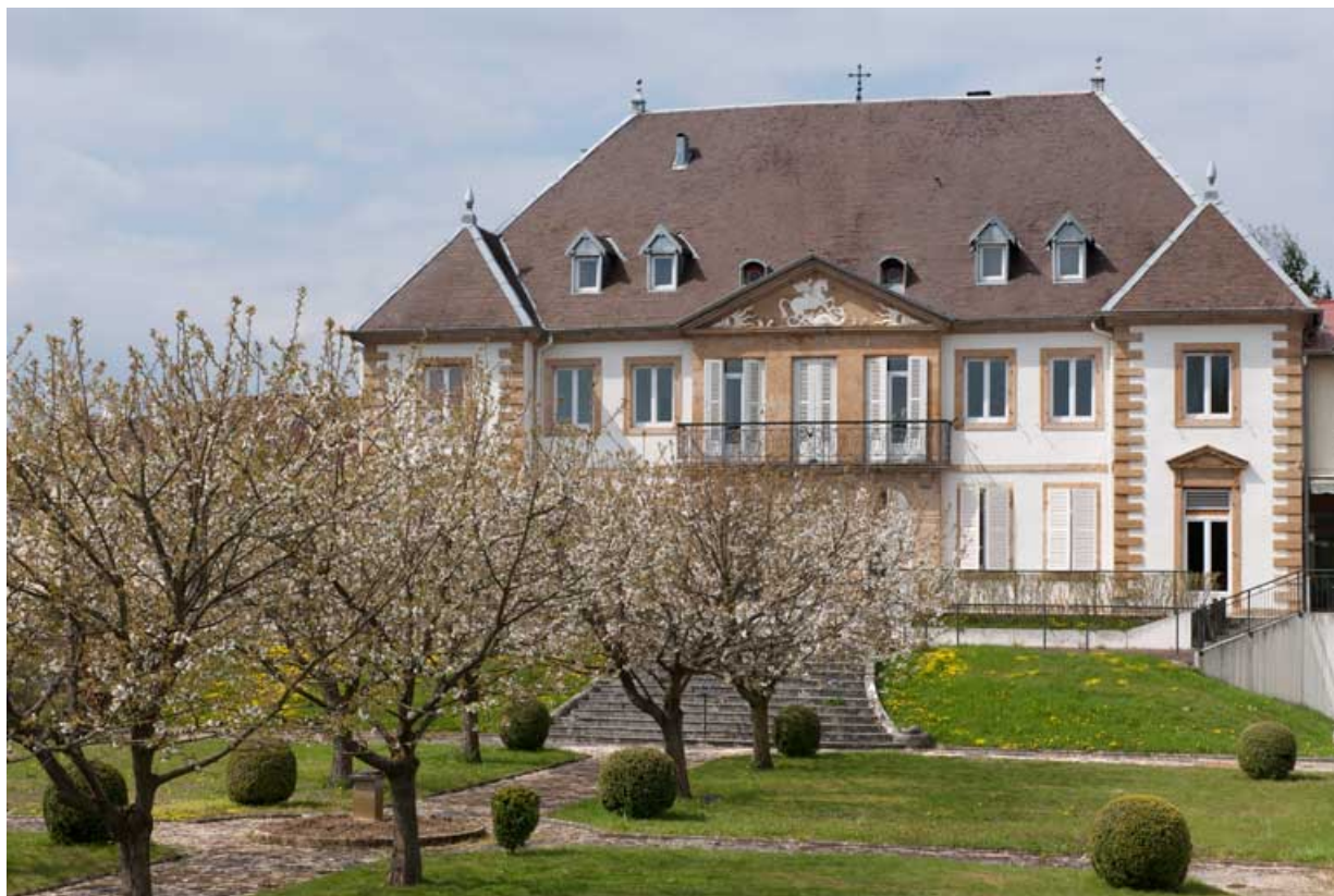
Vue rapprochée de la façade antérieure et du jardin.