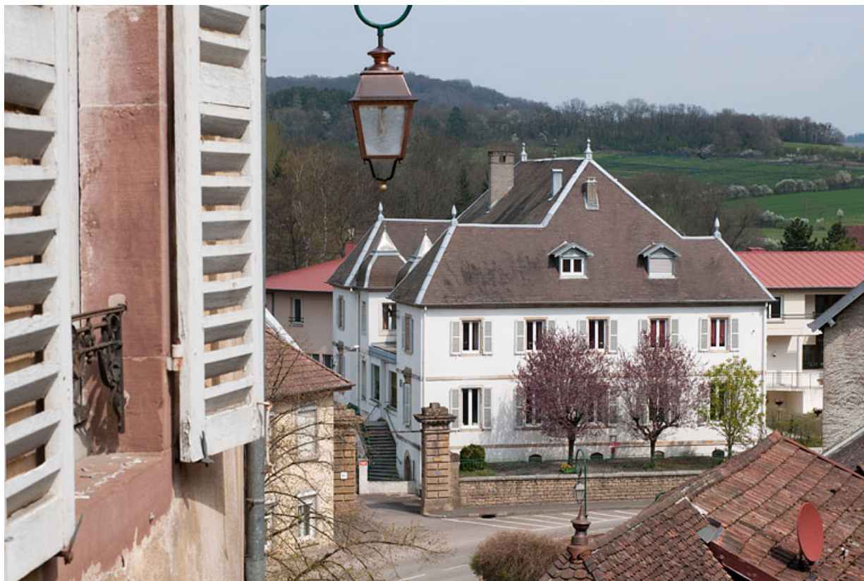
Vue rapprochée depuis la rue de la Petite Côte.