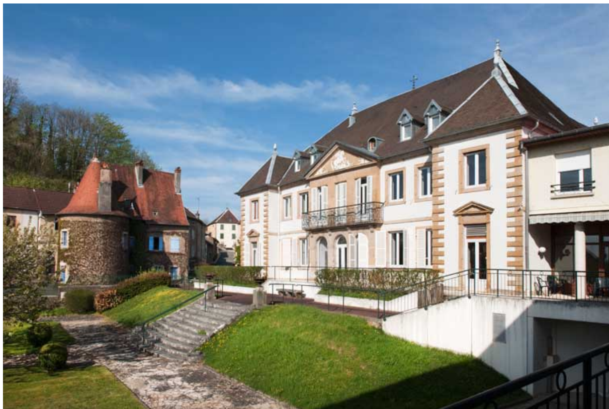
Vue d'ensemble de la maison du moulin et du château depuis le jardin.