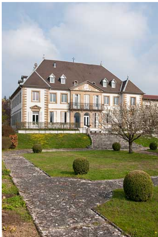
Façade antérieure depuis le jardin.