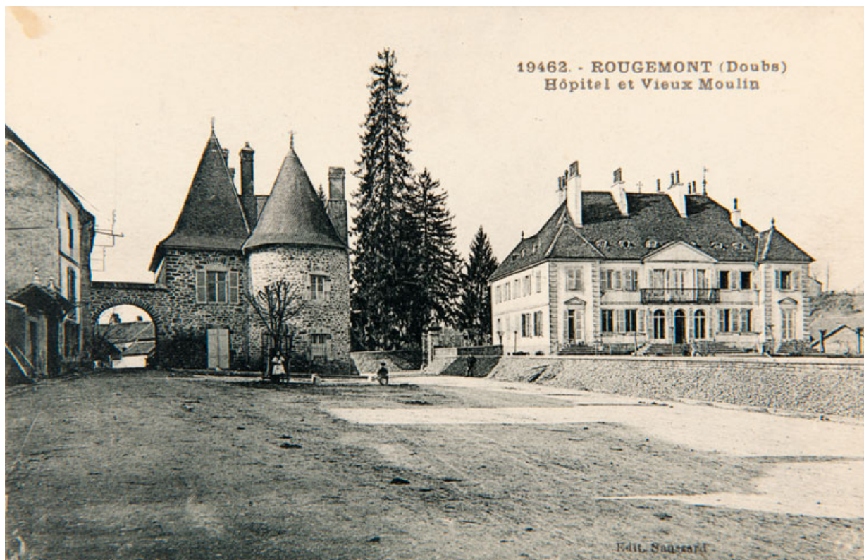
19462- ROUGEMONT (Doubs) Hôpital et Vieux Moulin.