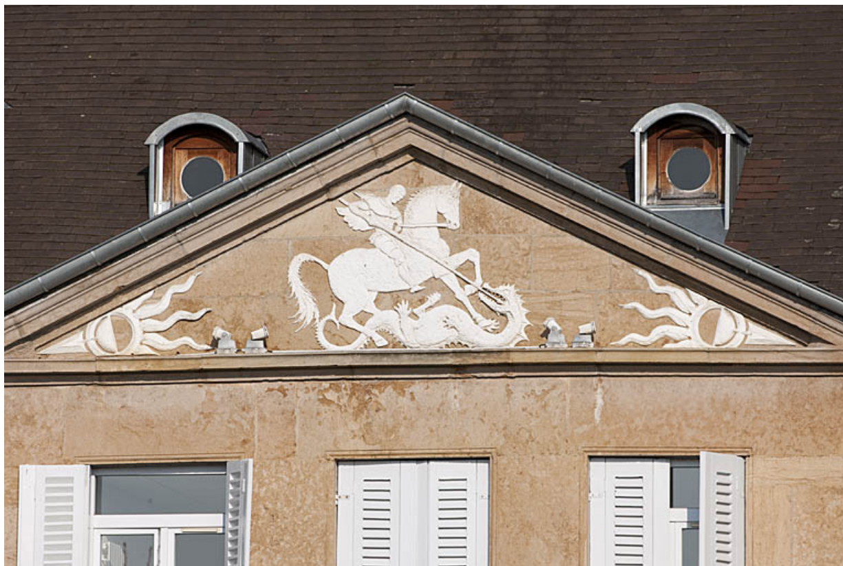
Façade antérieure, détail : le relief du fronton représentant saint Georges terrassant le dragon. 25, Rougemont, 11 rue du Vieux Moulin