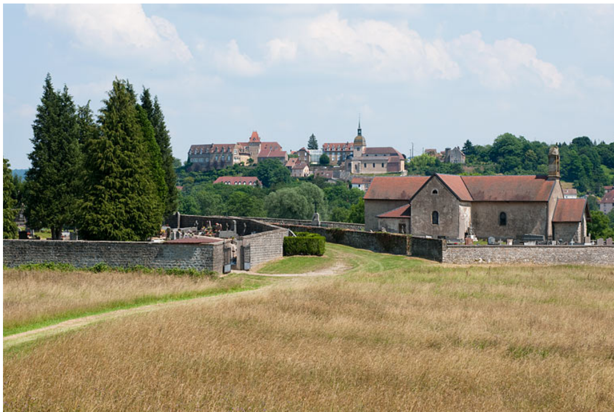
Vue générale, avec Rougemont en arrière-plan.