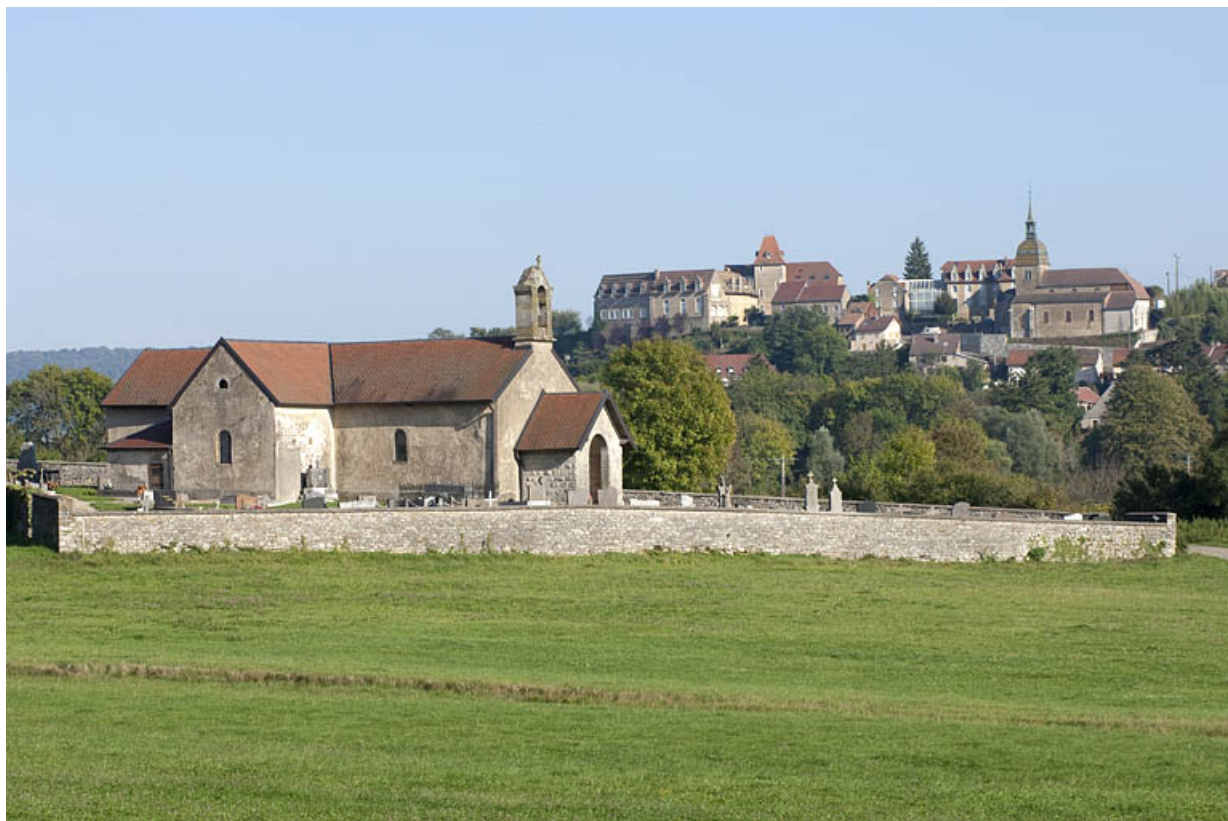
Vue générale rapprochée, avec Rougemont en arrière-plan.