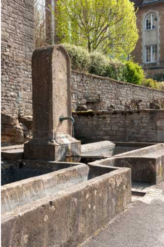
Détail : borne fontaine.