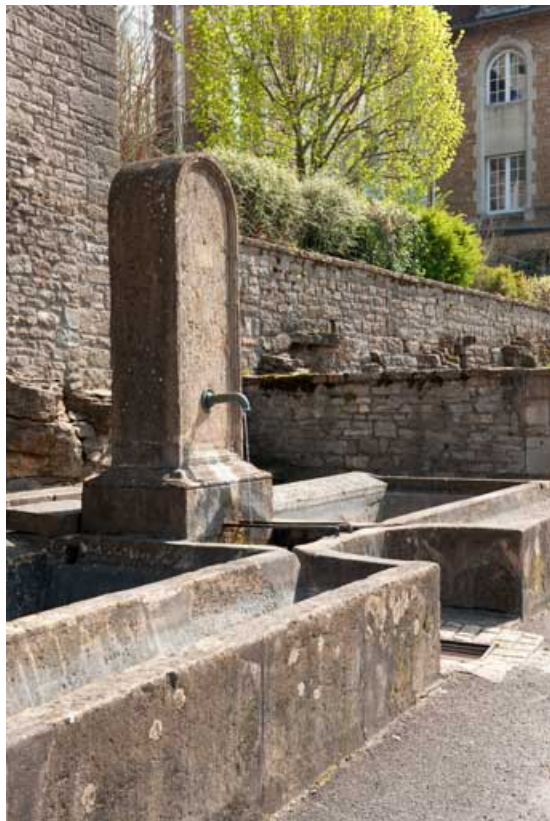
Détail : borne fontaine.