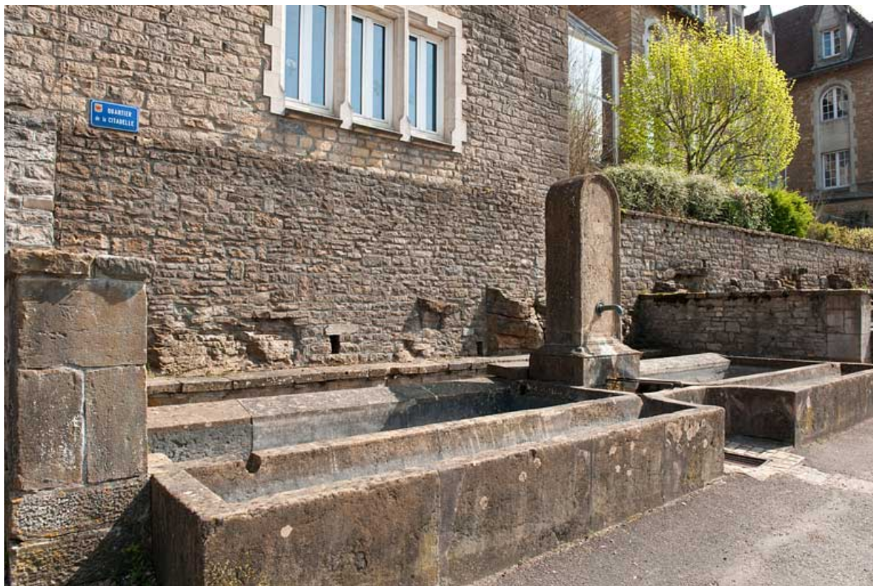
Vue générale de trois quart gauche. 25, Rougemont quartier de la Citadelle