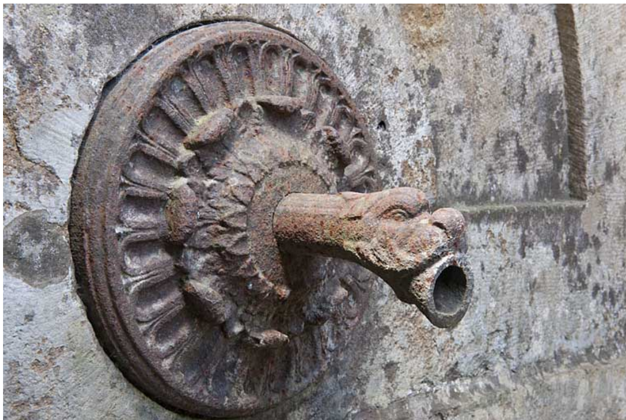
Vue d'une gueule de dragon ornant une pile de jet. 25, Rougemont rue du Lavoir