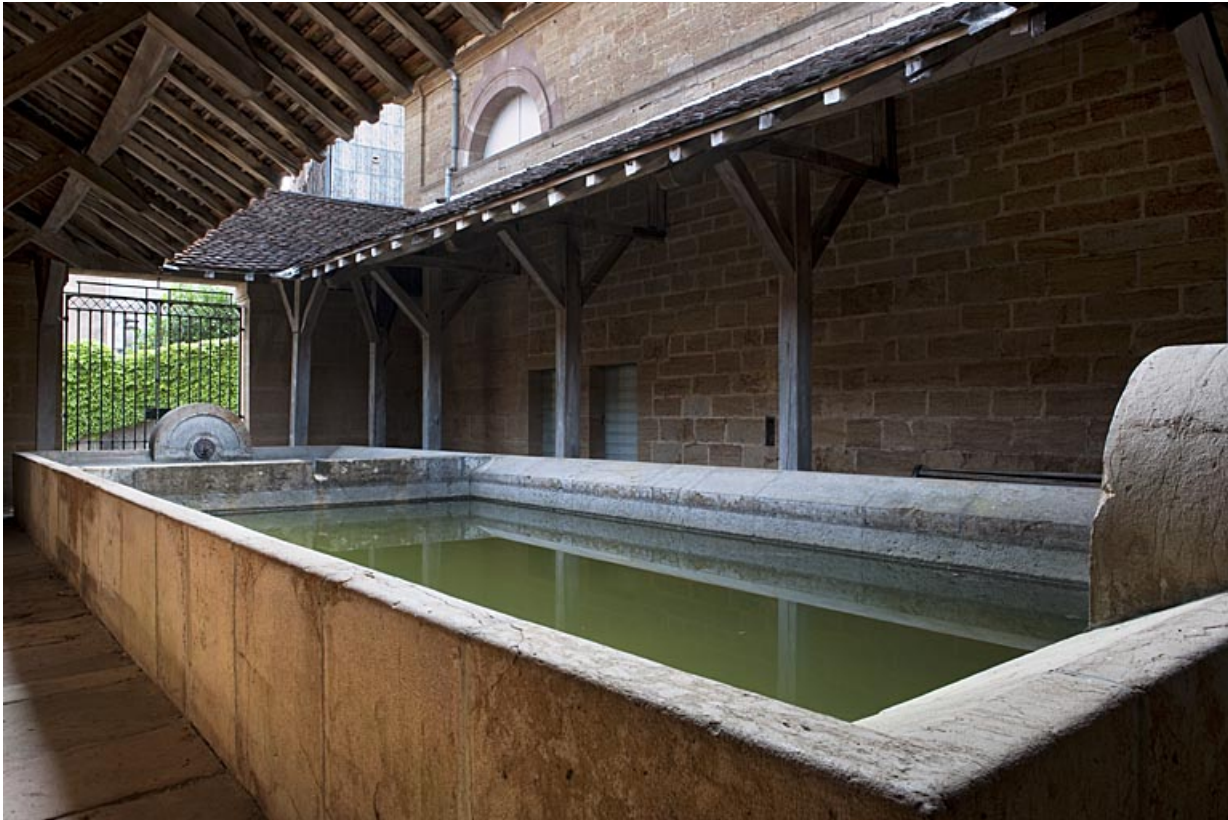
Vue des bassins.