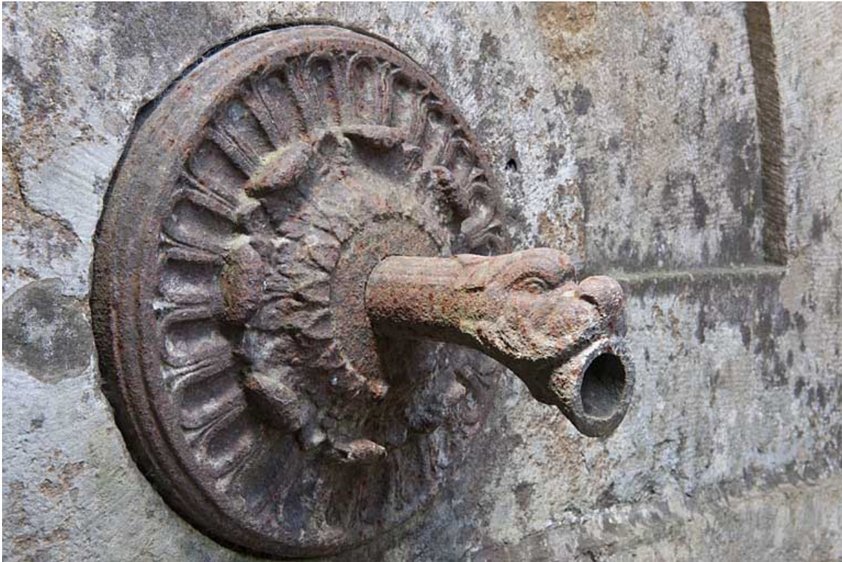
Vue d'une gueule de dragon ornant une pile de jet.