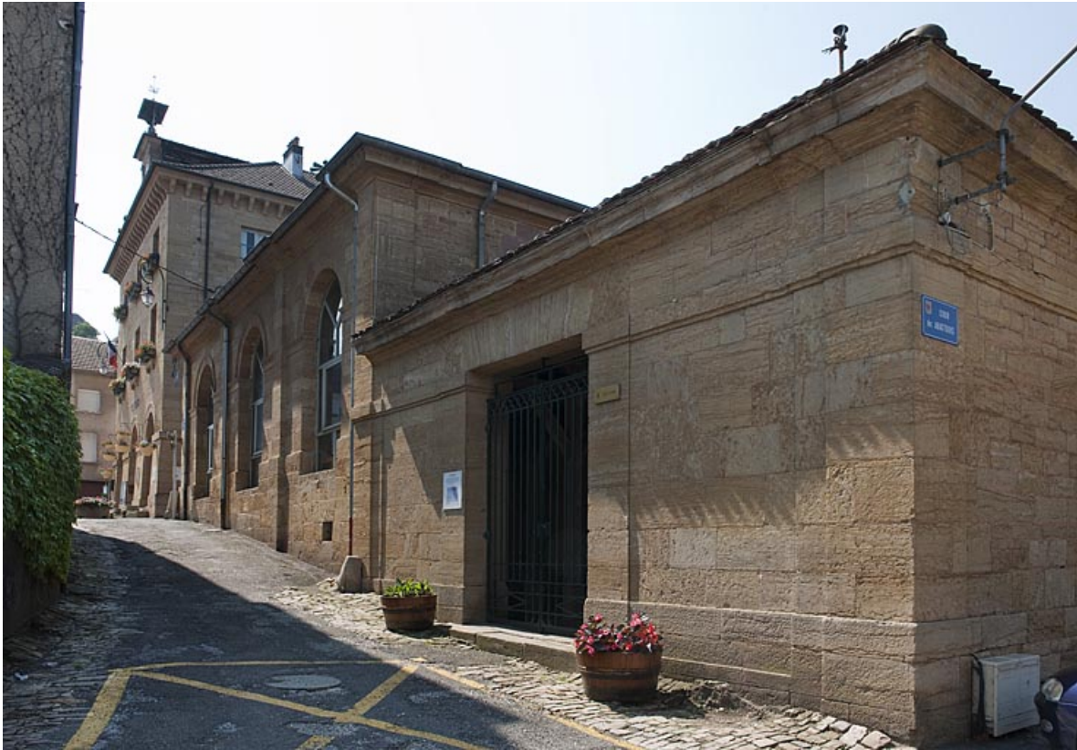
Façade rue du Lavoir.