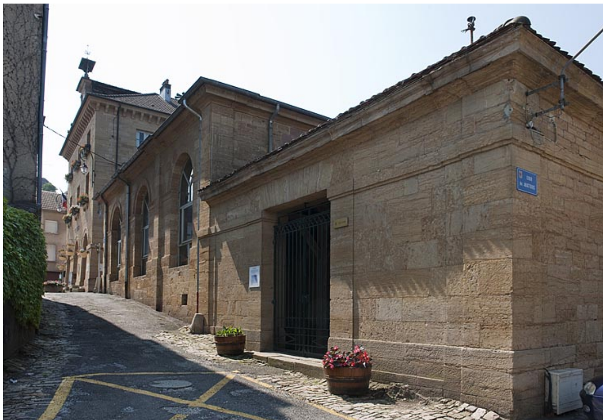
Façade rue du Lavoir.