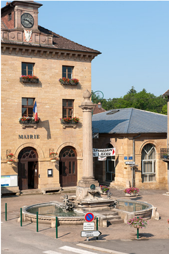
Vue générale ; au second plan la mairie et la halle. 25, Rougemont place du Marché