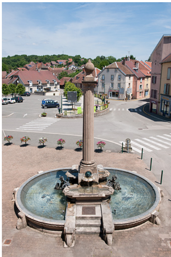
Vue générale depuis la mairie. 25, Rougemont place du Marché