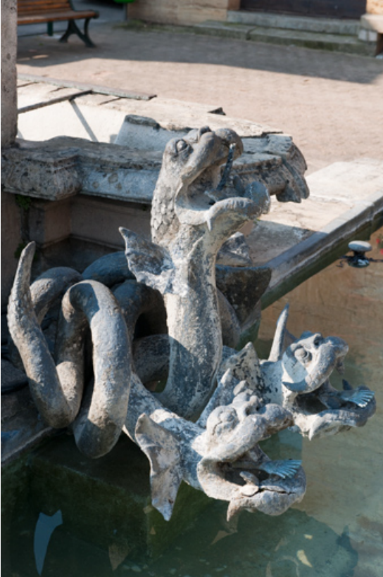
Vue en plongée de deux hydres.