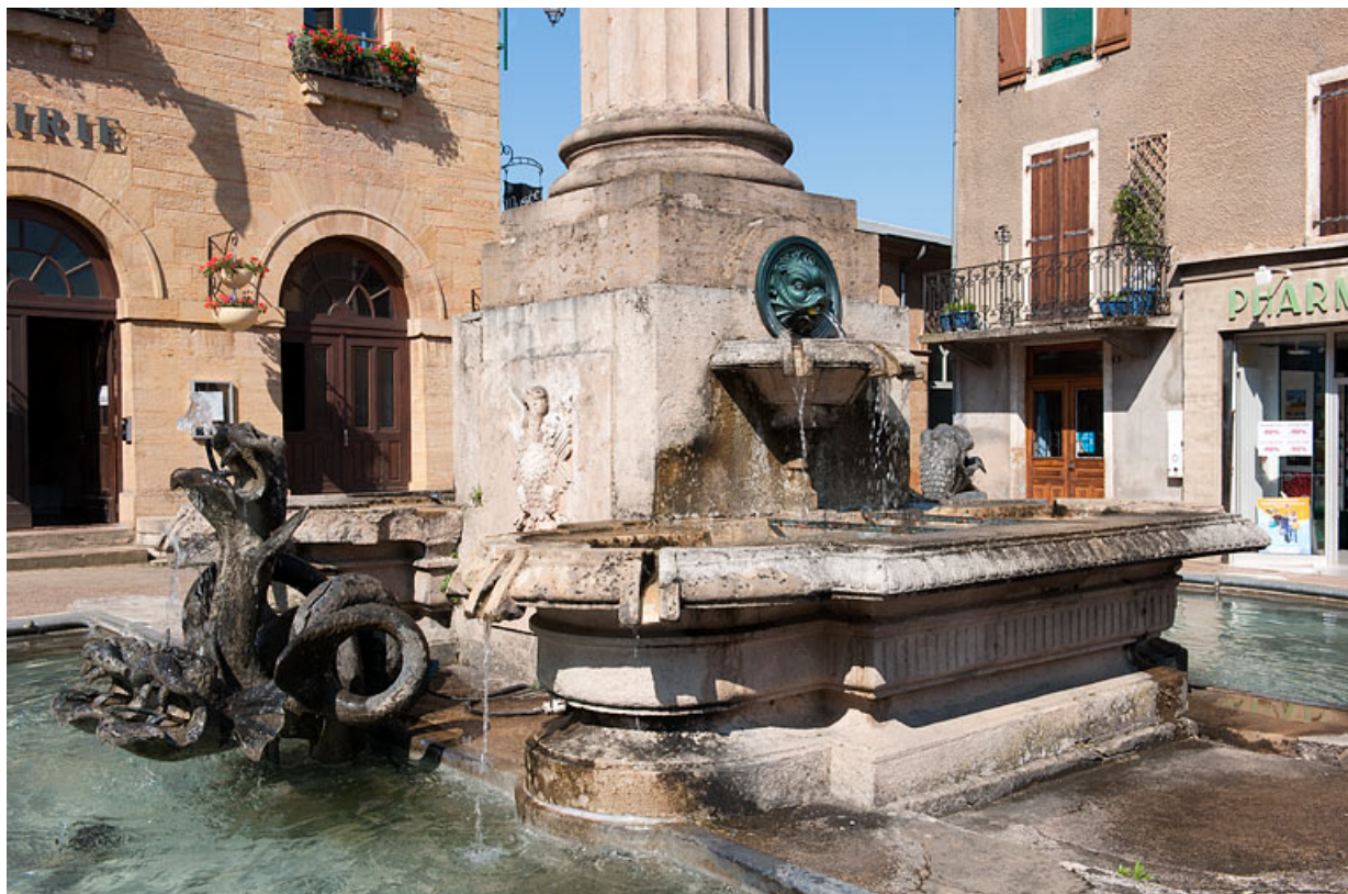
Vue rapprochée et de trois quart des bassins de la fontaine.