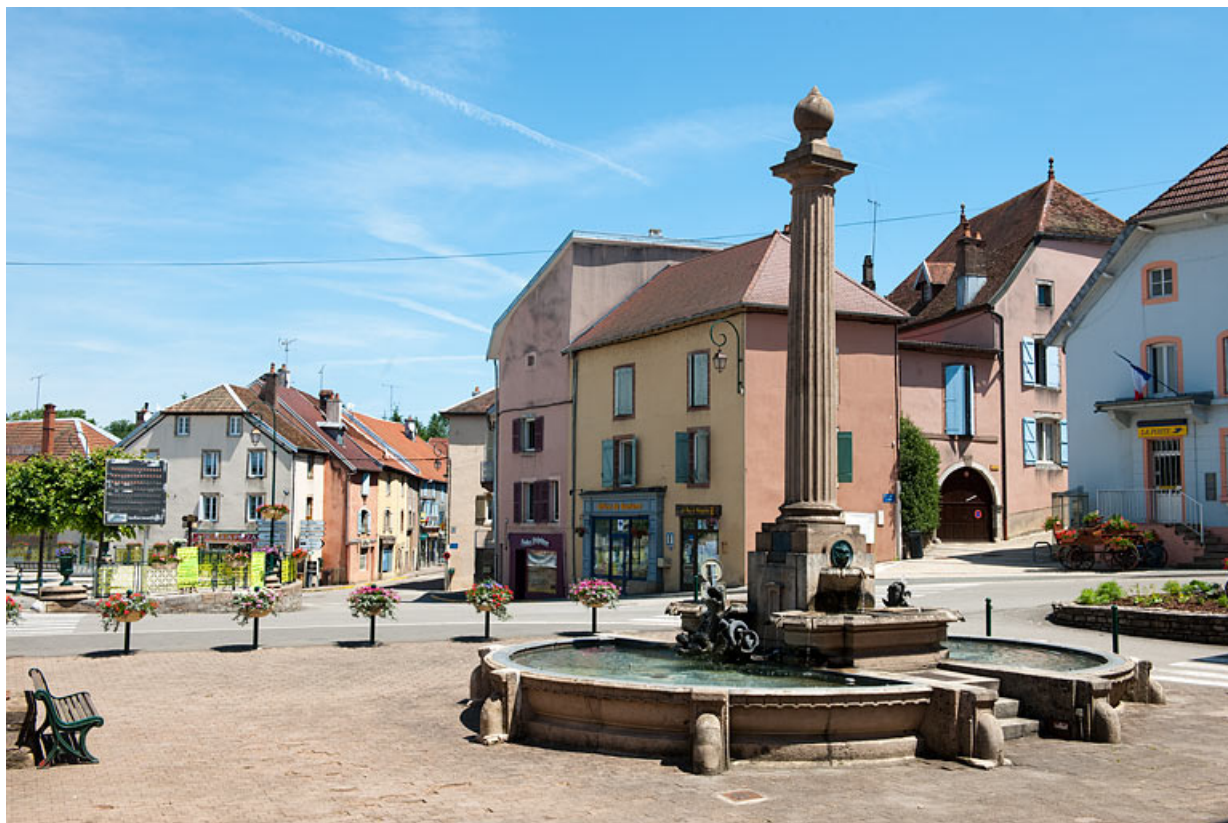
Vue générale de la place de la mairie.