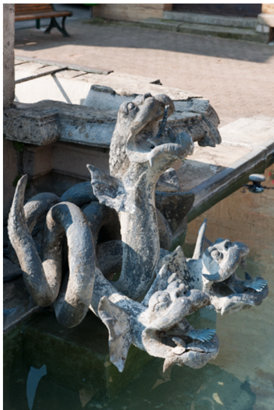
Vue en plongée de deux hydres.