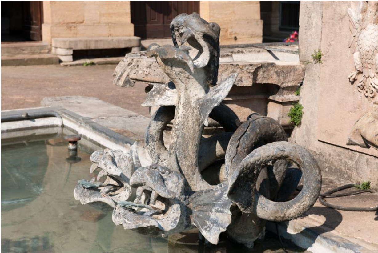
Vue de deux hydres.