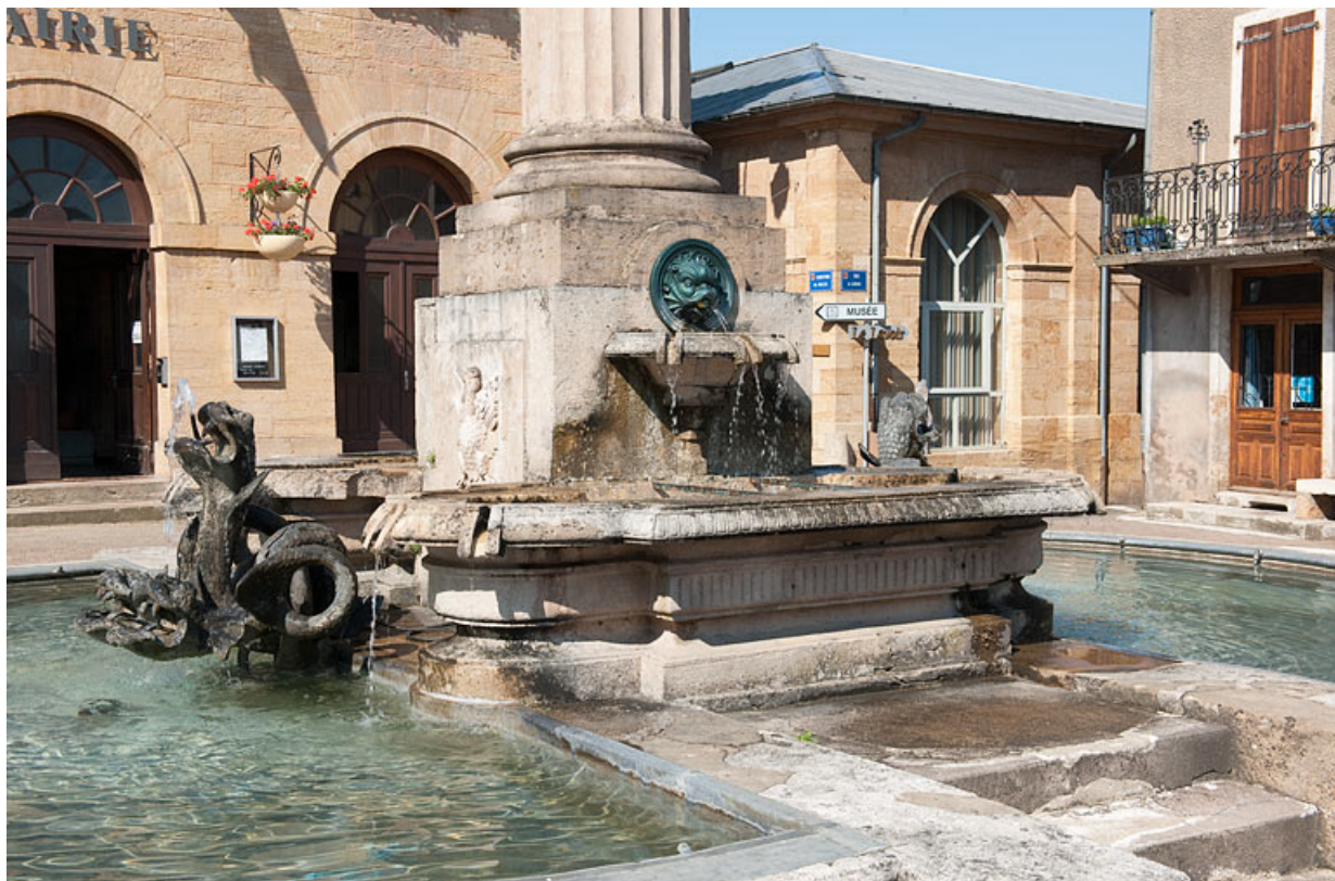
Vue de trois quart des bassins de la fontaine.