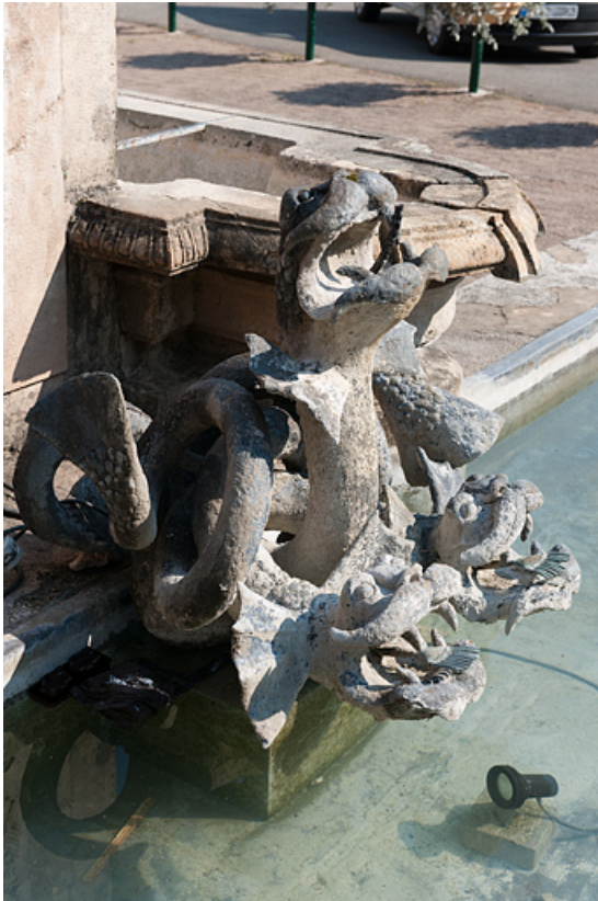
Vue de deux hydres.