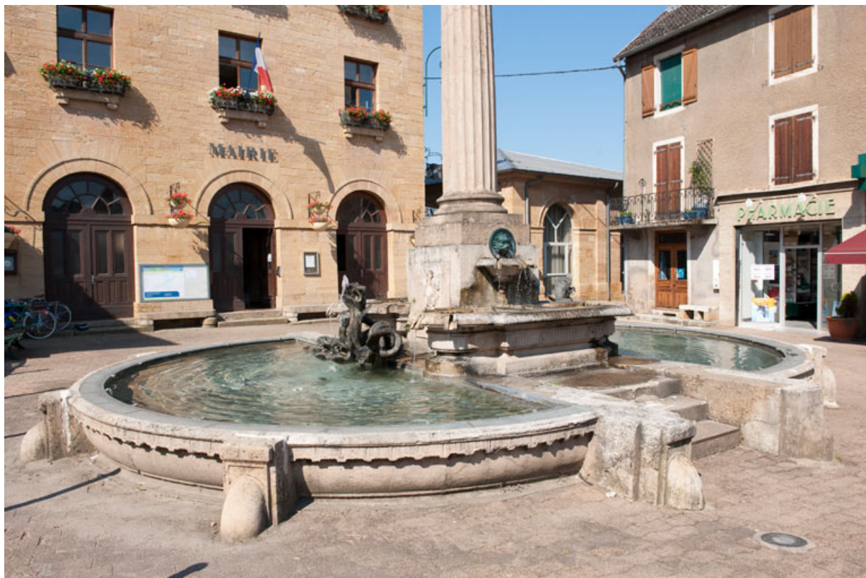
Vue générale des bassins de la fontaine.