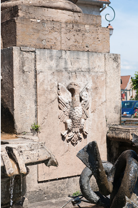
Détail de la borne-fontaine : les armes de la cité.