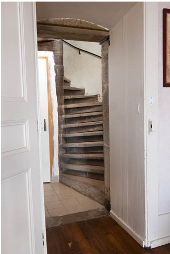
Intérieur : départ de l'escalier menant au 1er étage. 25, Rougemont, 2 quartier de la Citadelle