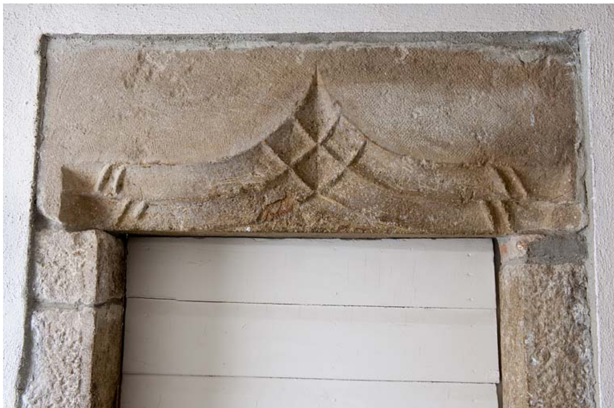
Intérieur : détail du linteau de la baie conduisant à l'ancienne grange.

25, Rougemont, 2 quartier de la Citadelle