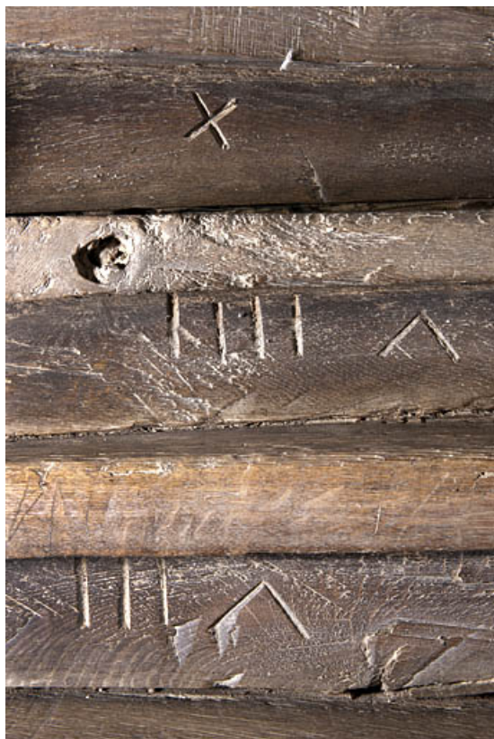
Intérieur : escalier en charpente meant à l'étage, détail des marches numérotées. 25, Rougemont, 2 quartier de la Citadelle