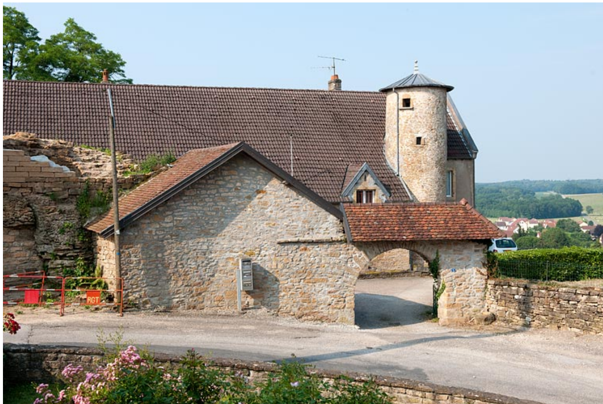
Vue d'ensemble depuis la rue du Quartier de la Citadelle.

25, Rougemont, 2 quartier de la Citadelle