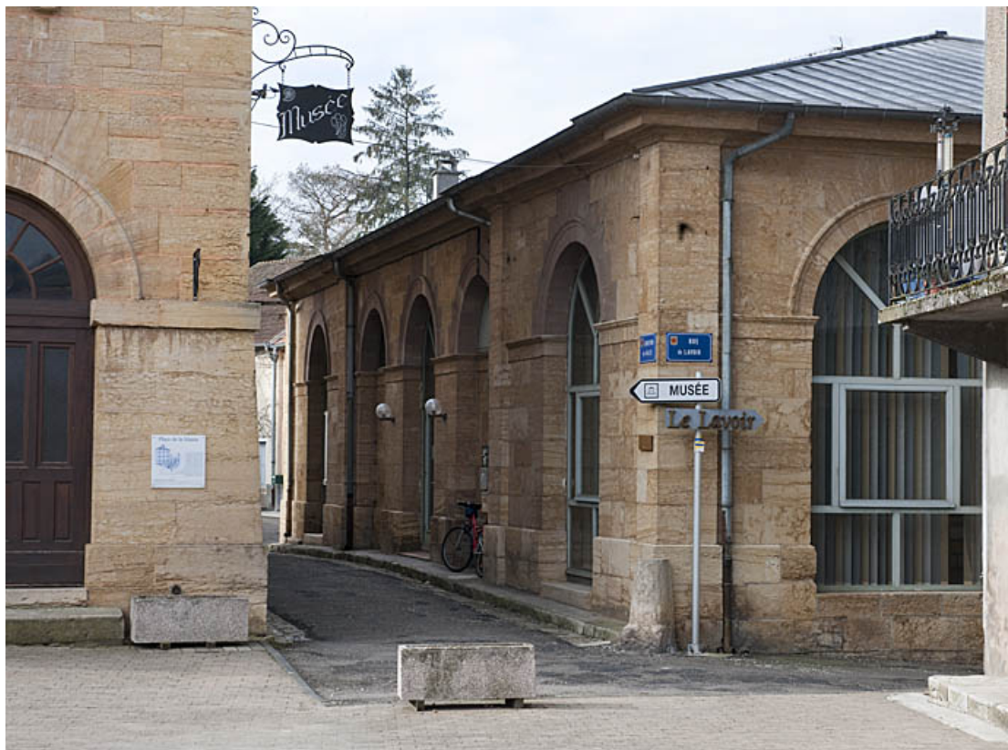
La façade vue de trois quart droit. 25, Rougemont rue du Lavoir