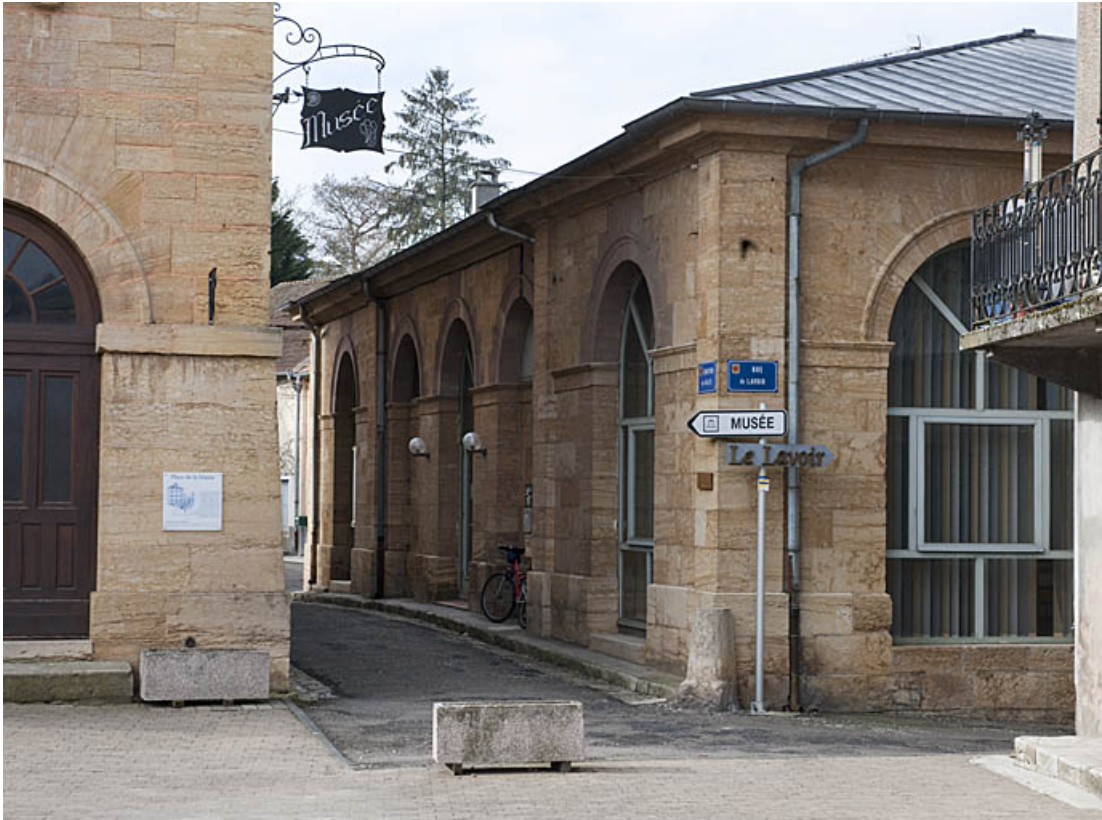
La façade vue de trois quart droit. 25, Rougemont rue du Lavoir