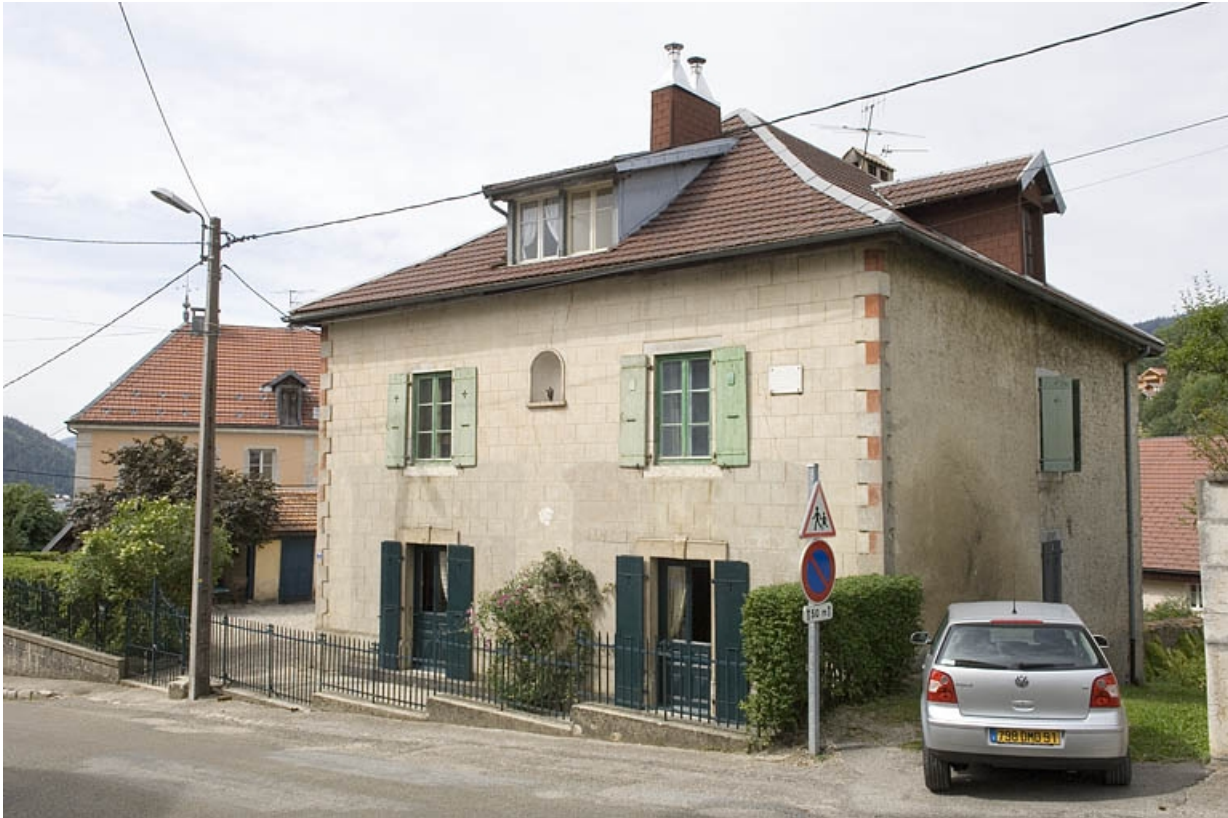
Vue de trois-quarts droit.