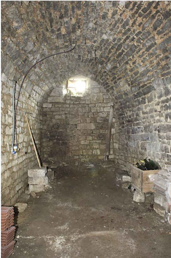
Première cave voûtée.