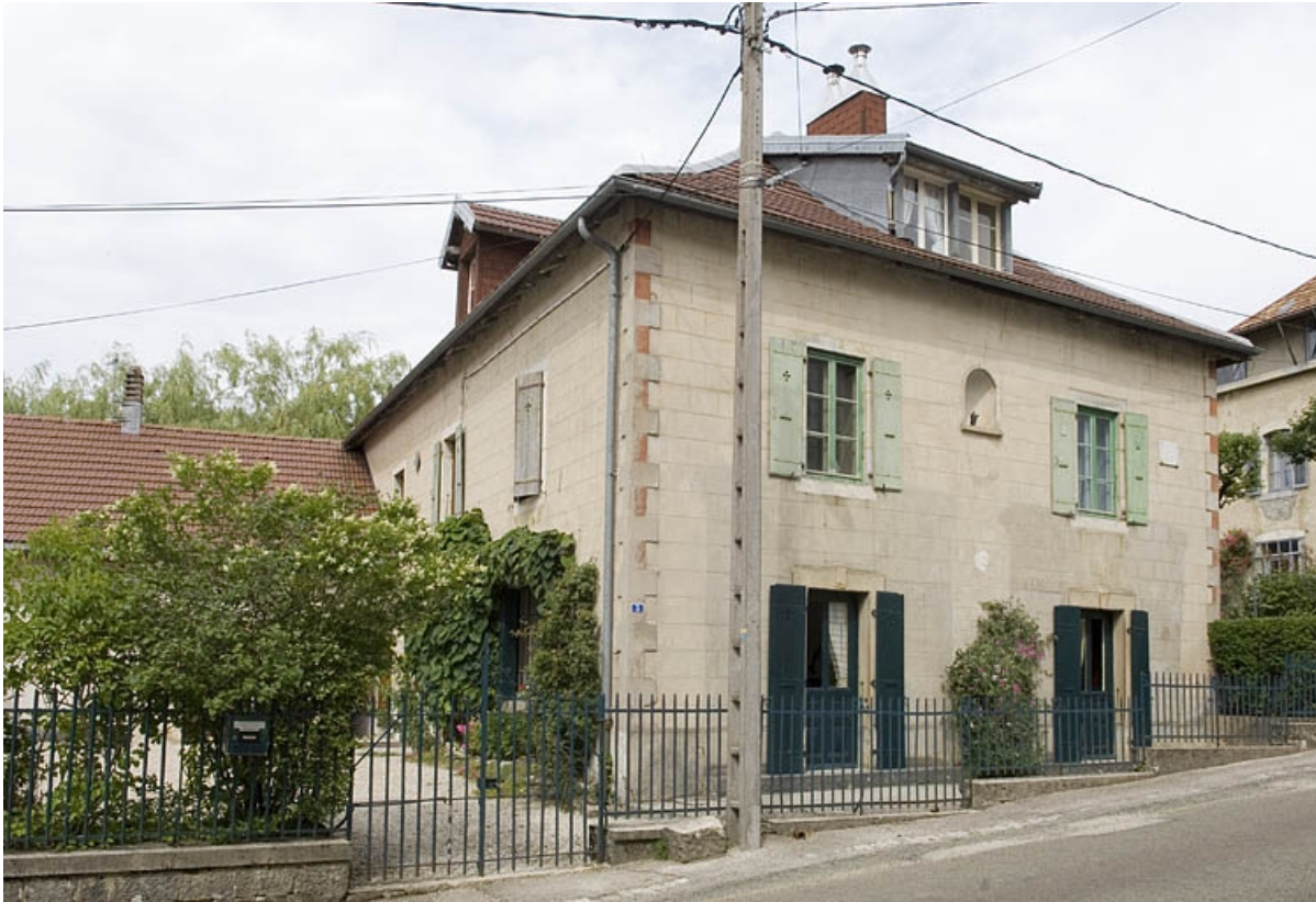
Façade antérieure et façade latérale gauche. 25, Jougne