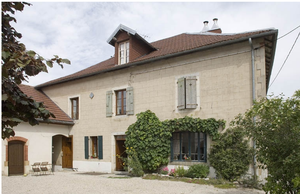
Élévation côté cour.