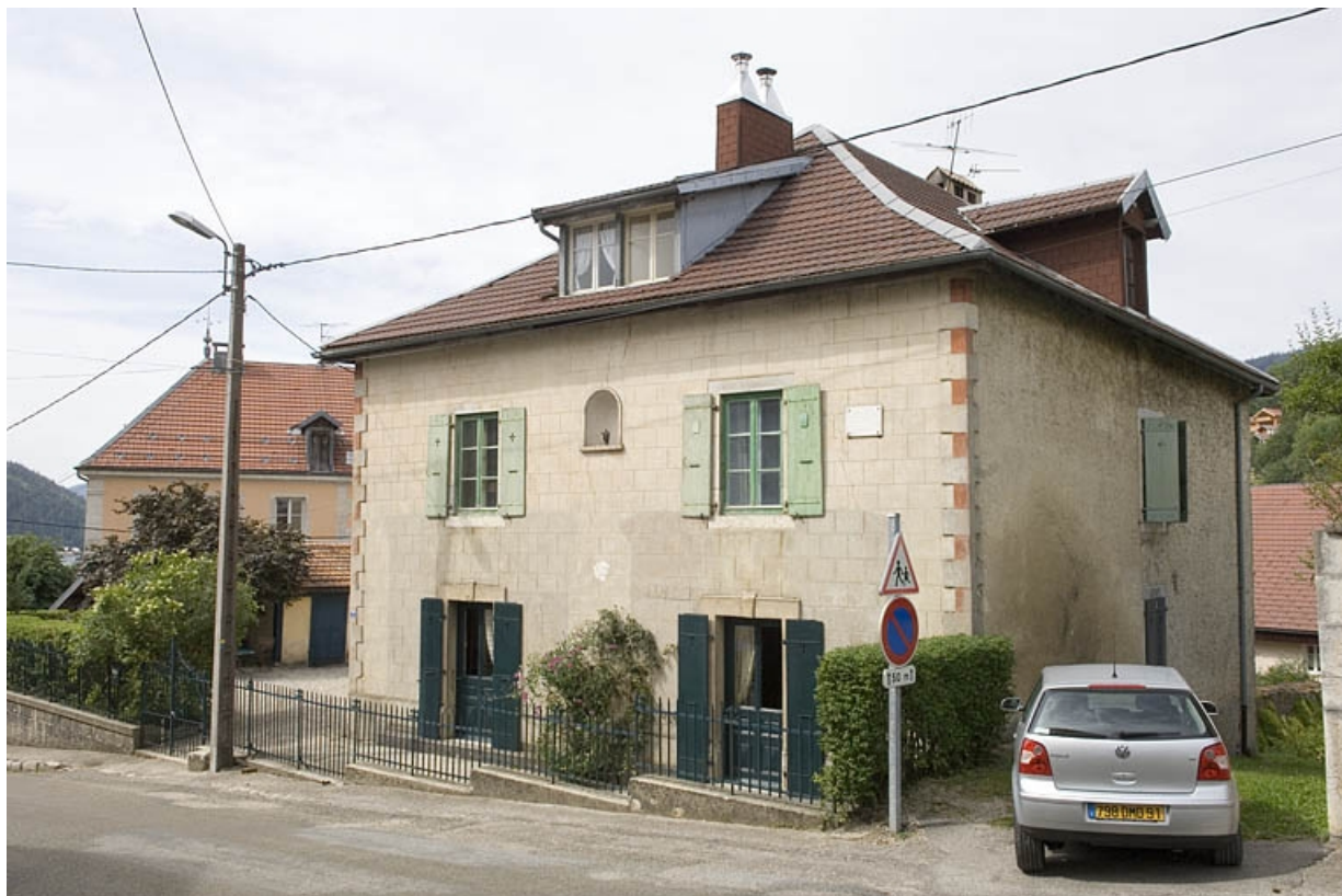
Vue de trois-quarts droit.