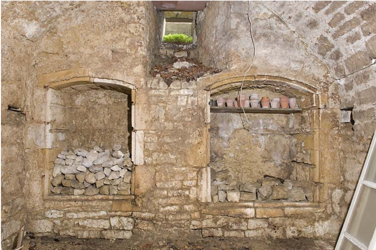
Deuxième cave voûtée : placards muraux. 25, Jougne