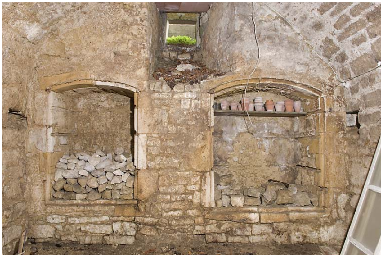
Deuxième cave voûtée : placards muraux. 25, Jougne