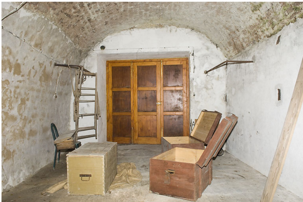
Deuxième cave voûtée. 25, Jougne