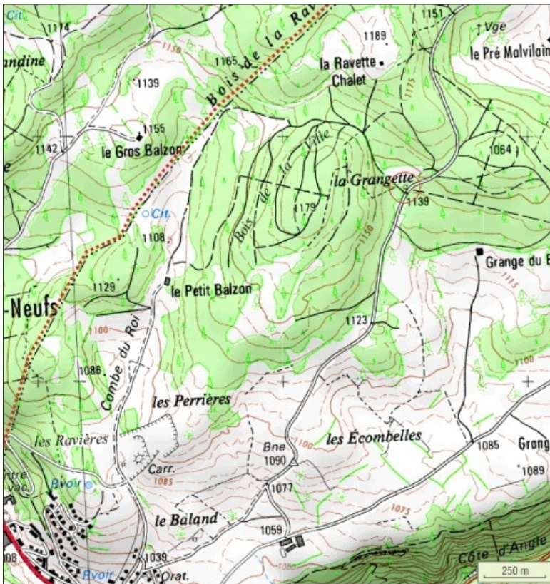
Carte de localisation. Extrait de la carte IGN, échelle 1/12 500 ; 25, Jougne, lieudit : la Grangette