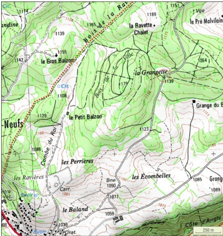
Carte de localisation. Extrait de la carte IGN, échelle 1/12 500 ; 25, Jougne, lieudit : la Grangette