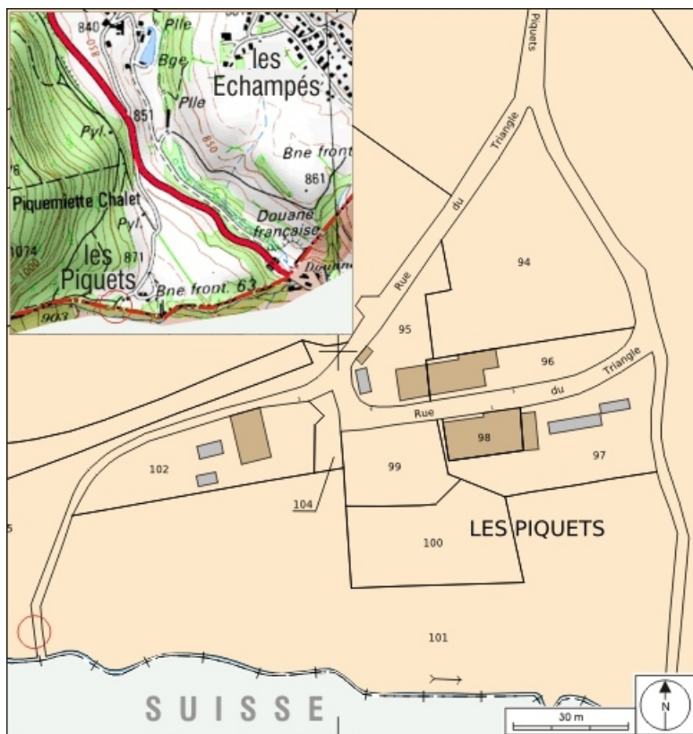
Plan masse et carte de localisation. Extrait du plan cadastral, 2008, section C, échelle 1/1 000 et extrait de la carte IGN, échelle 1/12 500 ; SCAN 25 (c) IGN - 2008, Licence n° 2008CISE29-68.