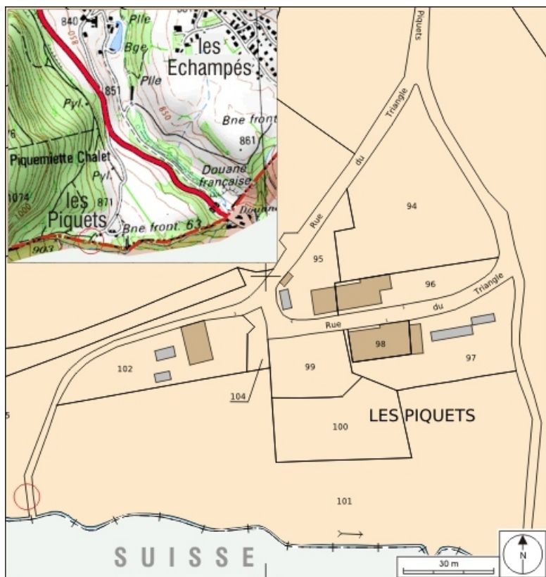
Plan masse et carte de localisation. Extrait du plan cadastral, 2008, section C, échelle 1/1 000 et extrait de la carte IGN, échelle 1/12 500 ; SCAN 25 (c) IGN - 2008, Licence n° 2008CISE29-68.