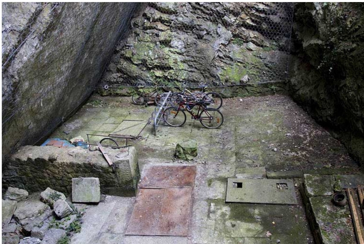
Vestiges des anciennes glaciers de la ville (?), 72 rue du Faubourg Rivotte.

25, Besançon, 62, 64, 66, 68, 70, 72 rue du Faubourg Rivotte, lieudit : îlot Porte taillée