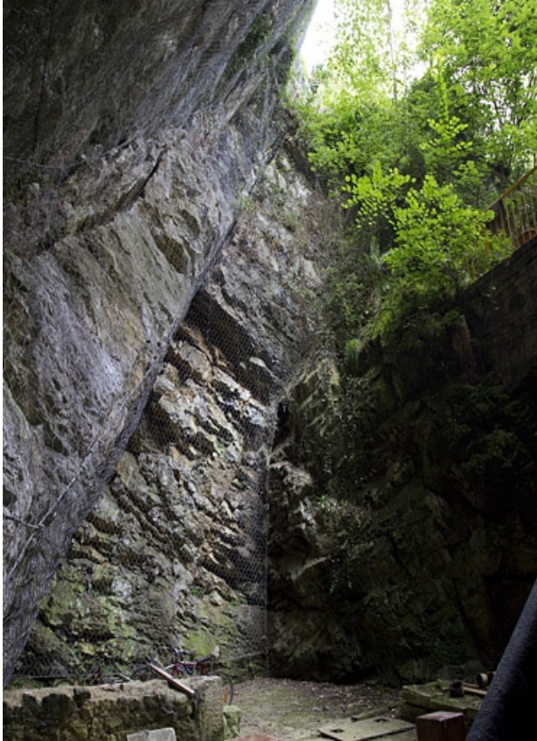
Vestiges des anciennes glaciers de la ville (?) : 72 rue du Faubourg Rivotte.

25, Besançon, 62, 64, 66, 68, 70, 72 rue du Faubourg Rivotte, lieudit : îlot Porte taillée