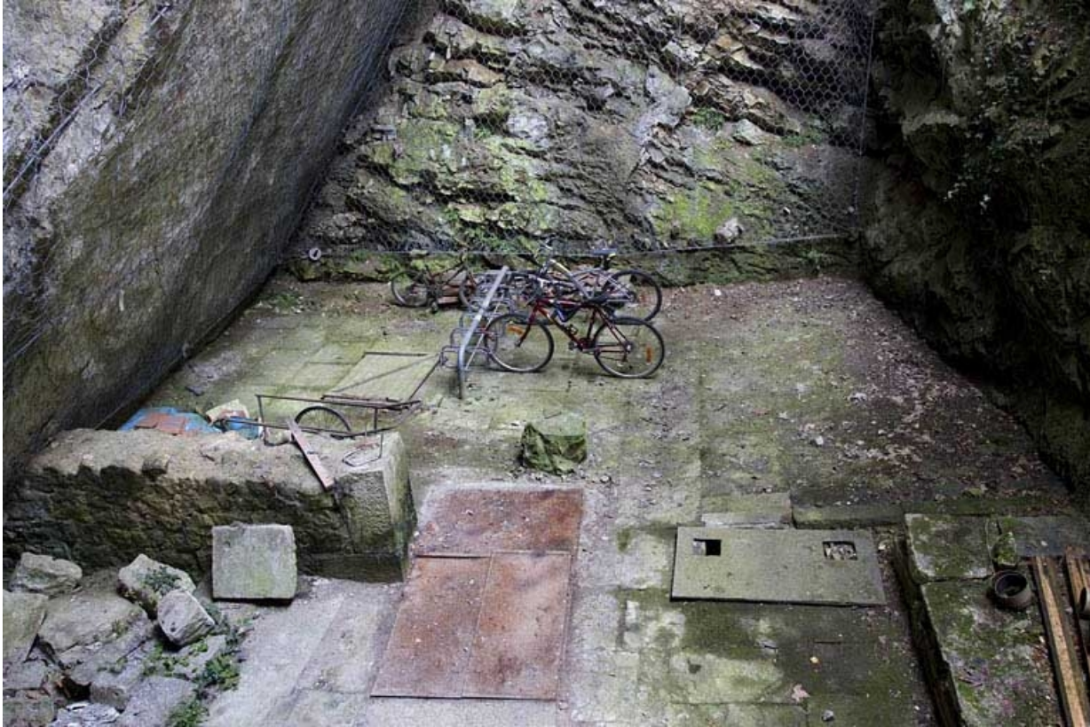
Vestiges des anciennes glaciers de la ville (?), 72 rue du Faubourg Rivotte.

25, Besançon, 62, 64, 66, 68, 70, 72 rue du Faubourg Rivotte, lieudit : îlot Porte taillée