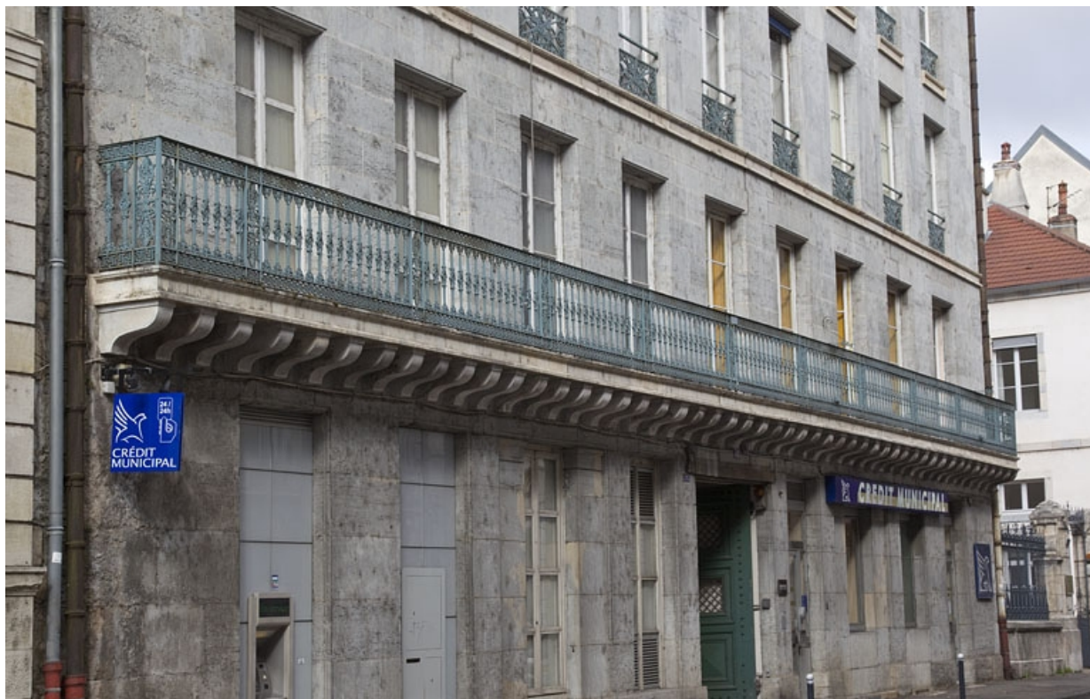
Façade antérieure, premier étage : vue d'ensemble du balcon filant.

25, Besançon, 32 rue Charles Nodier, lieudit : îlot Porteau