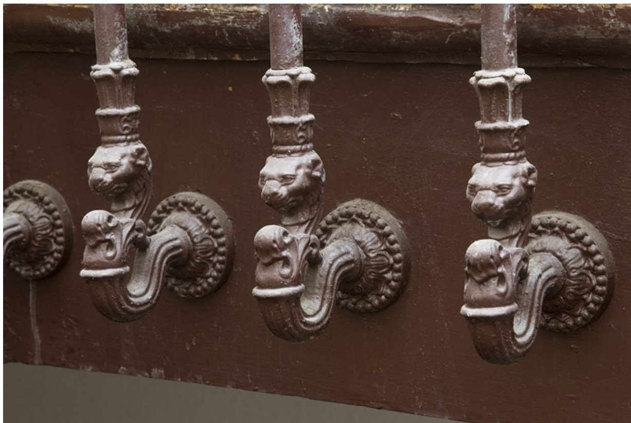
Intérieur, escalier : détail du décor à la base des barreaux de la rampe.

25, Besançon, 32 rue Charles Nodier, lieudit : îlot Porteau