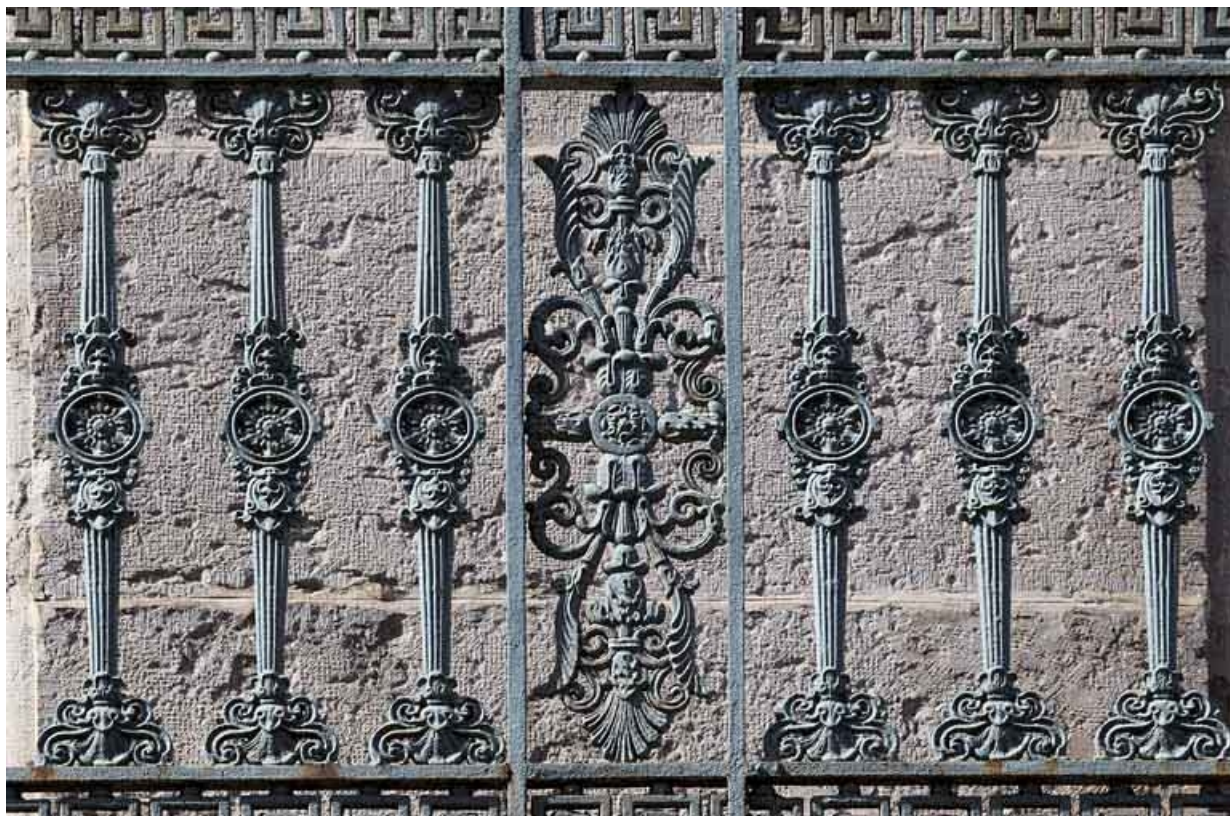
Façade antérieure, balcon filant : détail d'un décor du garde-corps en fonte.

25, Besançon, 32 rue Charles Nodier, lieudit : îlot Porteau