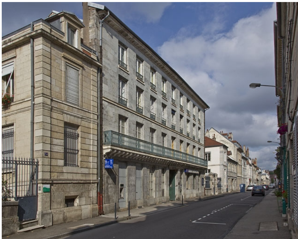
Vue d'ensemble depuis la rue, de trois quarts gauche. 25, Besançon, 32 rue Charles Nodier, lieudit : îlot Porteau