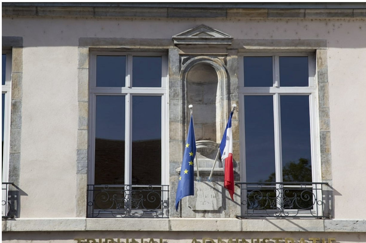
Façade antérieure : détail de la niche, vue rapprochée.

25, Besançon, 30 rue Charles Nodier, lieudit : îlot Porteau