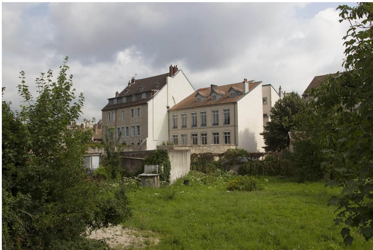
Façade postérieure depuis la parcelle voisine : de trois quarts droit, vue éloignée.

25, Besançon, 30 rue Charles Nodier, lieudit : îlot Porteau