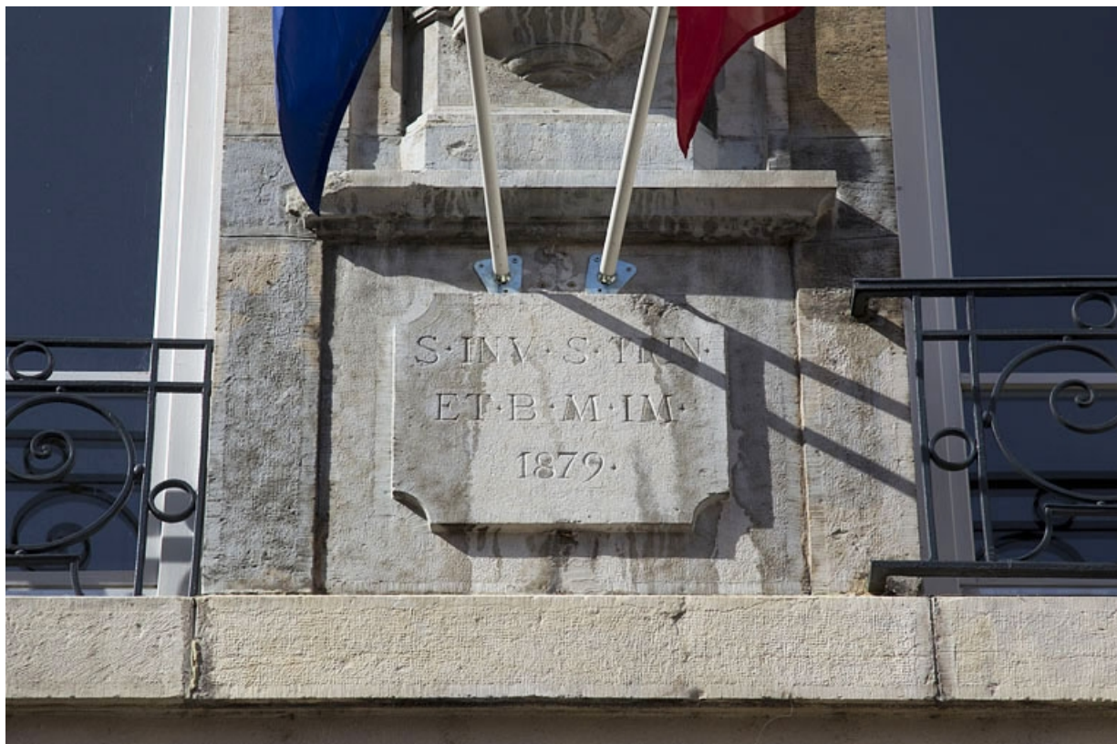
Façade antérieure, niche : détail de l'inscription et de la date.

25, Besançon, 30 rue Charles Nodier, lieudit : îlot Porteau