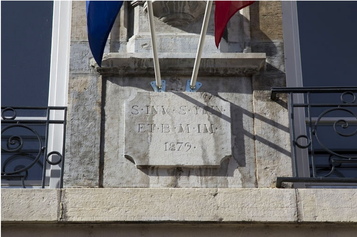
Façade antérieure, niche : détail de l'inscription et de la date.

25, Besançon, 30 rue Charles Nodier, lieudit : îlot Porteau