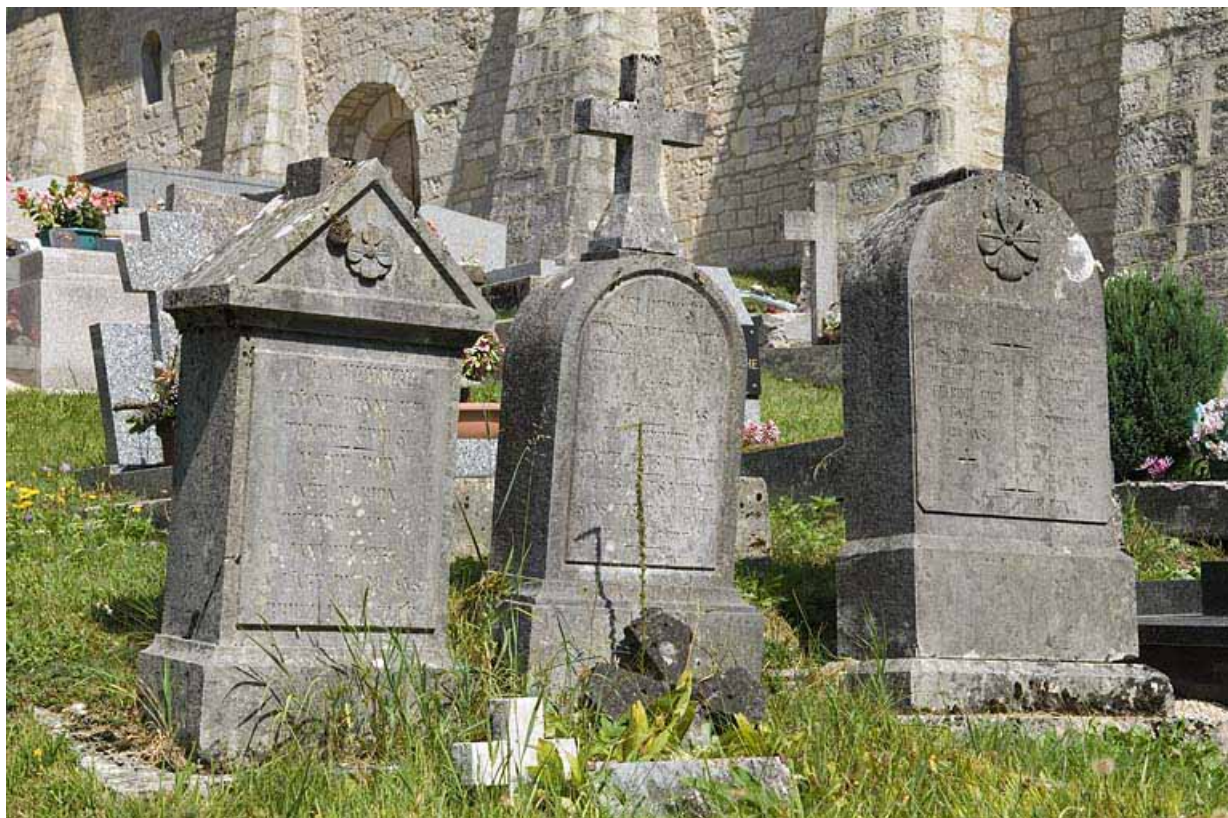
Vue d'ensemble des 5e, 6e et 7e tombeaux.

25, Jougne 7e tombeau, lieudit : la Ferrière