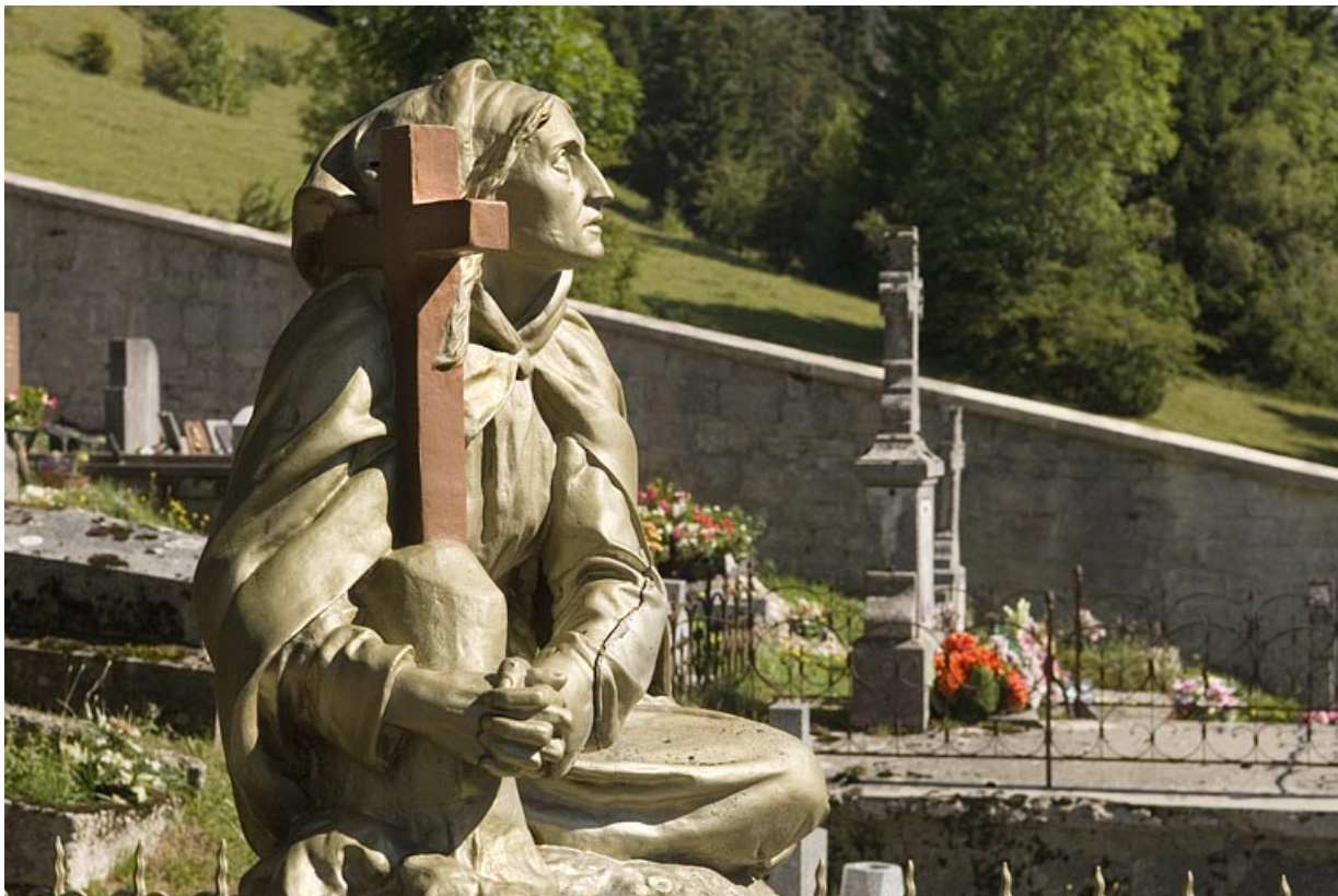
détail : la Vierge, de profil droit.

25, Jougne 36e tombeau, lieudit : la Ferrière