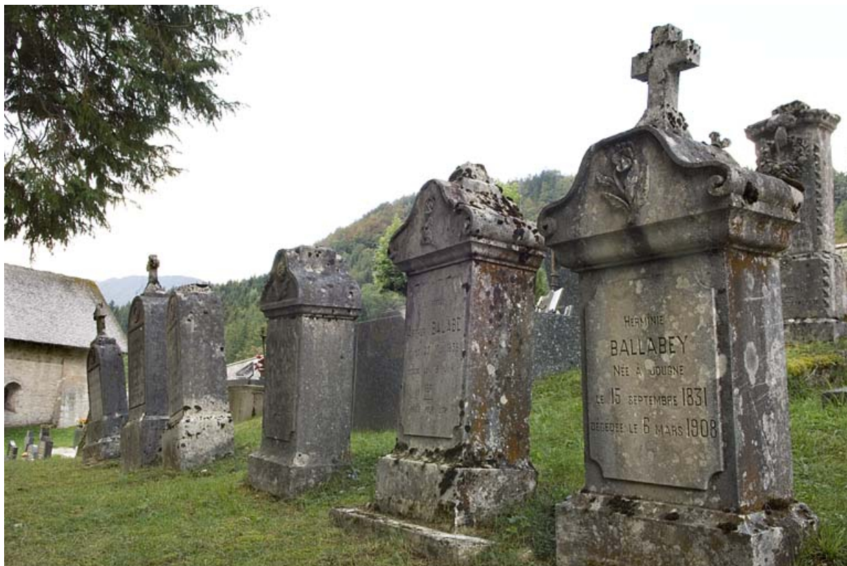
Vue d'ensemble en direction de la chapelle.

25, Jougne 24e tombeau, lieudit : la Ferrière