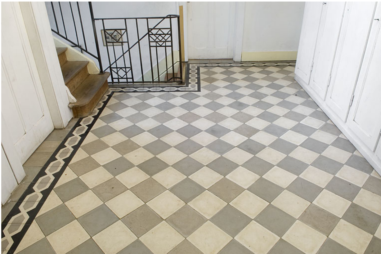
Intérieur : pavement du premier étage de l'aile en retour (1933).