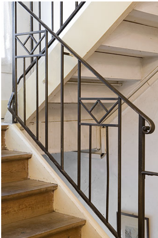
Intérieur : détail de la rampe d'appui de l'escalier menant aux étages de l'aile en retour (1933). 25, Jougne, 32 rue du Faubourg