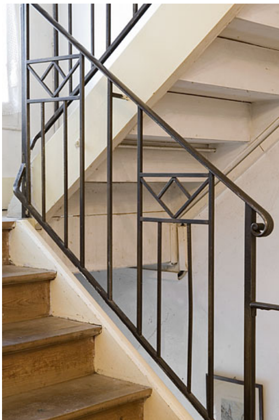
Intérieur : détail de la rampe d'appui de l'escalier menant aux étages de l'aile en retour (1933). 25, Jougne, 32 rue du Faubourg