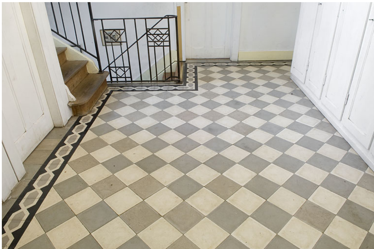
Intérieur : pavement du premier étage de l'aile en retour (1933). 25, Jougne, 32 rue du Faubourg