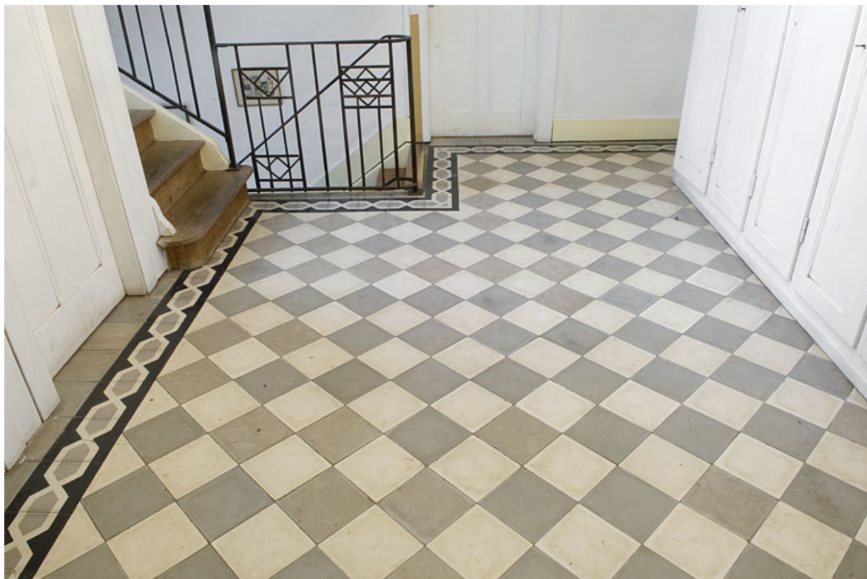
Intérieur : pavement du premier étage de l'aile en retour (1933). 25, Jougue, 32 rue du Faubourg