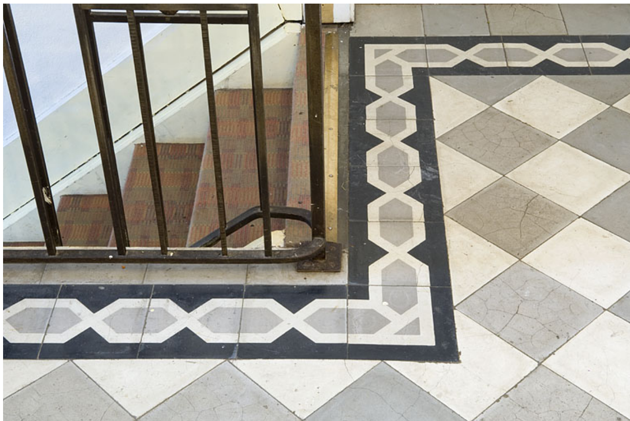
Intérieur : détail du pavement du premier étage de l'aile en retour (1933). 25, Jougne, 32 rue du Faubourg