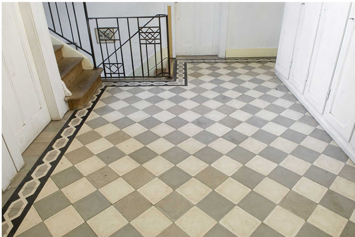
Intérieur : pavement du premier étage de l'aile en retour (1933). 25, Jougne, 32 rue du Faubourg