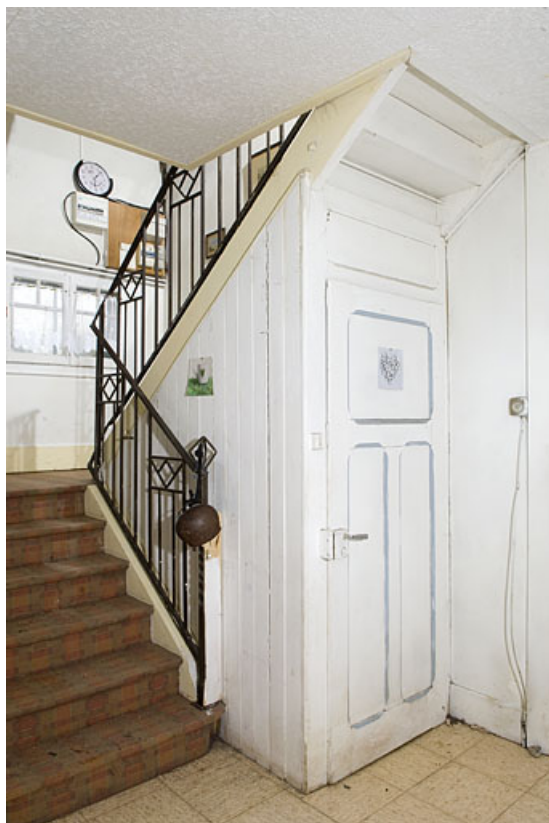
Intérieur : départ de l'escalier conduisant aux étages de l'aile en retour (1933). 25, Jougne, 32 rue du Faubourg