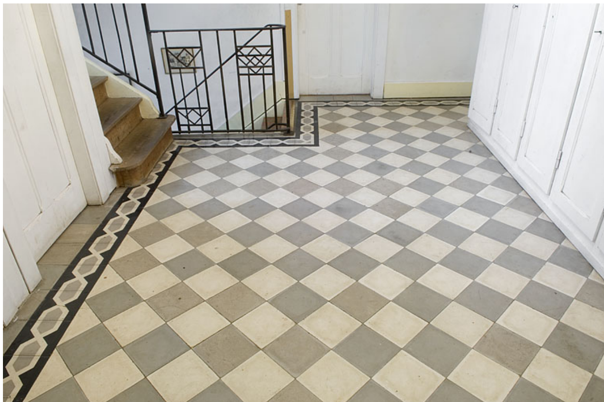
Intérieur : pavement du premier étage de l'aile en retour (1933). 25, Jougne, 32 rue du Faubourg