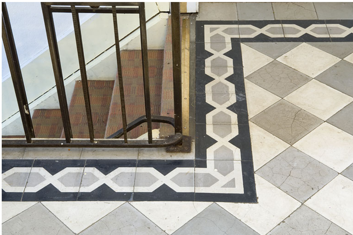
Intérieur : détail du pavement du premier étage de l'aile en retour (1933). 25, Jougne, 32 rue du Faubourg