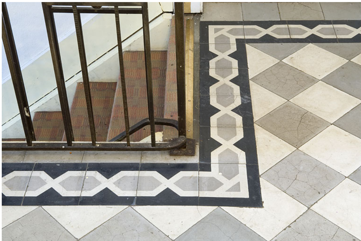
Intérieur : détail du pavement du premier étage de l'aile en retour (1933). 25, Jougne, 32 rue du Faubourg