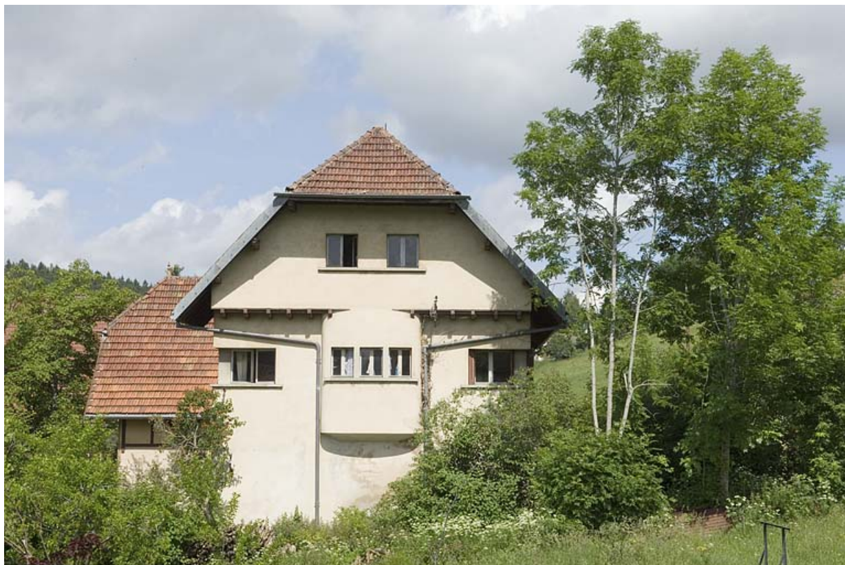
Elévation latérale droite.