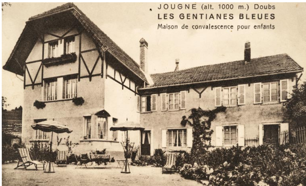
Jougne (alt. 1000 m.) Doubs. Les Gentianes Bleues. Maison de convalescence pour enfants. 25, Jougne, 32 rue du Faubourg