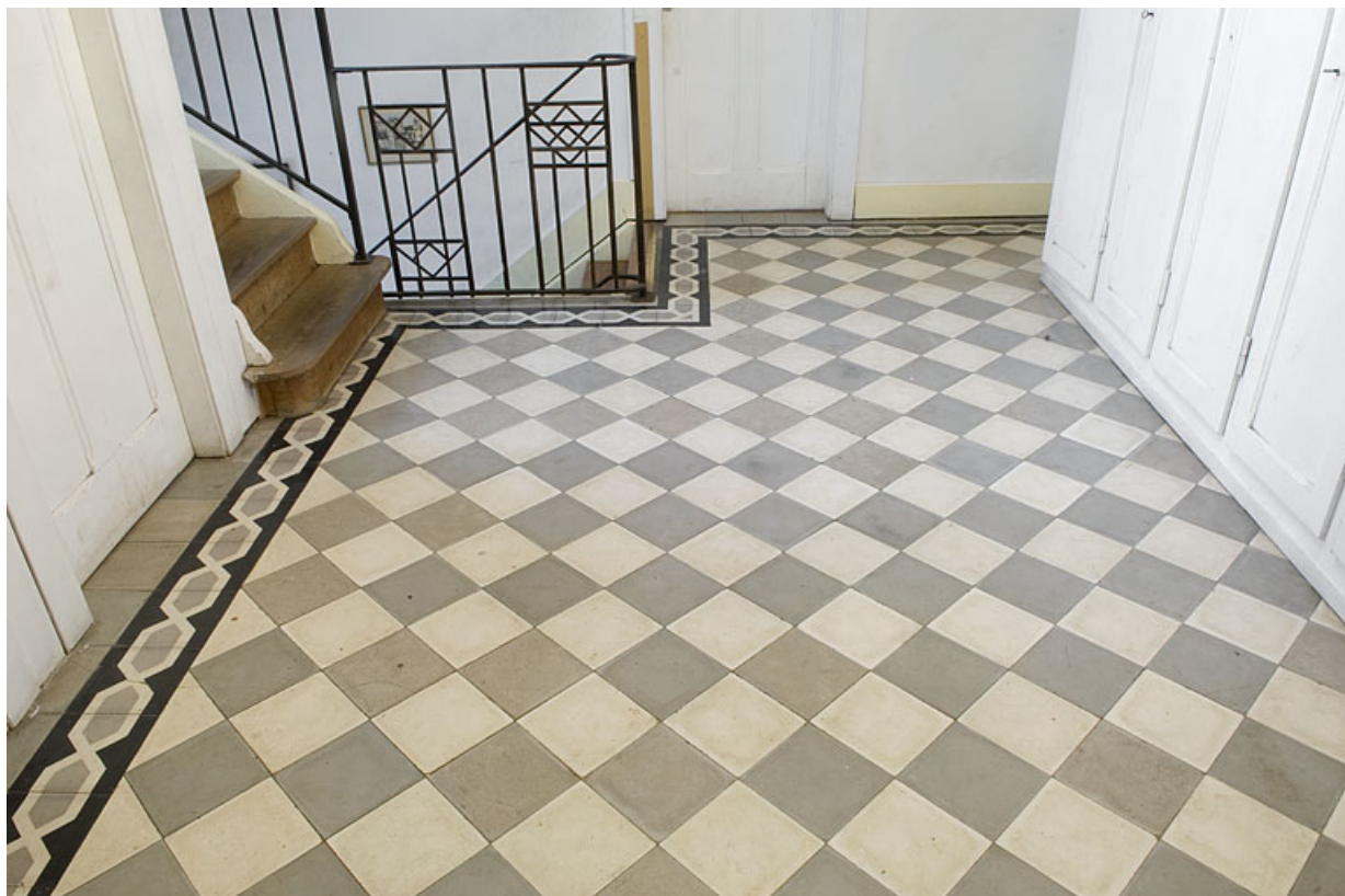
Intérieur : pavement du premier étage de l'aile en retour (1933). 25, Jougue, 32 rue du Faubourg