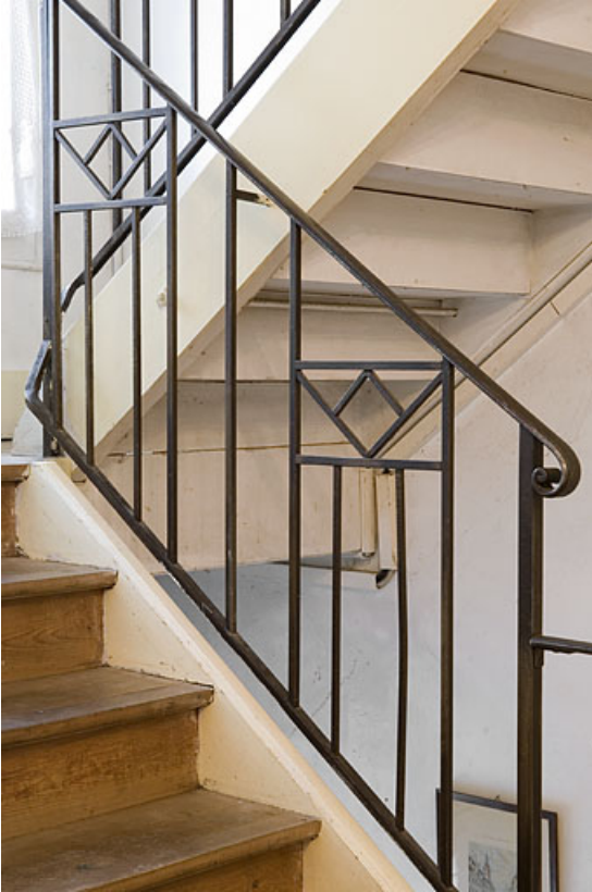
Intérieur : détail de la rampe d'appui de l'escalier menant aux étages de l'aile en retour (1933). 25, Jougne, 32 rue du Faubourg