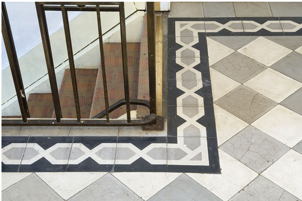
Intérieur : détail du pavement du premier étage de l'aile en retour (1933). 25, Jougne, 32 rue du Faubourg