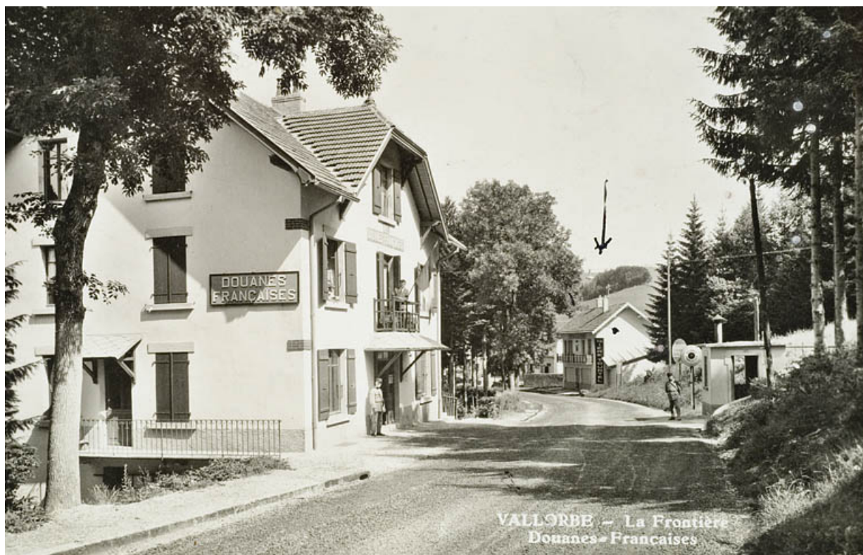
VALLORBE-La Frontière-Douanes Françaises.