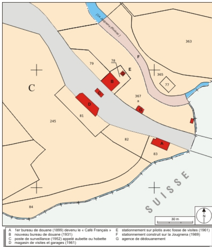
Plan masse et de situation. Extrait du plan cadastral, 2008, section C, échelle 1/1 000. 25, Jougne, lieudit : la Ferrière