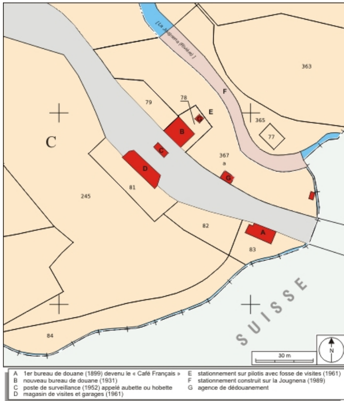
Plan masse et de situation. Extrait du plan cadastral, 2008, section C, échelle 1/1 000. 25, Jougne, lieudit : la Ferrière