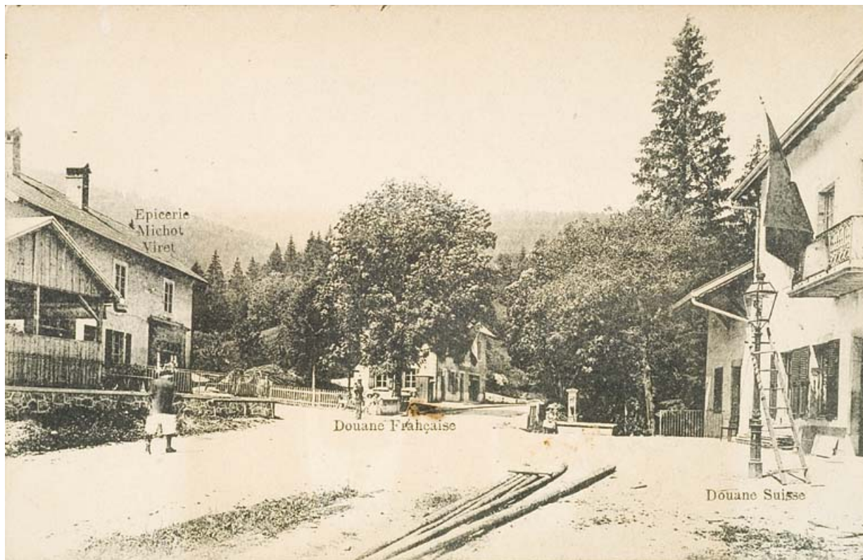
[La douane vue du côté suisse], [1ère moitié 20e siècle]. 25, Jougne, lieudit : la Ferrière