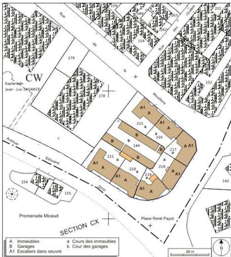
Plan masse et de situation. Extrait du plan cadastral, 1974, section CW. 25, Besançon avenue Edouard Droz, lieudit : îlot Casino