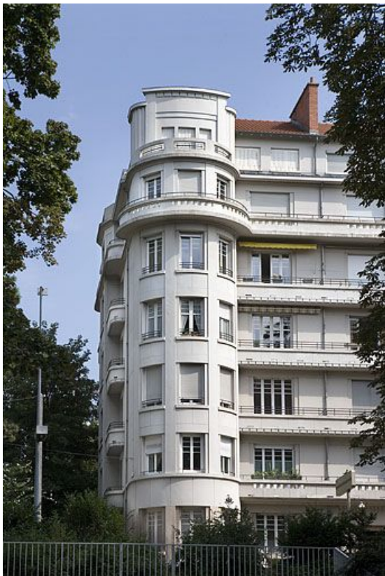
Avant-corps arrondi du côté de l' hôtel Mercure, de face. 25, Besançon avenue Edouard Droz, lieudit : îlot Casino