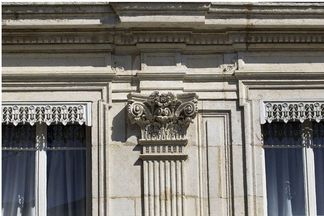
Façade antérieure, décor : détail d'un chapiteau corinthien.

25, Besançon, 12 rue Proudhon, lieudit : îlot Saint-Amour