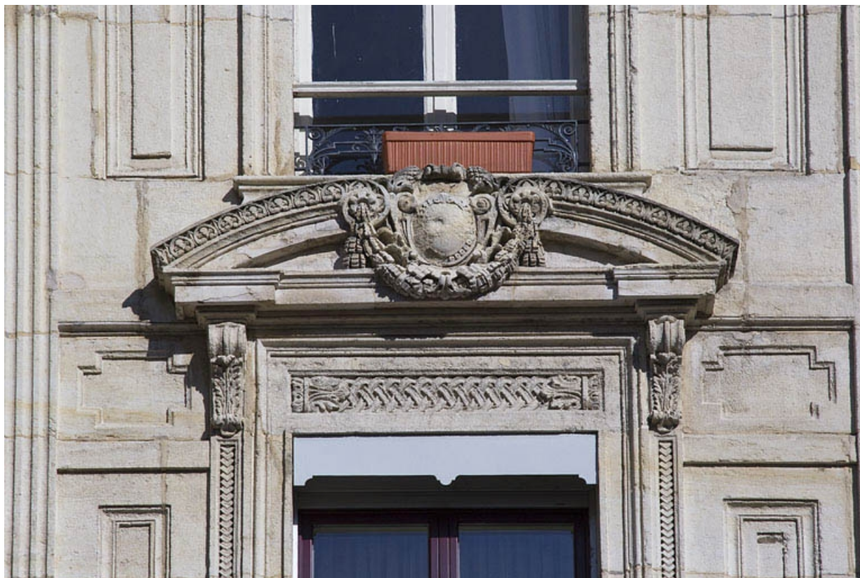
Façade antérieure, angle à pan coupé : détail du fronton cintré ornant la baie du premier étage.

25, Besançon, 12 rue Proudhon, lieudit : îlot Saint-Amour