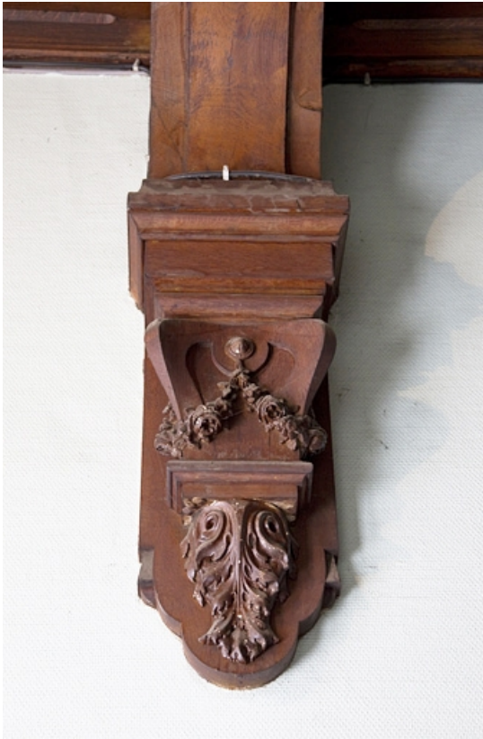
Intérieur, escalier : détail d'une console.

25, Besançon, 19 rue de la République, lieudit : îlot Pierre Bayle