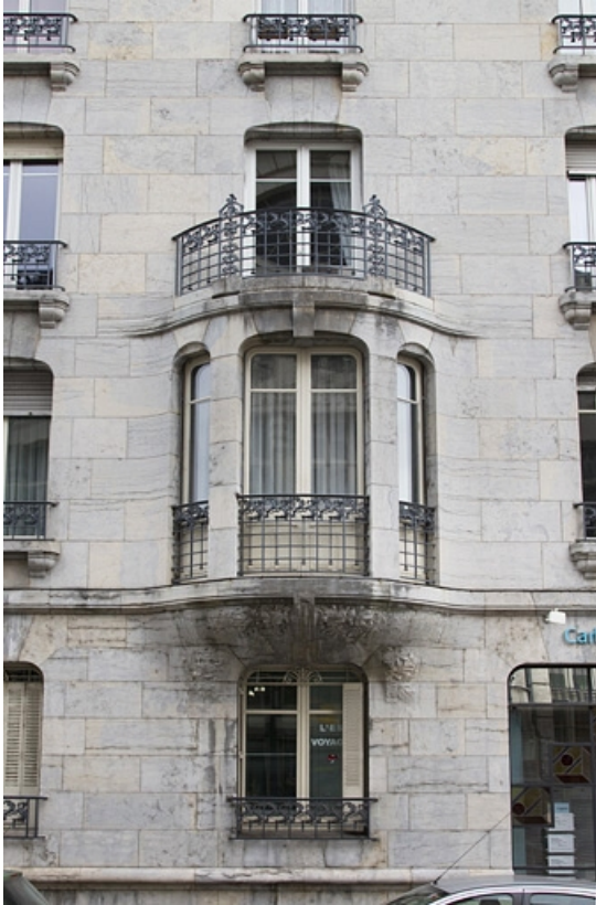
Façade latérale gauche : détail du bow-window.

25, Besançon, 19 rue de la République, lieudit : îlot Pierre Bayle