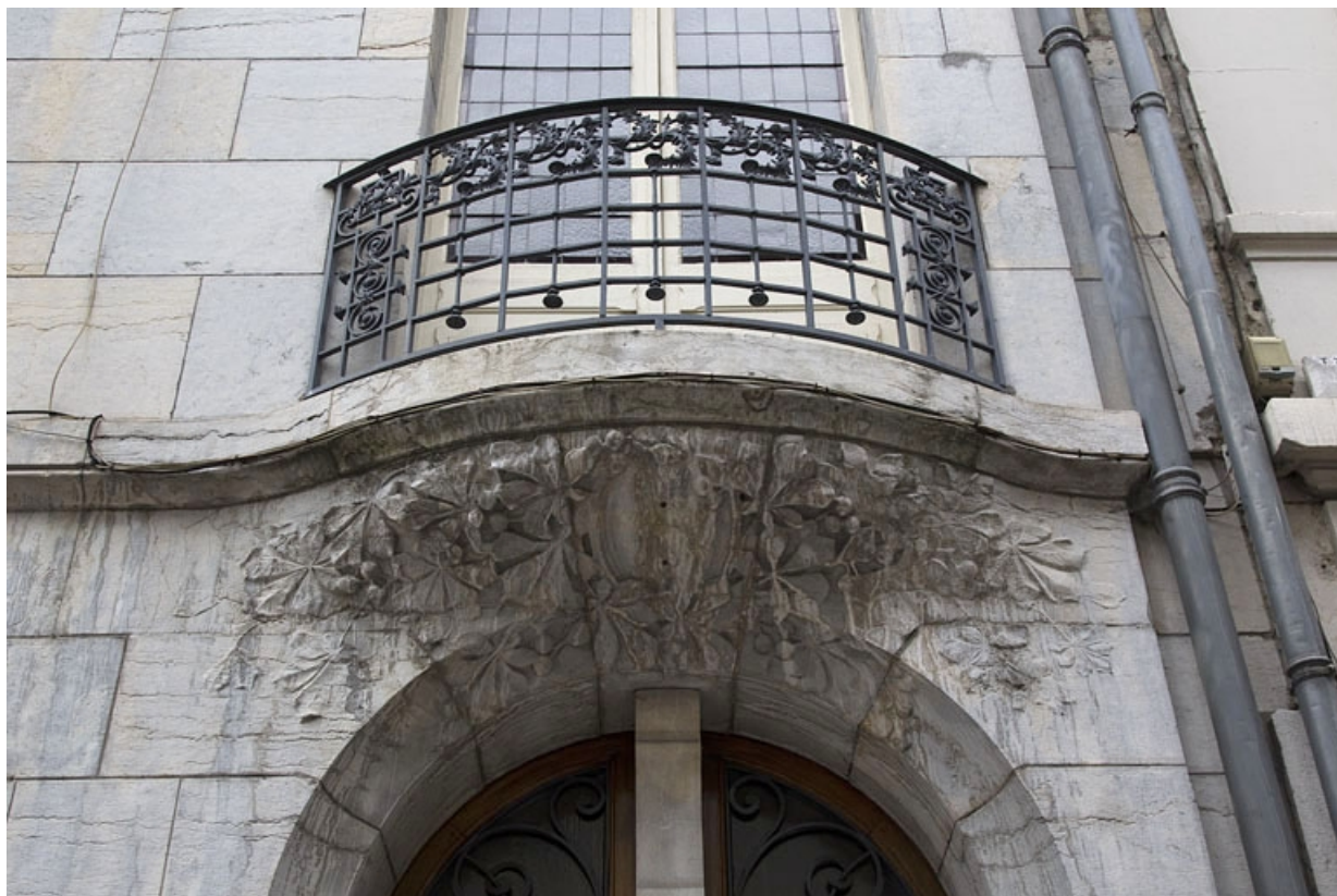
Détail du balcon au-dessus de la porte d'entrée, rue de la République.

25, Besançon, 19 rue de la République, lieudit : îlot Pierre Bayle