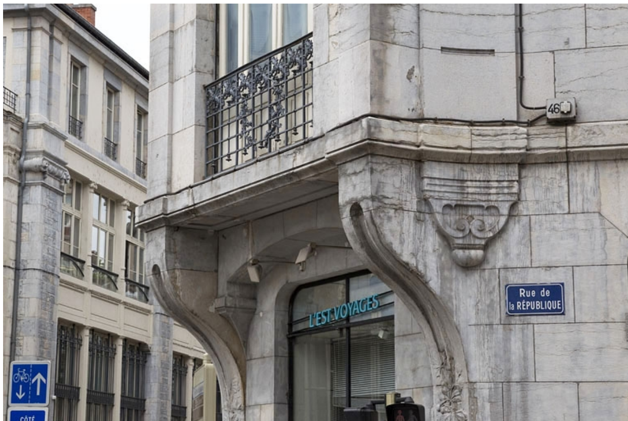
Façade d'angle : détail du rez-de-chaussée.

25, Besançon, 19 rue de la République, lieudit : îlot Pierre Bayle