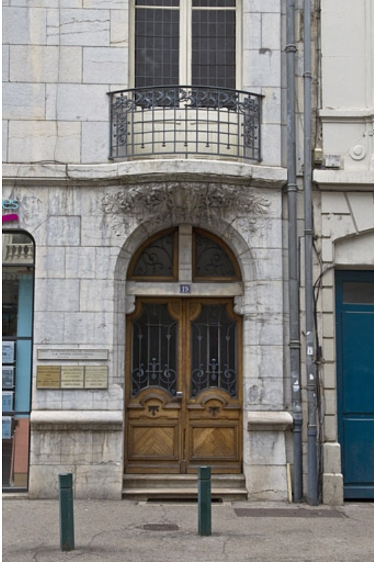
Vue de la porte d'entrée rue de la république.

25, Besançon, 19 rue de la République, lieudit : îlot Pierre Bayle