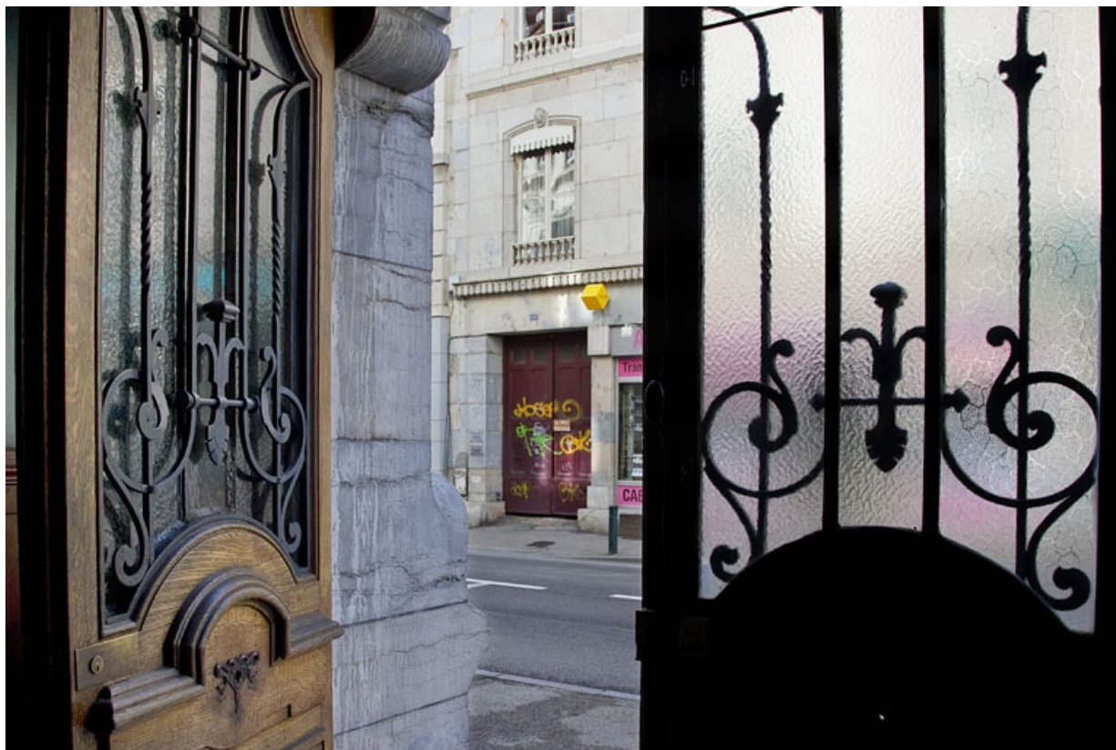
Détail du décor en ferronnerie de la porte d'entrée, depuis l'intérieur.

25, Besançon, 19 rue de la République, lieudit : îlot Pierre Bayle