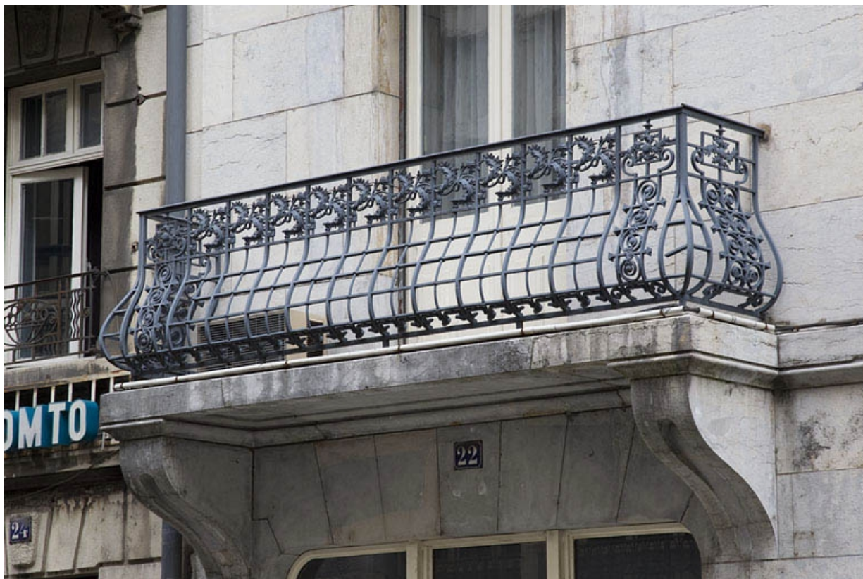
Façade latérale gauche : détail du balcon du premier étage. 25, Besançon, 19 rue de la République, lieudit : îlot Pierre Bayle