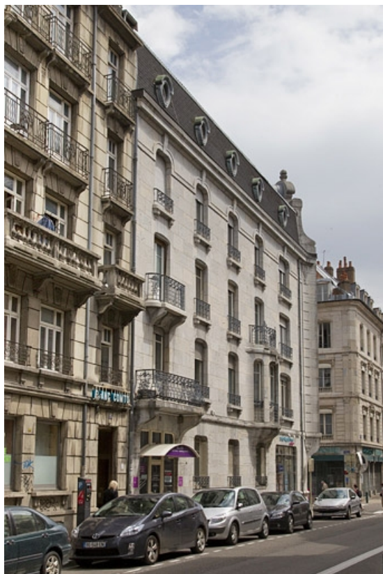
Vue d'ensemble de la façade latérale gauche.

25, Besançon, 19 rue de la République, lieudit : îlot Pierre Bayle