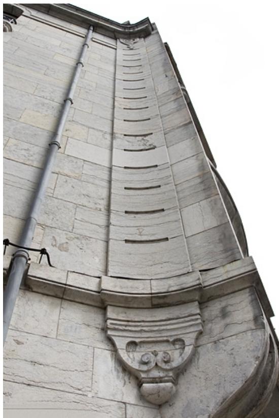
Façade d'angle : détail de la partie latérale gauche.

25, Besançon, 19 rue de la République, lieudit : îlot Pierre Bayle