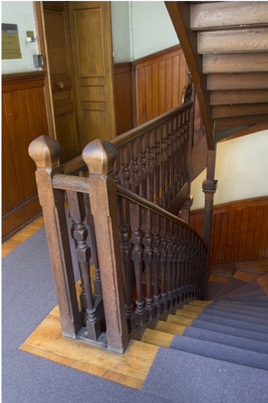
Intérieur, escalier : vue d'ensemble.

25, Besançon, 19 rue de la République, lieudit : îlot Pierre Bayle