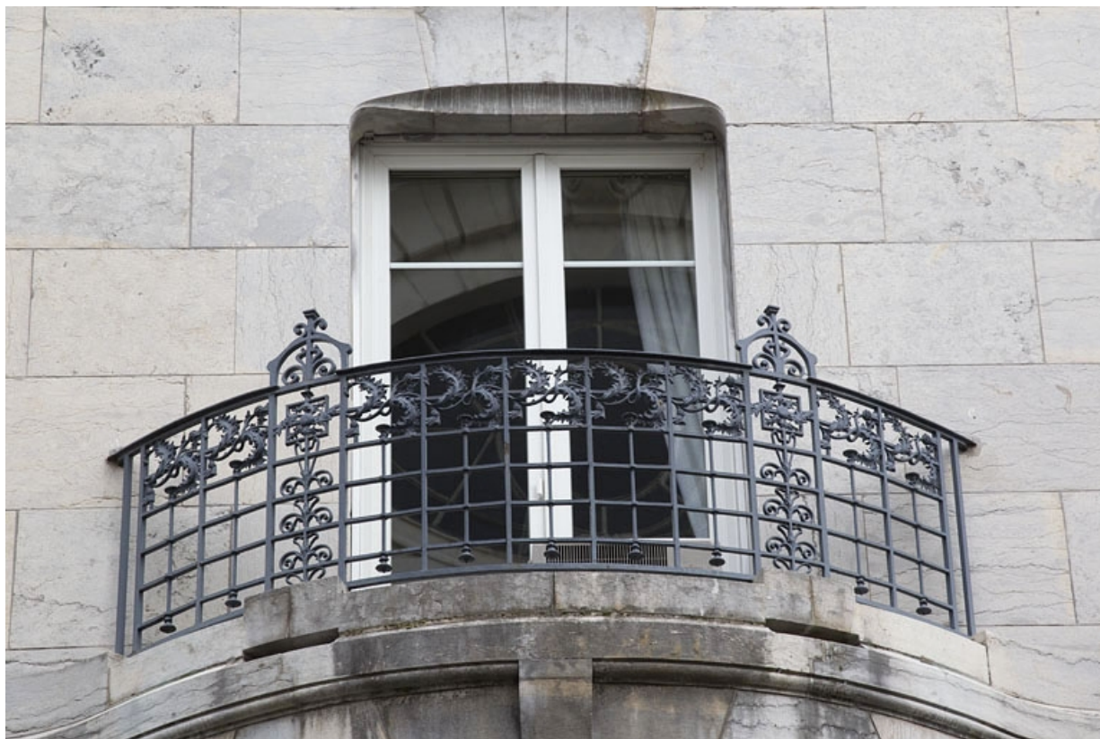
Façade latérale gauche : détail du balcon du bow-window. 25, Besançon, 19 rue de la République, lieudit : îlot Pierre Bayle