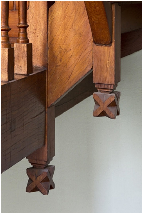
Intérieur, escalier : détail de la menuiserie.

25, Besançon, 19 rue de la République, lieudit : îlot Pierre Bayle