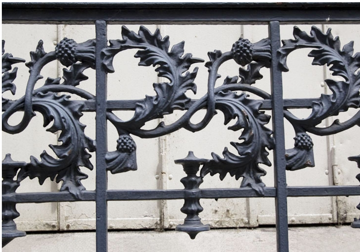
Façade latérale gauche : détail du décor du balcon en ferronnerie du premier étage. 25, Besançon, 19 rue de la République, lieudit : îlot Pierre Bayle