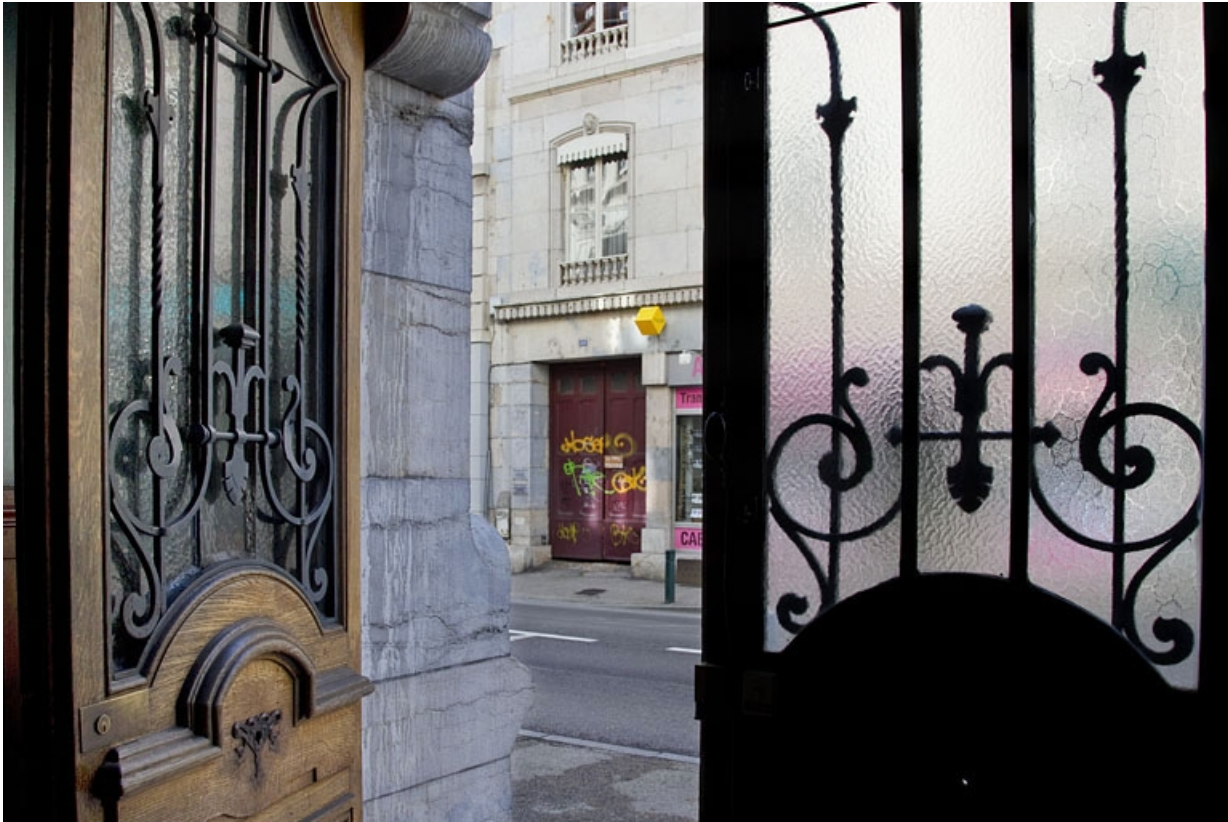
Détail du décor en ferronnerie de la porte d'entrée, depuis l'intérieur.

25, Besançon, 19 rue de la République, lieudit : îlot Pierre Bayle