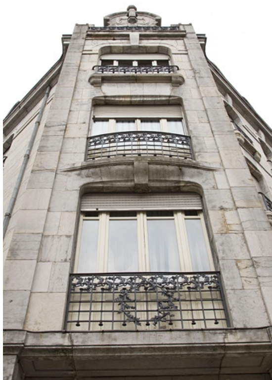
Détail de l'angle à partir du premier étage.

25, Besançon, 19 rue de la République, lieudit : îlot Pierre Bayle