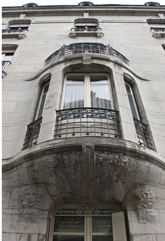
Façade latérale gauche : détail du bow-window en contre-plongée.

25, Besançon, 19 rue de la République, lieudit : îlot Pierre Bayle