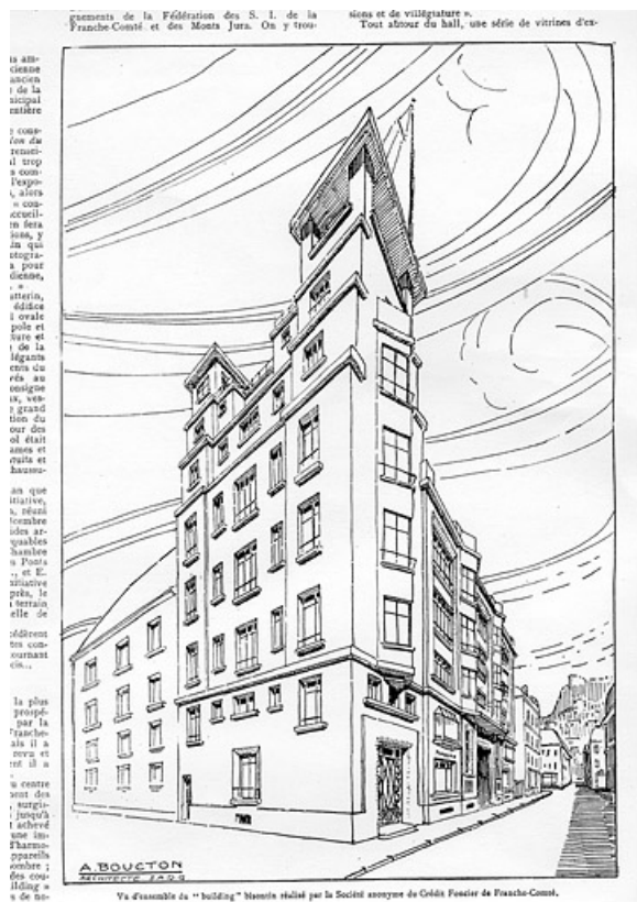
Dessin de la façade latérale gauche de l'immeuble. 25, Besançon, 26 rue Proudhon, lieudit : îlot Pierre Bayle