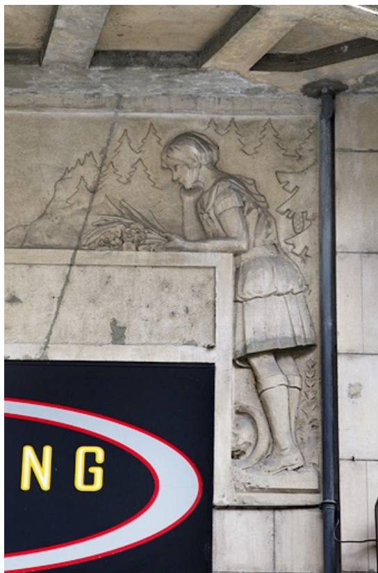
Détail du décor de l'entrée en bas-relief : la jeune fille.

25, Besançon, 26 rue Proudhon, lieudit : îlot Pierre Bayle