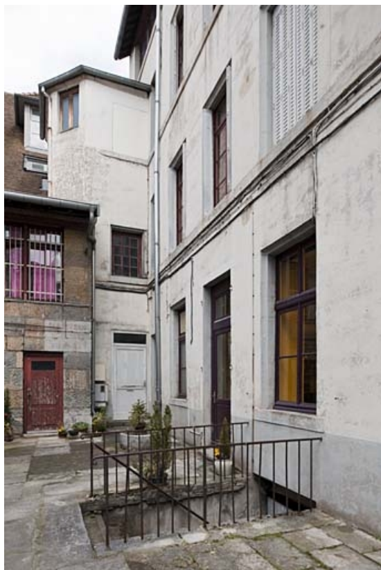
Détail de la façade postérieure de l'immeuble, partie gauche.

25, Besançon, 49 rue Bersot, lieudit : îlot Lorraine