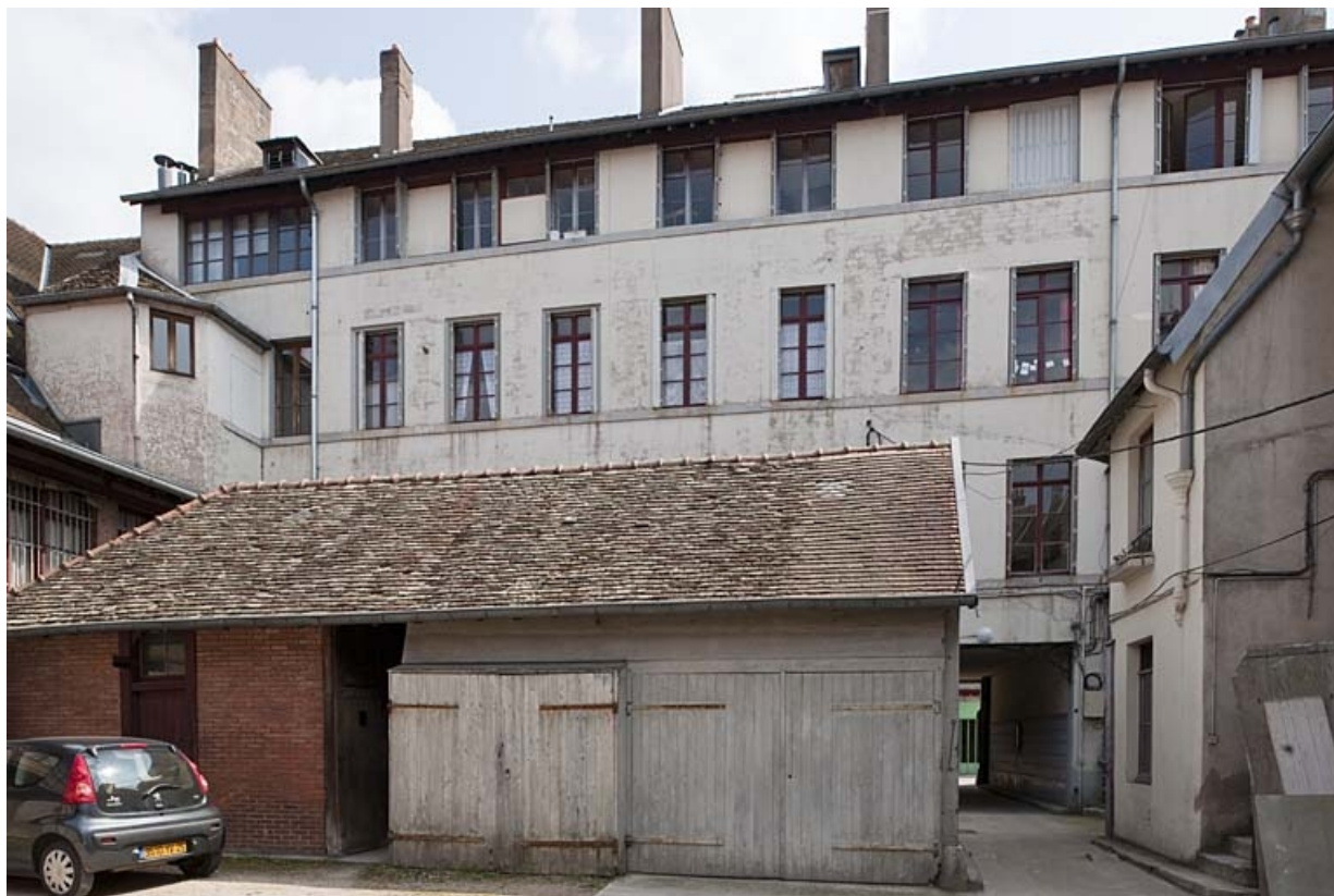
Façade postérieure de l'immeuble depuis la cour.

25, Besançon, 49 rue Bersot, lieudit : îlot Lorraine