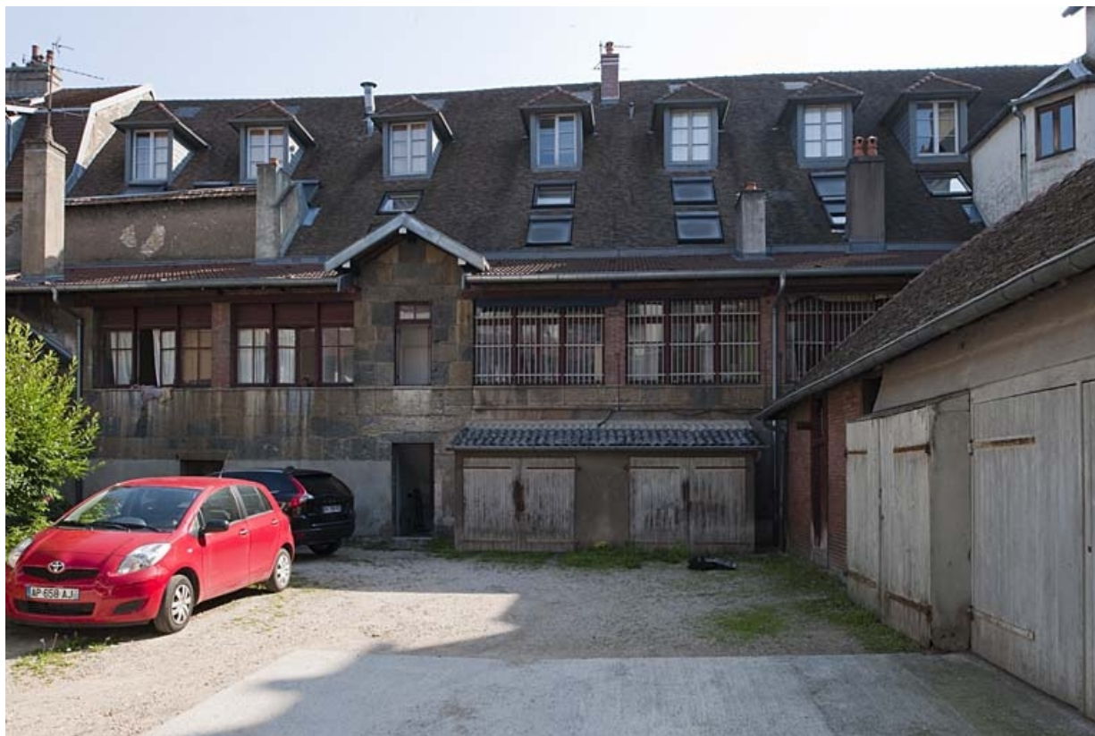
Vue d'ensemble des ateliers à droite de la cour.

25, Besançon, 49 rue Bersot, lieudit : îlot Lorraine