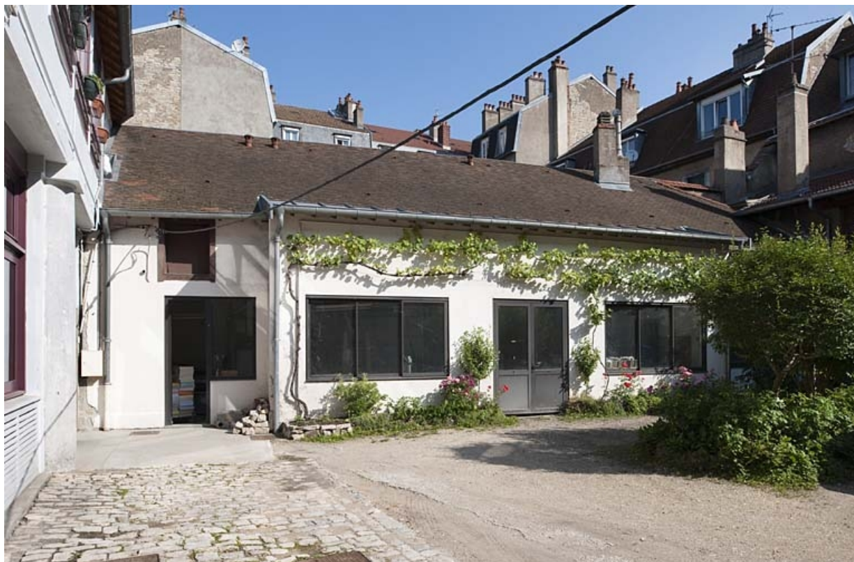
Vue d'ensemble de l'atelier d'imprimerie au fond de la cour.

25, Besançon, 49 rue Bersot, lieudit : îlot Lorraine