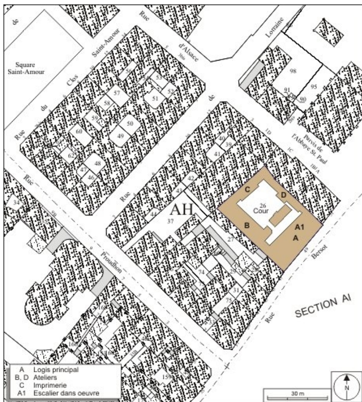
Plan masse et de situation. Extrait du plan cadastral, 1974, section AH. 25, Besançon, 49 rue Bersot, lieudit : îlot Lorraine