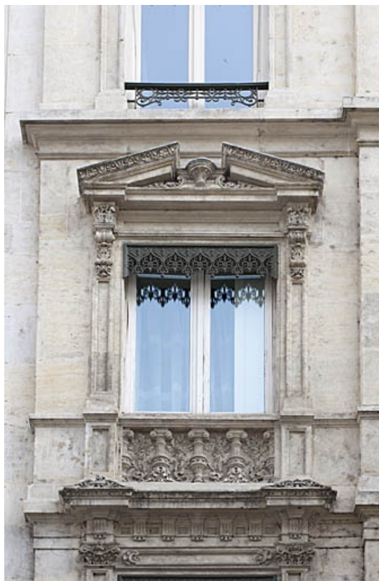
Façade antérieure : détail d'une fenêtre du deuxième étage.

25, Besançon, 4 rue de Lorraine, lieudit : îlot Lorraine