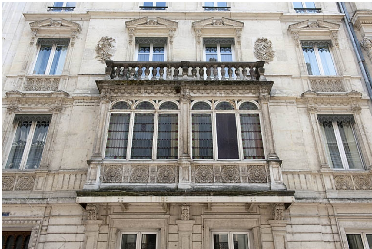
Façade antérieure : détail du bow-window de face.

25, Besançon, 4 rue de Lorraine, lieudit : îlot Lorraine