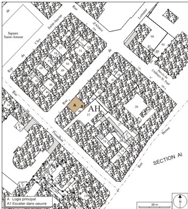
Plan masse et de situation. Extrait du plan cadastral, 1974, section AH. 25, Besançon, 4 rue de Lorraine, lieudit : îlot Lorraine