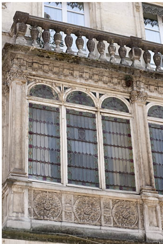
Façade antérieure : détail de la partie gauche du bow-window.

25, Besançon, 4 rue de Lorraine, lieudit : îlot Lorraine