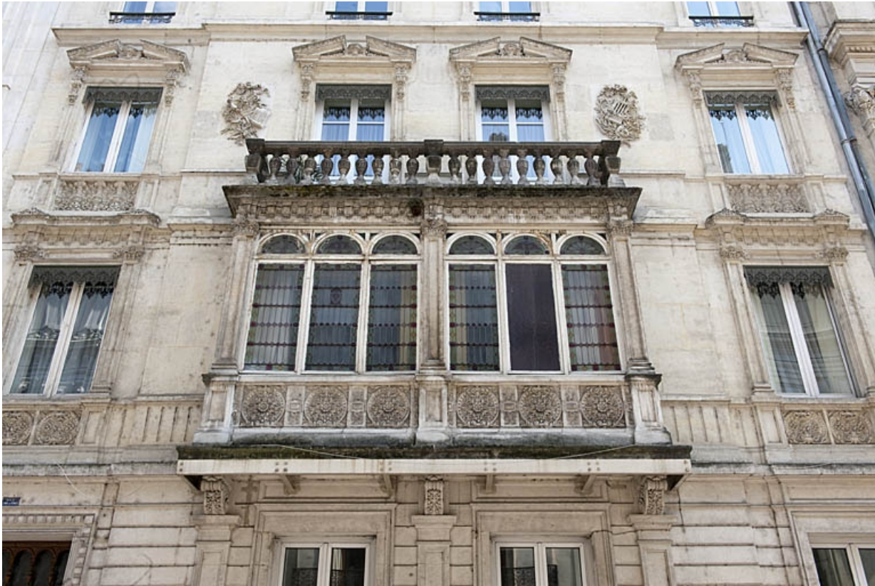
Façade antérieure : détail du bow-window de face.

25, Besançon, 4 rue de Lorraine, lieudit : îlot Lorraine