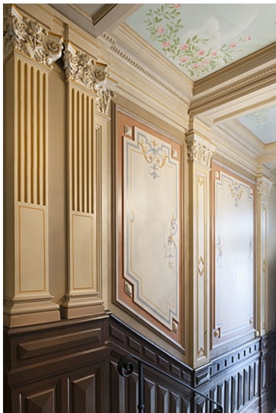
Détail du décor d'un mur de l'entrée scandé par des pilastres.

25, Besançon, 4 rue de Lorraine, lieudit : îlot Lorraine