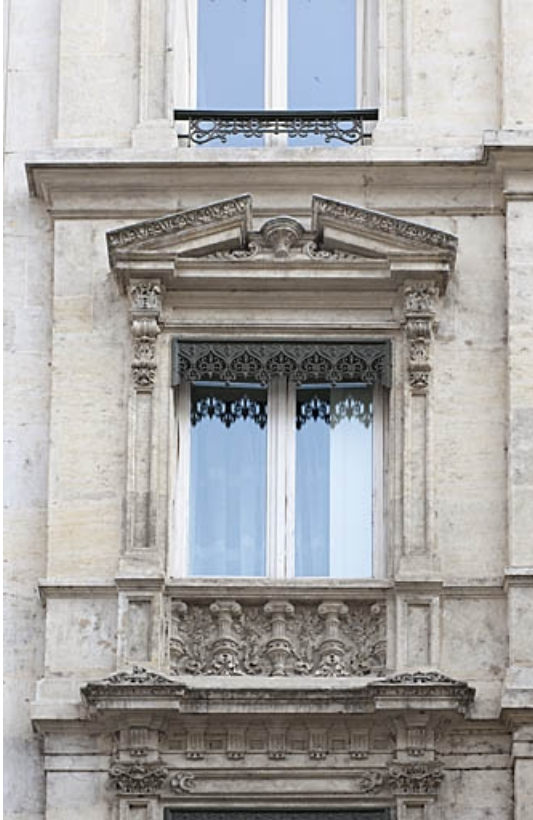
Façade antérieure : détail d'une fenêtre du deuxième étage.

25, Besançon, 4 rue de Lorraine, lieudit : îlot Lorraine