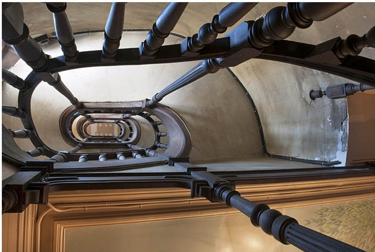
Détail de l'escalier en contre-plongée depuis le rez-de-chaussée.

25, Besançon, 4 rue de Lorraine, lieudit : îlot Lorraine