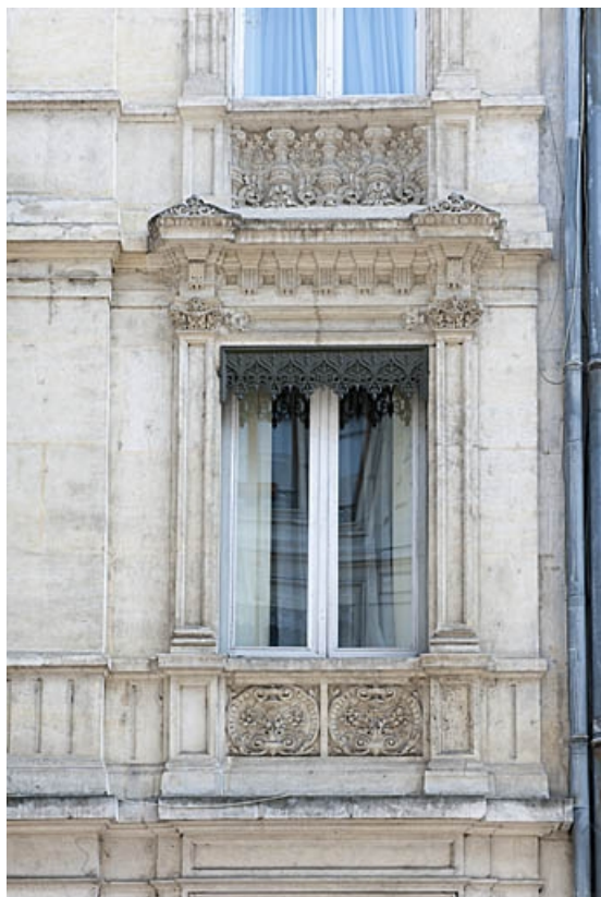
Façade antérieure : détail d'une fenêtre du premier étage.

25, Besançon, 4 rue de Lorraine, lieudit : îlot Lorraine