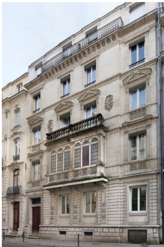
Façade antérieure : vue d'ensemble de trois quarts droit.

25, Besançon, 4 rue de Lorraine, lieudit : îlot Lorraine