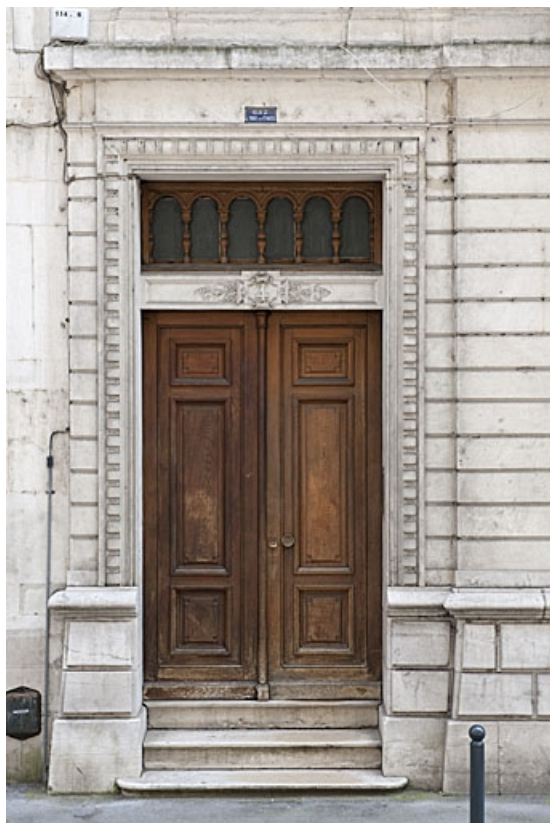
Façade antérieure : détail de la porte d'entrée.

25, Besançon, 4 rue de Lorraine, lieudit : îlot Lorraine