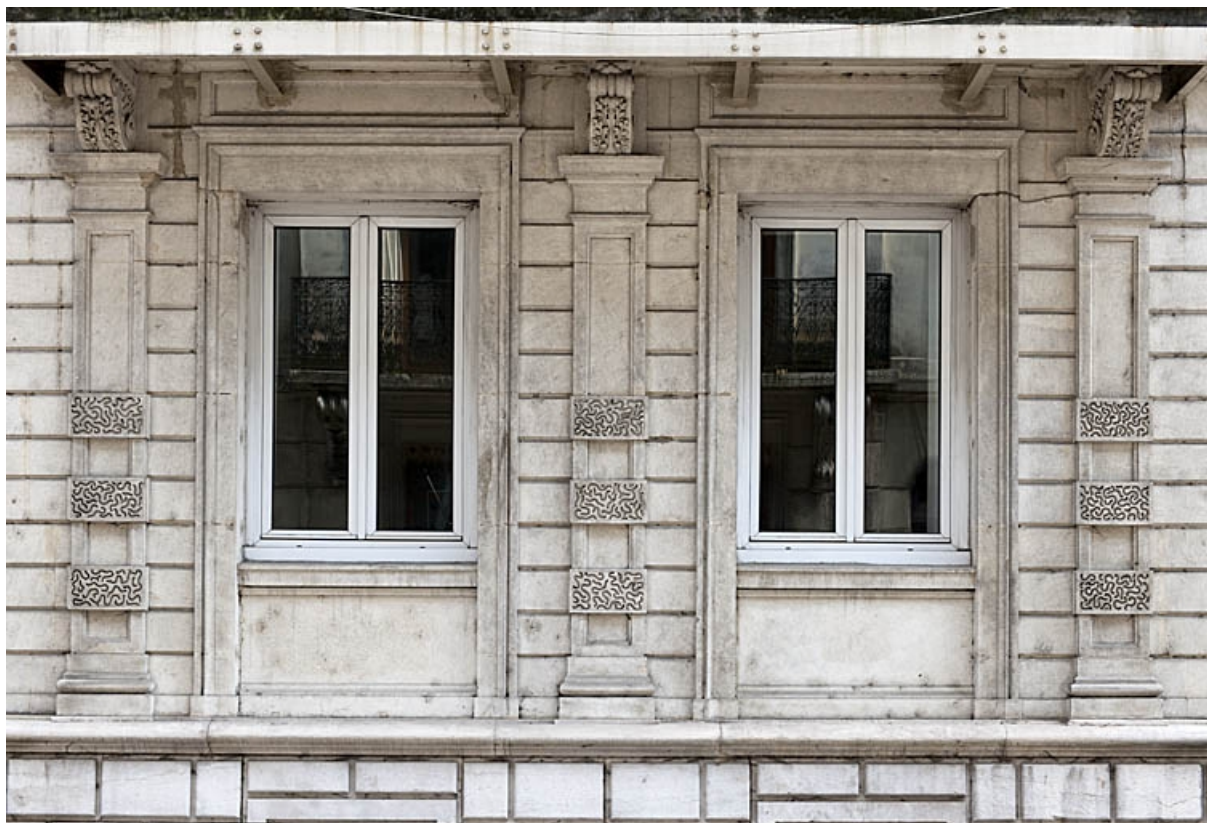
Façade antérieure : détail de deux fenêtres du rez-de-chaussée.

25, Besançon, 4 rue de Lorraine, lieudit : îlot Lorraine