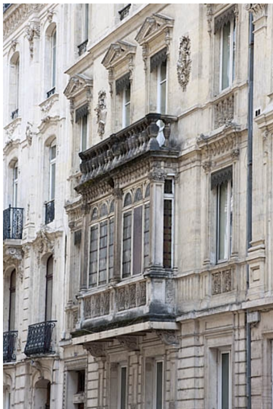
Façade antérieure : détail du bow-window de trois quarts droit.

25, Besançon, 4 rue de Lorraine, lieudit : îlot Lorraine