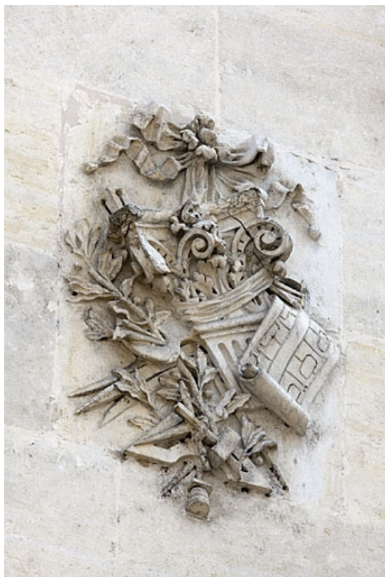
Façade antérieure : détail de l'amas d'objets représentant le métier d'architecte.

25, Besançon, 4 rue de Lorraine, lieudit : îlot Lorraine