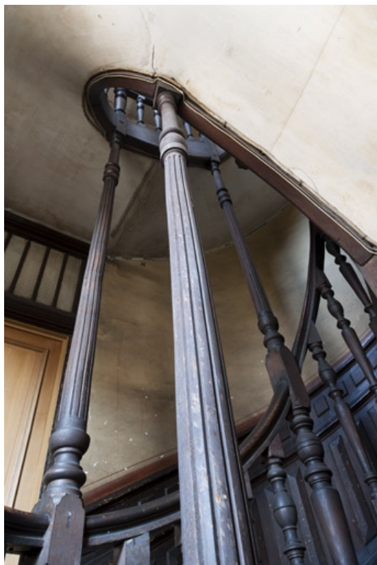
Détail des montants de l'escalier.

25, Besançon, 4 rue de Lorraine, lieudit : îlot Lorraine