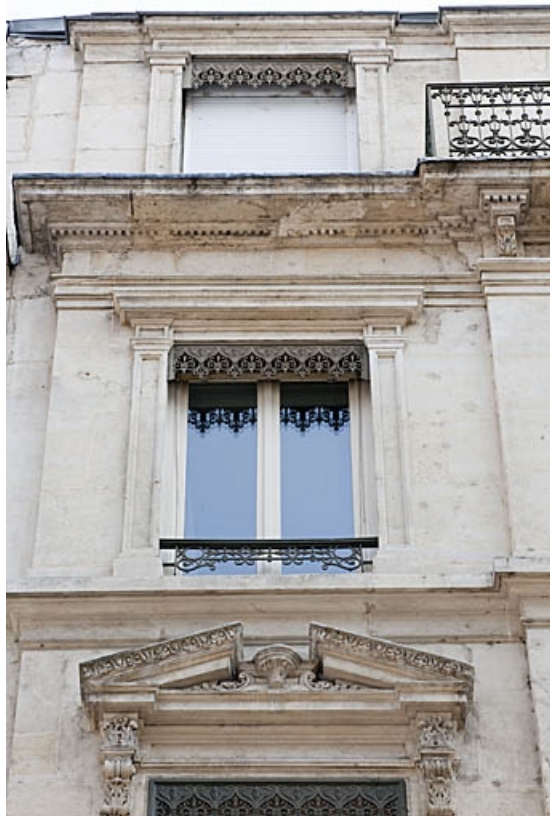
Façade antérieure : détail d'une fenêtre du troisième étage.

25, Besançon, 4 rue de Lorraine, lieudit : îlot Lorraine