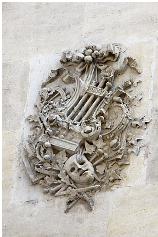
Façade antérieure : détail de l'amas d'objets avec des instruments de musique. 25, Besançon, 4 rue de Lorraine, lieudit : îlot Lorraine