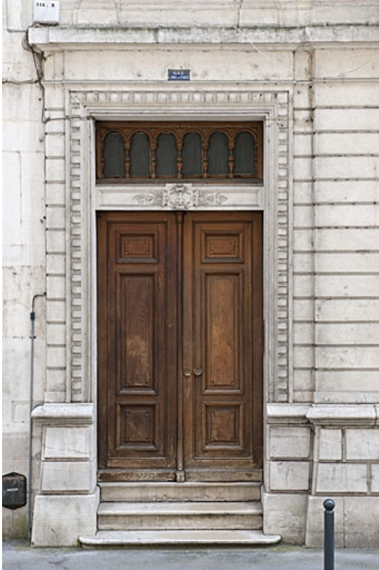
Façade antérieure : détail de la porte d'entrée.

25, Besançon, 4 rue de Lorraine, lieudit : îlot Lorraine