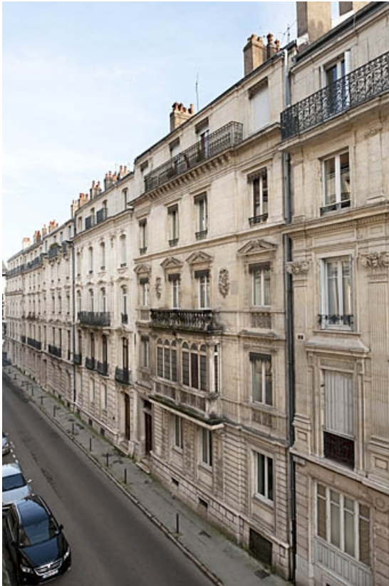
Vue d'ensemble de l'immeuble de trois quarts droit. 25, Besançon, 4 rue de Lorraine, lieudit : îlot Lorraine