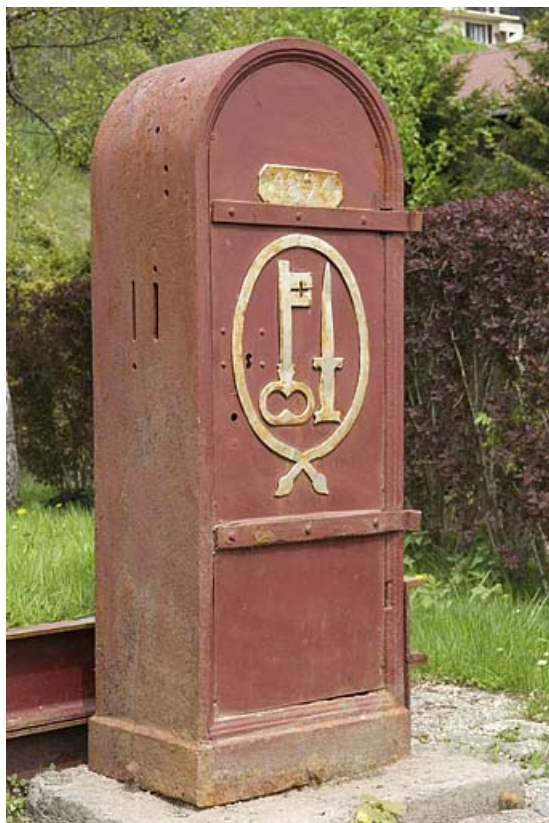
Détail : la borne fontaine portant les armoiries de la cité et la date 1894. 25, Jougne