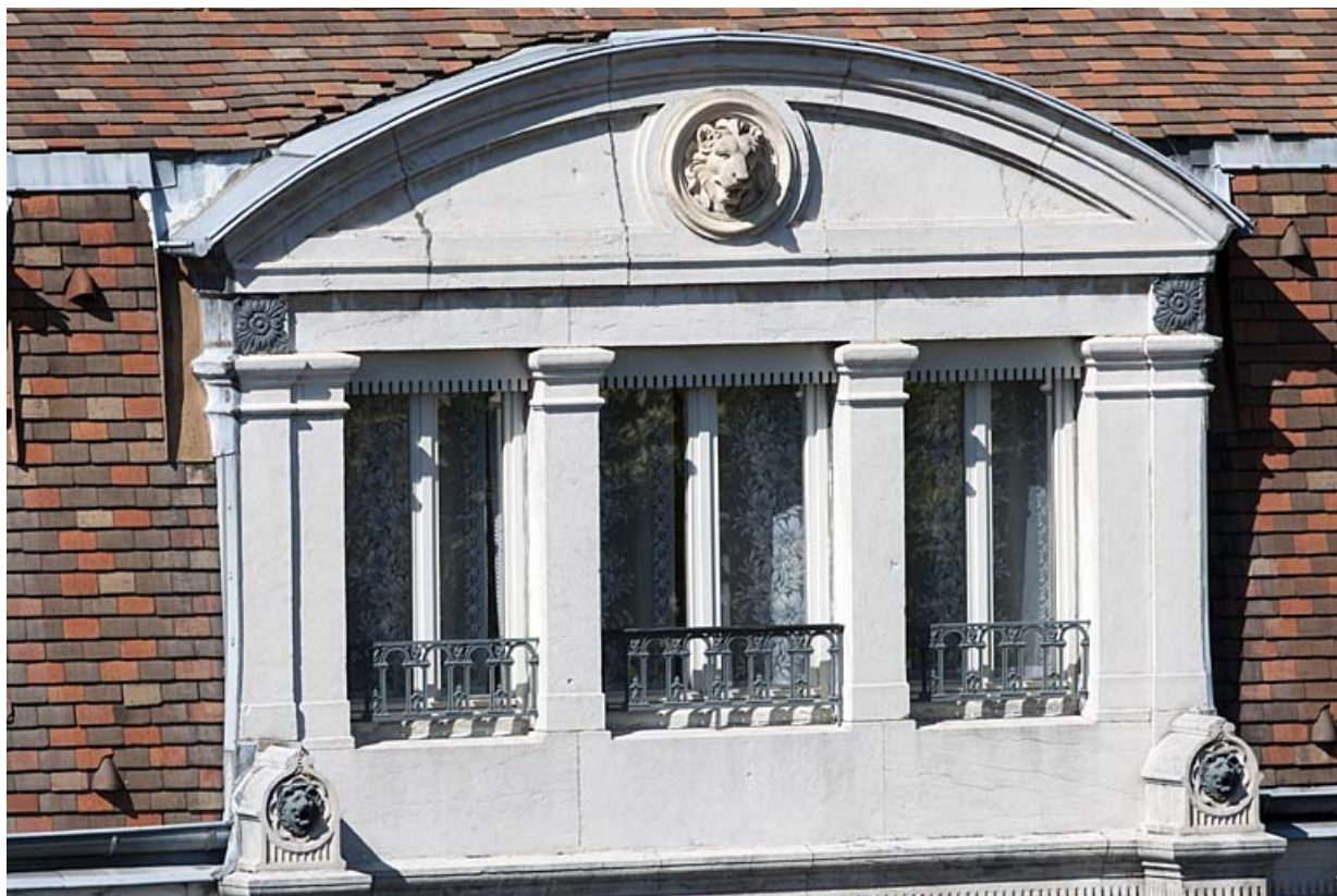
Façade sur rue : détail de la baie centrale du comble.

25, Besançon, 11 rue Gustave Courbet, lieudit : îlot Courbet