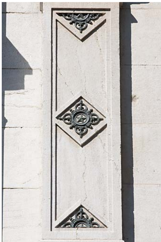
Façade sur rue : détail du décor d'un pilastre du deuxième étage.

25, Besançon, 11 rue Gustave Courbet, lieudit : îlot Courbet