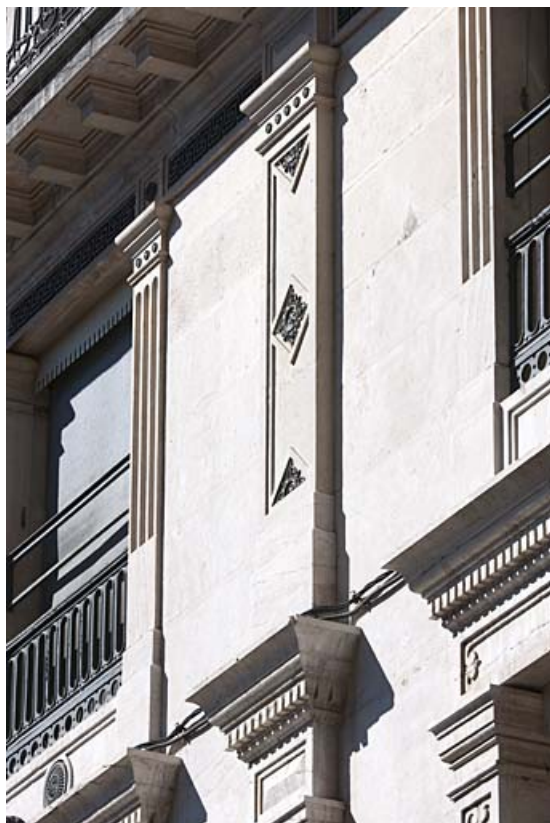
Façade sur rue : détail du décor d'un montant de fenêtre et d'un pilastre du deuxième étage.

25, Besançon, 11 rue Gustave Courbet, lieudit : îlot Courbet