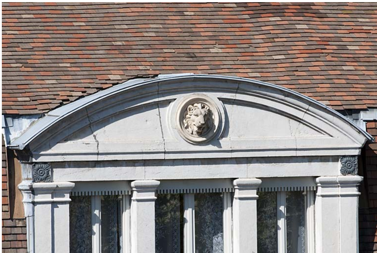
Façade sur rue : détail du fronton cintré de la baie centrale du comble décoré d'une tête de lion.

25, Besançon, 11 rue Gustave Courbet, lieudit : îlot Courbet