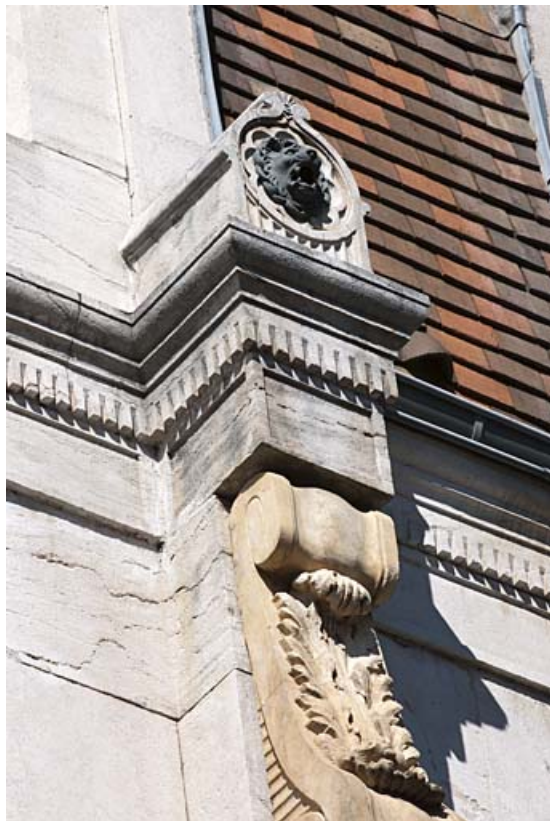
Façade sur rue : détail de la tête de lion à gauche de la baie centrale du comble. 25, Besançon, 11 rue Gustave Courbet, lieudit : îlot Courbet