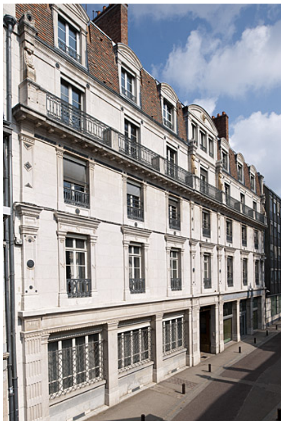
Vue d'ensemble depuis la rue de trois quarts gauche. 25, Besançon