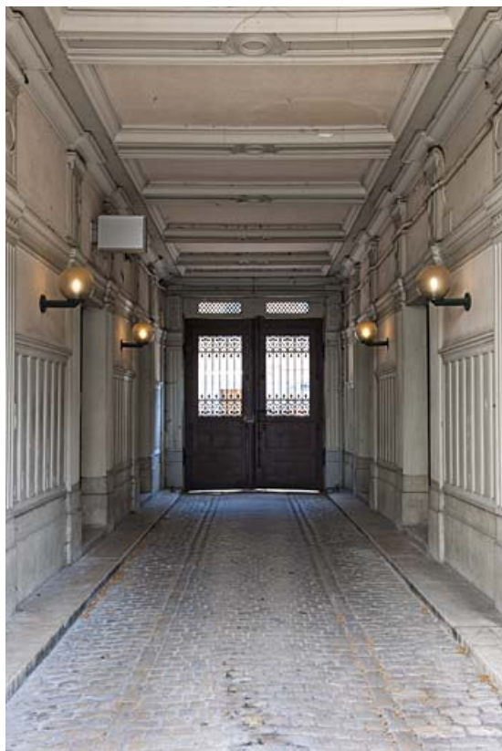
Détail du passage cocher depuis l'entrée de la cour.

25, Besançon, 11 rue Gustave Courbet, lieudit : îlot Courbet