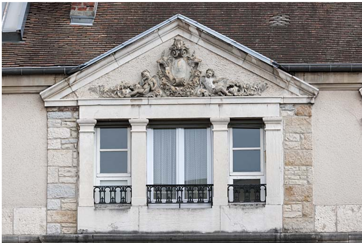
Façade postérieure : détail de la baie en triplet surmontée d'un fronton triangulaire.

25, Besançon, 11 rue Gustave Courbet, lieudit : îlot Courbet