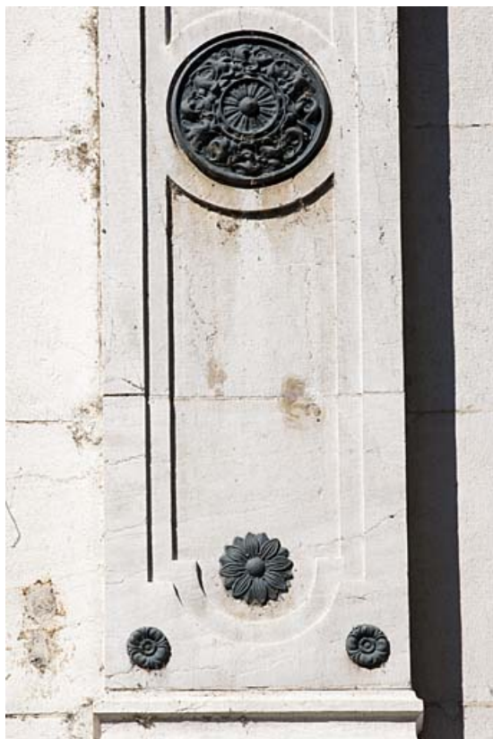
Façade sur rue : détail du décor d'un pilastre du premier étage.

25, Besançon, 11 rue Gustave Courbet, lieudit : îlot Courbet