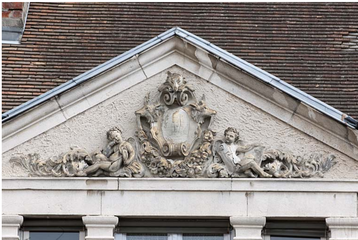
Façade postérieure : détail des sculptures dans le fronton triangulaire surmontant la baie en triplet.

25, Besançon, 11 rue Gustave Courbet, lieudit : îlot Courbet