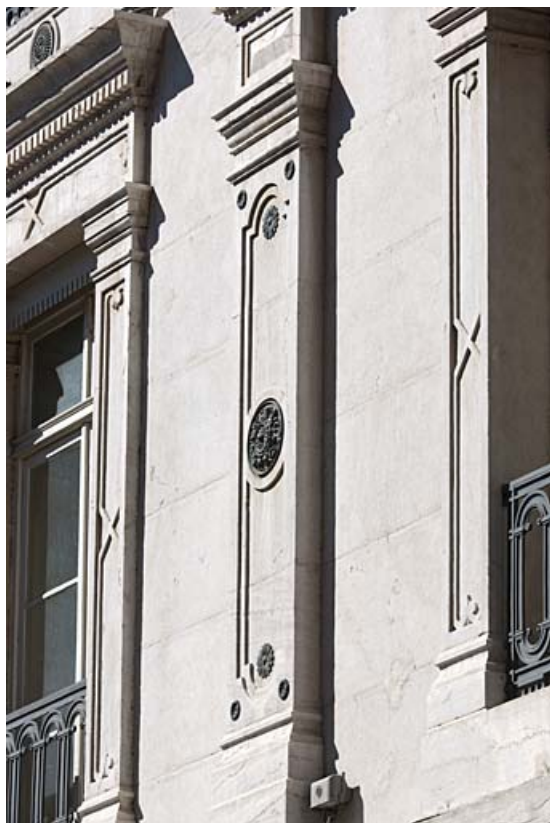
Façade sur rue : détail du décor d'un montant de fenêtre et d'un pilastre du premier étage.

25, Besançon, 11 rue Gustave Courbet, lieudit : îlot Courbet