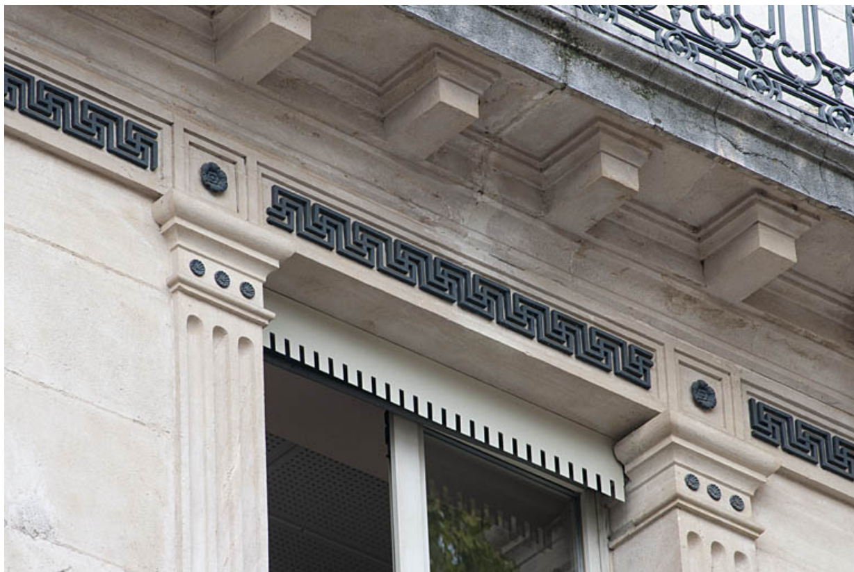
Façade sur rue : détail de la frise de grecques sous le balcon filant.

25, Besançon, 11 rue Gustave Courbet, lieudit : îlot Courbet