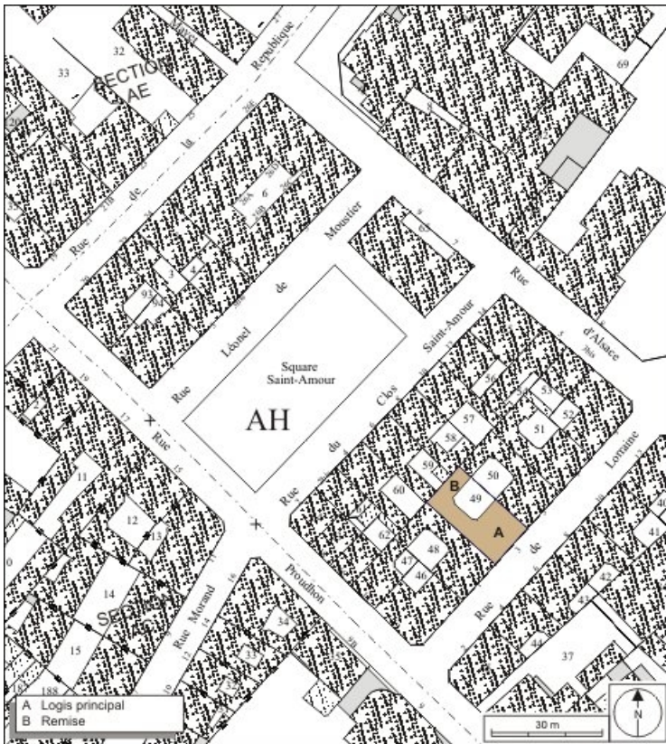
Plan masse et de situation. Extrait du plan cadastral, 1974, section AH. 25, Besançon, 3 rue Lorraine, lieudit : îlot Saint-Amour