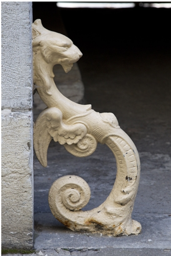
Passage cocher : détail d'un chasse-roue en fonte en forme de dragon ailé. 25, Besançon, 26 rue de la République, lieudit : îlot Saint-Amour