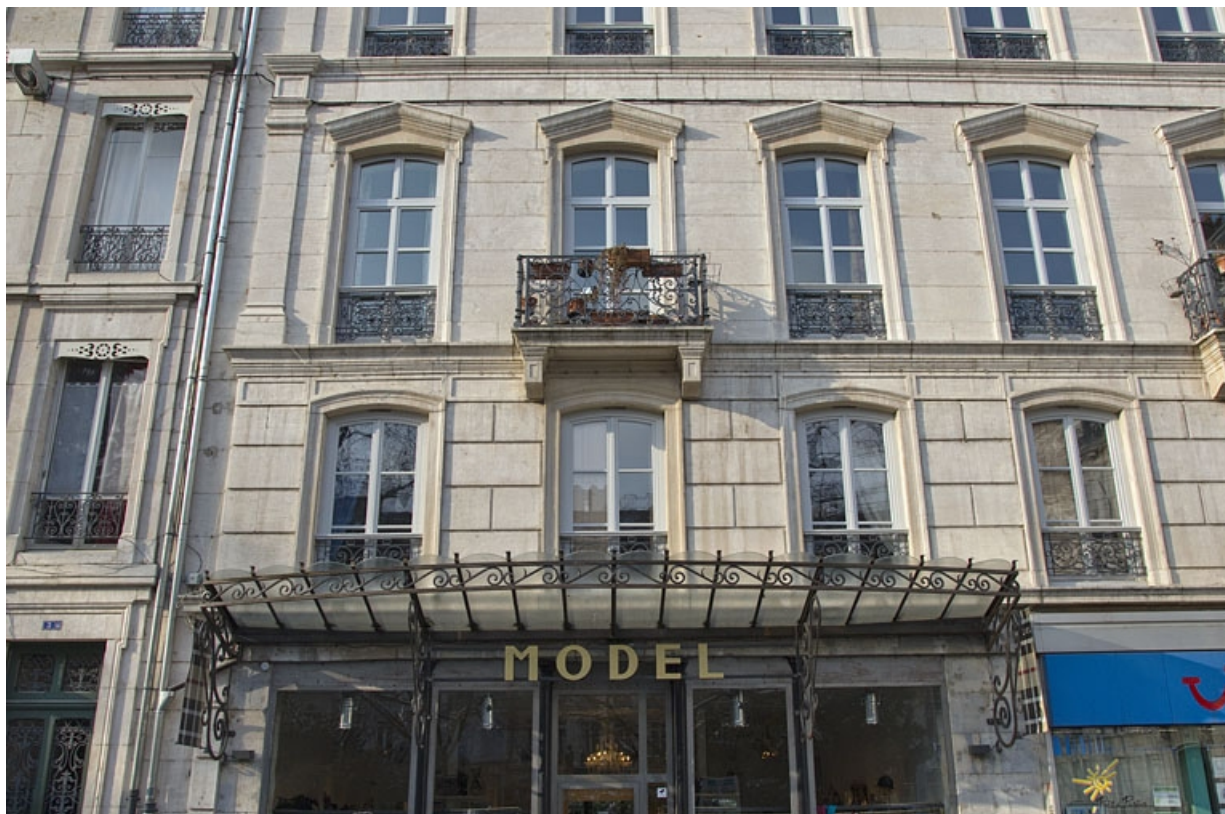
Façade antérieure, rue Léonel de Moustier : détail de la partie gauche jusqu'au deuxième étage, de face. 25, Besançon, 26 rue de la République, lieudit : îlot Saint-Amour