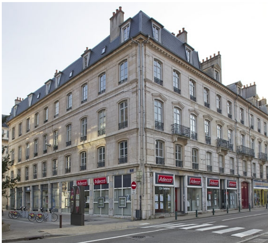
Vue d'ensemble de la façade rue Léonel de Moustier et de la façade latéral droite, de trois quarts droit. 25, Besançon, 26 rue de la République, lieudit : îlot Saint-Amour