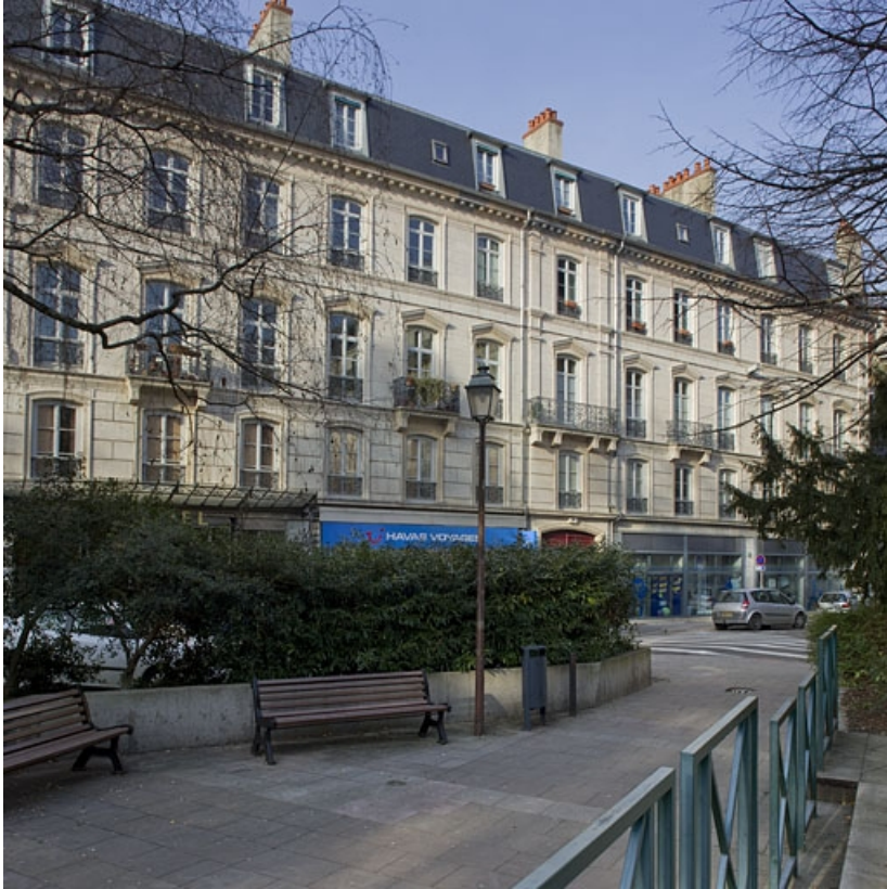
Vue d'ensemble dans l'alignement de la rue, depuis le square Saint-Amour.

25, Besançon, 26 rue de la République, lieudit : îlot Saint-Amour