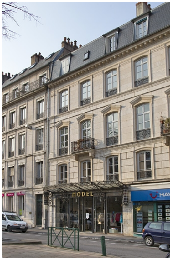
Façade antérieure, rue Léonel de Moustier : vue d'ensemble de la partie gauche, de trois quarts droit. 25, Besançon, 26 rue de la République, lieudit : îlot Saint-Amour