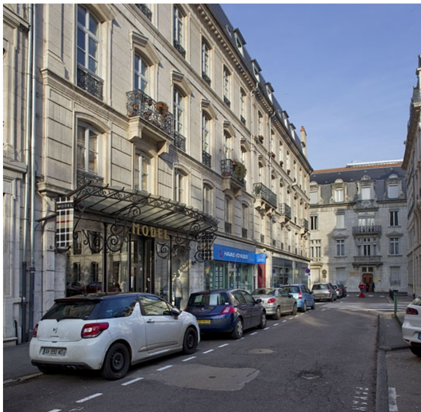
Vue d'ensemble de la façade rue Léonel de Moustier, de trois quarts gauche. 25, Besançon, 26 rue de la République, lieudit : îlot Saint-Amour