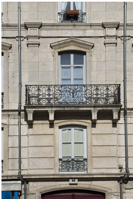
Façade antérieure, rue Léonel de Moustier : détail du balcon du deuxième étage au-dessus du portail d'entrée. 25, Besançon, 26 rue de la République, lieudit : îlot Saint-Amour