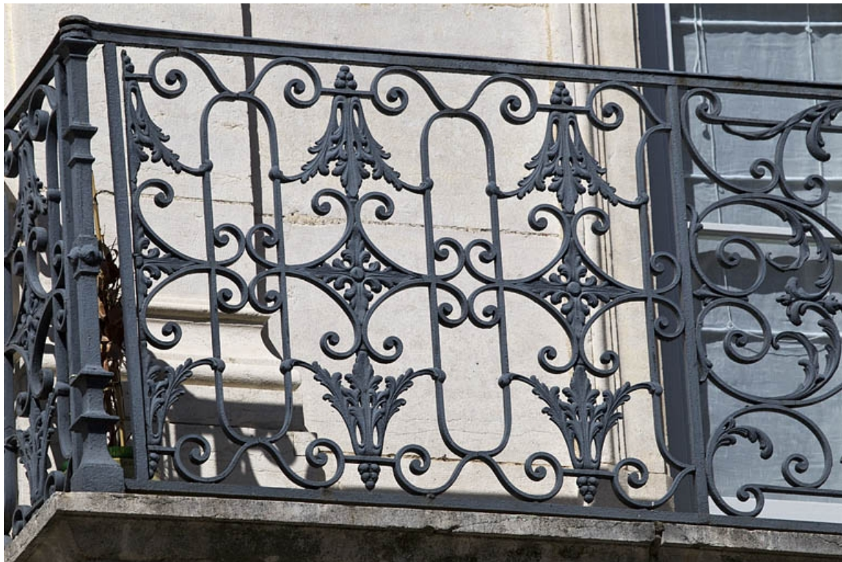
Façade antérieure, rue Léonel de Moustier, balcon du deuxième étage au-dessus du portail d'entrée : détail du garde-corps. 25, Besançon, 26 rue de la République, lieudit : îlot Saint-Amour