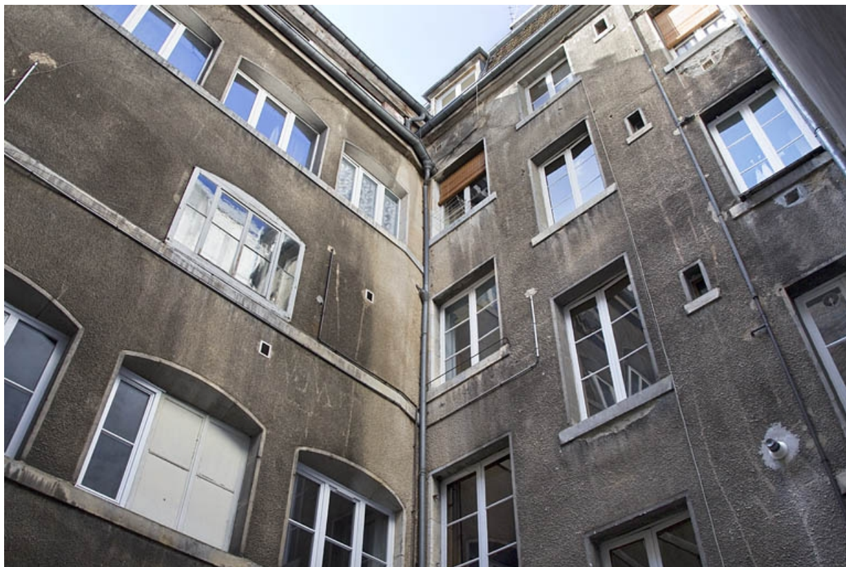
Vue de l'angle de la cour entre l'atelier d'horlogerie et la façade postérieure du logis.

25, Besançon, 4 rue du Clos Saint-Amour, lieudit : îlot Saint-Amour