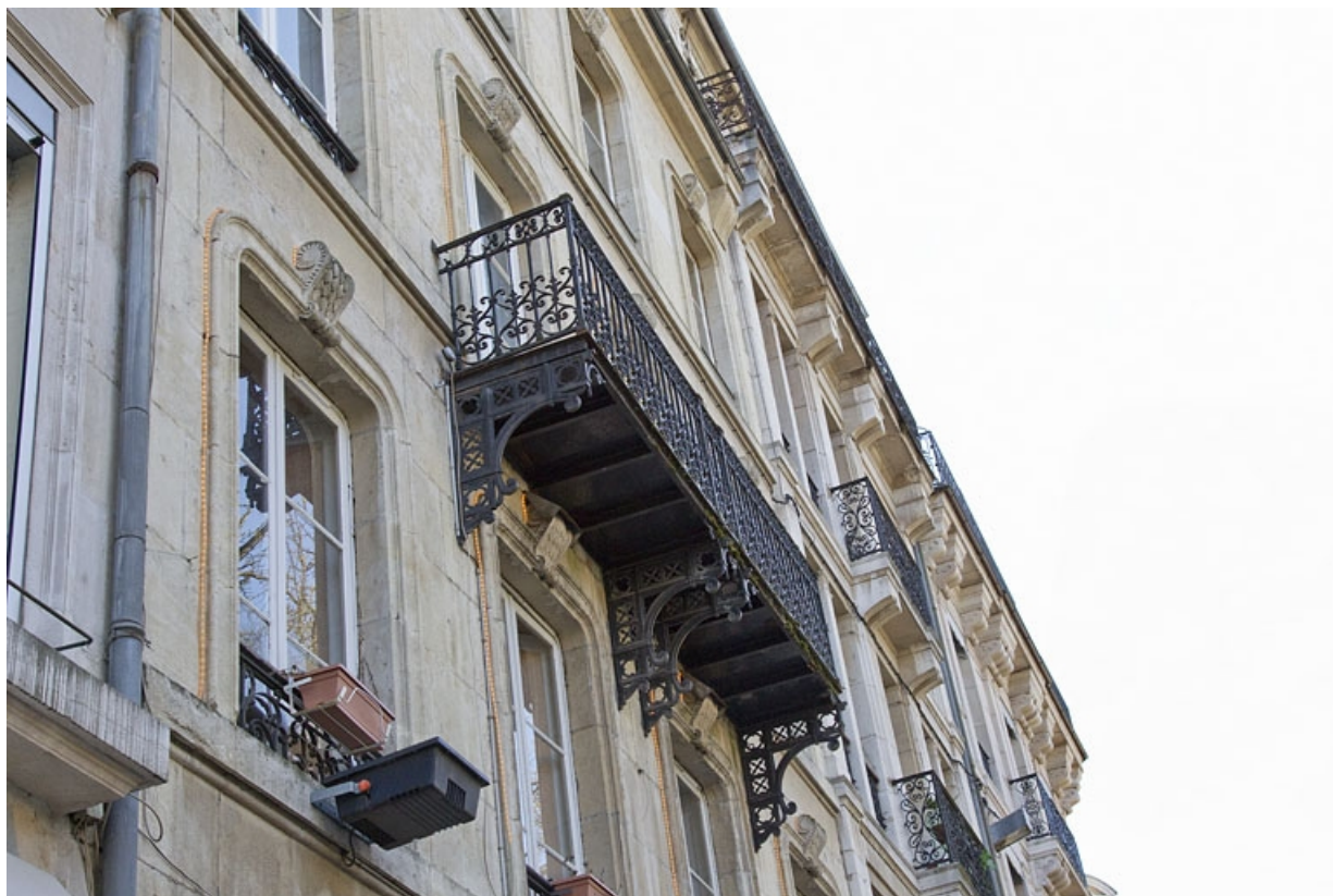
Façade antérieure : détail du balcon du deuxième étage, de trois quarts gauche.

25, Besançon, 4 rue du Clos Saint-Amour, lieudit : îlot Saint-Amour