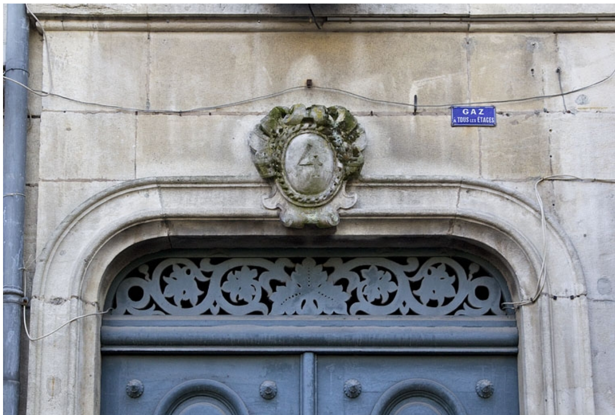
Façade antérieure : détail de la partie supérieure du portail d'entrée.

25, Besançon, 4 rue du Clos Saint-Amour, lieudit : îlot Saint-Amour