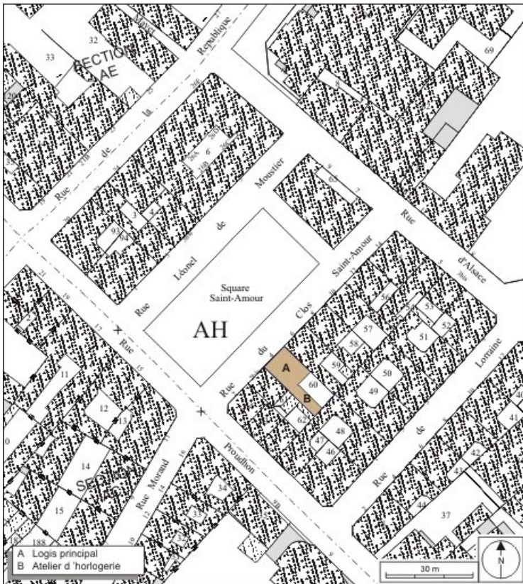
Plan masse et de situation. Extrait du plan cadastral, 1974, section AH. 25, Besançon, 4 rue du Clos Saint-Amour, lieudit : îlot Saint-Amour