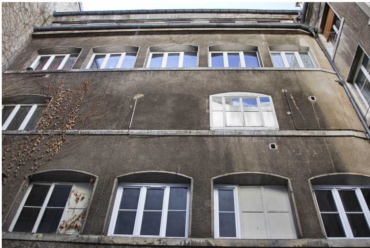
Vue de l'atelier d'horlogerie à droite de la cour, de face. 25, Besançon