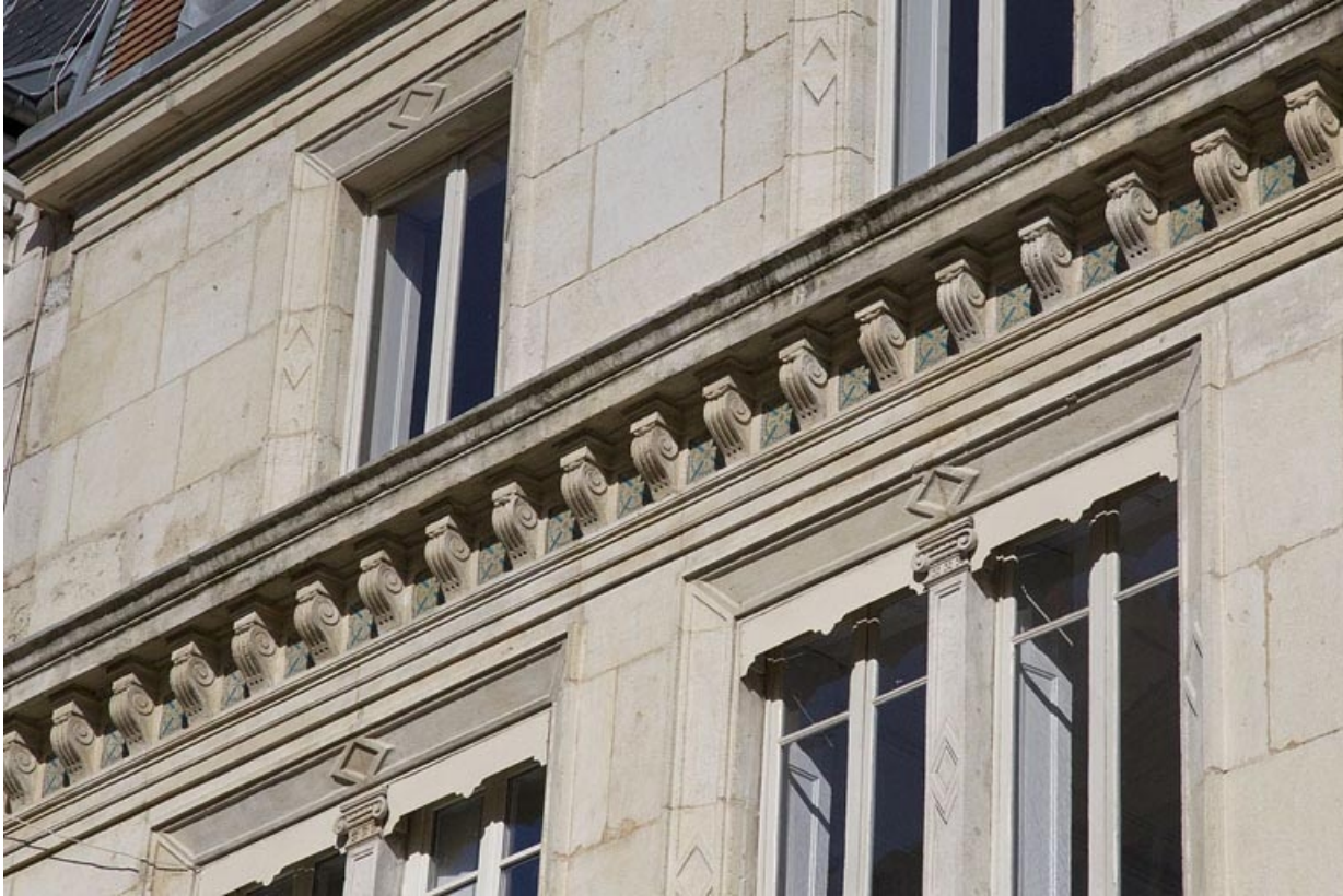
Façade antérieure : détail de la corniche entre les deuxième et troisième étages : de trois quarts droit.

25, Besançon, 14 rue Proudhon, lieudit : îlot Saint-Amour