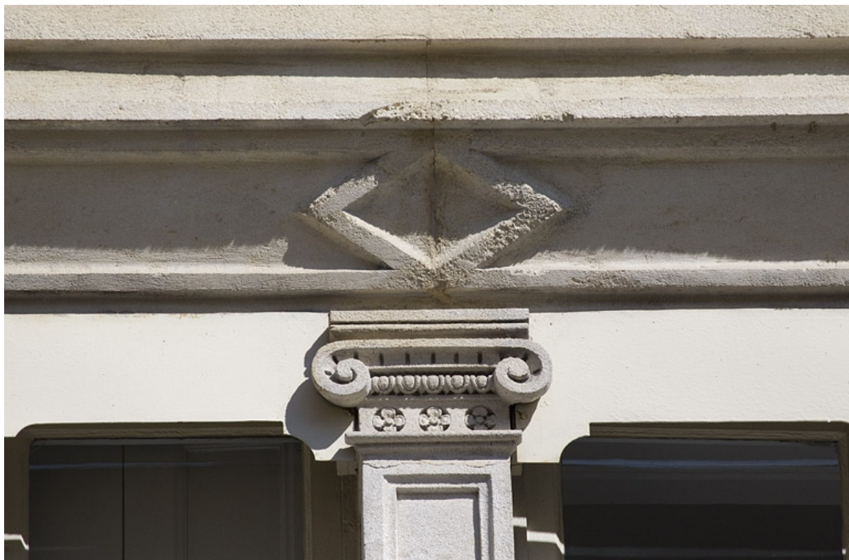
Façade antérieure, fenêtre du deuxième étage : détail d'un chapiteau ionique couronnant le meneau.

25, Besançon, 14 rue Proudhon, lieudit : îlot Saint-Amour