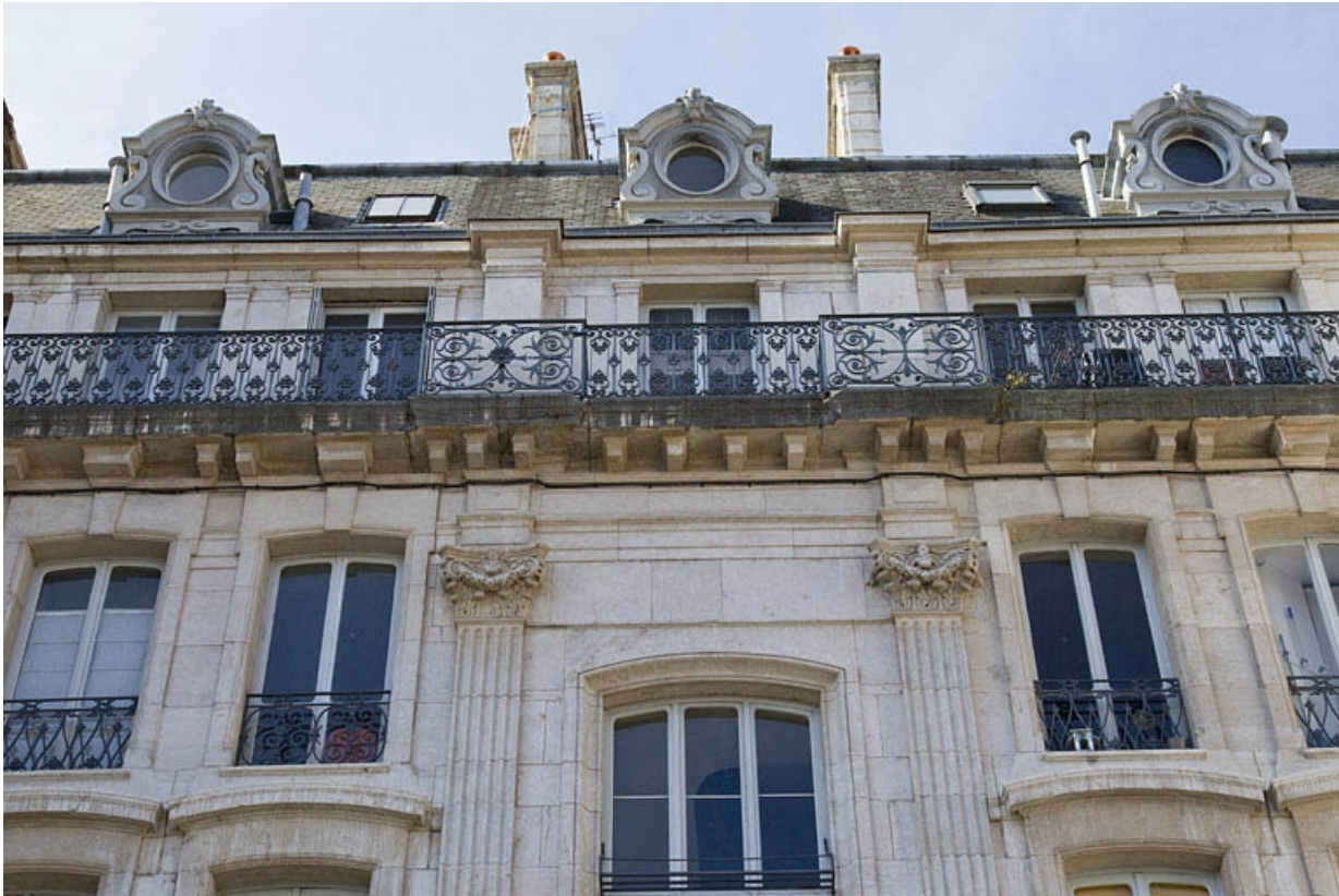
Façade antérieure : détail de la partie supérieure.

25, Besançon, 7 square Saint-Amour, lieudit : îlot Saint-Amour