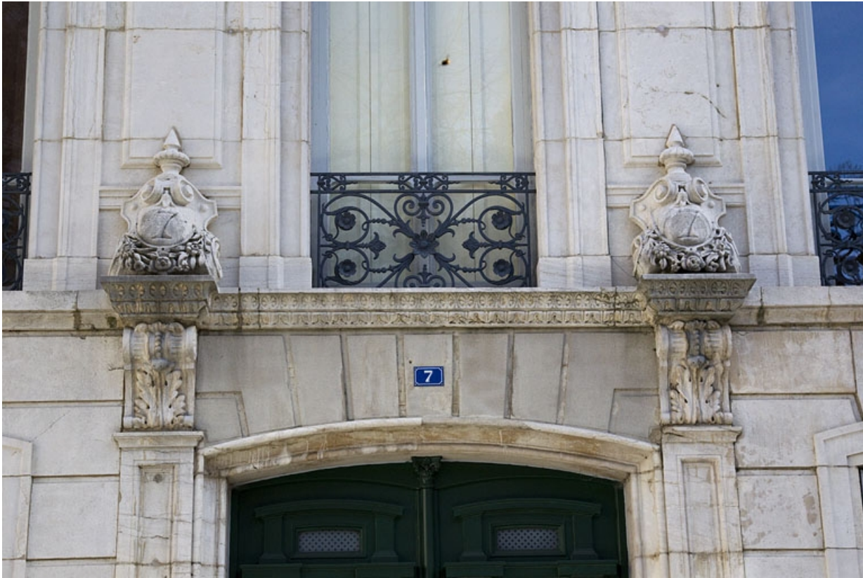
Façade antérieure : détail des décors cantonnant la porte d'entrée.

25, Besançon, 7 square Saint-Amour, lieudit : îlot Saint-Amour