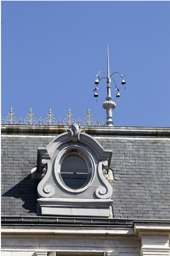
Toiture : détail d'une lucarne et du décor du faite du toit.

25, Besançon, 7 square Saint-Amour, lieudit : îlot Saint-Amour