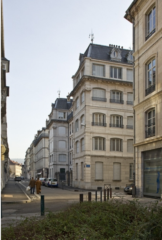
Façade postérieure, vue éloignée : de trois quarts droit.

25, Besançon, 7 square Saint-Amour, lieudit : îlot Saint-Amour