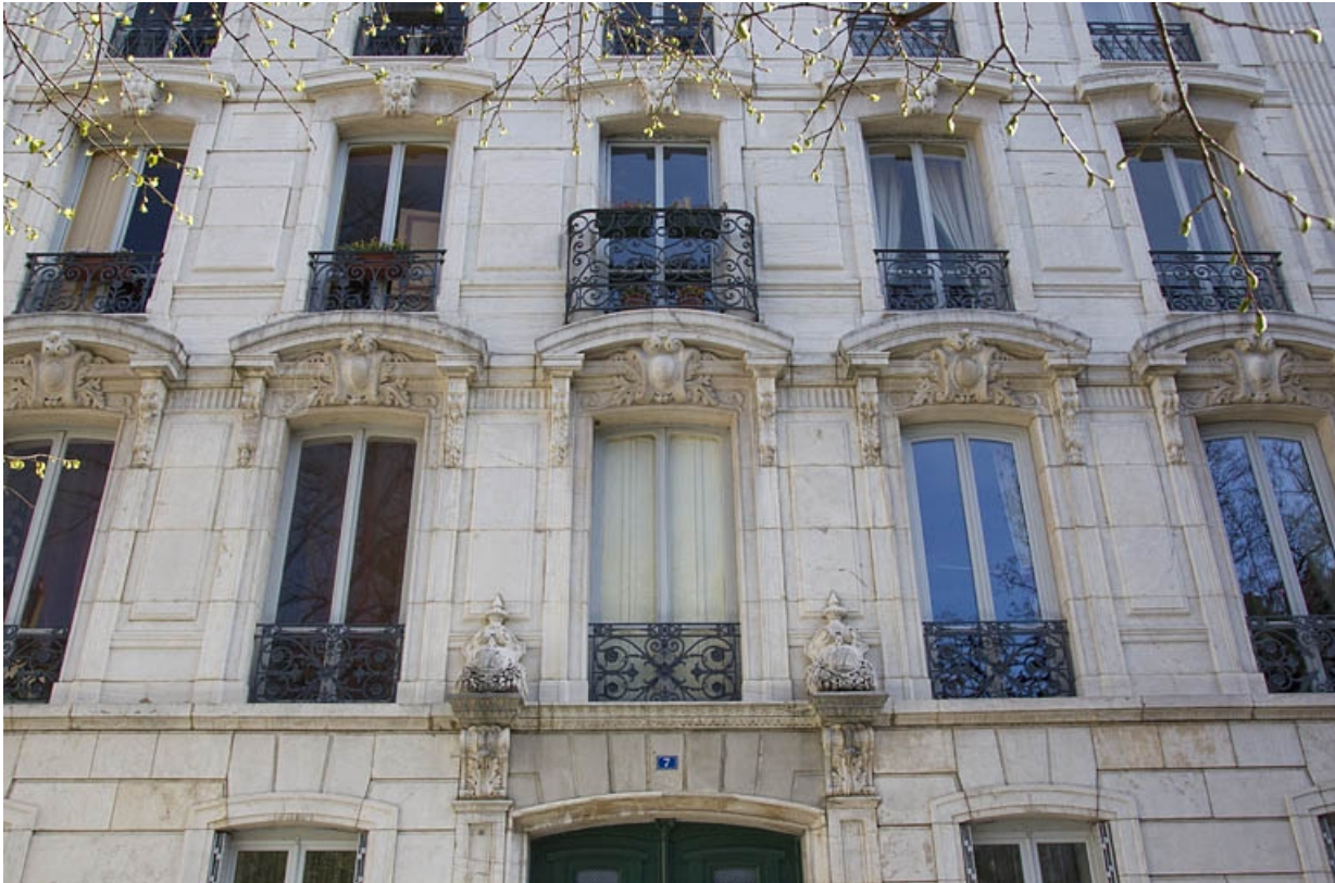
Vue de la façade antérieure à partir du premier étage.

25, Besançon, 7 square Saint-Amour, lieudit : îlot Saint-Amour