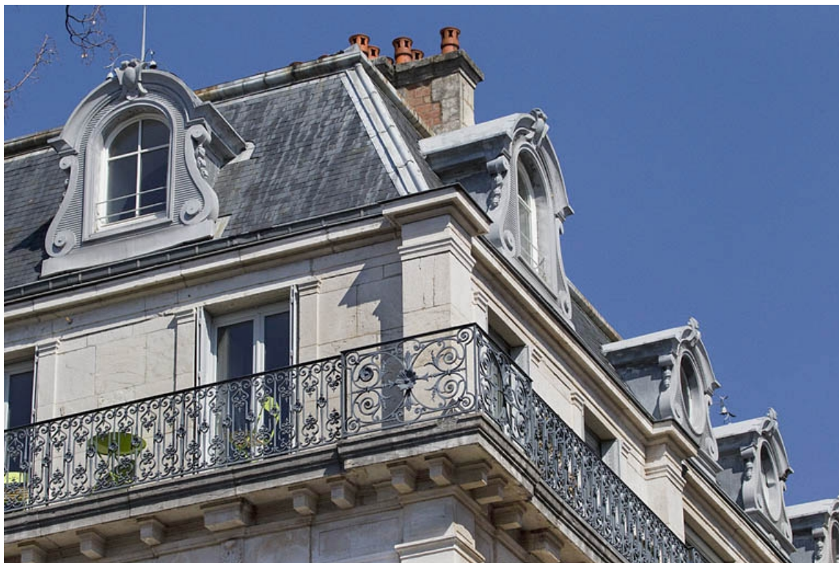
Détail de la toiture et du garde-corps de l'étage de surélévation, à l'angle droit de l'édifice.

25, Besançon, 7 square Saint-Amour, lieudit : îlot Saint-Amour