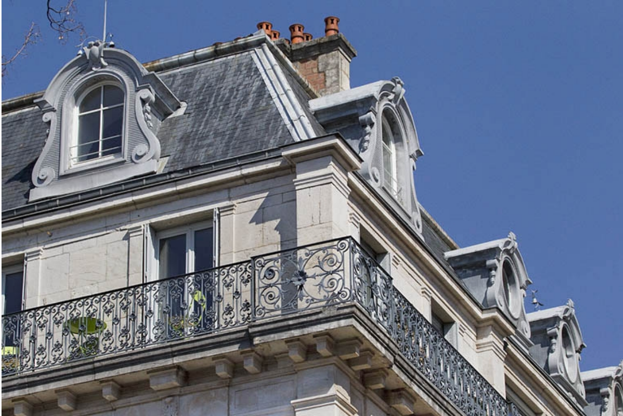
Détail de la toiture et du garde-corps de l'étage de surélévation, à l'angle droit de l'édifice.

25, Besançon, 7 square Saint-Amour, lieudit : îlot Saint-Amour