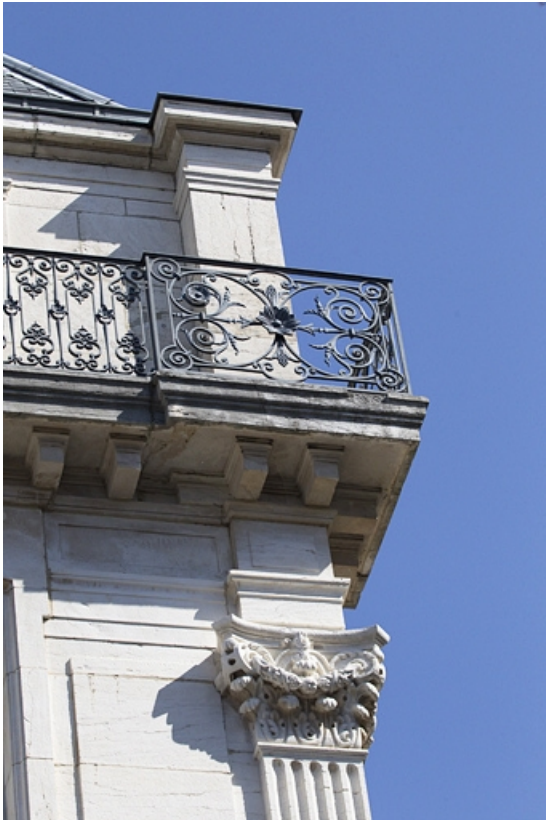
Façade antérieure, angle droit : détail d'un chapiteau corinthien et du garde-corps de l'étage de surélévation.

25, Besançon, 7 square Saint-Amour, lieudit : îlot Saint-Amour