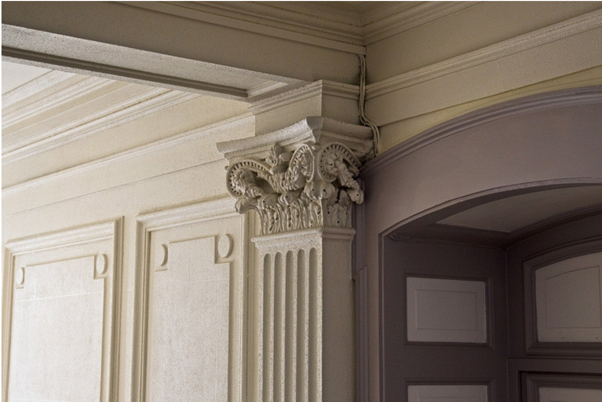
Intérieur : détail du chapiteau d'un pilastre décorant le vestibule.

25, Besançon, 7 square Saint-Amour, lieudit : îlot Saint-Amour