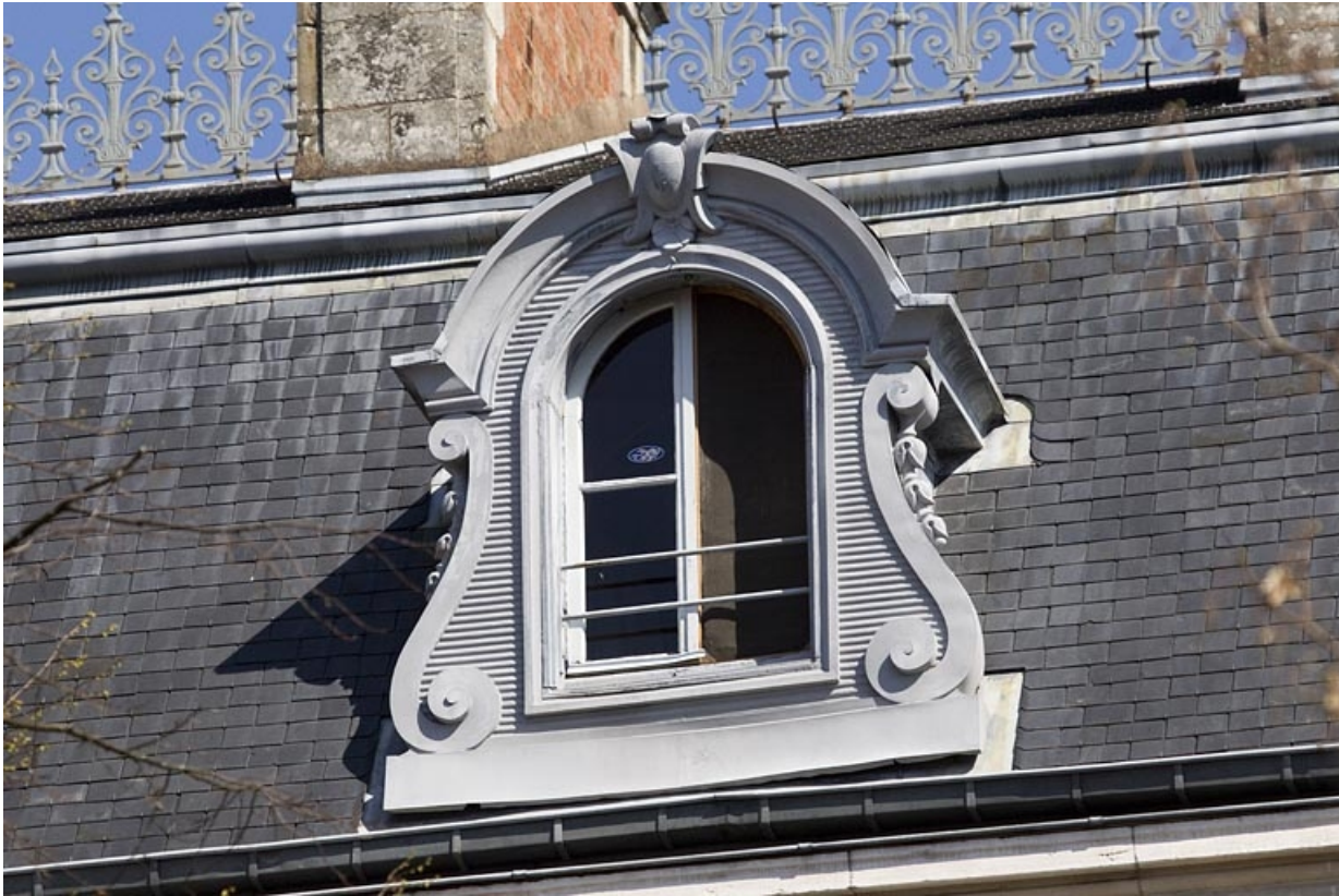
Toiture : détail d'une lucarne.

25, Besançon, 7 square Saint-Amour, lieudit : îlot Saint-Amour