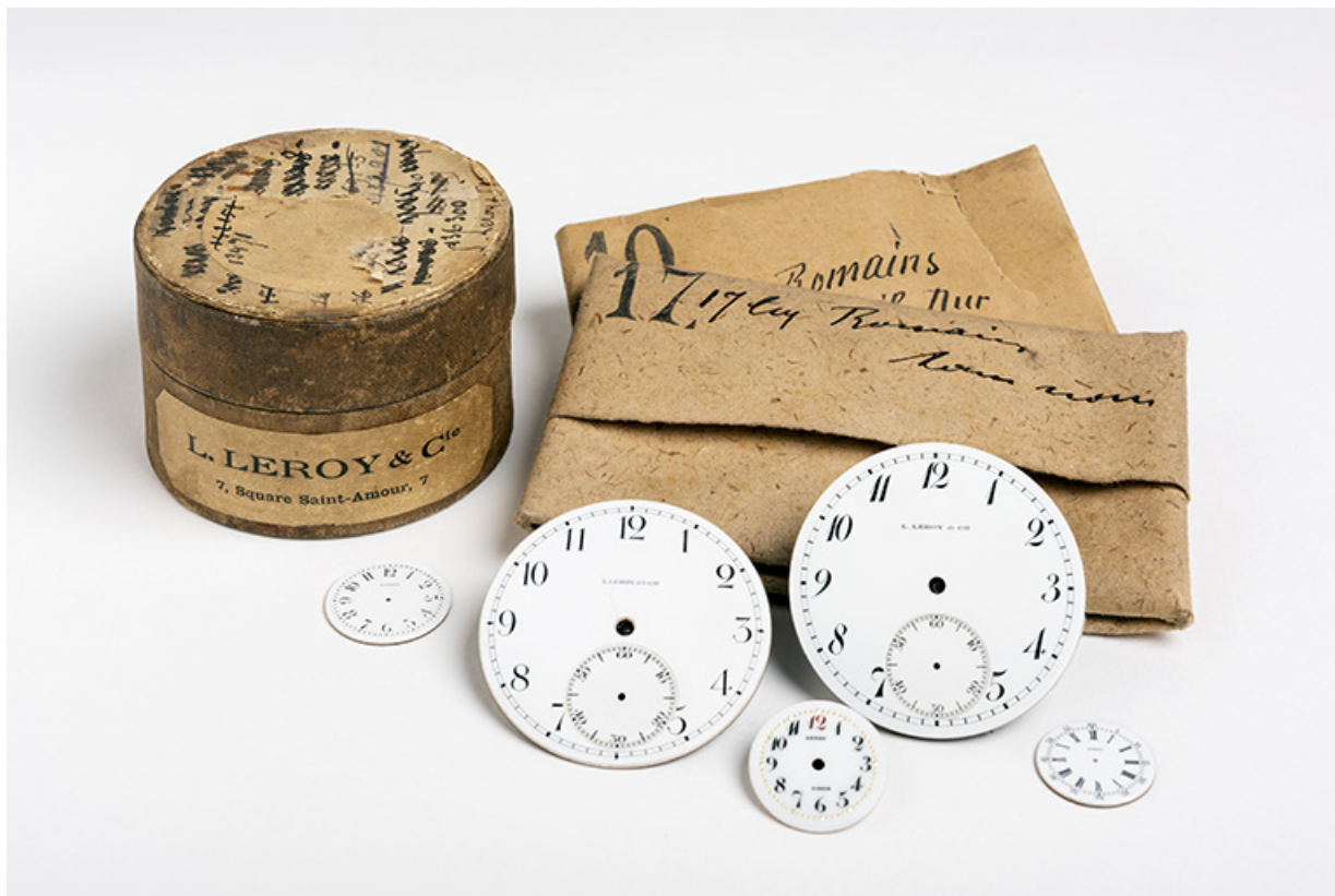
Cadrans et boîte de fourniture Leroy, début 20e siècle. (Collection J.M. Loiseau).

25, Besançon, 7 square Saint-Amour, lieudit : îlot Saint-Amour