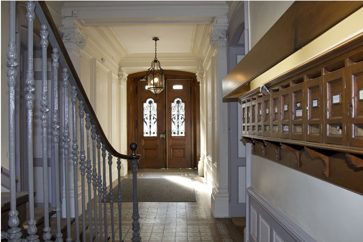
Intérieur : vue du vestibule depuis l'escalier.

25, Besançon, 7 square Saint-Amour, lieudit : îlot Saint-Amour