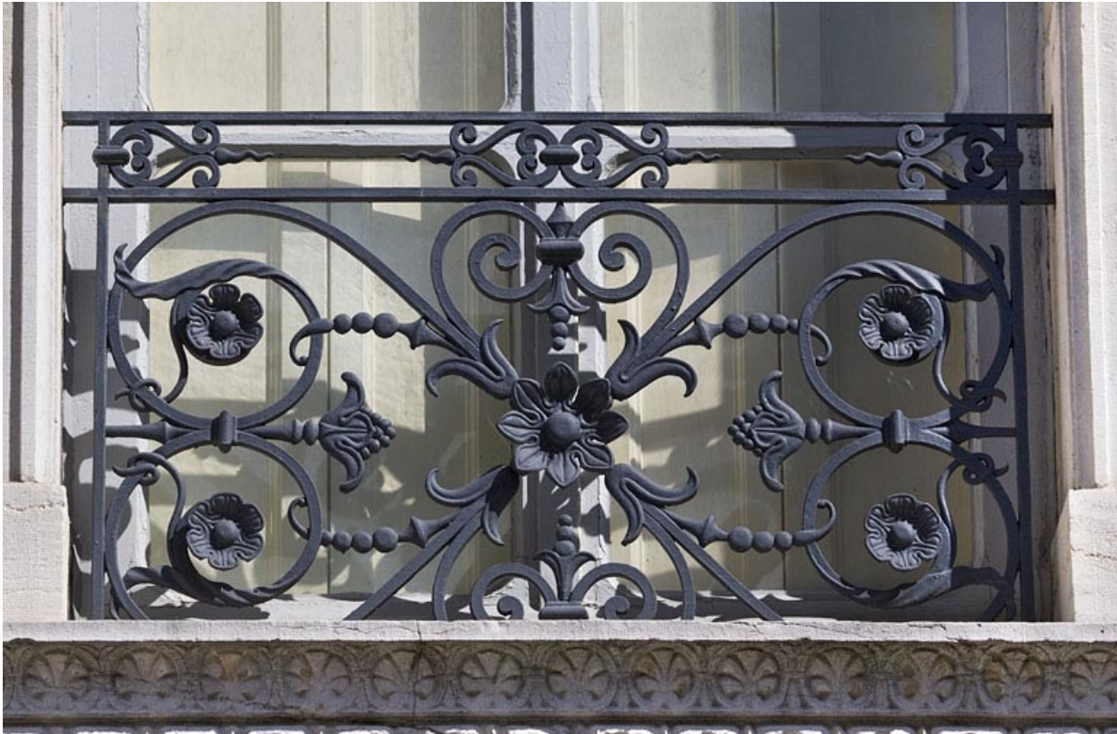
Façade antérieure : détail d'un garde-corps en ferronnerie d'une fenêtre.

25, Besançon, 7 square Saint-Amour, lieudit : îlot Saint-Amour