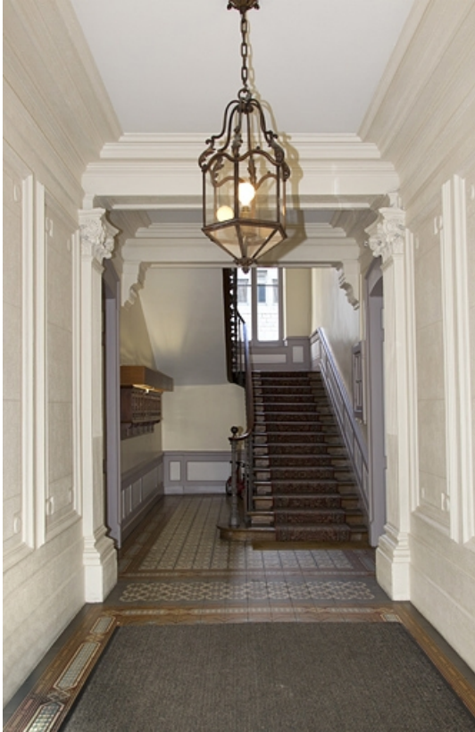
Intérieur : vue du vestibule et de l'escalier depuis l'entrée.

25, Besançon, 7 square Saint-Amour, lieudit : îlot Saint-Amour