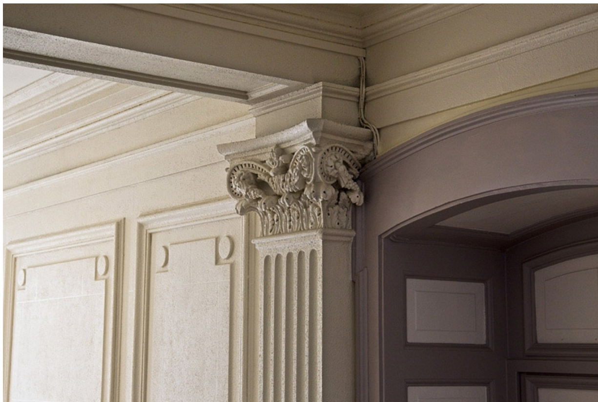
Intérieur : détail du chapiteau d'un pilastre décorant le vestibule.

25, Besançon, 7 square Saint-Amour, lieudit : îlot Saint-Amour