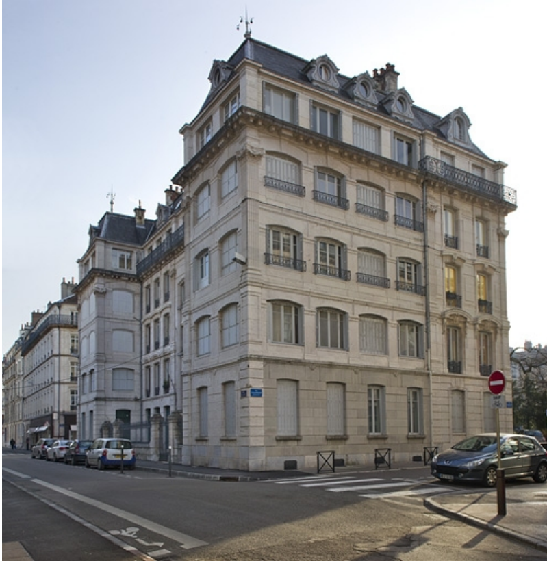
Façade latérale gauche et postérieure : de trois quarts droit.

25, Besançon, 7 square Saint-Amour, lieudit : îlot Saint-Amour