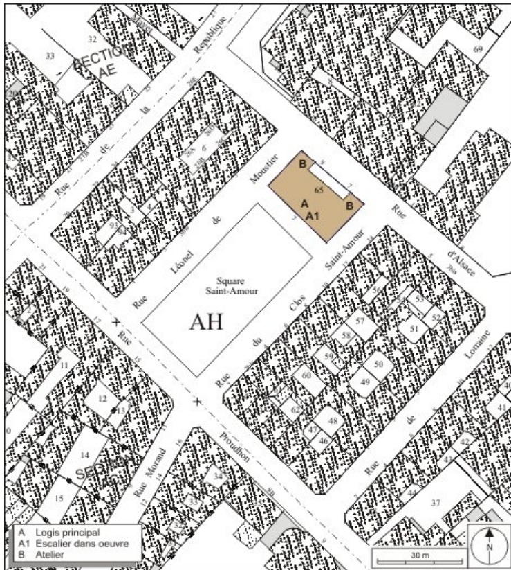
Plan masse et de situation. Extrait du plan cadastral, 1974, section AH. 25, Besançon, 7 square Saint-Amour, lieudit : îlot Saint-Amour