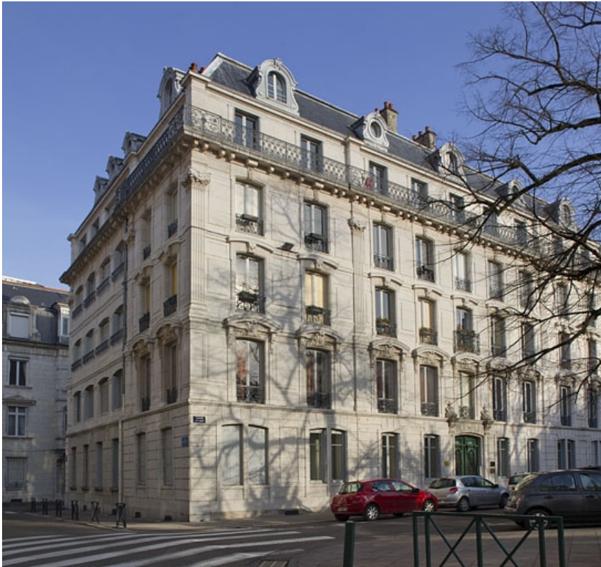
Vue d'ensemble de trois quarts gauche.

25, Besançon, 7 square Saint-Amour, lieudit : îlot Saint-Amour