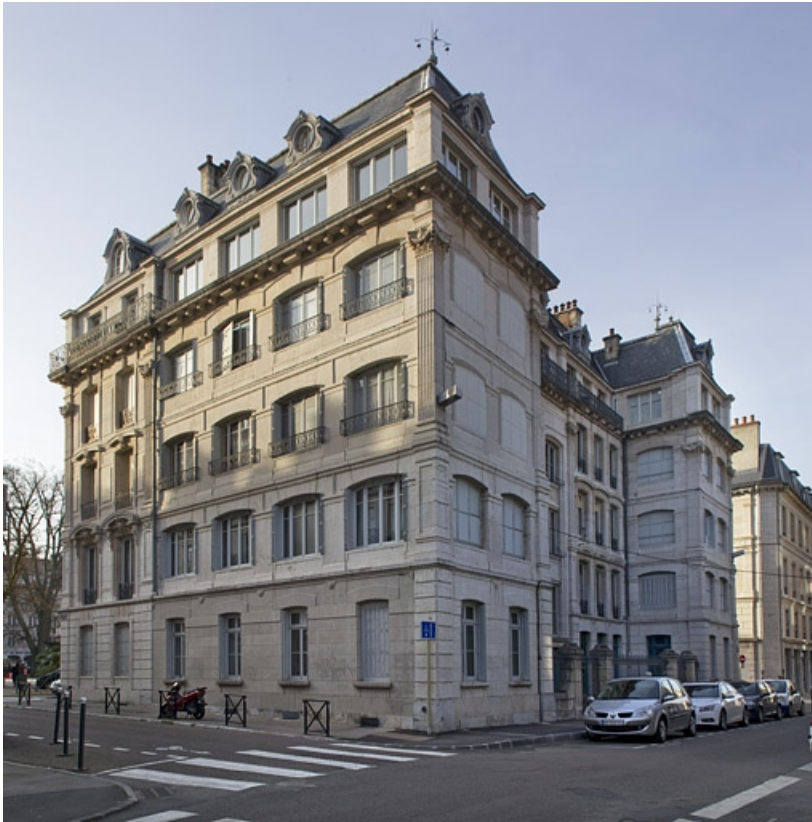
Façade latérale droite : de trois quarts droit.