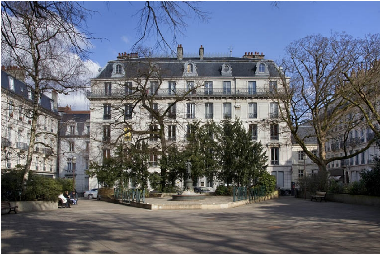
Façade antérieure, depuis le square saint-Amour : de face. 25, Besançon