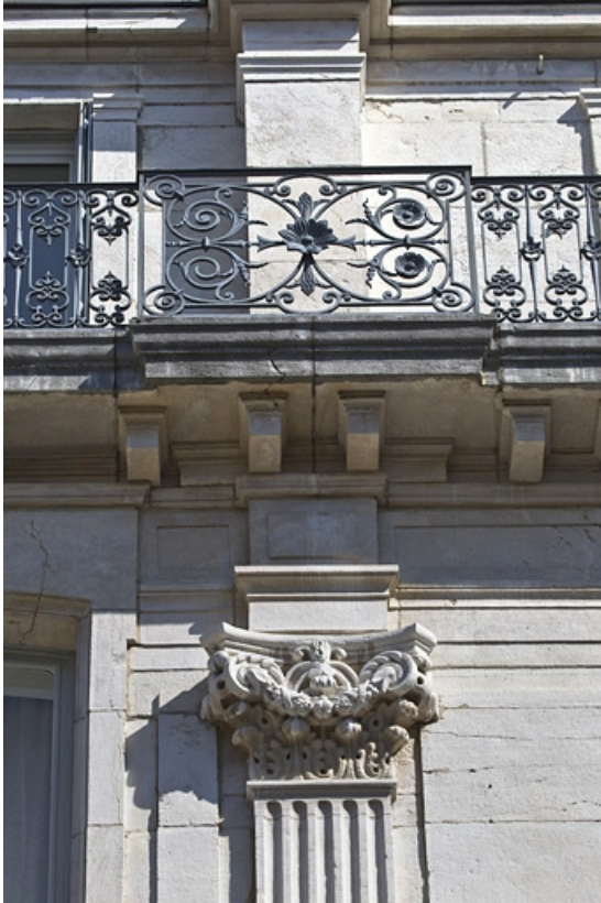
Façade antérieure : détail d'un chapiteau corinthien et du garde-corps de l'étage de surélévation.

25, Besançon, 7 square Saint-Amour, lieudit : îlot Saint-Amour