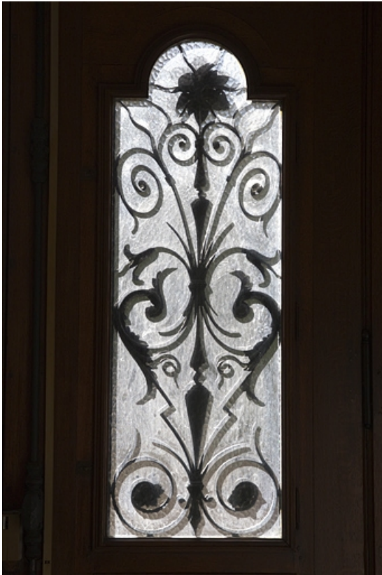
Intérieur, vestibule : détail d'un vitrage de la porte d'entrée.

25, Besançon, 7 square Saint-Amour, lieudit : îlot Saint-Amour