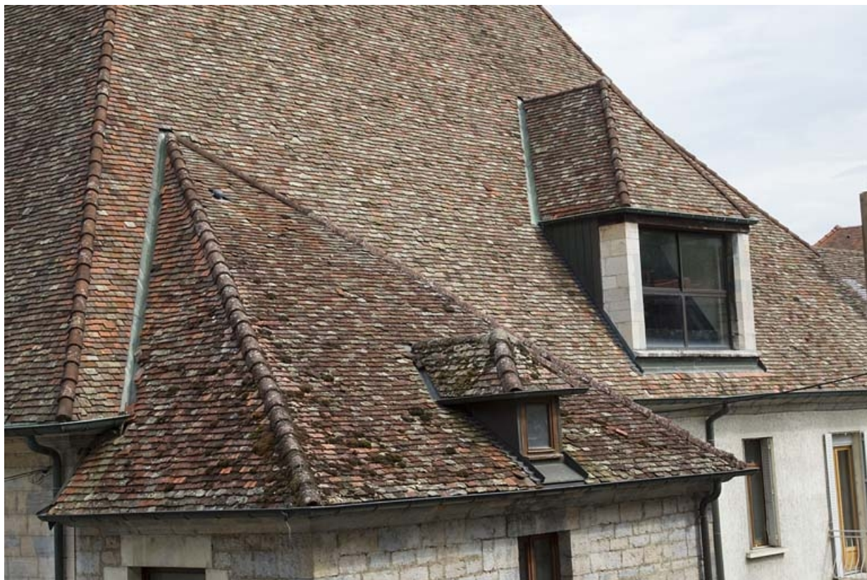
Détail du pan de toiture au-dessus de la façade latérale droite.

25, Besançon, 19 rue Rivotte, lieudit : îlot Porte Rivotte