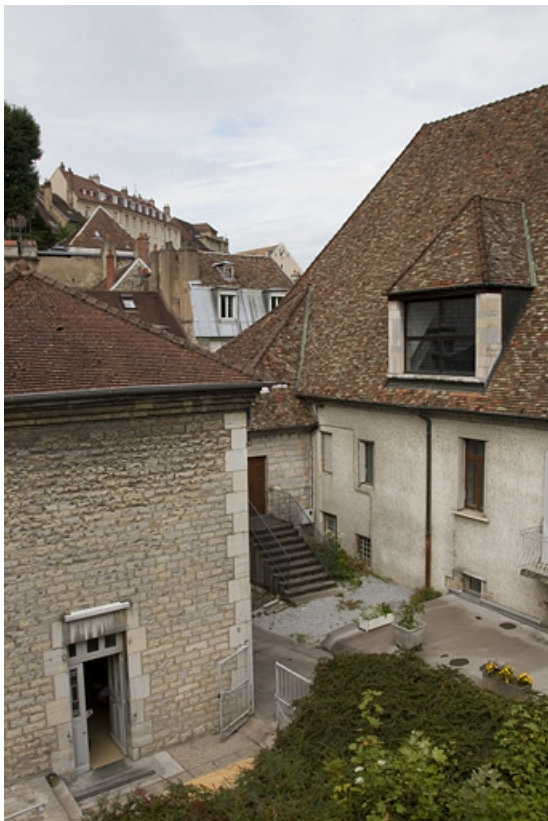
Façade latérale droite, détail de la partie gauche : de trois quarts droit.

25, Besançon, 19 rue Rivotte, lieudit : îlot Porte Rivotte