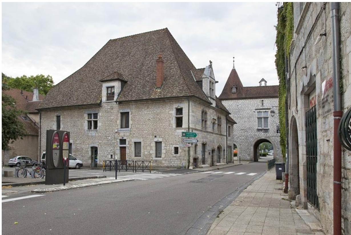
Vue d'ensemble éloignée, de trois quarts gauche.

25, Besançon, 19 rue Rivotte, lieudit : îlot Porte Rivotte