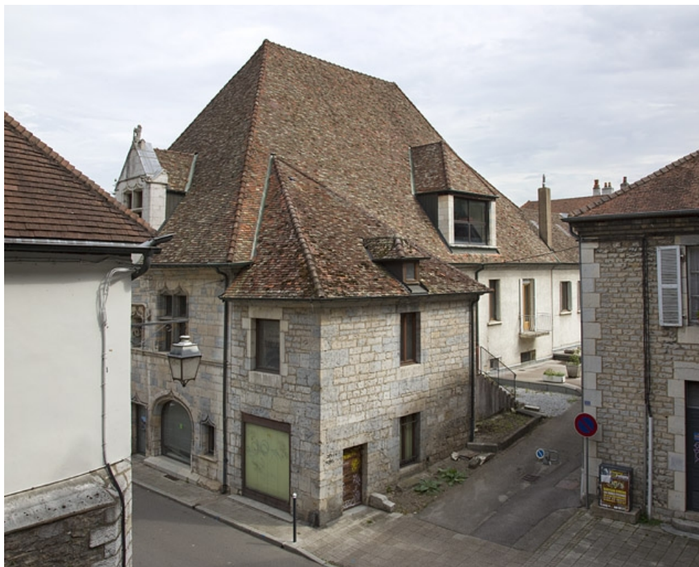
Façade rue Rivotte, de trois quarts droit.

25, Besançon, 19 rue Rivotte, lieudit : îlot Porte Rivotte