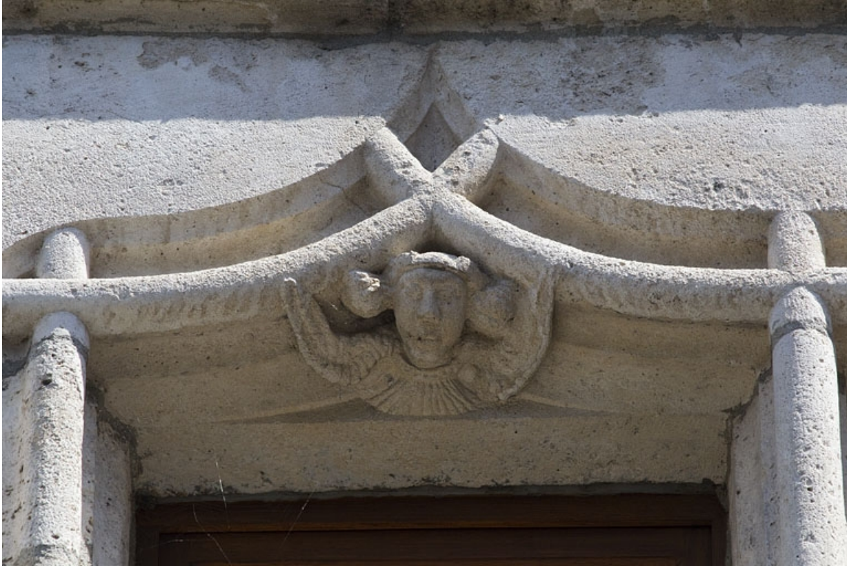
Façade antérieure, lucarne : détail de l'accolade, partie droite.

25, Besançon, 19 rue Rivotte, lieudit : îlot Porte Rivotte