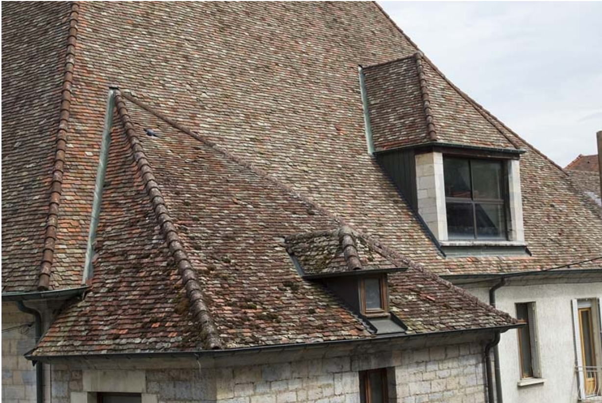
Détail du pan de toiture au-dessus de la façade latérale droite.

25, Besançon, 19 rue Rivotte, lieudit : îlot Porte Rivotte