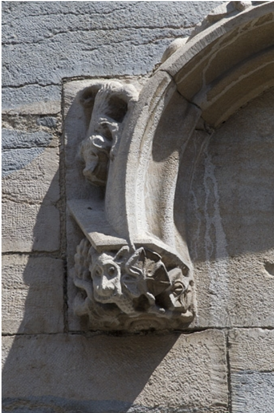
Façade antérieure, lucarne : détail de l'extrémité gauche de l'archivolte. 25, Besançon, 19 rue Rivotte, lieudit : îlot Porte Rivotte