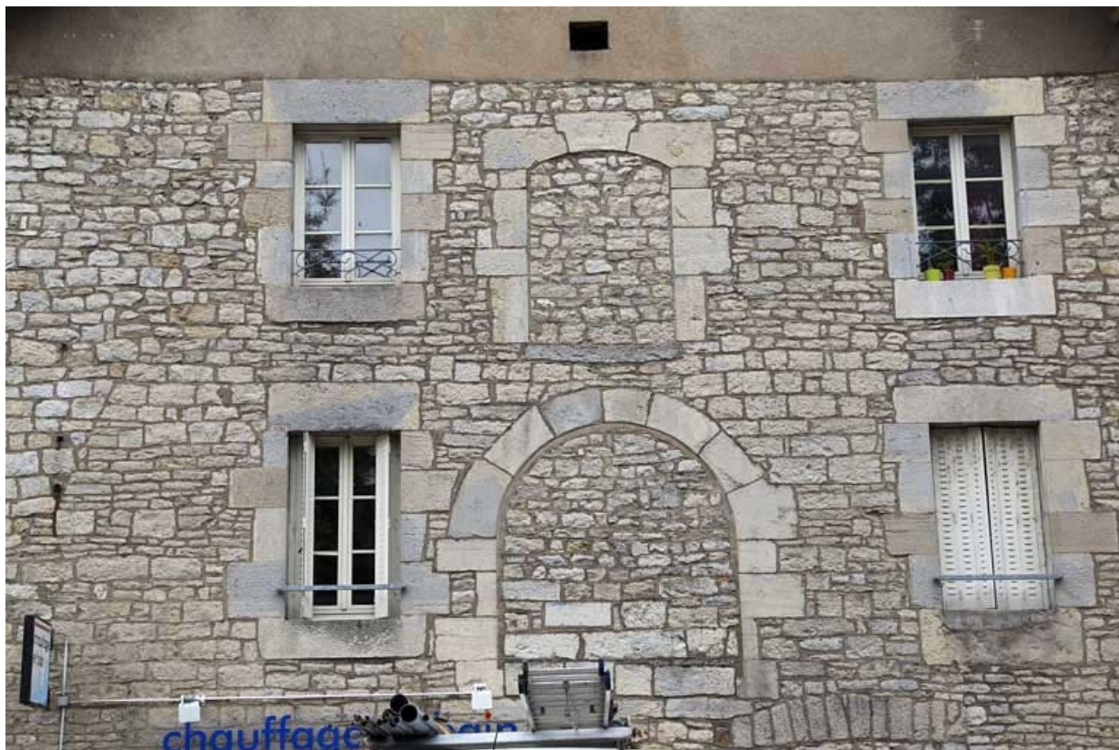
Bâtiment des remises et écuries : détail de la façade antérieure.

25, Besançon, 19 rue Rivotte, lieudit : îlot Porte Rivotte