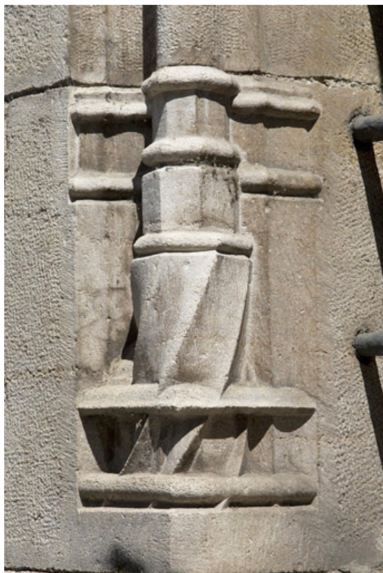
Façade antérieure, fenêtre au-dessus de l'entrée de cave : détail de la base prismatique gauche, vue rapprochée. 25, Besançon, 19 rue Rivotte, lieudit : îlot Porte Rivotte