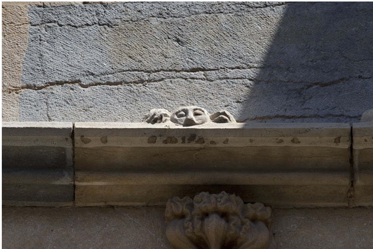
Façade antérieure, premier étage, baie centrale : détail de la partie centrale de l'archivolte.

25, Besançon, 19 rue Rivotte, lieudit : îlot Porte Rivotte