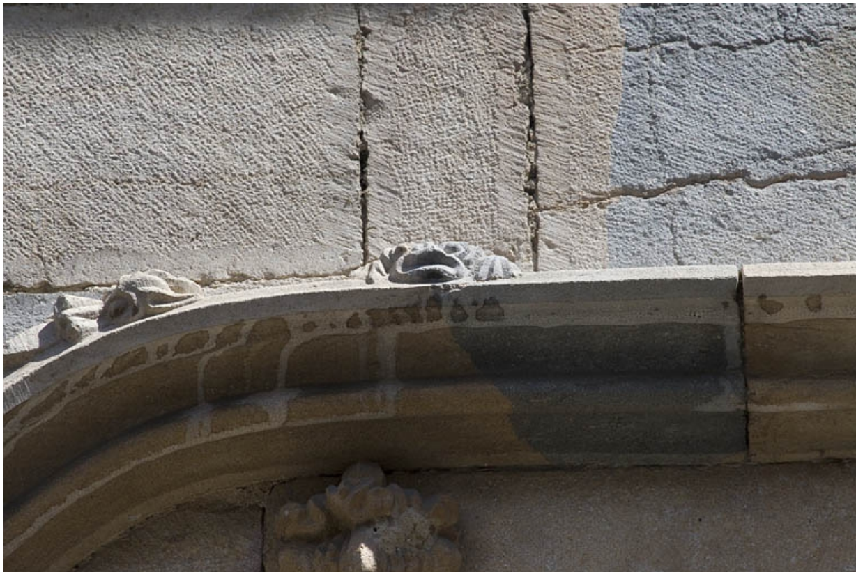
Façade antérieure, premier étage : détail de l'archivolte, partie gauche.

25, Besançon, 19 rue Rivotte, lieudit : îlot Porte Rivotte