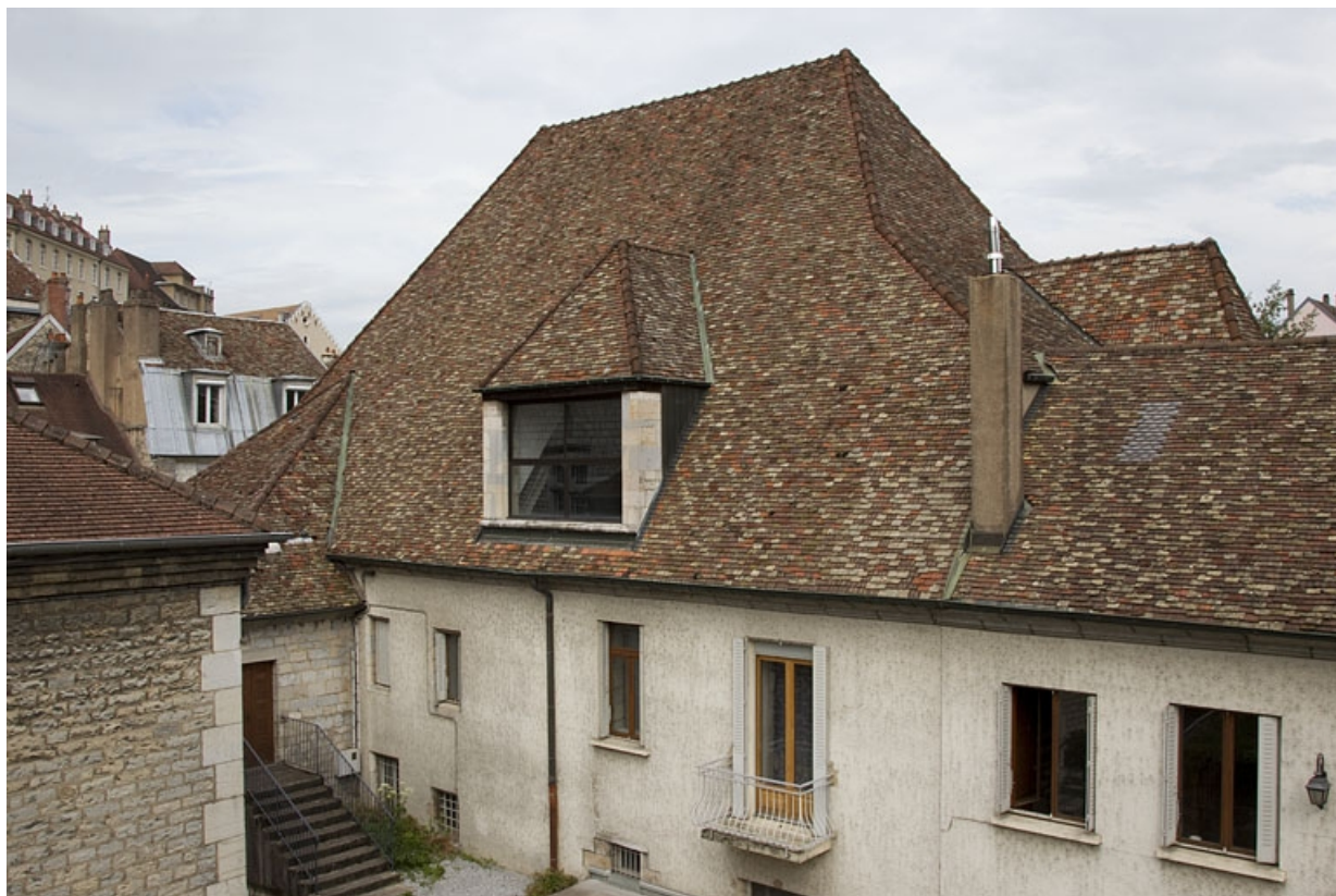
Façade latérale droite, de trois quarts droit.

25, Besançon, 19 rue Rivotte, lieudit : îlot Porte Rivotte