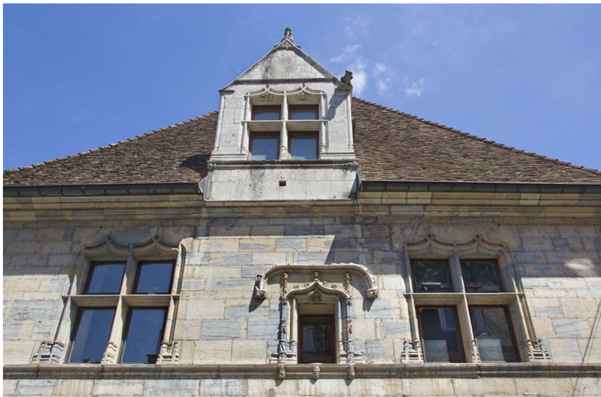
Façade antérieure, premier étage et lucarne : vue d'ensemble, de face.

25, Besançon, 19 rue Rivotte, lieudit : îlot Porte Rivotte