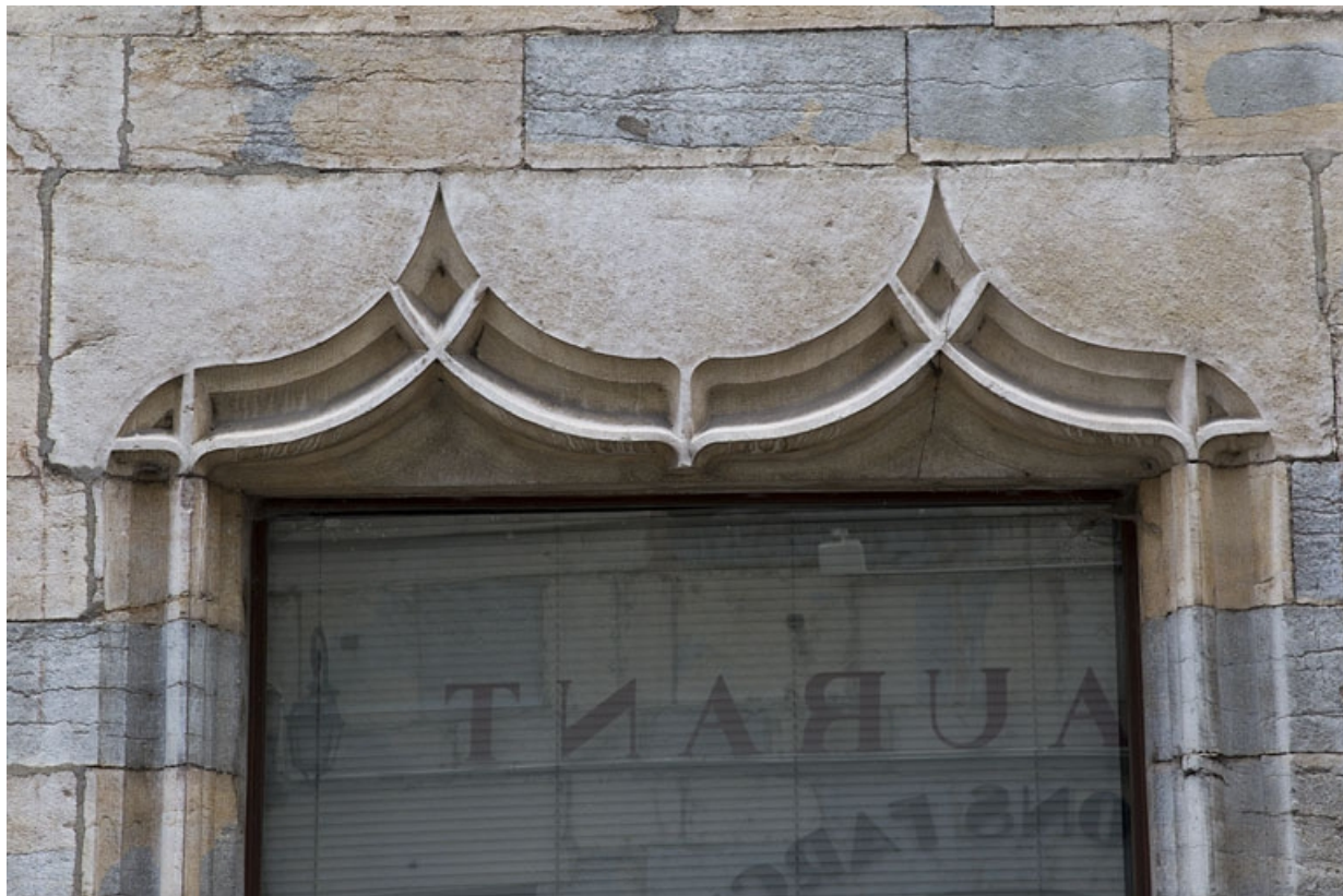
Façade antérieure : détail de l'arc en accolade de la baie à gauche l'ancienne entrée.

25, Besançon, 19 rue Rivotte, lieudit : îlot Porte Rivotte