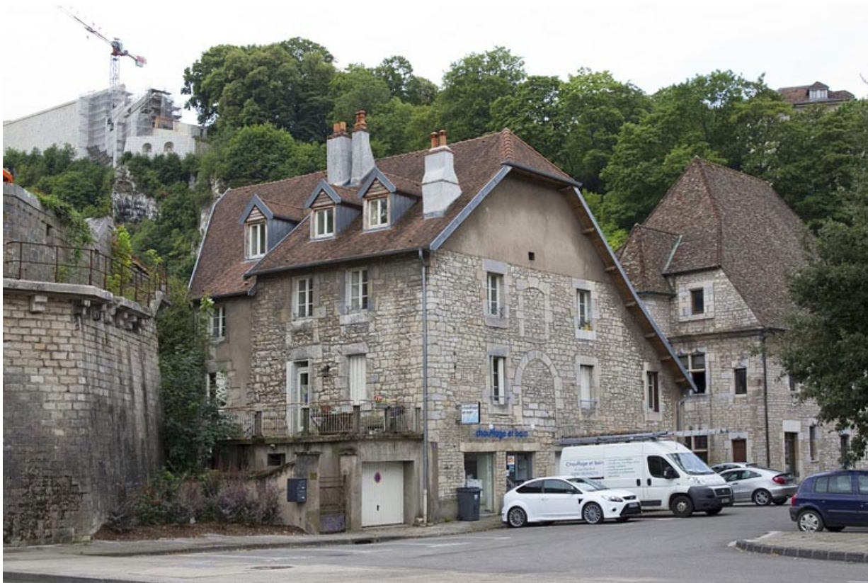
Bâtiment des remises et écuries : vue d'ensemble, de trois quarts gauche.

25, Besançon, 19 rue Rivotte, lieudit : îlot Porte Rivotte