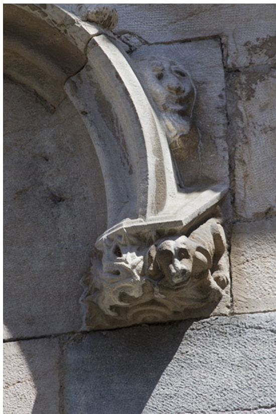
Façade antérieure, premier étage, baie centrale : détail de l'extrémité droite de l'archivolte. 25, Besançon, 19 rue Rivotte, lieudit : îlot Porte Rivotte