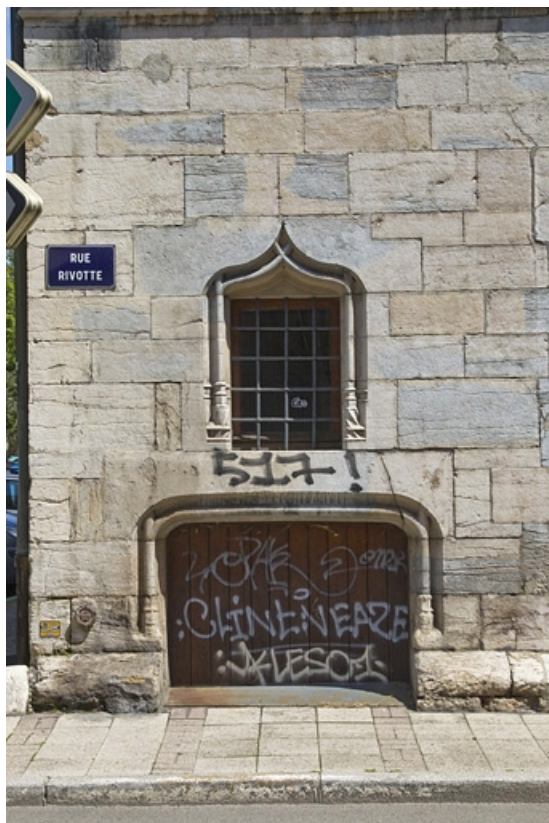
Façade antérieure, vue de l'entrée de cave.

25, Besançon, 19 rue Rivotte, lieudit : îlot Porte Rivotte