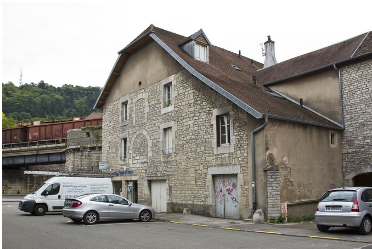
Bâtiment des remises et écuries : vue d'ensemble, de trois quarts droit.

25, Besançon, 19 rue Rivotte, lieudit : îlot Porte Rivotte