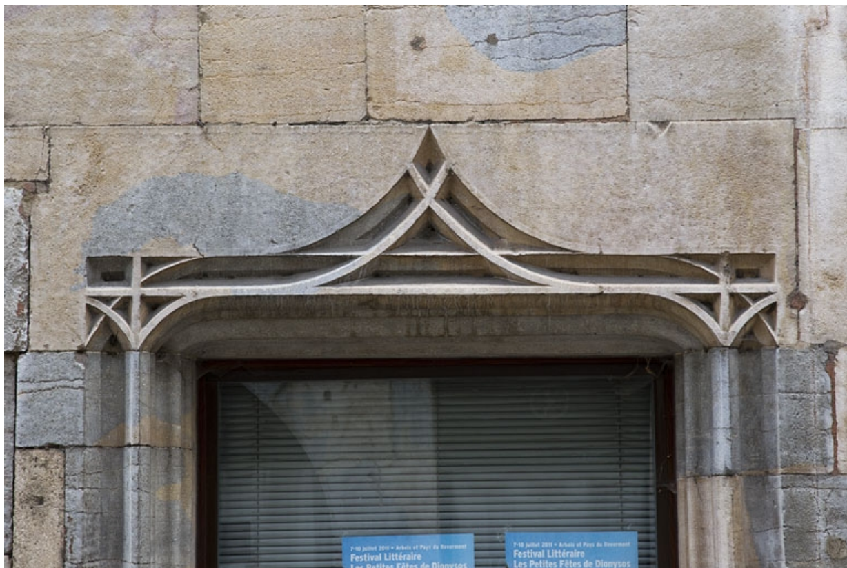
Façade antérieure : détail de l'arc en accolade de l'ancienne entrée.

25, Besançon, 19 rue Rivotte, lieudit : îlot Porte Rivotte