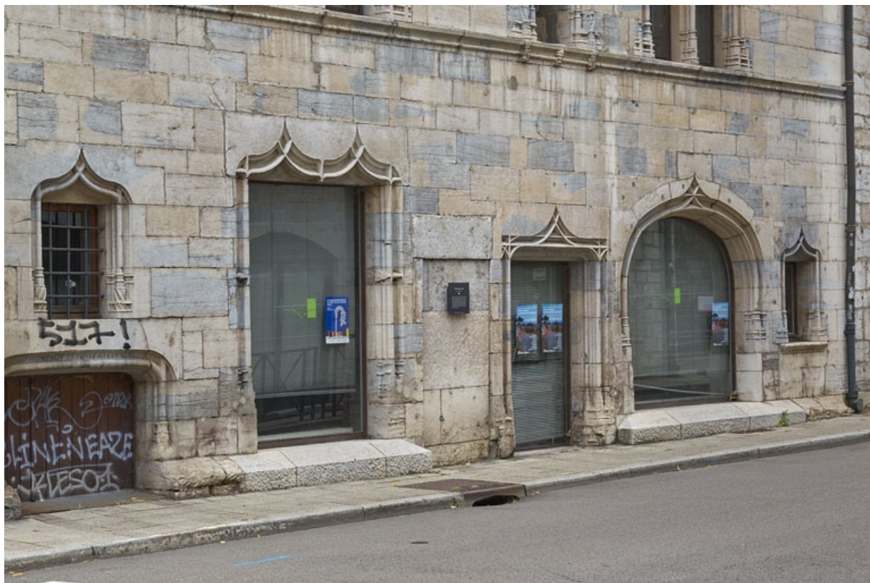
Façade rue Rivotte, détail du rez-de-chaussée, de trois quarts gauche.

25, Besançon, 19 rue Rivotte, lieudit : îlot Porte Rivotte