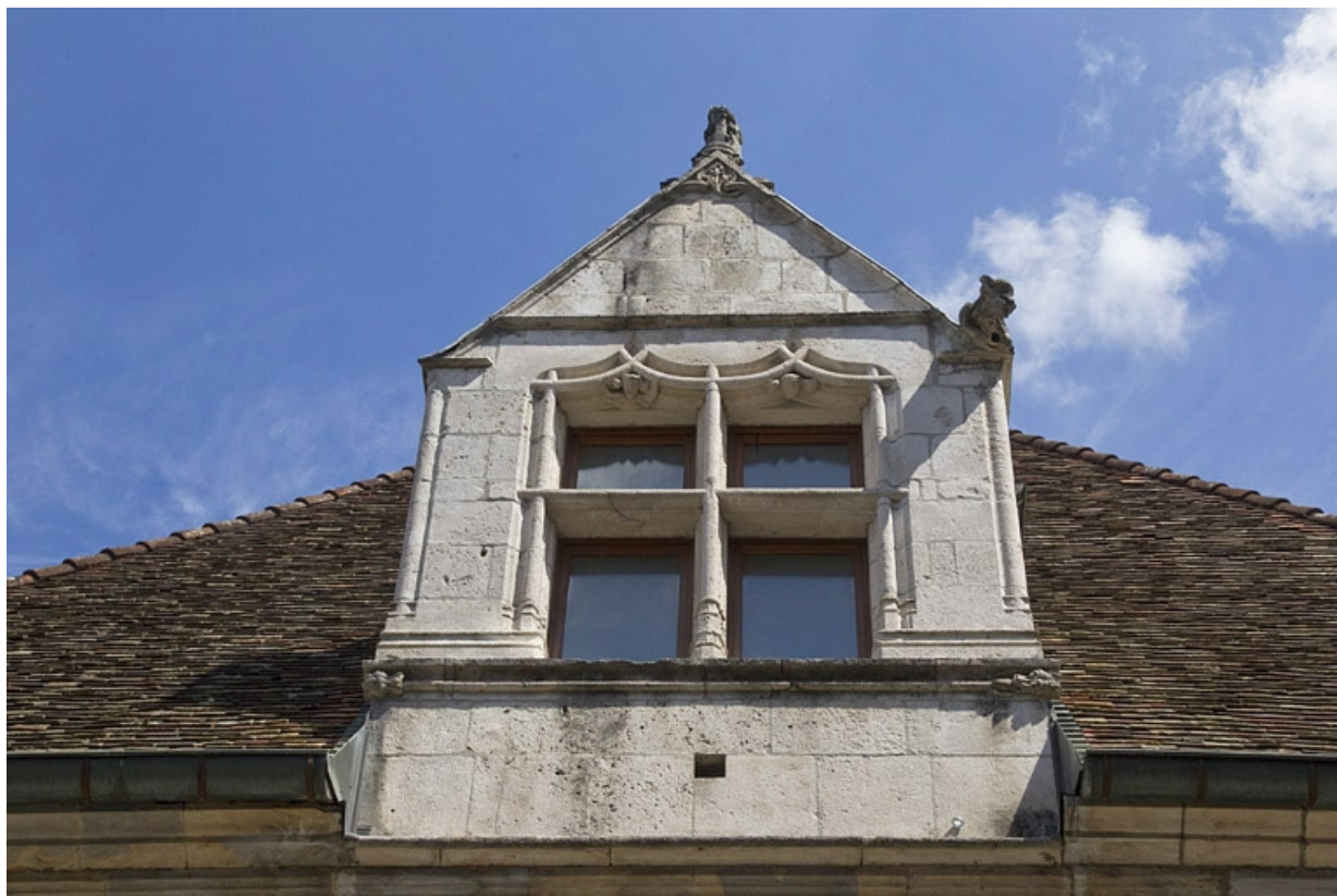
Façade antérieure, lucarne : vue d'ensemble.

25, Besançon, 19 rue Rivotte, lieudit : îlot Porte Rivotte