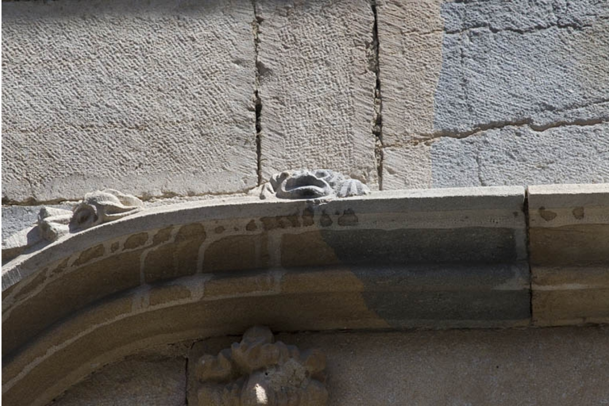
Façade antérieure, premier étage : détail de l'archivolte, partie gauche.

25, Besançon, 19 rue Rivotte, lieudit : îlot Porte Rivotte