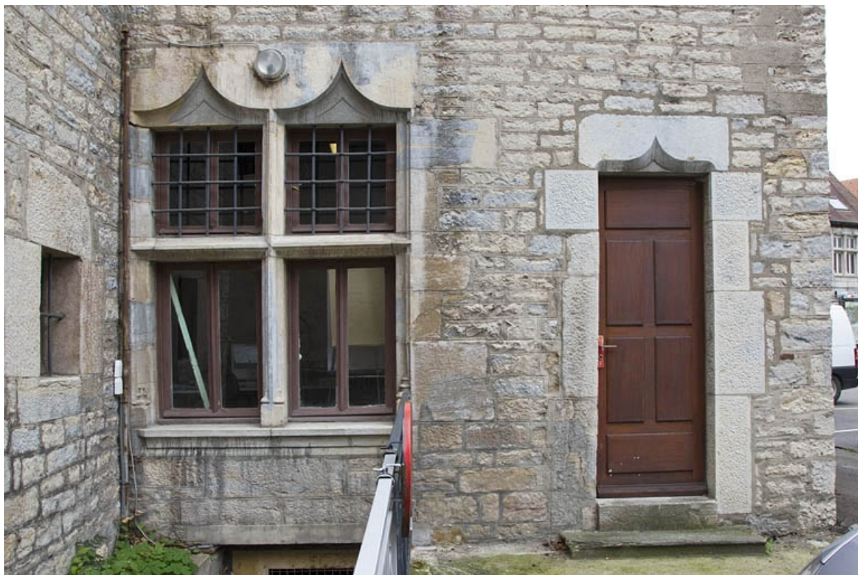
Façade postérieure : détail du rez-de-chaussée.

25, Besançon, 19 rue Rivotte, lieudit : îlot Porte Rivotte