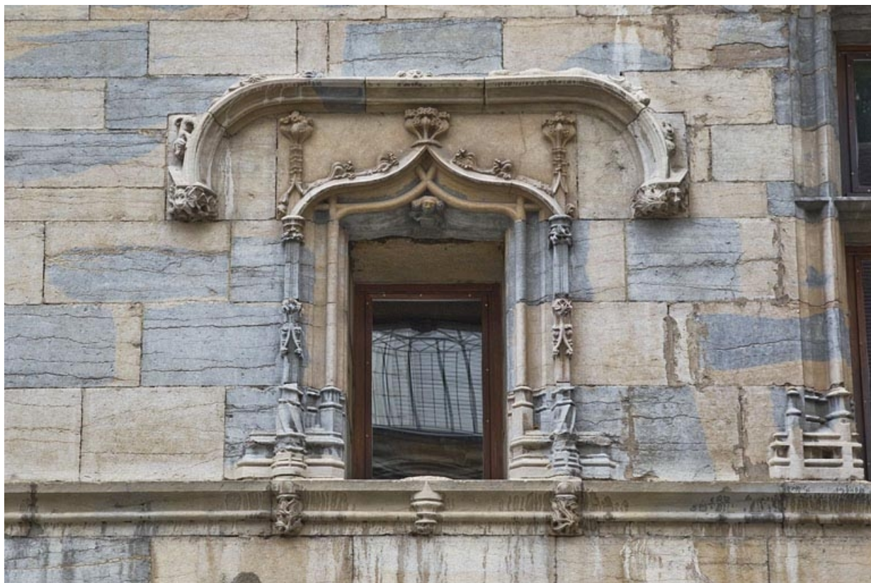
Façade antérieure, premier étage : détail de la fenêtre centrale, de face.

25, Besançon, 19 rue Rivotte, lieudit : îlot Porte Rivotte