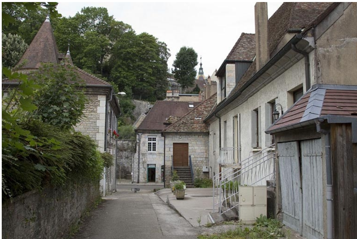
Façade latérale droite depuis le fond de la venelle.

25, Besançon, 19 rue Rivotte, lieudit : îlot Porte Rivotte