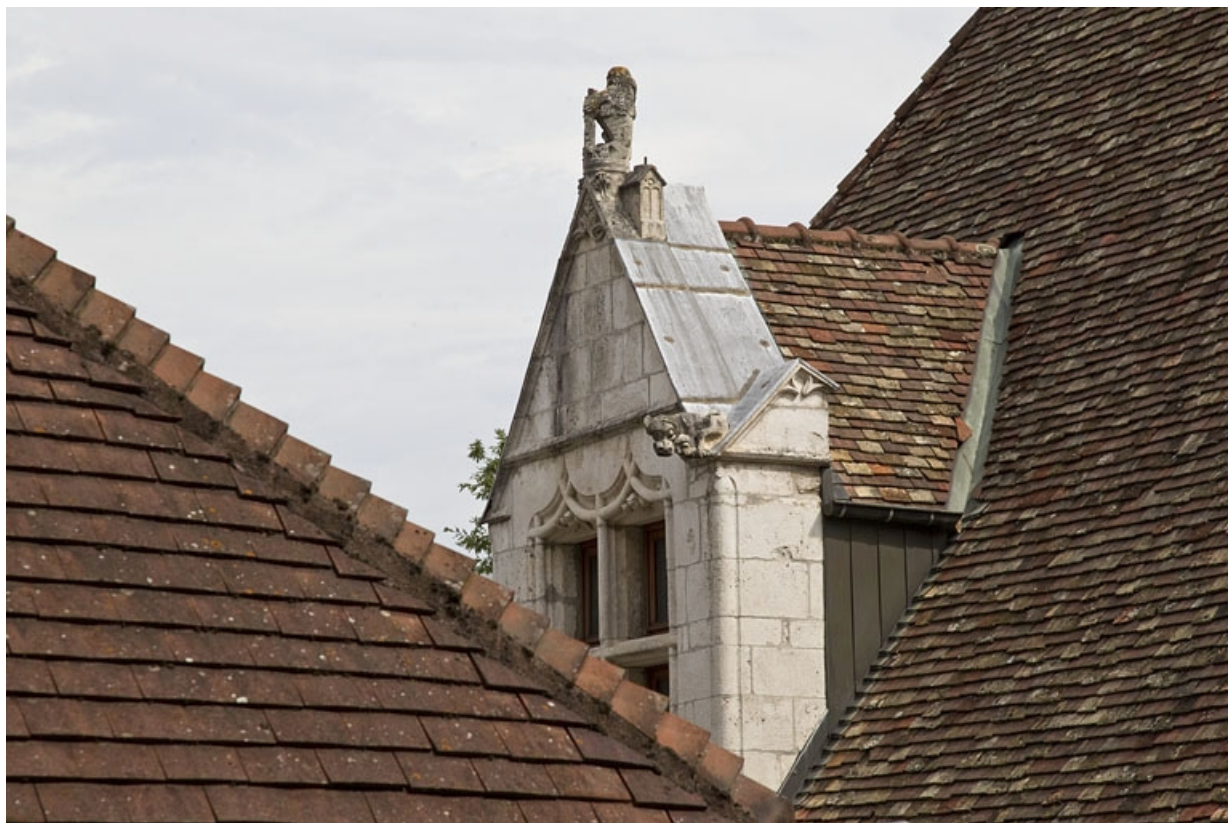
Façade antérieure : détail de la lucarne, de trois quarts droit.

25, Besançon, 19 rue Rivotte, lieudit : îlot Porte Rivotte