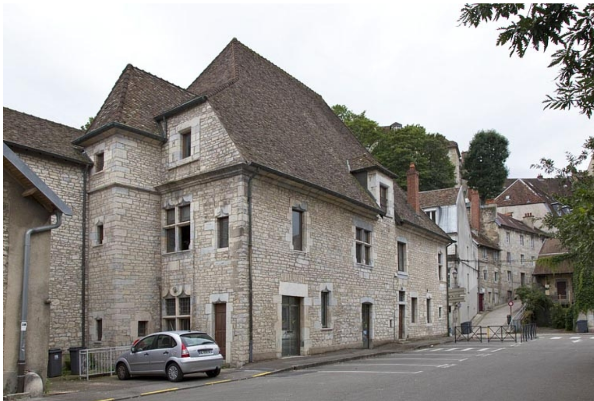
Façade latérale droite : de trois quarts gauche.

25, Besançon, 19 rue Rivotte, lieudit : îlot Porte Rivotte