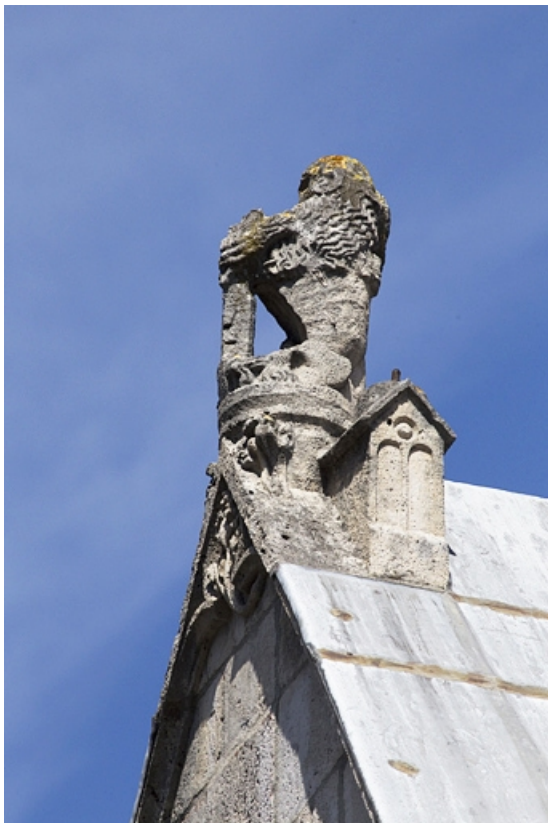
Façade antérieure, lucarne : détail de la sculpture ornant le pignon, de profil.

25, Besançon, 19 rue Rivotte, lieudit : îlot Porte Rivotte