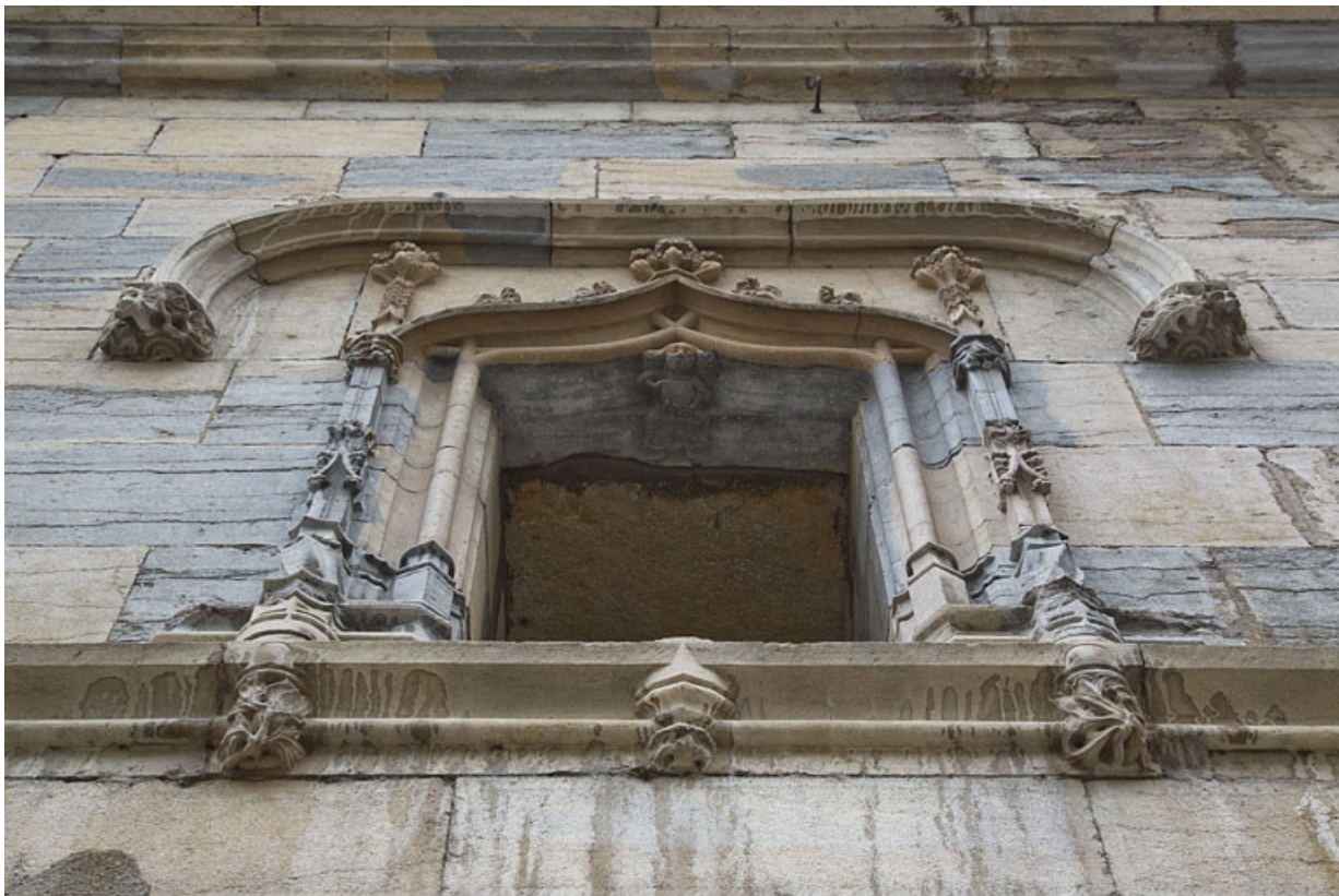
Façade antérieure, premier étage : détail de la fenêtre centrale, en contre-plongée.

25, Besançon, 19 rue Rivotte, lieudit : îlot Porte Rivotte