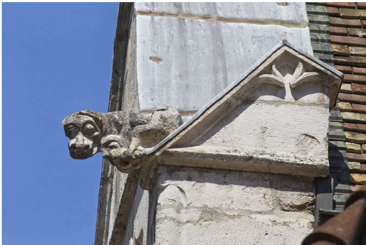
Façade antérieure, lucarne : détail d'une gargouille.

25, Besançon, 19 rue Rivotte, lieudit : îlot Porte Rivotte