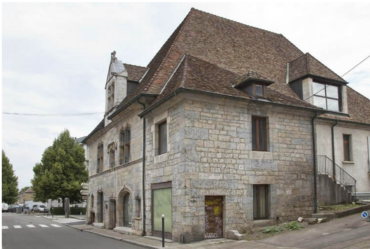
Vue d'ensemble rapprochée, de trois quarts droit.

25, Besançon, 19 rue Rivotte, lieudit : îlot Porte Rivotte