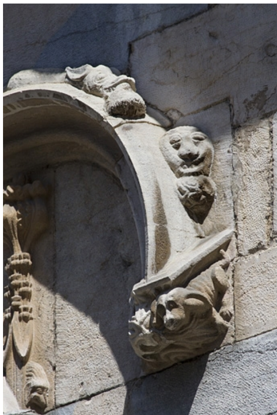
Façade antérieure, premier étage, baie centrale : détail de la partie droite de l'archivolte.

25, Besançon, 19 rue Rivotte, lieudit : îlot Porte Rivotte