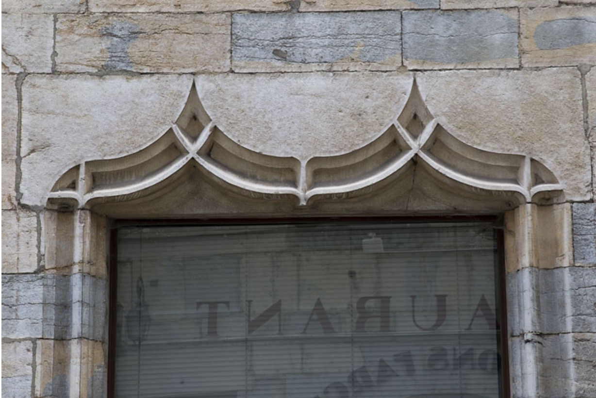
Façade antérieure : détail de l'arc en accolade de la baie à gauche l'ancienne entrée.

25, Besançon, 19 rue Rivotte, lieudit : îlot Porte Rivotte