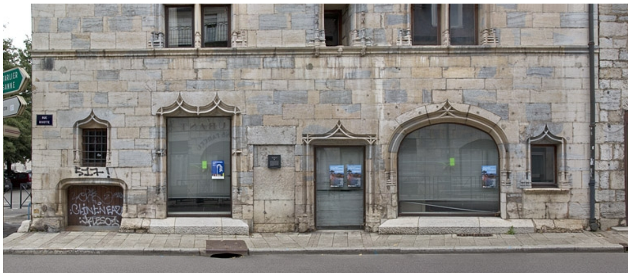
Façade rue Rivotte, détail du rez-de-chaussée, de face.

25, Besançon, 19 rue Rivotte, lieudit : îlot Porte Rivotte