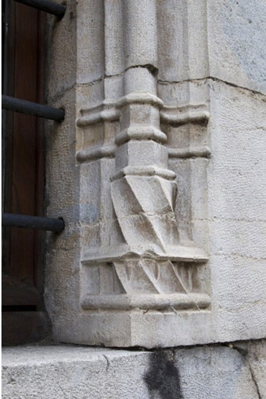
Façade antérieure, fenêtre au-dessus de l'entrée de cave : détail de la base prismatique droite. 25, Besançon, 19 rue Rivotte, lieudit : îlot Porte Rivotte