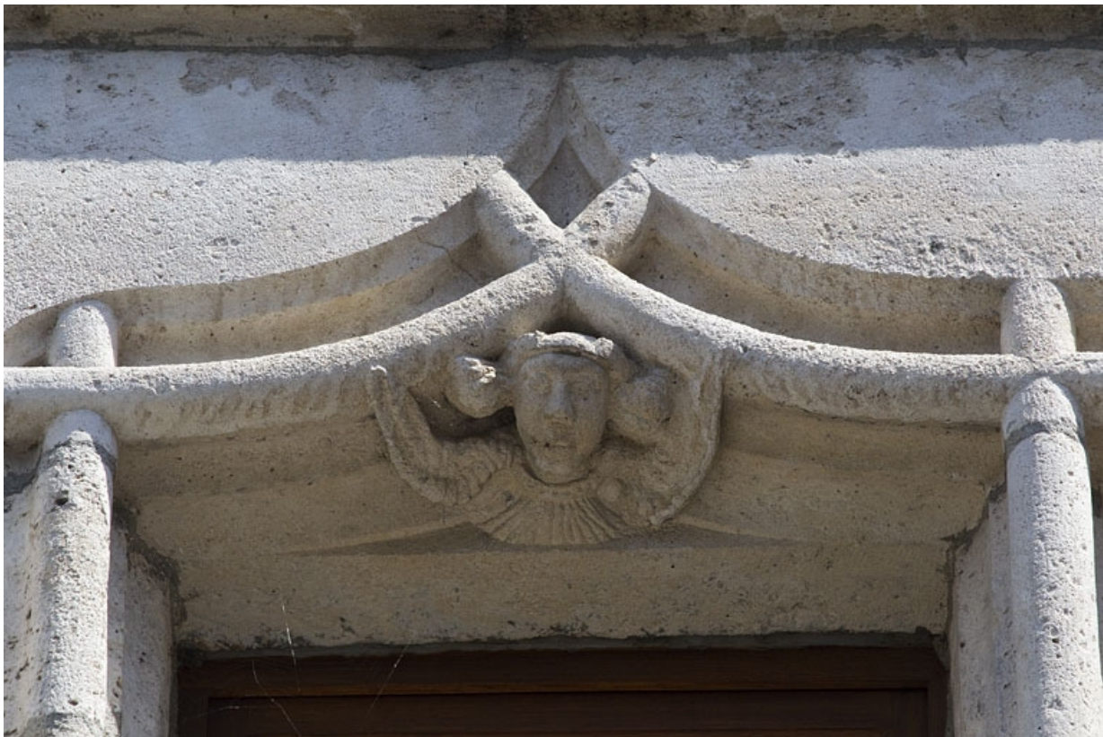
Façade antérieure, lucarne : détail de l'accolade, partie droite.

25, Besançon, 19 rue Rivotte, lieudit : îlot Porte Rivotte