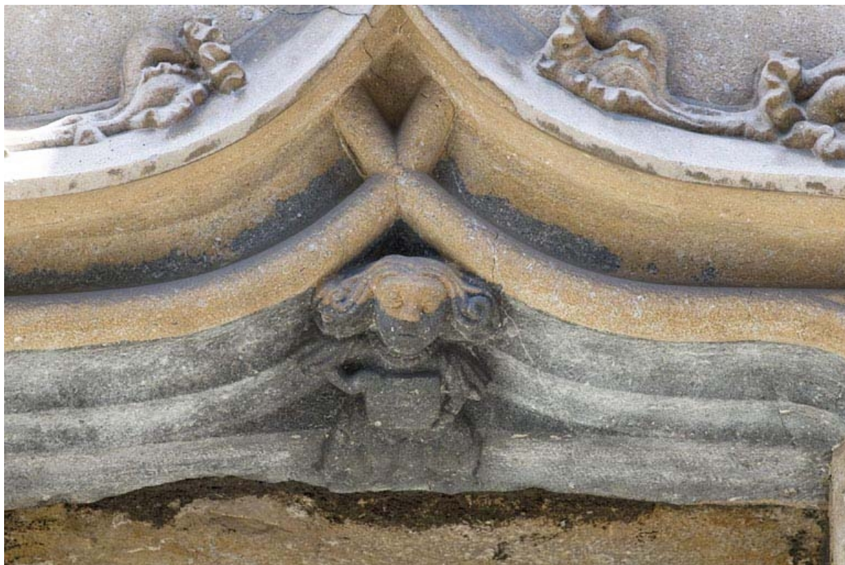
Façade antérieure, premier étage : détail de l'accolade de la baie centrale.

25, Besançon, 19 rue Rivotte, lieudit : îlot Porte Rivotte