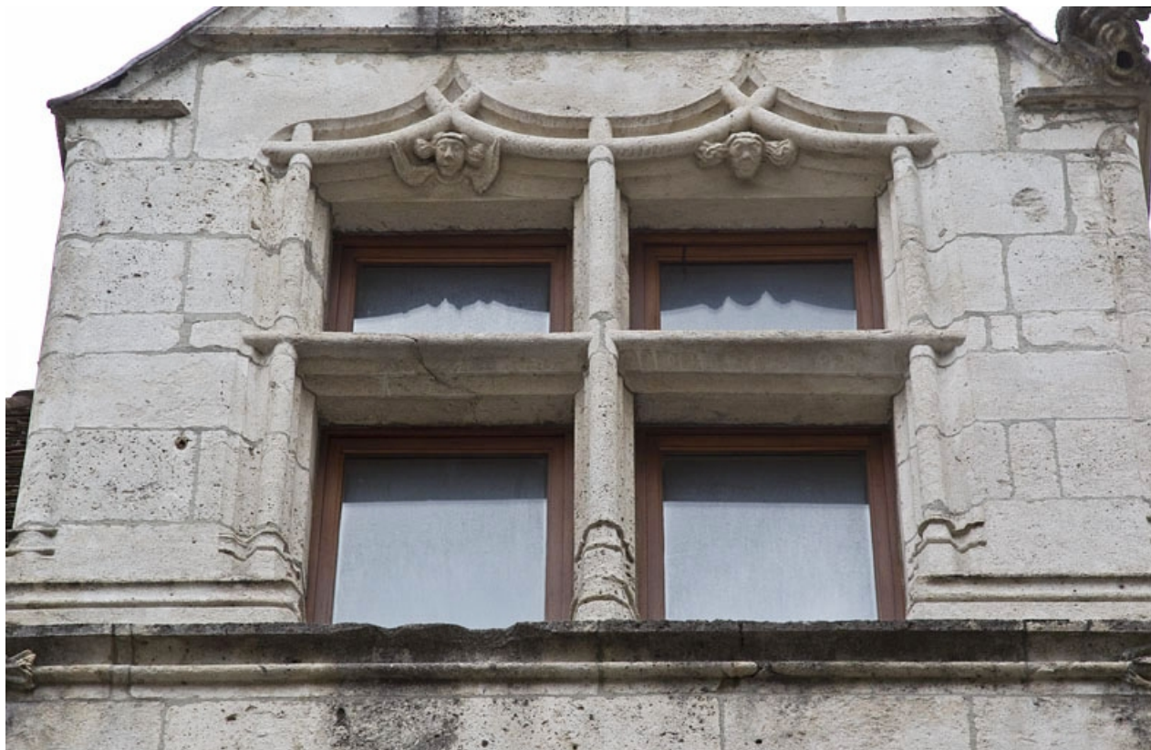
Façade antérieure, lucarne : détail de la fenêtre.

25, Besançon, 19 rue Rivotte, lieudit : îlot Porte Rivotte