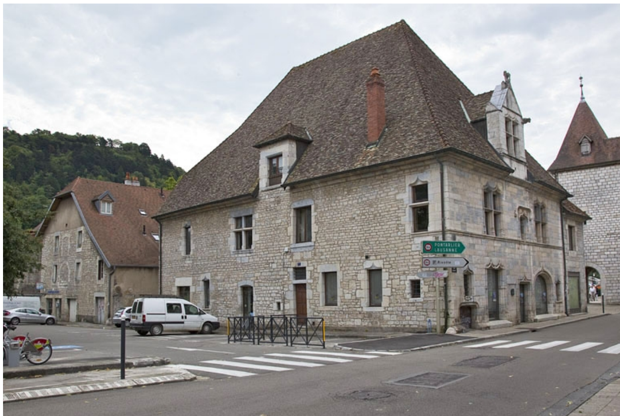
Vue d'ensemble rapprochée, de trois quarts gauche.

25, Besançon, 19 rue Rivotte, lieudit : îlot Porte Rivotte