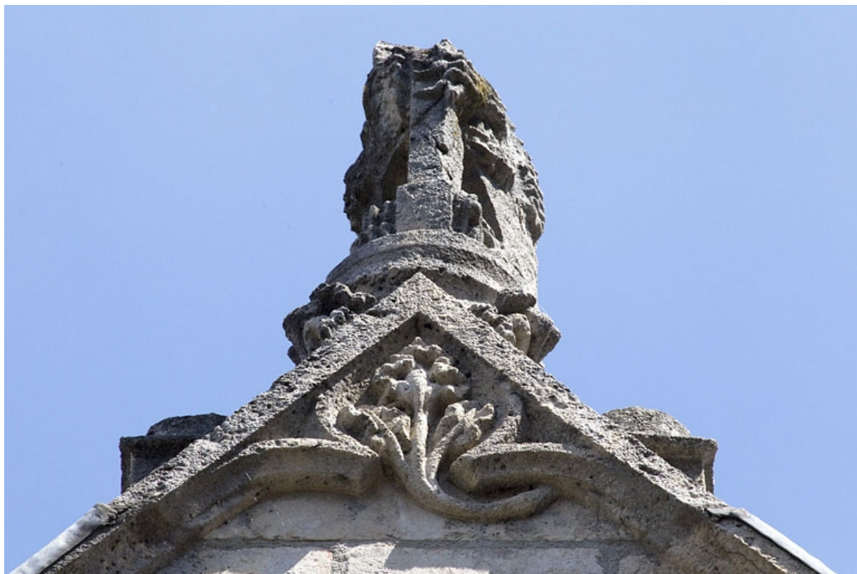
Façade antérieure, lucarne : détail de la sculpture ornant la pignon, de face.

25, Besançon, 19 rue Rivotte, lieudit : îlot Porte Rivotte