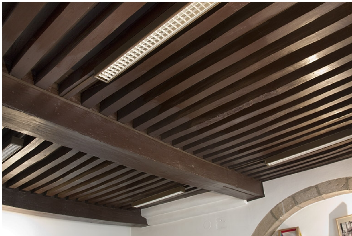
Intérieur, rez-de-chaussée : détail d'un plafond à la française.

25, Besançon, 19 rue Rivotte, lieudit : îlot Porte Rivotte