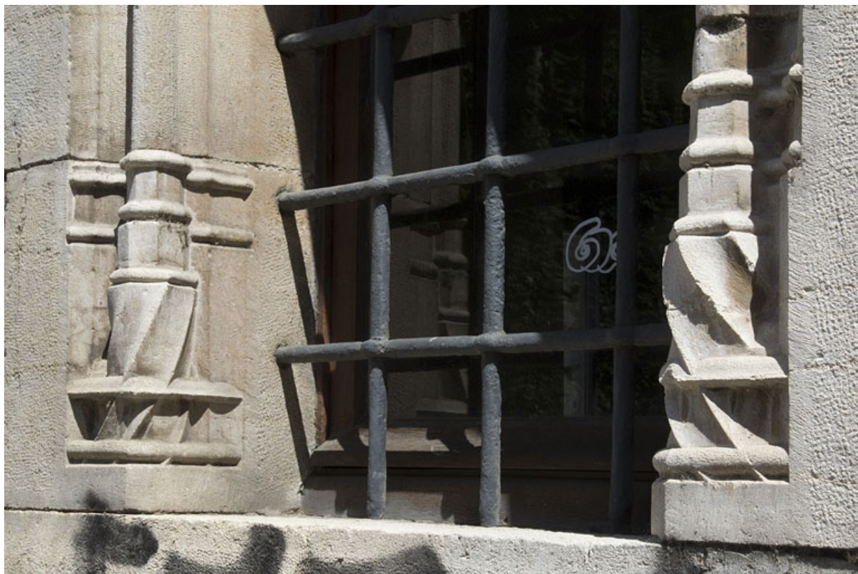
Façade antérieure, fenêtre au-dessus de l'entrée de cave : détail des bases prismatiques.

25, Besançon, 19 rue Rivotte, lieudit : îlot Porte Rivotte