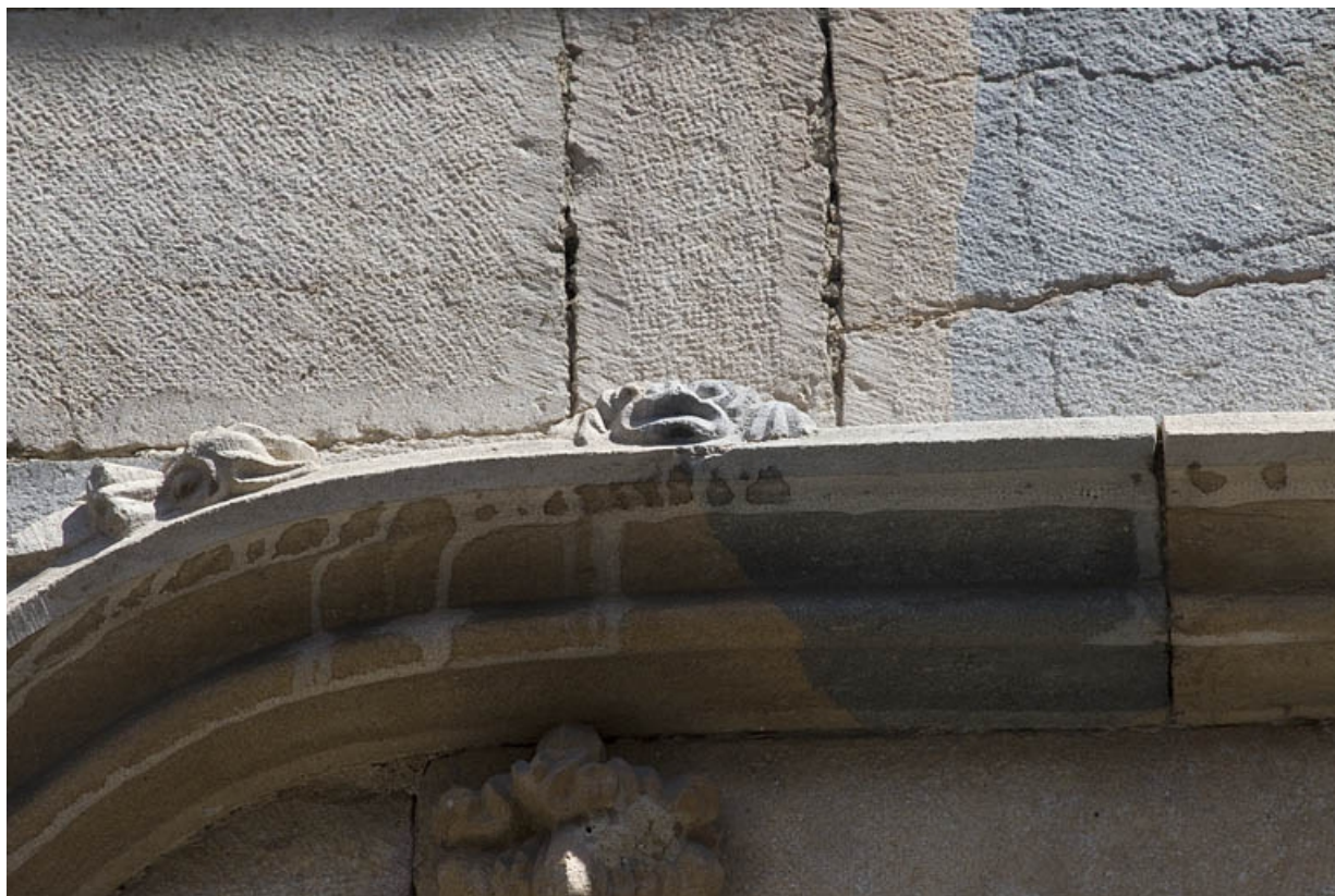
Façade antérieure, premier étage : détail de l'archivolte, partie gauche.

25, Besançon, 19 rue Rivotte, lieudit : îlot Porte Rivotte