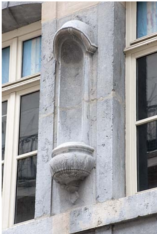
Façade sur rue : détail de la niche.

25, Besançon, 16 rue Courbet, lieudit : îlot Carmélites