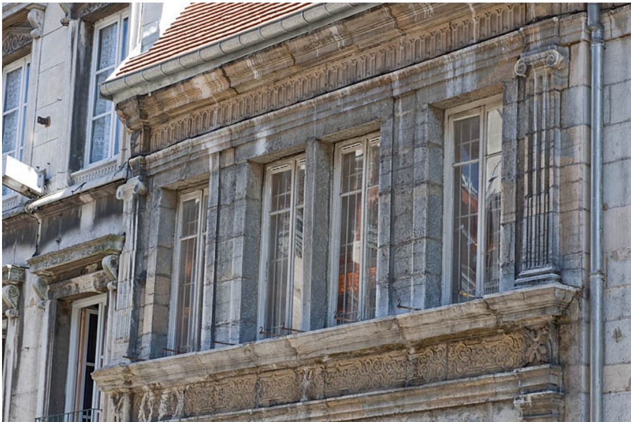
Façade sur rue : premier étage, partie gauche.

25, Besançon, 3bis, 5 rue des Granges, lieudit : îlot Carmélites