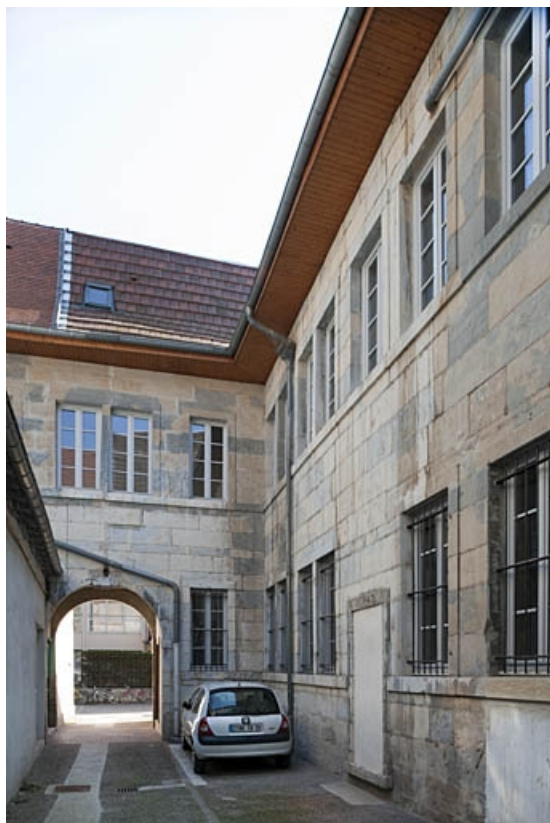
Vue du passage cocher depuis le fond de la cour.

25, Besançon, 3bis, 5 rue des Granges, lieudit : îlot Carmélites