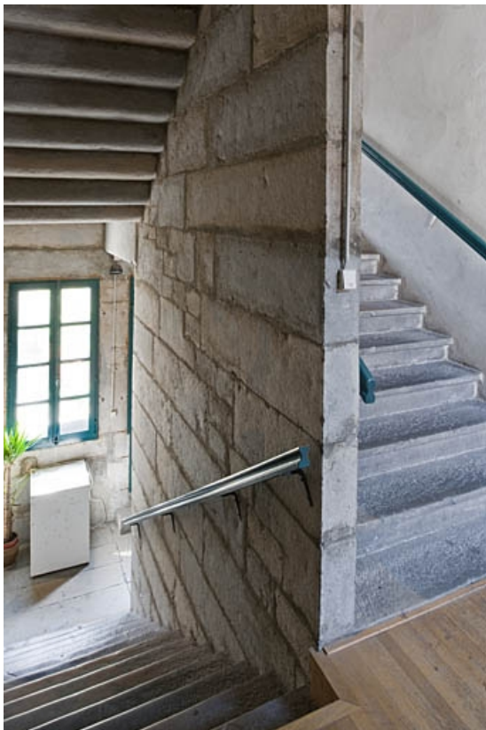
Intérieur : escalier principal en pierre.

25, Besançon, 3bis, 5 rue des Granges, lieudit : îlot Carmélites