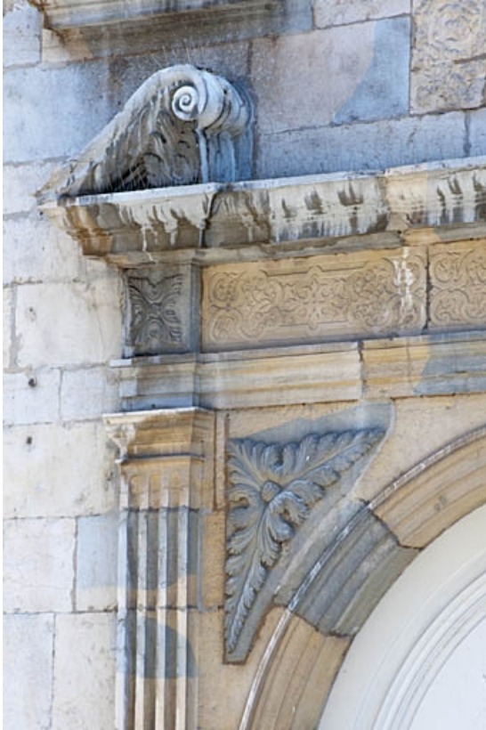
Façade sur rue : détail de l'angle supérieur gauche de l'entrée cochère. 25, Besançon, 3bis, 5 rue des Granges, lieudit : îlot Carmélites