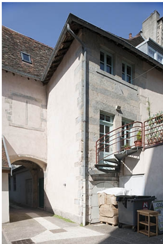
Façade postérieure du logis principal, partie droite.

25, Besançon, 3bis, 5 rue des Granges, lieudit : îlot Carmélites