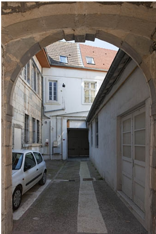
Vue de la cour depuis le passage cocher.

25, Besançon, 3bis, 5 rue des Granges, lieudit : îlot Carmélites