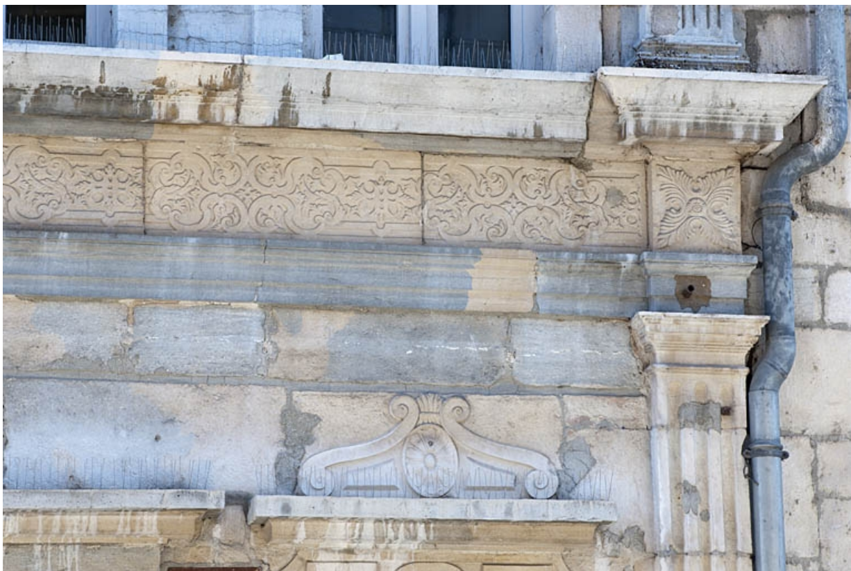
Façade sur rue : détail de la frise entre le rez-de-chaussée et le premier étage.

25, Besançon, 3bis, 5 rue des Granges, lieudit : îlot Carmélites