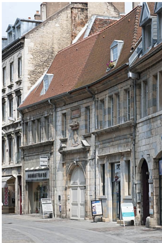
Façade sur rue : vue d'ensemble de trois quarts droit.

25, Besançon, 3bis, 5 rue des Granges, lieudit : îlot Carmélites