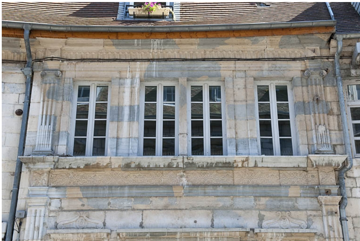
Façade sur rue : partie gauche, détail des fenêtres du premier étage.

25, Besançon, 3bis, 5 rue des Granges, lieudit : îlot Carmélites