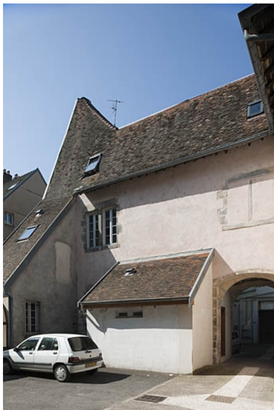
Façade postérieure du logis principal, partie gauche.

25, Besançon, 3bis, 5 rue des Granges, lieudit : îlot Carmélites