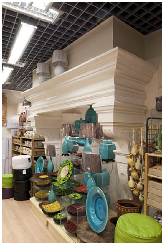
Intérieur : détail d'une cheminée du rez-de-chaussée.

25, Besançon, 3bis, 5 rue des Granges, lieudit : îlot Carmélites