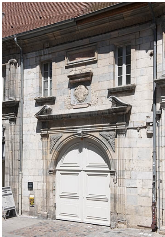
Façade sur rue : vue d'ensemble de la partie centrale.

25, Besançon, 3bis, 5 rue des Granges, lieudit : îlot Carmélites