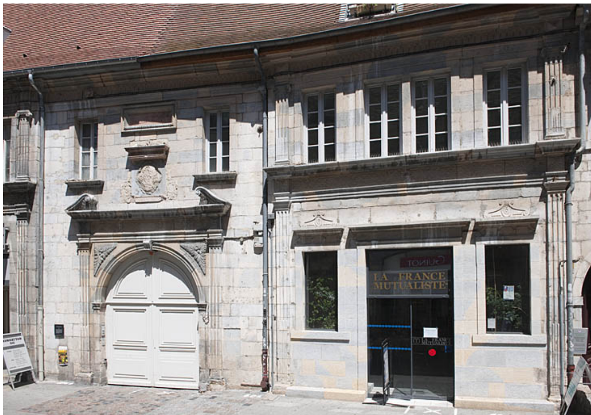
Façade sur rue : vue d'ensemble de la partie centrale et de la partie gauche. 25, Besançon, 3bis, 5 rue des Granges, lieudit : îlot Carmélites