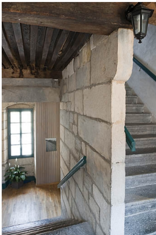
Intérieur : escalier principal en pierre, dernière volée.

25, Besançon, 3bis, 5 rue des Granges, lieudit : îlot Carmélites