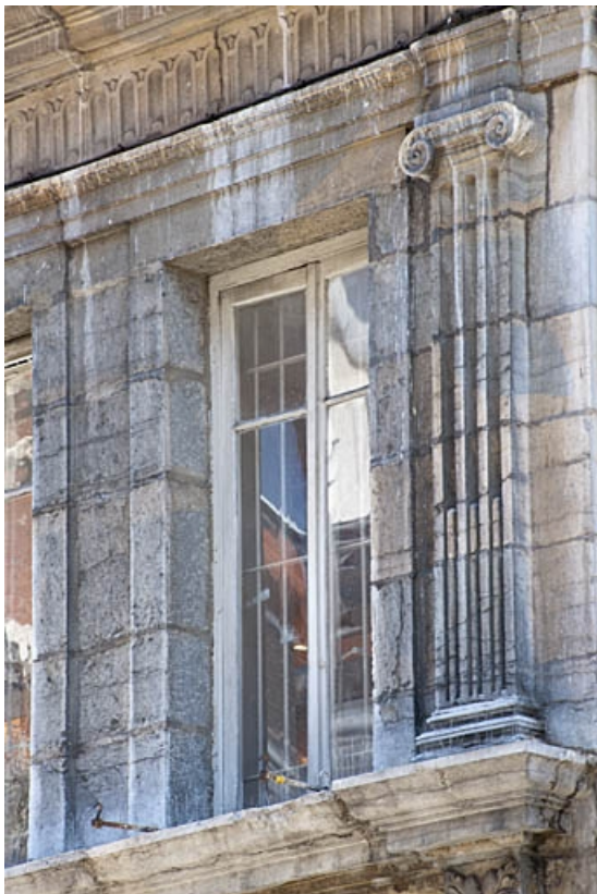
Façade sur rue : détail d'un pilastre ionique du premier étage.

25, Besançon, 3bis, 5 rue des Granges, lieudit : îlot Carmélites