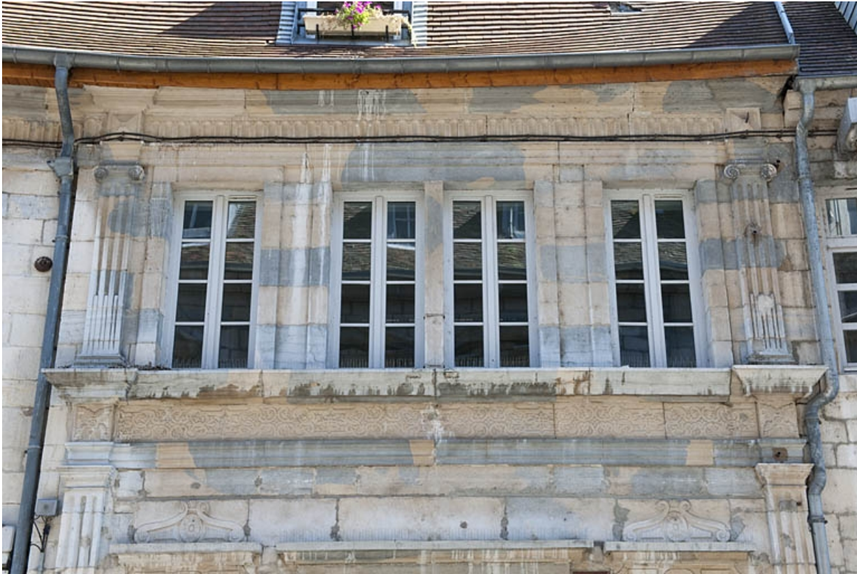
Façade sur rue : partie gauche, détail des fenêtres du premier étage.

25, Besançon, 3bis, 5 rue des Granges, lieudit : îlot Carmélites