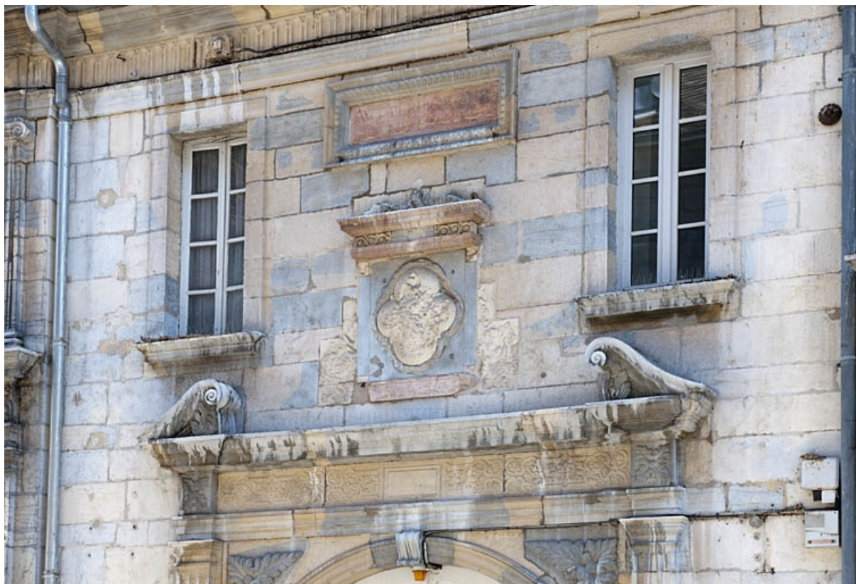
Façade sur rue : détail du décor au-dessus de la porte cochère.

25, Besançon, 3bis, 5 rue des Granges, lieudit : îlot Carmélites