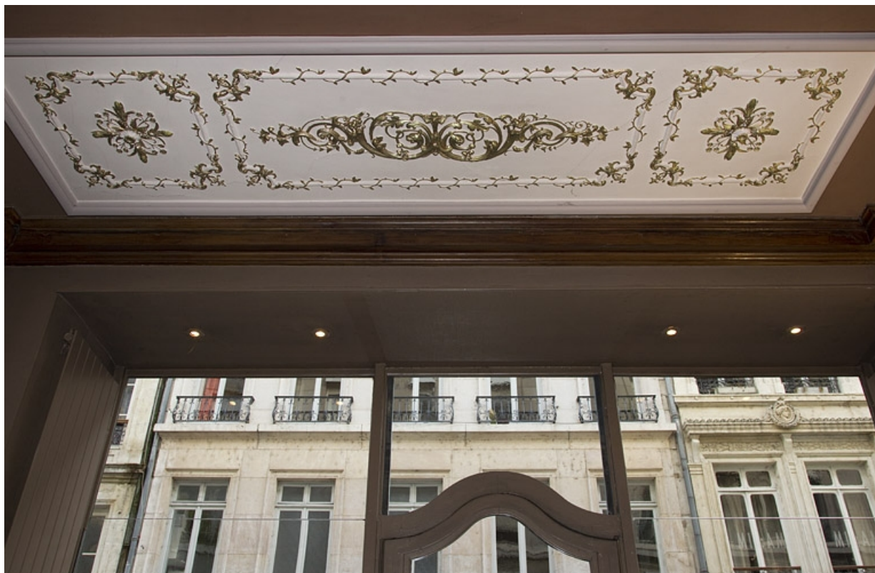
Logis principal, pharmacie : détail du décor du plafond, côté vitrine.

25, Besançon, 7 rue Morand, lieudit : îlot Morand