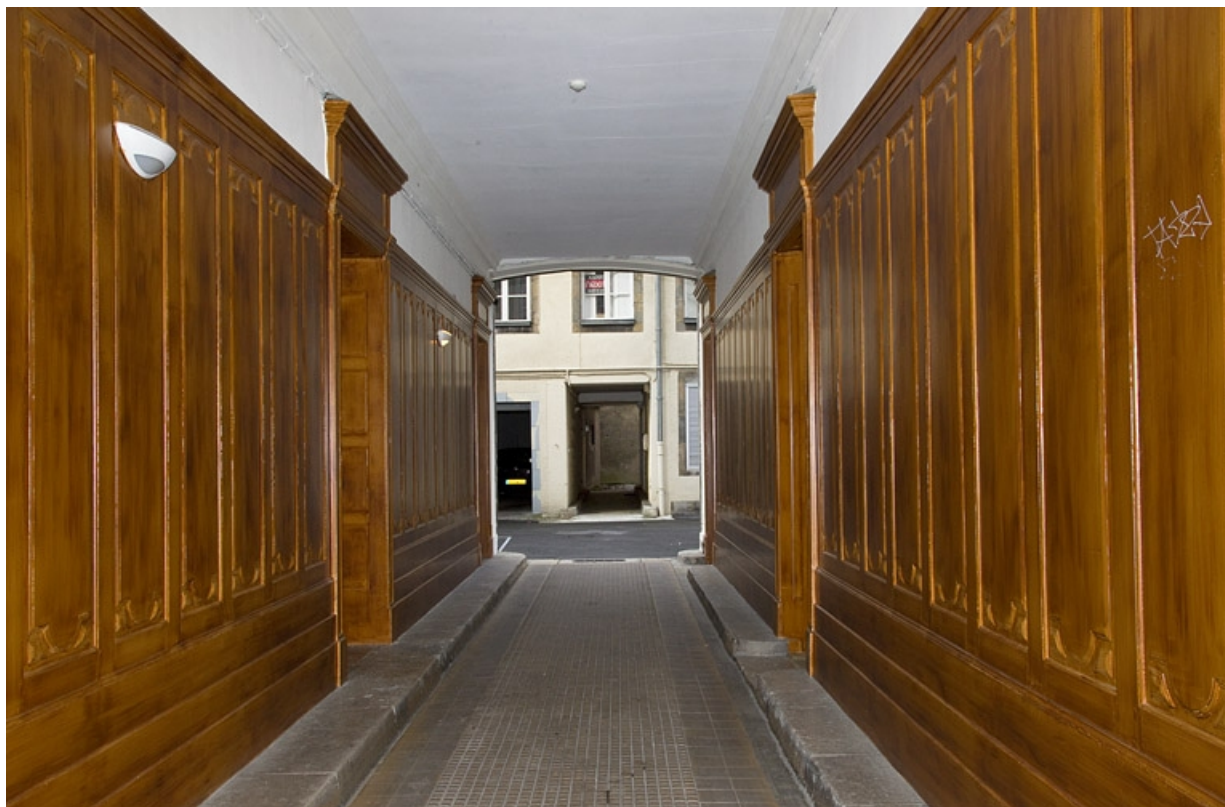
Logis principal, vue d'ensemble du passage cocher depuis l'entrée.

25, Besançon, 7 rue Morand, lieudit : îlot Morand