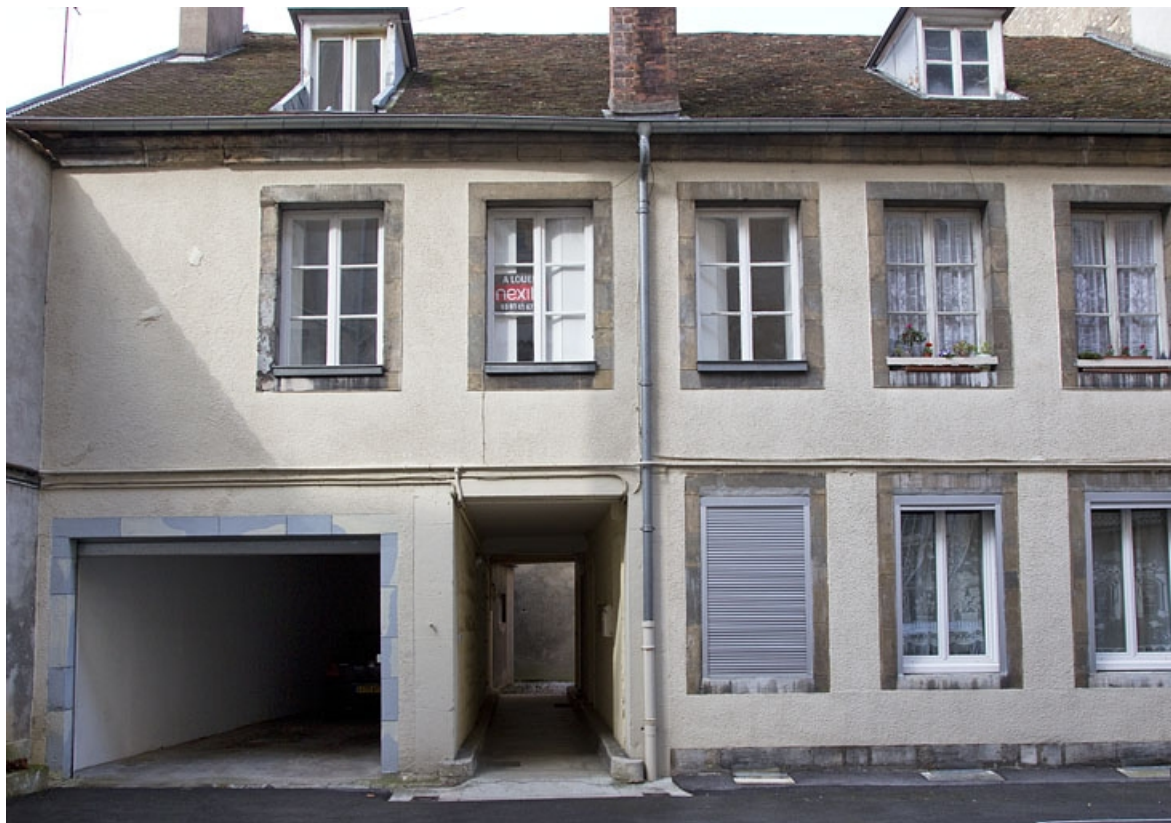
Logis secondaire, façade antérieure, de face. 25, Besançon, 7 rue Morand, lieudit : îlot Morand