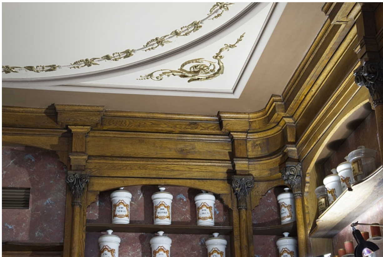
Logis principal, pharmacie : détail d'un angle du plafond et des boiseries de la boutique.

25, Besançon, 7 rue Morand, lieudit : îlot Morand