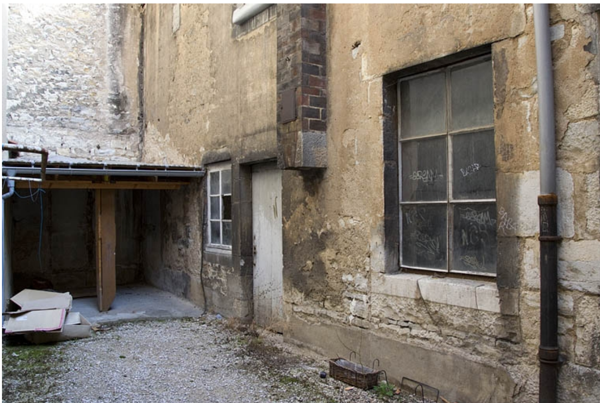
Logis secondaire, détail de la façade postérieure, de trois quarts droit.

25, Besançon, 7 rue Morand, lieudit : îlot Morand