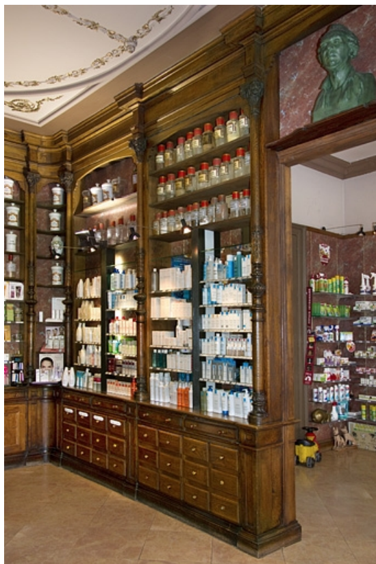
Logis principal, pharmacie : détail des boiseries, partie droite, depuis l'entrée de la boutique. 25, Besançon, 7 rue Morand, lieudit : îlot Morand