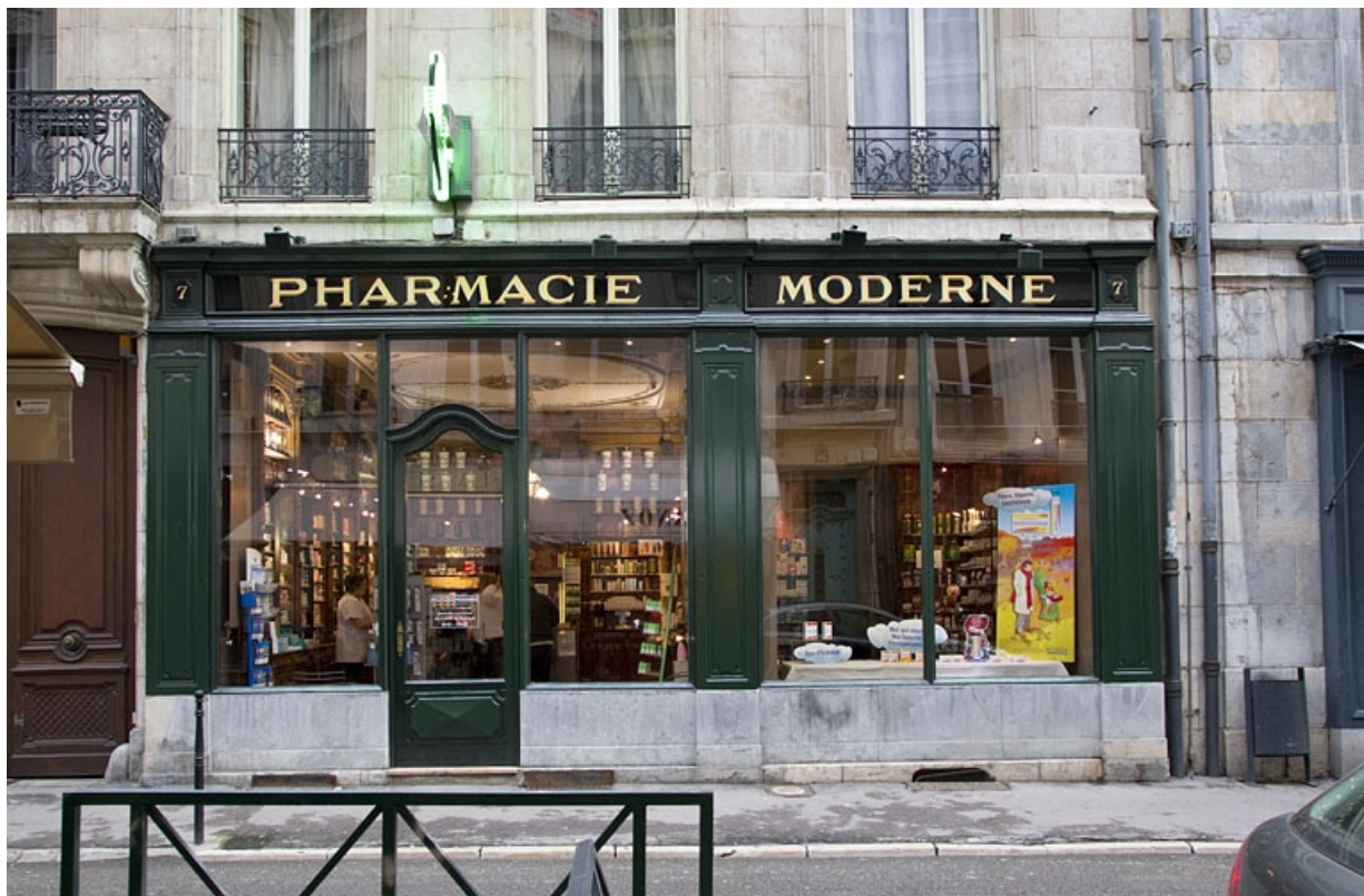
Logis principal : détail de la devanture de la pharmacie, de face.

25, Besançon, 7 rue Morand, lieudit : îlot Morand