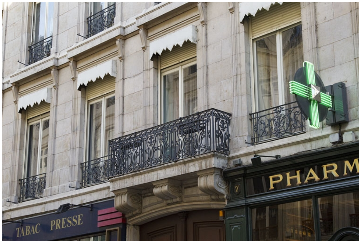
Logis principal, façade antérieure : détail des garde-corps et du balcon du premier étage.

25, Besançon, 7 rue Morand, lieudit : îlot Morand