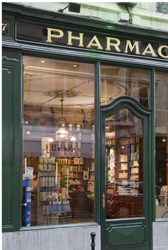
Logis principal : détail de la devanture de la pharmacie, partie gauche.

25, Besançon, 7 rue Morand, lieu-dit : îlot Morand