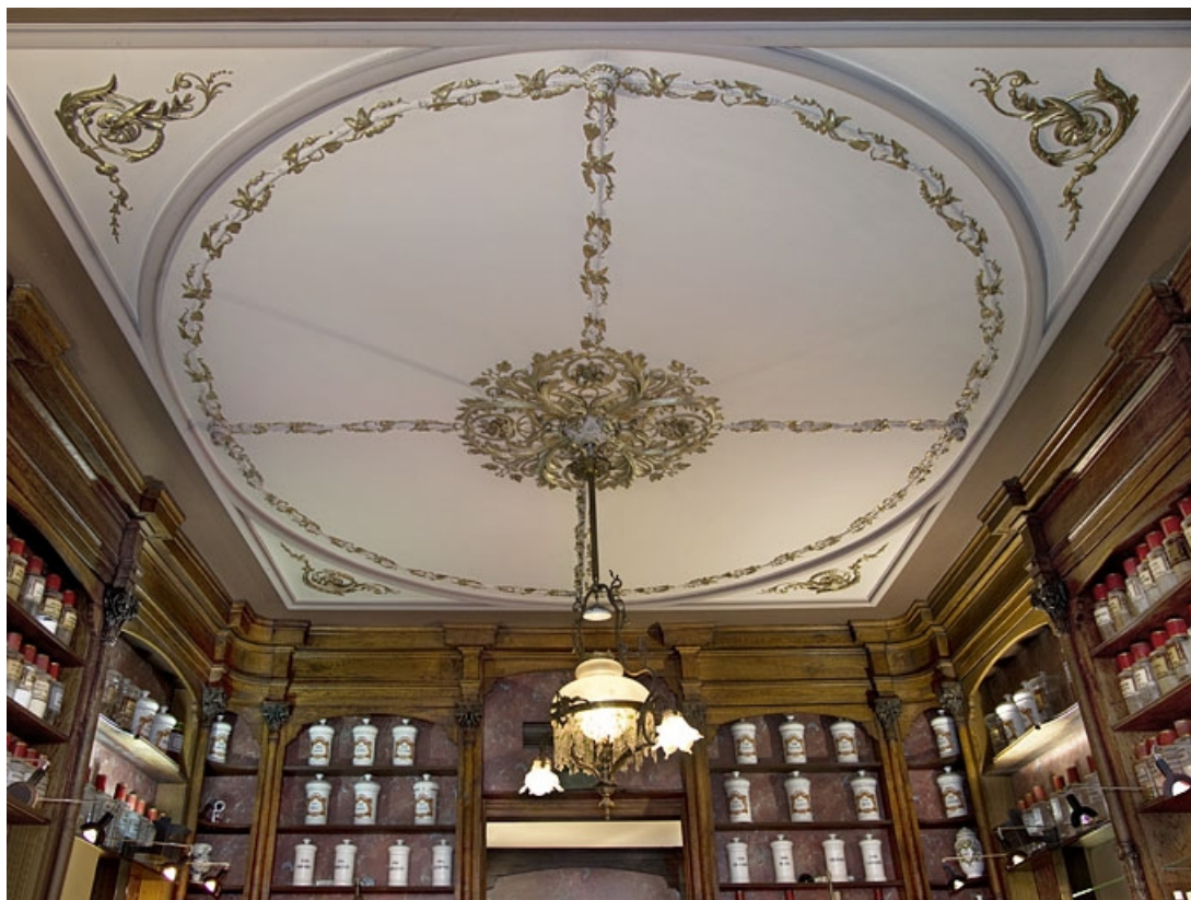
Logis principal, intérieur : vue d'ensemble du plafond de la pharmacie.

25, Besançon, 7 rue Morand, lieudit : îlot Morand