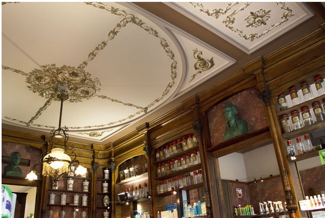
Logis principal, pharmacie : détail du plafond et des boiseries de la boutique, depuis le fond : de trois quarts gauche. 25, Besançon, 7 rue Morand, lieu dit : îlot Morand