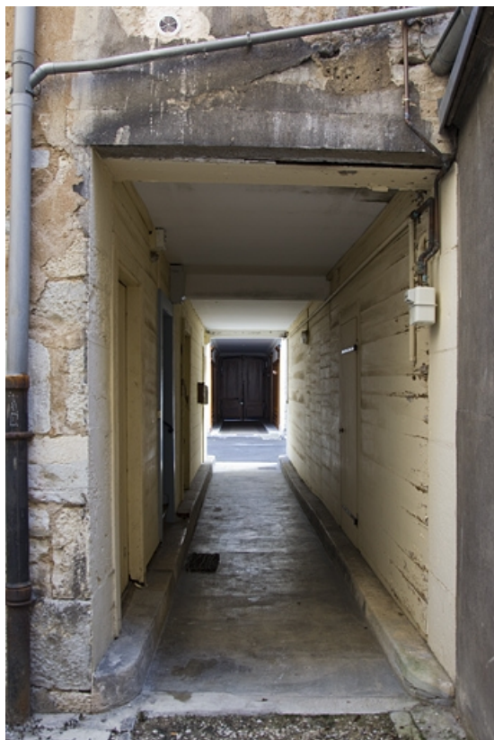
Vue des passages cochers en enfilade depuis la deuxième cour.

25, Besançon, 7 rue Morand, lieudit : îlot Morand