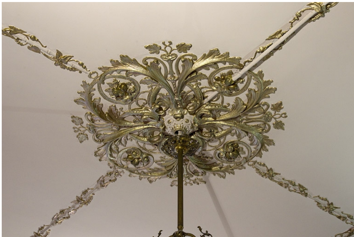
Logis principal, pharmacie : détail de la rosace du plafond.

25, Besançon, 7 rue Morand, lieudit : îlot Morand