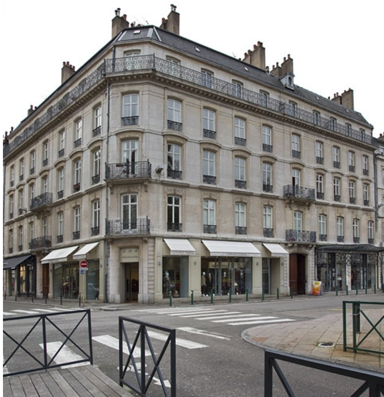
Vue d'ensemble depuis le carrefour des deux rues.

25, Besançon, 15 rue Proudhon, lieudit : îlot Morand