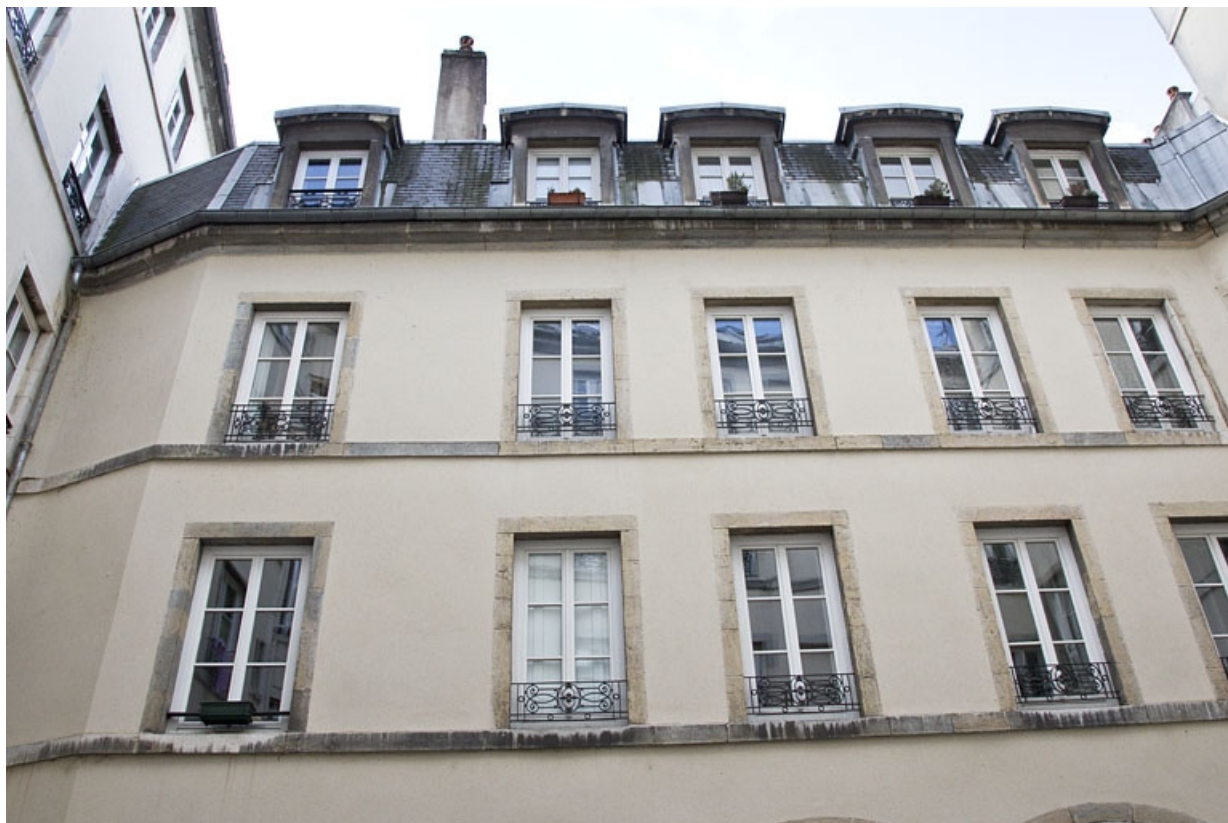
Logis secondaire, façade antérieure : détail des étages, de face.

25, Besançon, 15 rue Proudhon, lieudit : îlot Morand