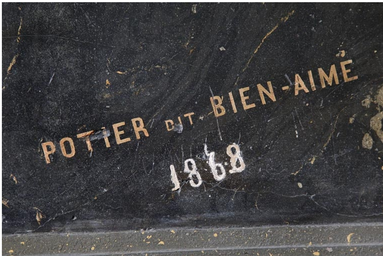
Logis principal, passage cocher côté rue Proudhon : décor en faux marbre, détail de la signature du stucateur. 25, Besançon, 15 rue Proudhon, lieudit : îlot Morand