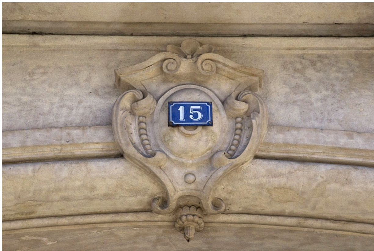
Logis principal, façade antérieure, portail d'entrée côté rue Proudhon : détail de la clé de l'arc. 25, Besançon, 15 rue Proudhon, lieudit : îlot Morand