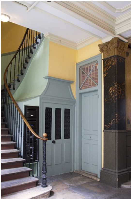
Logis principal, détail du départ de l'escalier à droite du passage cocher côté rue Proudhon. 25, Besançon, 15 rue Proudhon, lieudit : îlot Morand