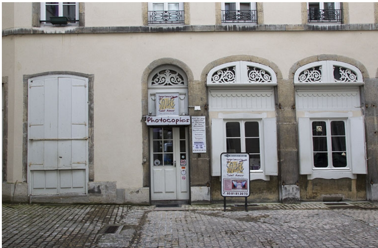
Logis secondaire, façade antérieure : détail du rez-de-chaussée.

25, Besançon, 15 rue Proudhon, lieudit : îlot Morand