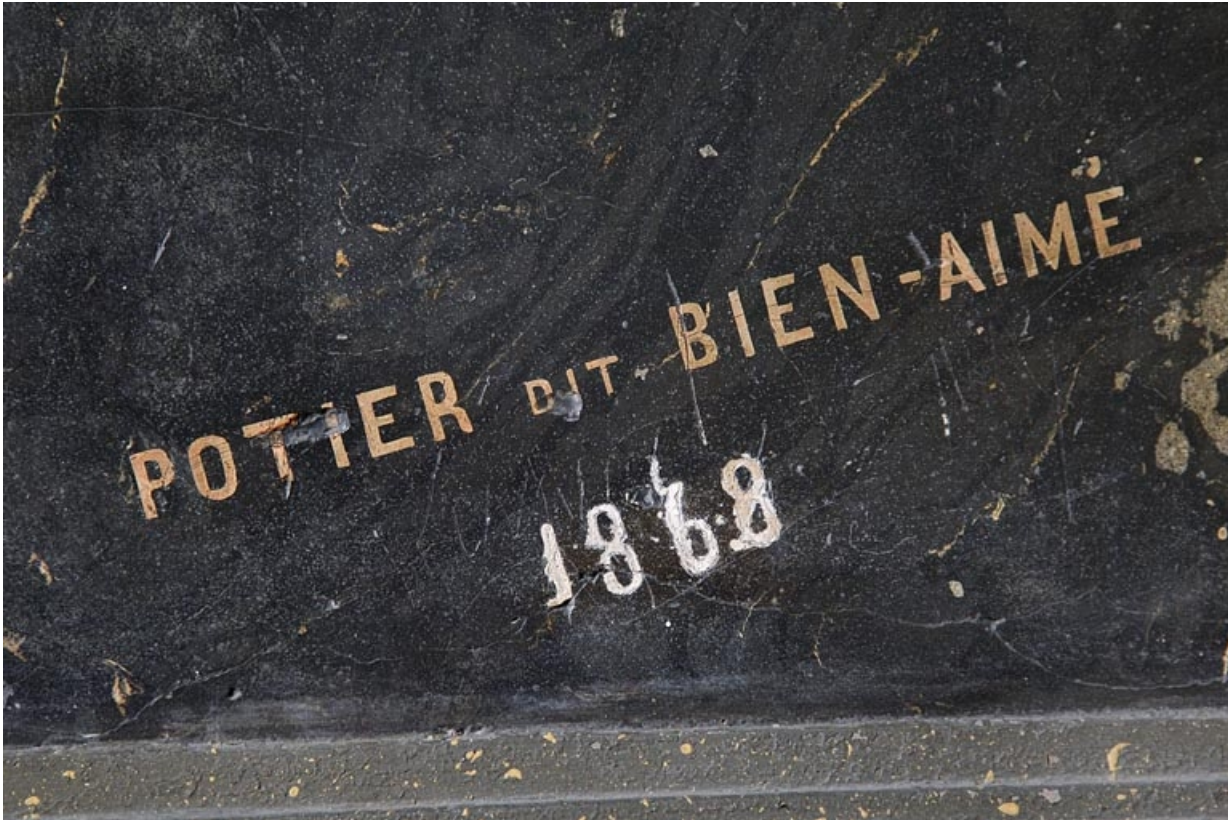
Logis principal, passage cocher côté rue Proudhon : décor en faux marbre, détail de la signature du stucateur. 25, Besançon, 15 rue Proudhon, lieudit : îlot Morand