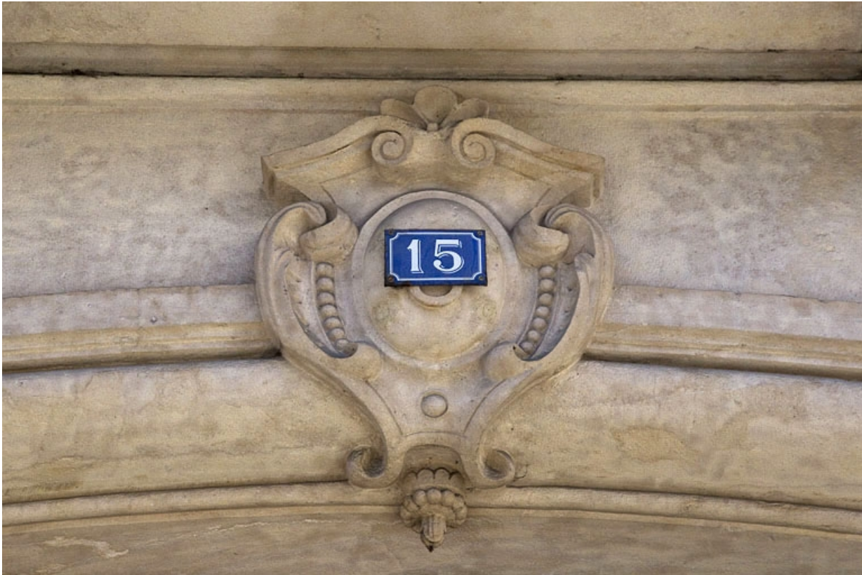
Logis principal, façade antérieure, portail d'entrée côté rue Proudhon : détail de la clé de l'arc. 25, Besançon, 15 rue Proudhon, lieudit : îlot Morand