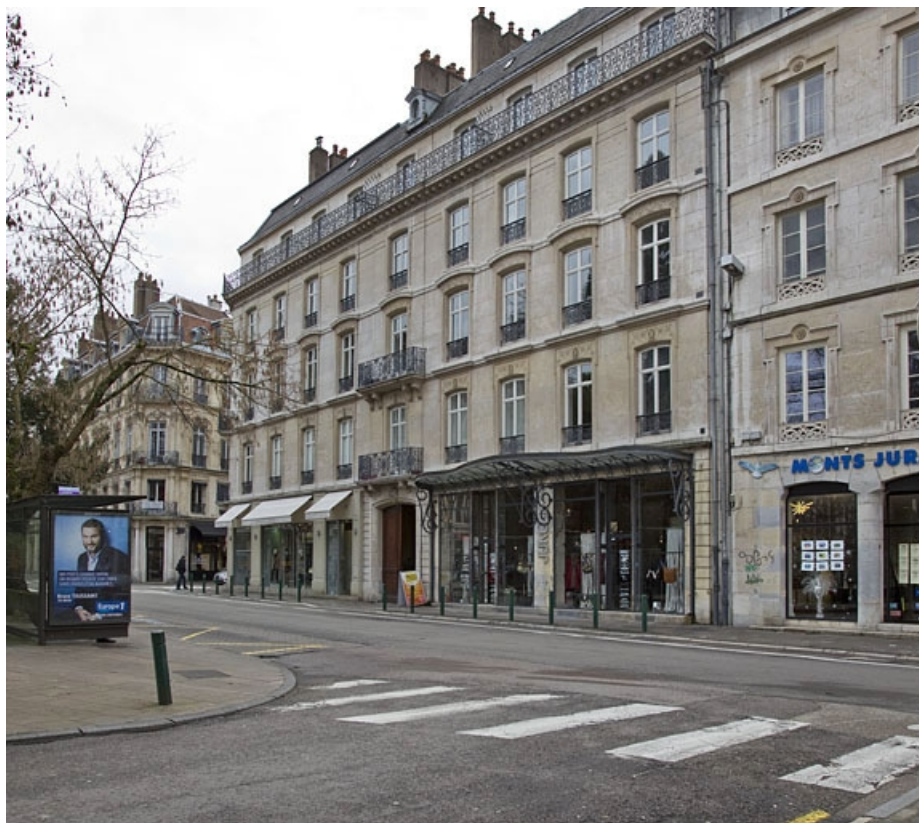
Logis principal, façade sur la rue Proudhon, de trois quarts droit.

25, Besançon, 15 rue Proudhon, lieudit : îlot Morand