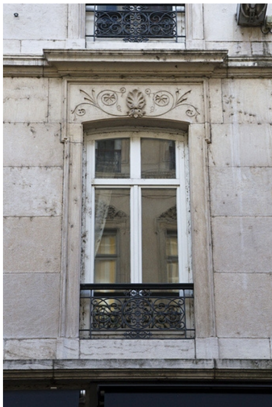
Logis principal, façade antérieure : détail d'une fenêtre du premier étage.

25, Besançon, 15 rue Proudhon, lieudit : îlot Morand