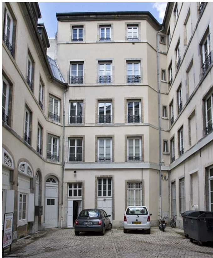
Logis principal, aile sur cour, de face.

25, Besançon, 15 rue Proudhon, lieudit : îlot Morand