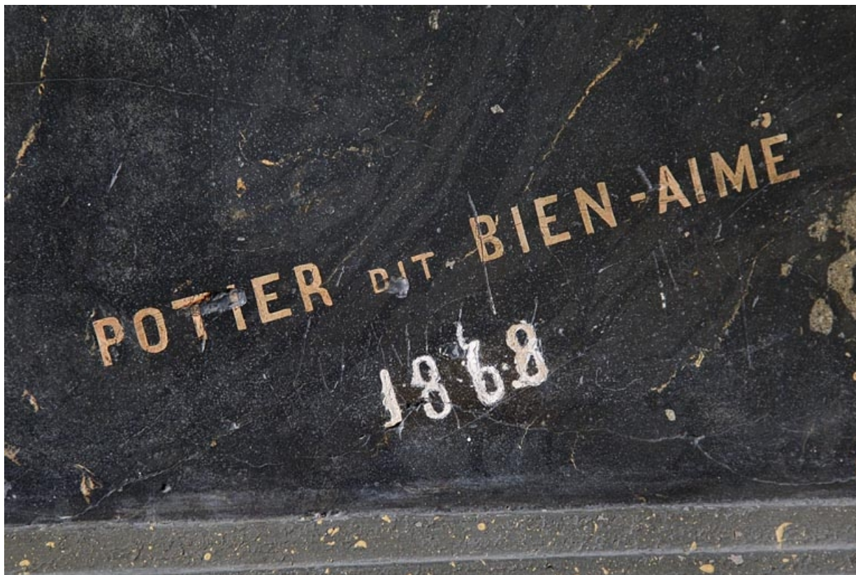
Logis principal, passage cocher côté rue Proudhon : décor en faux marbre, détail de la signature du stucateur. 25, Besançon, 15 rue Proudhon, lieudit : îlot Morand