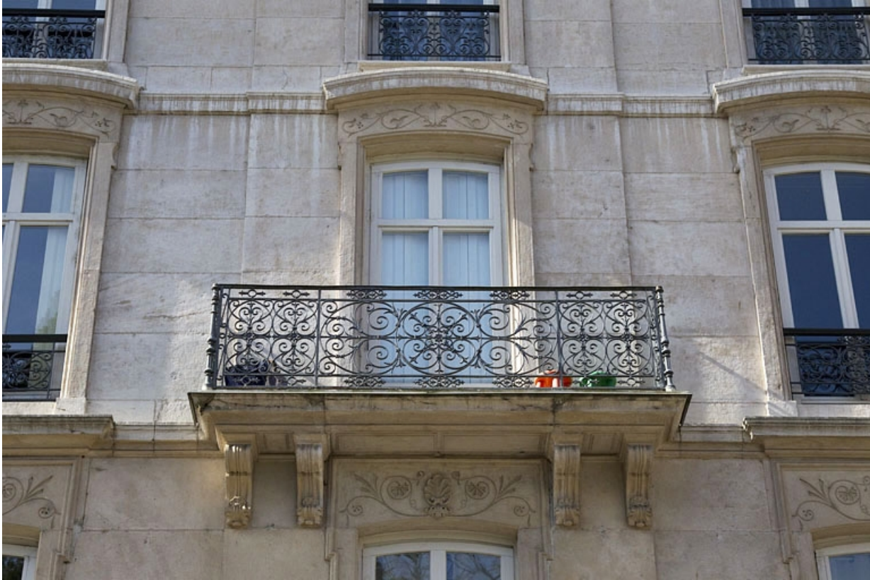
Logis principal, façade antérieure : détail d'un balcon du deuxième étage.

25, Besançon, 15 rue Proudhon, lieudit : îlot Morand