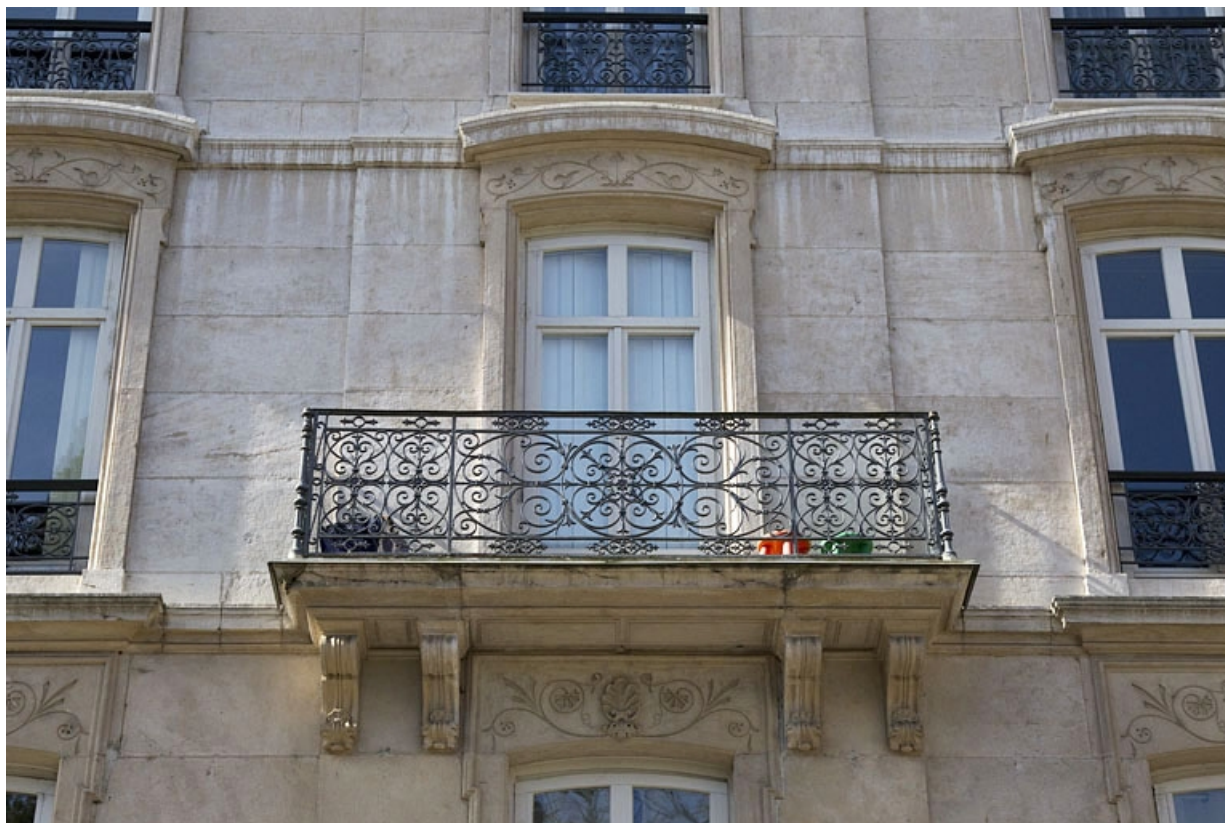
Logis principal, façade antérieure : détail d'un balcon du deuxième étage.

25, Besançon, 15 rue Proudhon, lieudit : îlot Morand