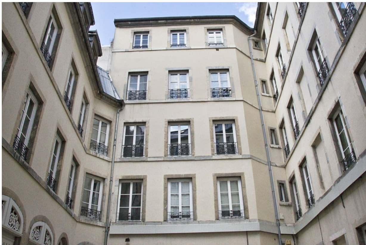
Vue d'ensemble des façades sur cour depuis l'entrée située côté rue Morand.

25, Besançon, 15 rue Proudhon, lieudit : îlot Morand