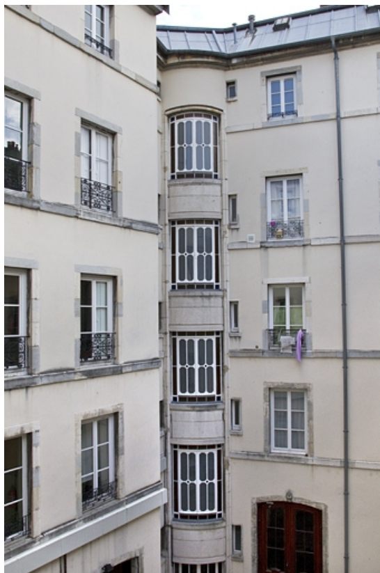
Logis principal, façade postérieure : détail de la cage de l'escalier d'angle.

25, Besançon, 15 rue Proudhon, lieudit : îlot Morand