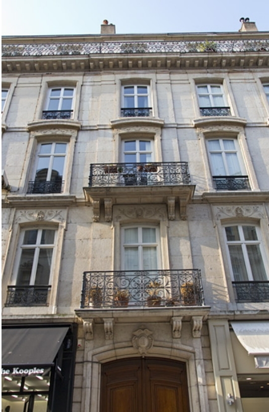
Logis principal, façade antérieure : détail des balcons des premier et deuxième étages côté rue Morand, de face. 25, Besançon, 15 rue Proudhon, lieudit : îlot Morand