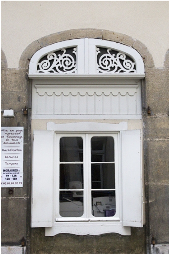
Logis secondaire : détail d'une baie du rez-de-chaussée.

25, Besançon, 15 rue Proudhon, lieudit : îlot Morand