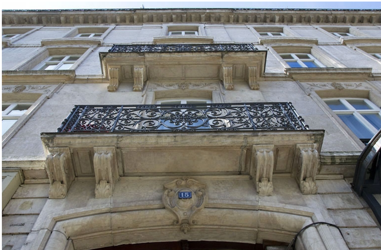
Logis principal, façade antérieure côté rue Proudhon : détail de la partie médiane en contre-plongée.

25, Besançon, 15 rue Proudhon, lieudit : îlot Morand