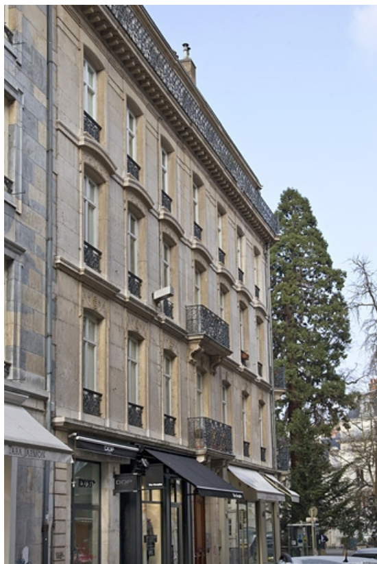
Logis principal, façade antérieure : vue d'ensemble côté rue Morand, de trois quarts gauche. 25, Besançon, 15 rue Proudhon, lieudit : îlot Morand