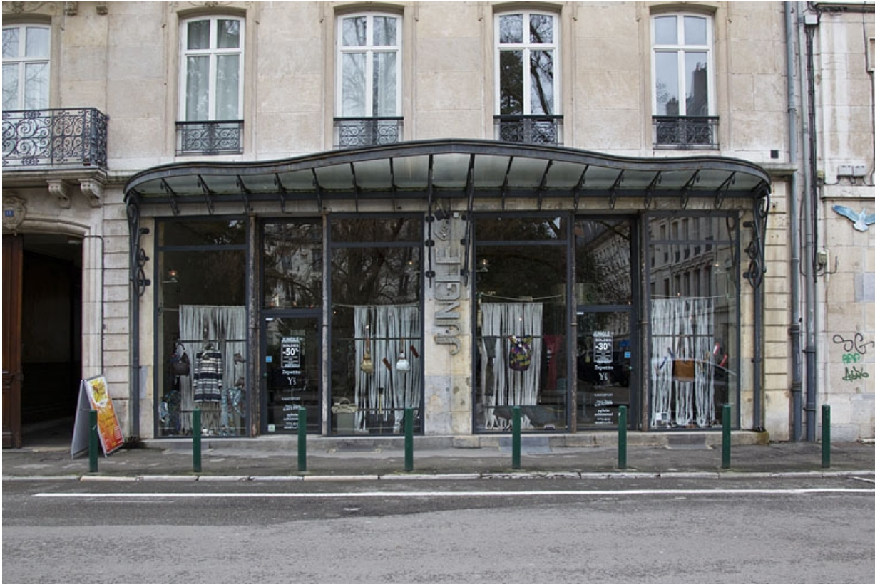
Logis principal, façade antérieure : détail de la boutique, côté rue Proudhon.

25, Besançon, 15 rue Proudhon, lieudit : îlot Morand