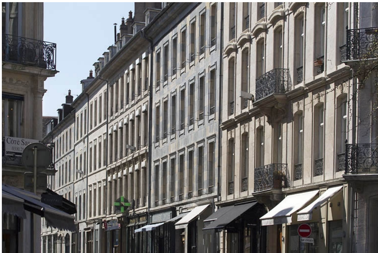
Vue d'ensemble dans l'alignement de la rue Morand, depuis la rue Proudhon.

25, Besançon, 15 rue Proudhon, lieudit : îlot Morand