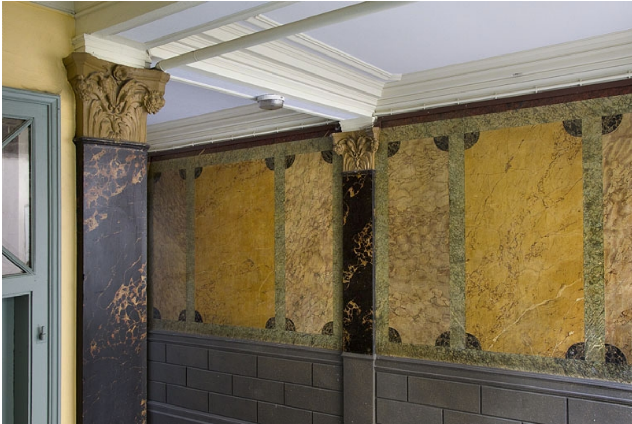
Logis principal, passage cocher côté rue Proudhon : détail du décor en faux marbre.

25, Besançon, 15 rue Proudhon, lieudit : îlot Morand