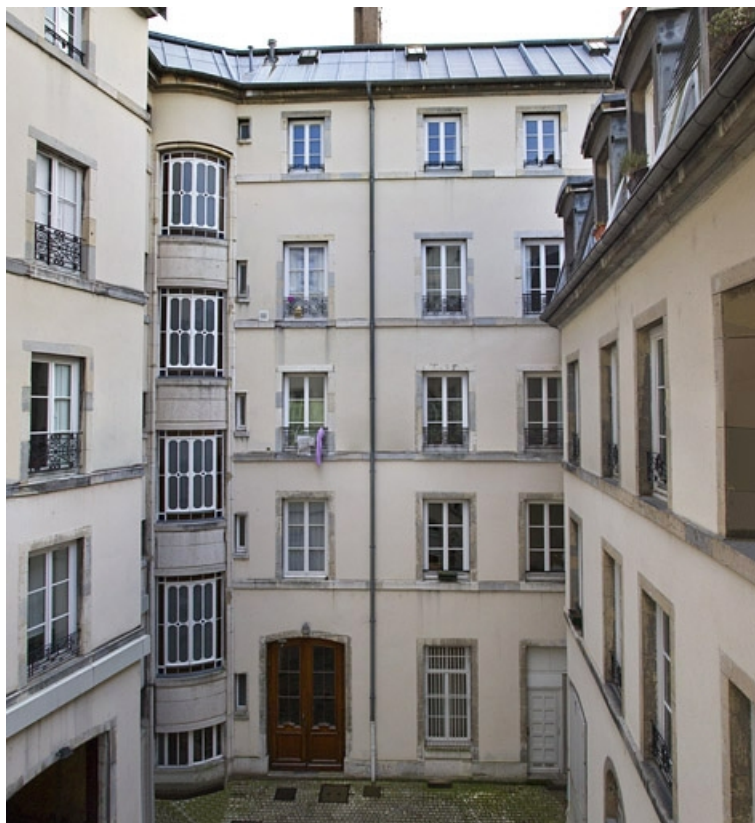
Logis principal, façade postérieure, côté rue Morand.

25, Besançon, 15 rue Proudhon, lieudit : îlot Morand