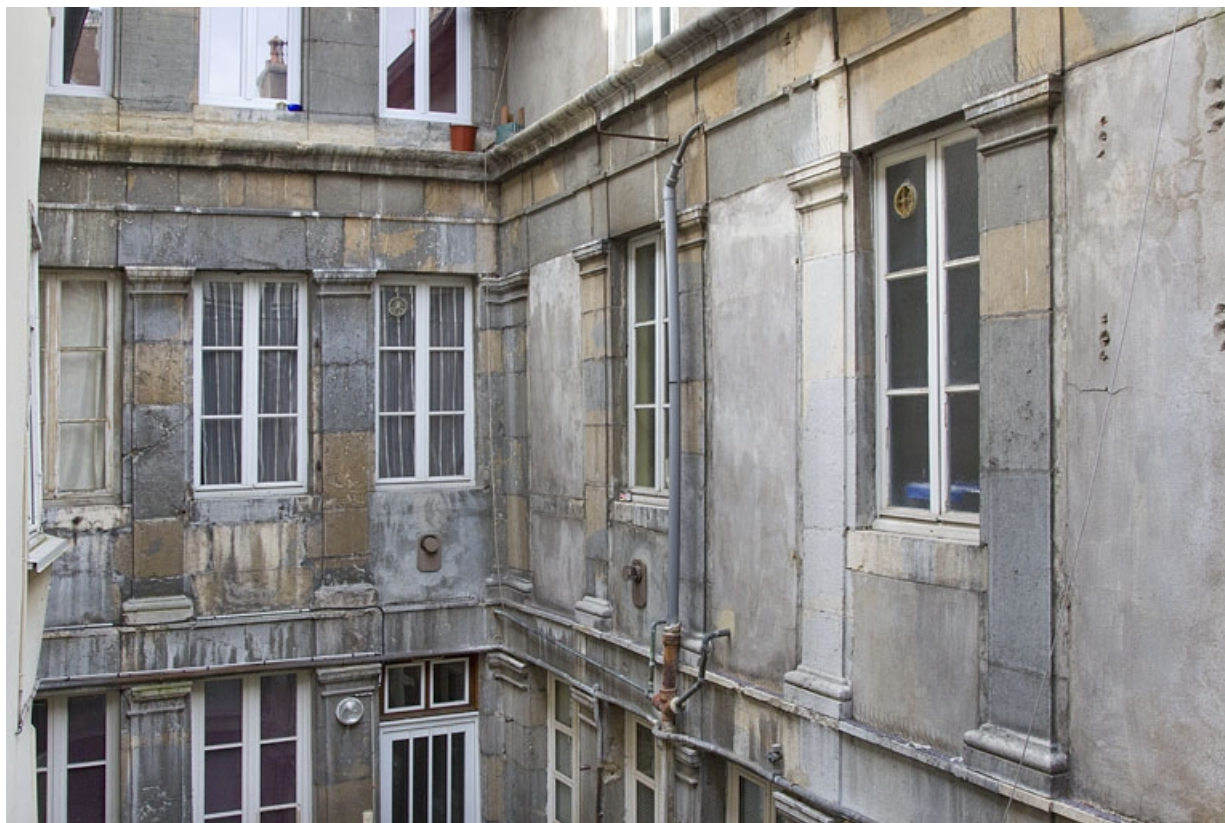
Logis secondaire, deuxième cour, vue d'une partie des façades au niveau du premier étage.

25, Besançon, 49 rue des Granges, lieudit : îlot Morand