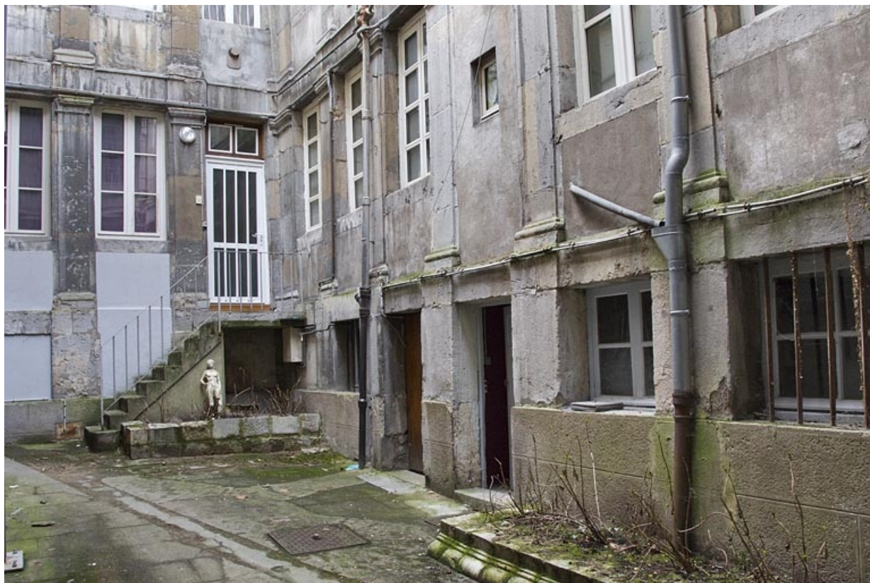
Logis secondaire, deuxième cour, vue d'ensemble de la partie basse des façades depuis le fond de la cour : de trois quarts gauche. 25, Besançon, 49 rue des Granges, lieudit : îlot Morand