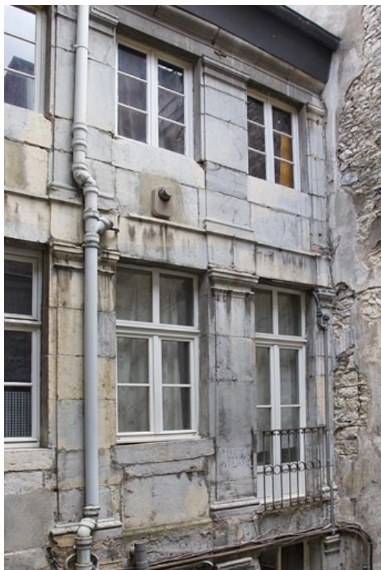
Logis secondaire : détail d'une partie de la façade à partir du premier étage sur la première cour. 25, Besançon, 49 rue des Granges, lieudit : îlot Morand