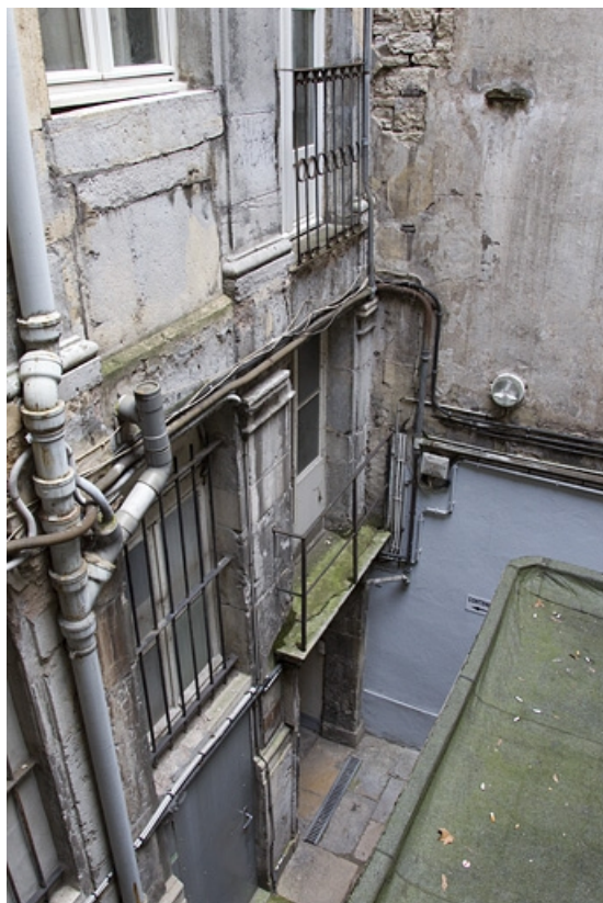
Logis secondaire : détail d'une partie de la façade à partir du rez-de-chaussée sur la première cour. 25, Besançon, 49 rue des Granges, lieudit : îlot Morand