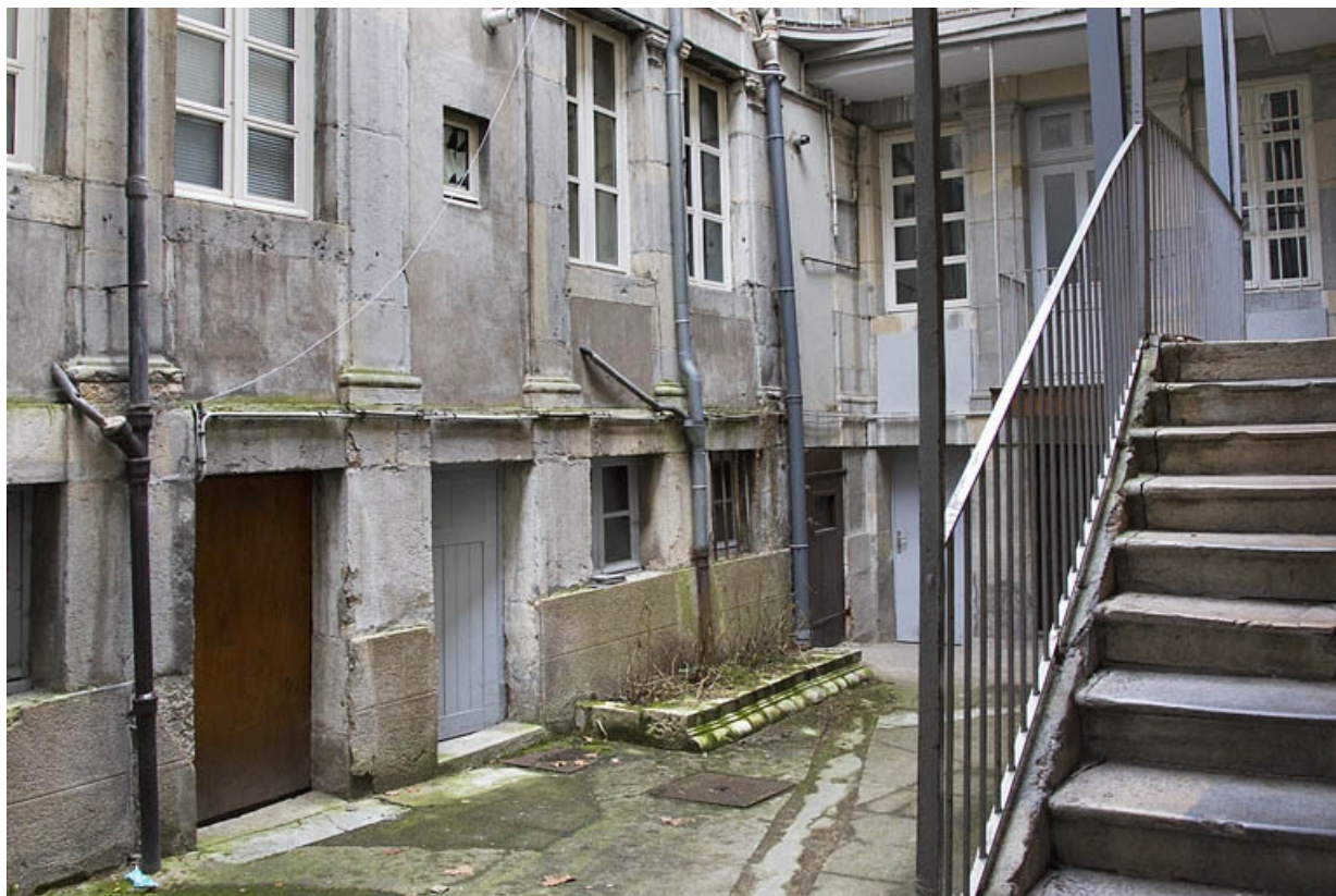
Logis secondaire, deuxième cour, façade en face de l'escalier à cage ouverte, partie droite : rez-de-chaussée et premier étage. 25, Besançon, 49 rue des Granges, lieudit : îlot Morand