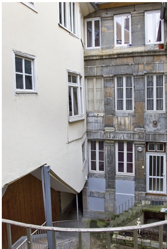
Logis secondaire, deuxième cour, détail de l'escalier à cage ouverte : de trois quarts gauche. 25, Besançon, 49 rue des Granges, lieudit : îlot Morand