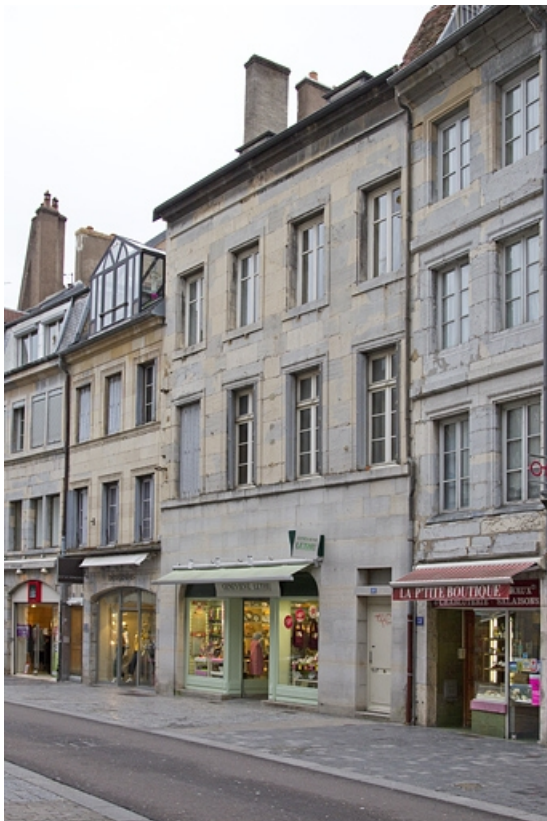
Vue d'ensemble de la façade sur rue, de trois quarts droit.

25, Besançon, 49 rue des Granges, lieudit : îlot Morand