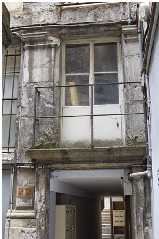
Logis secondaire : détail de la porte-fenêtre du premier étage au-dessus du couloir sur la première cour. 25, Besançon, 49 rue des Granges, lieudit : îlot Morand