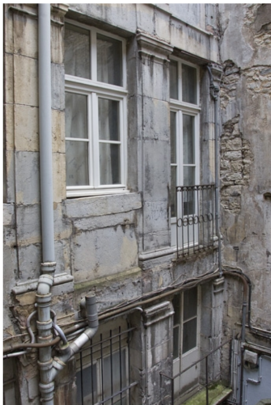
Logis secondaire : détail d'une partie de la façade à partir du premier étage sur la première cour. 25, Besançon, 49 rue des Granges, lieudit : îlot Morand