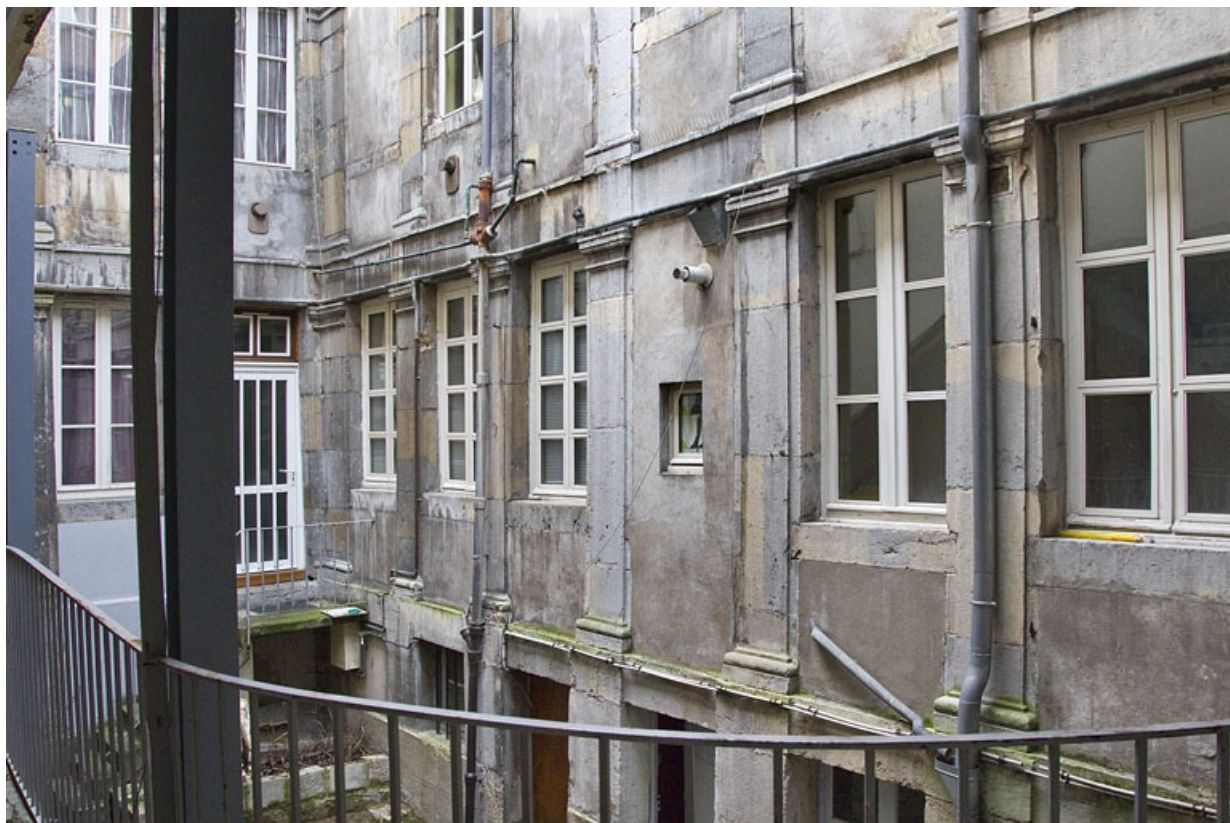
Logis secondaire, deuxième cour, vue d'ensemble de la partie basse des façades depuis l'escalier à cage ouverte : de trois quarts gauche.

25, Besançon, 49 rue des Granges, lieudit : îlot Morand