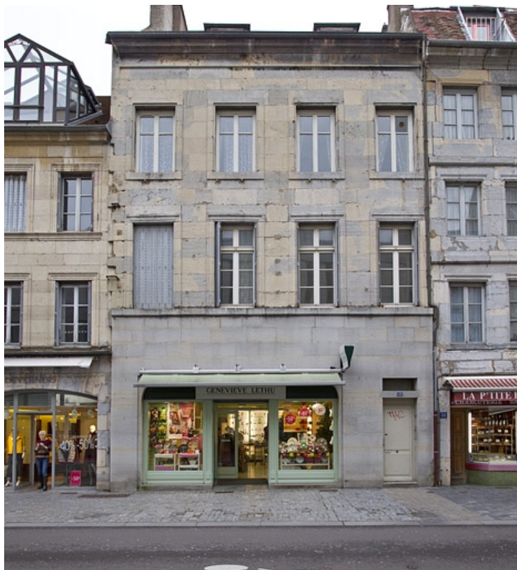
Vue d'ensemble de la façade sur rue, de face.

25, Besançon, 49 rue des Granges, lieudit : îlot Morand