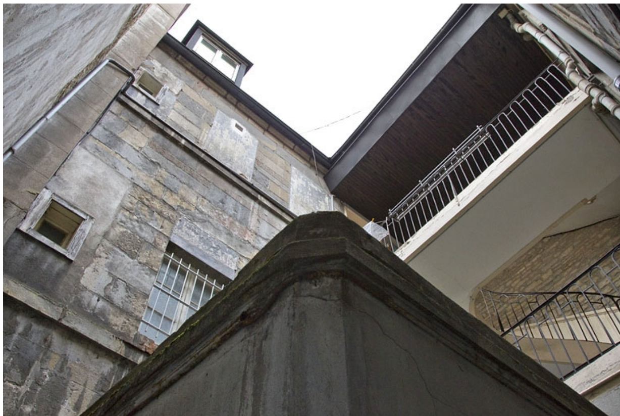
Vue de la première cour occupée par une extension de magasin.

25, Besançon, 49 rue des Granges, lieudit : îlot Morand