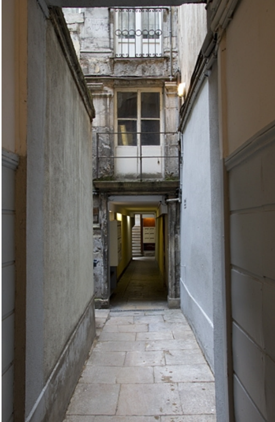
Logis secondaire : vue du couloir en enfilade depuis le couloir du logis principal. 25, Besançon, 49 rue des Granges, lieudit : îlot Morand