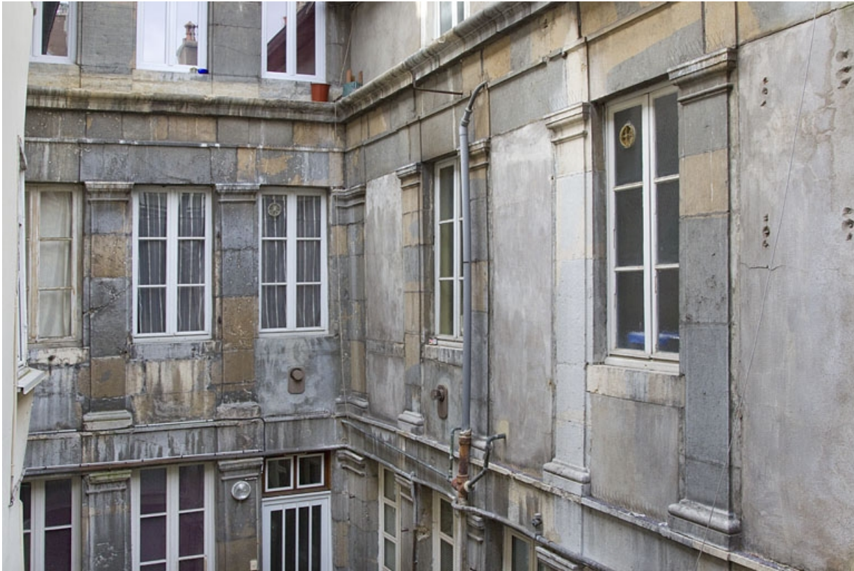
Logis secondaire, deuxième cour, vue d'une partie des façades au niveau du premier étage. 25, Besançon, 49 rue des Granges, lieudit : îlot Morand