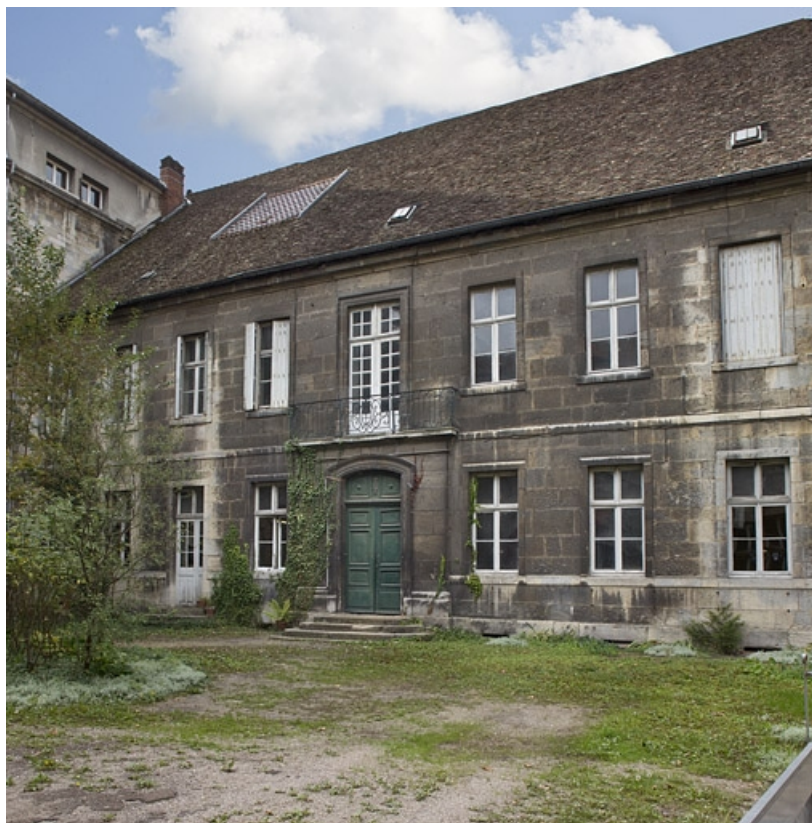
Logis principal : vue d'ensemble de la façade sur cour, de trois quarts droit. 25, Besançon, 9 rue Girod de Chantrans, lieudit : îlot Saint-Jacques