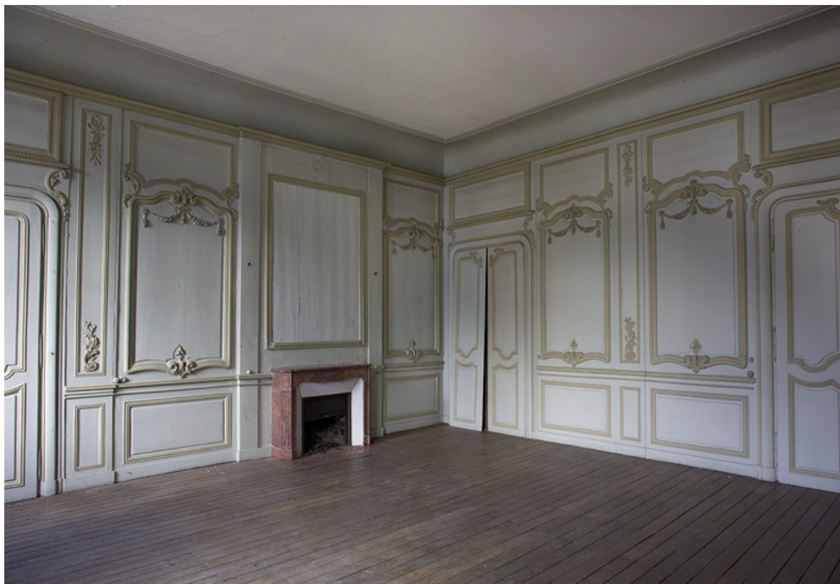
Logis principal, intérieur, premier étage : vue d'ensemble d'une pièce avec ses lambris, de trois quarts droit. 25, Besançon, 9 rue Girod de Chantrans, lieudit : îlot Saint-Jacques