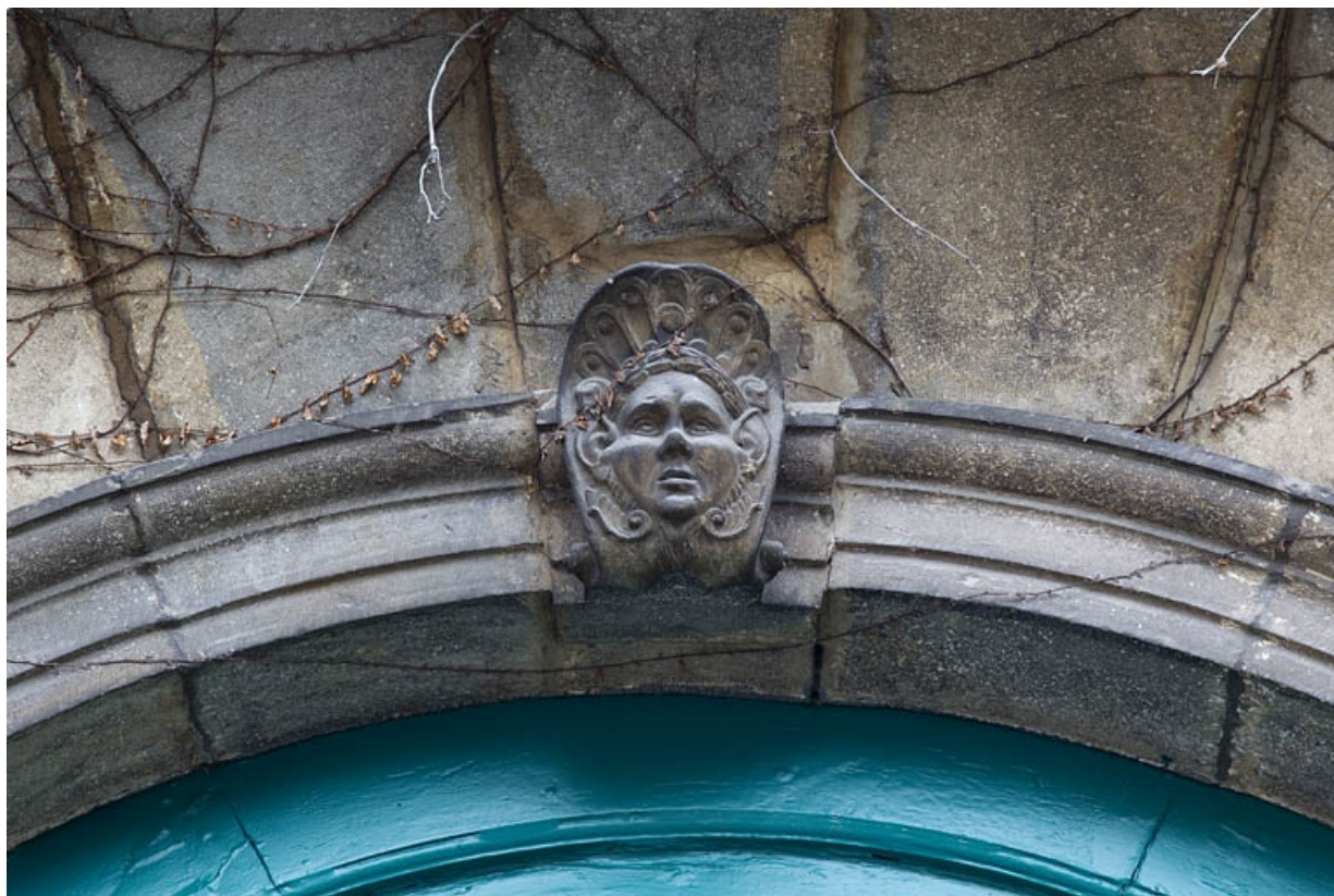
Logis secondaire, façade sur rue : détail du décor de la clé de l'arc du portail d'entrée, de face. 25, Besançon, 9 rue Girod de Chantrans, lieudit : îlot Saint-Jacques