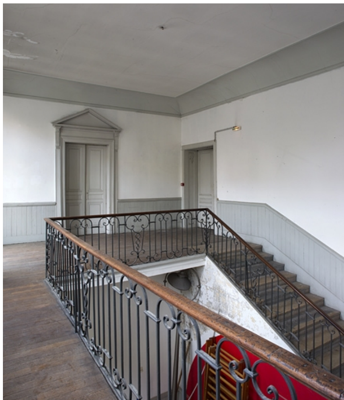
Logis principal, intérieur : vue d'ensemble de l'escalier.

25, Besançon, 9 rue Girod de Chantrans, lieudit : îlot Saint-Jacques