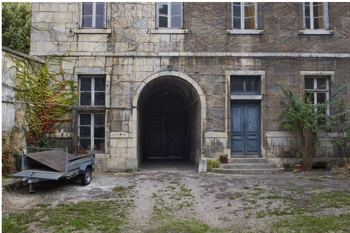
Logis secondaire : détail de façade sur cour, partie gauche, de face. 25, Besançon, 9 rue Girod de Chantrans, lieudit : îlot Saint-Jacques