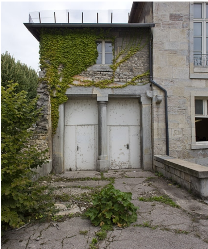
Détail de l'édicule à gauche de la façade donnant sur l'ancien jardin, de face. 25, Besançon, 9 rue Girod de Chantrans, lieudit : îlot Saint-Jacques