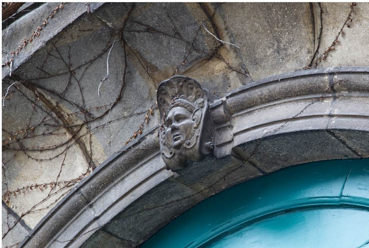
Logis secondaire, façade sur rue : détail du décor de la clé de l'arc du portail d'entrée, de trois quarts droit. 25, Besançon, 9 rue Girod de Chantrans, lieudit : îlot Saint-Jacques