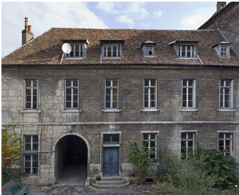
Logis secondaire : vue d'ensemble de la façade sur cour, de face. 25, Besançon, 9 rue Girod de Chantrans, lieudit : îlot Saint-Jacques