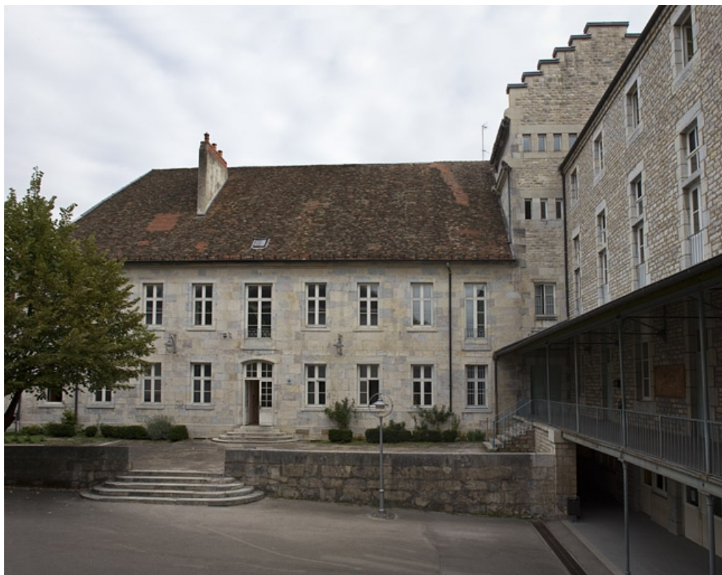
Logis principal : vue d'ensemble de la façade donnant sur l'ancien jardin, de face, vue éloignée. 25, Besançon, 9 rue Girod de Chantrans, lieudit : îlot Saint-Jacques