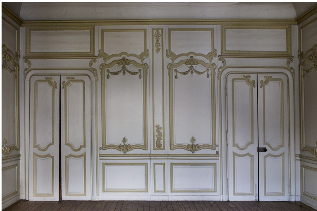
Logis principal, intérieur, premier étage : détail des lambris, de face. 25, Besançon, 9 rue Girod de Chantrans, lieudit : îlot Saint-Jacques