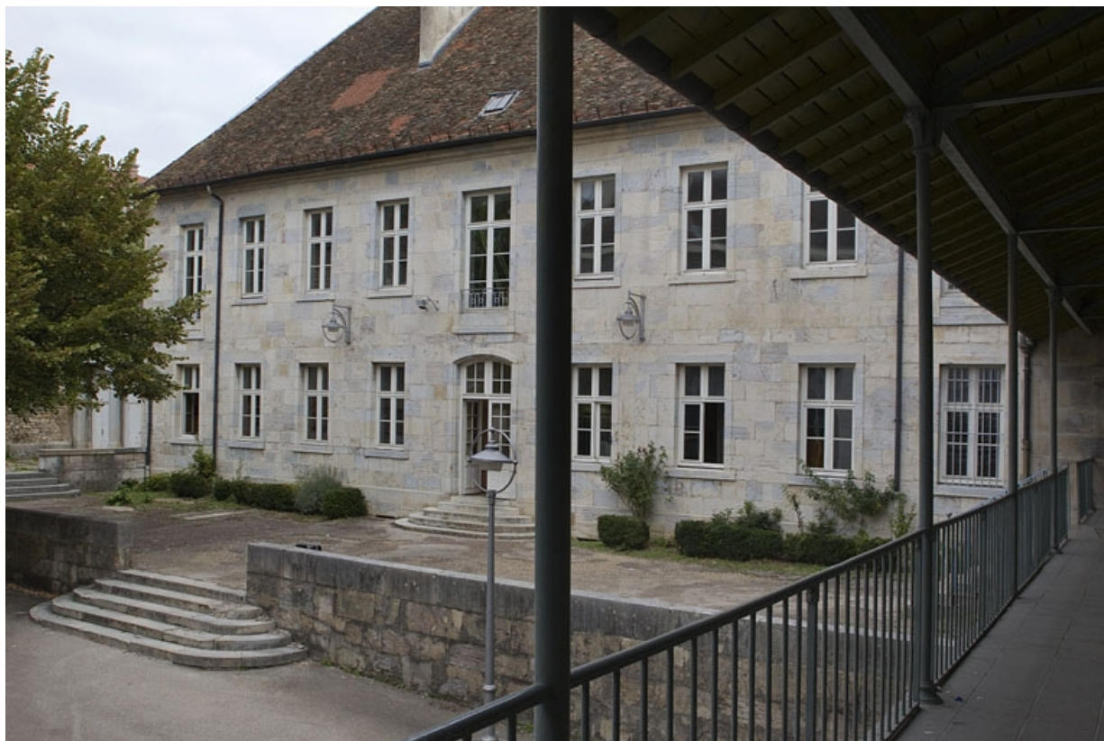
Logis principal : vue d'ensemble de la façade donnant sur l'ancien jardin, de trois quarts droit.

25, Besançon, 9 rue Girod de Chantrans, lieudit : îlot Saint-Jacques