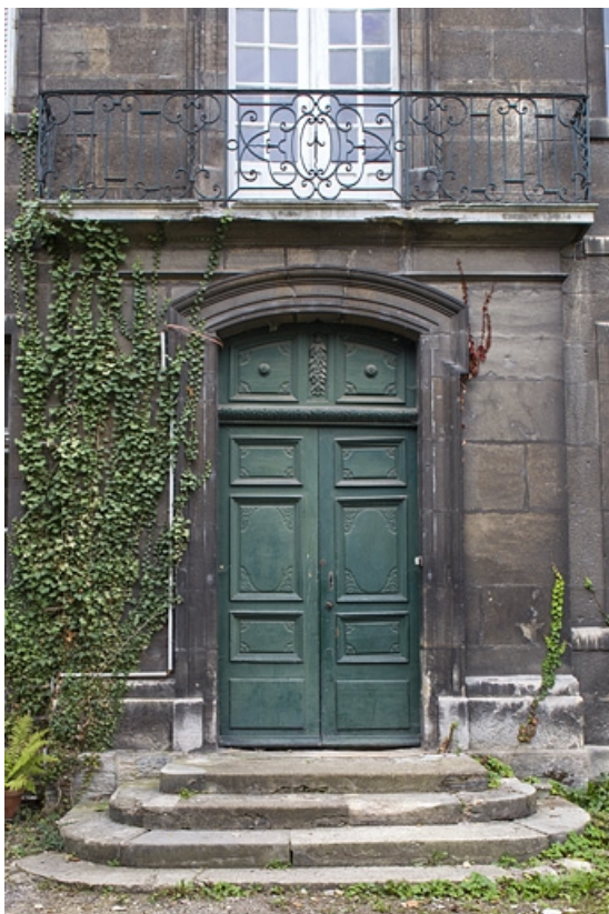
Logis principal, façade sur cour : détail de la porte d'entrée.

25, Besançon, 9 rue Girod de Chantrans, lieudit : îlot Saint-Jacques