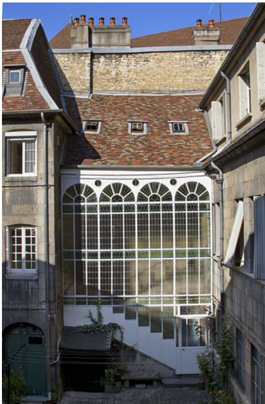
Escalier à cage ouverte sur cour : vue d'ensemble.

25, Besançon, 12 rue du Lycée, lieudit : îlot Saint-Jacques