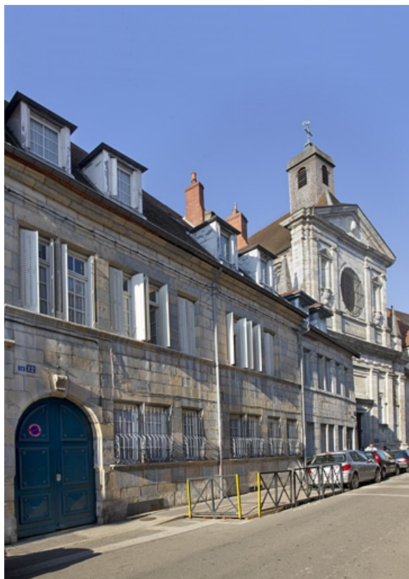
Vue d'ensemble depuis la rue : de trois quarts gauche.

25, Besançon, 12 rue du Lycée, lieudit : îlot Saint-Jacques