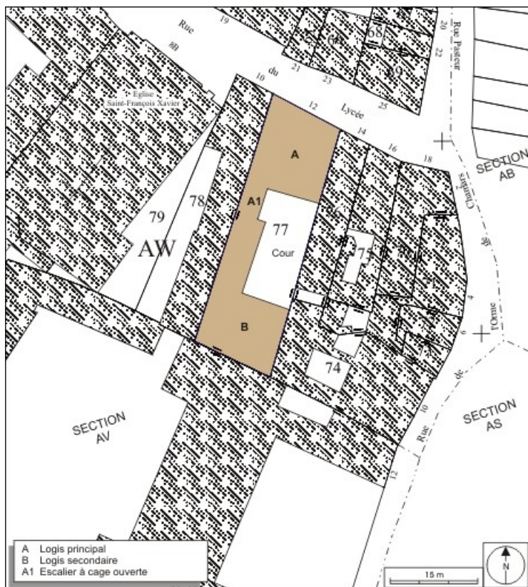
Plan masse et de situation. Extrait du plan cadastral, 1974, section AW. 25, Besançon, 12 rue du Lycée, lieudit : îlot Saint-Jacques