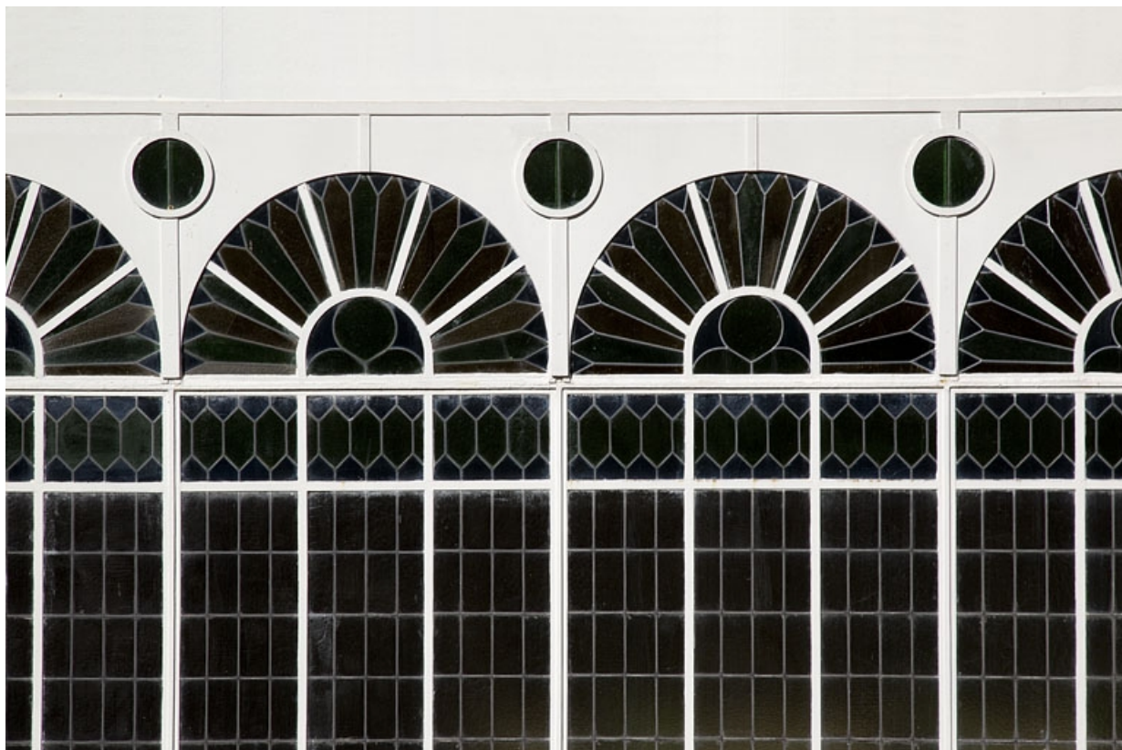
Escalier à cage ouverte sur cour : détail de la verrière abritant l'escalier.

25, Besançon, 12 rue du Lycée, lieudit : îlot Saint-Jacques