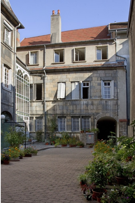
Logis principal : vue d'ensemble de la façade postérieure, depuis le fond de la cour. 25, Besançon, 12 rue du Lycée, lieudit : îlot Saint-Jacques