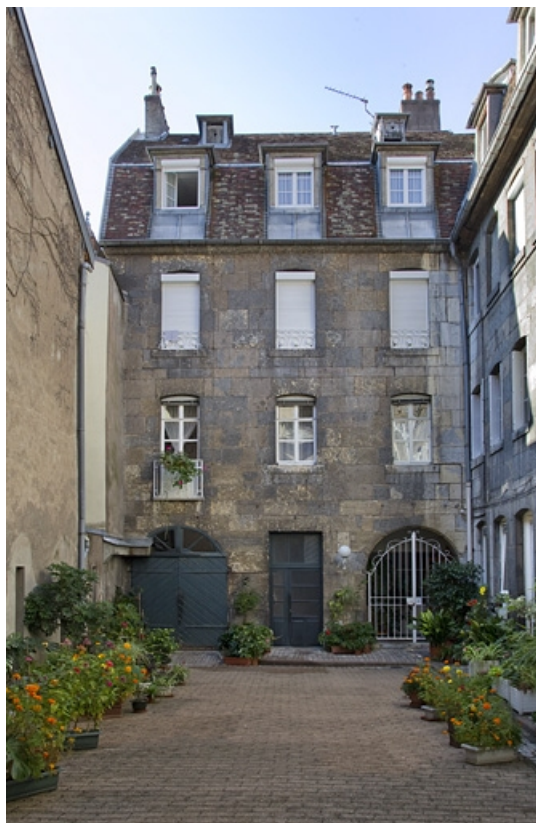
Vue d'ensemble du logis secondaire depuis l'entrée de la cour : de face.

25, Besançon, 12 rue du Lycée, lieudit : îlot Saint-Jacques