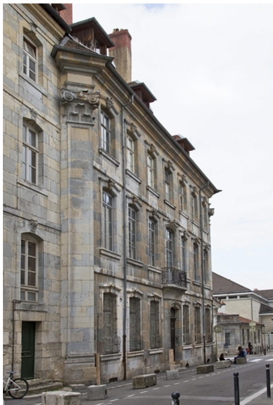
Vue d'ensemble depuis la rue du lycée, de trois quarts gauche.

25, Besançon, 6 rue du Lycée, lieudit : îlot Saint-Jacques