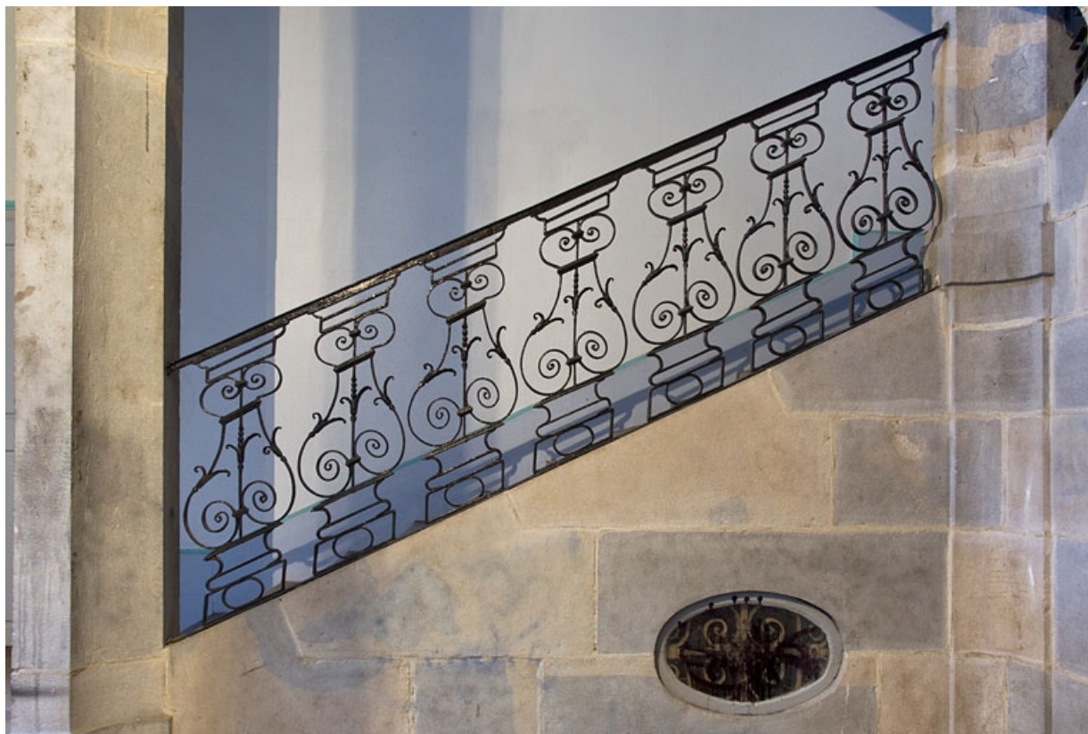
Intérieur, escalier : détail de la rampe en ferronnerie, vue rapprochée.

25, Besançon, 6 rue du Lycée, lieudit : îlot Saint-Jacques