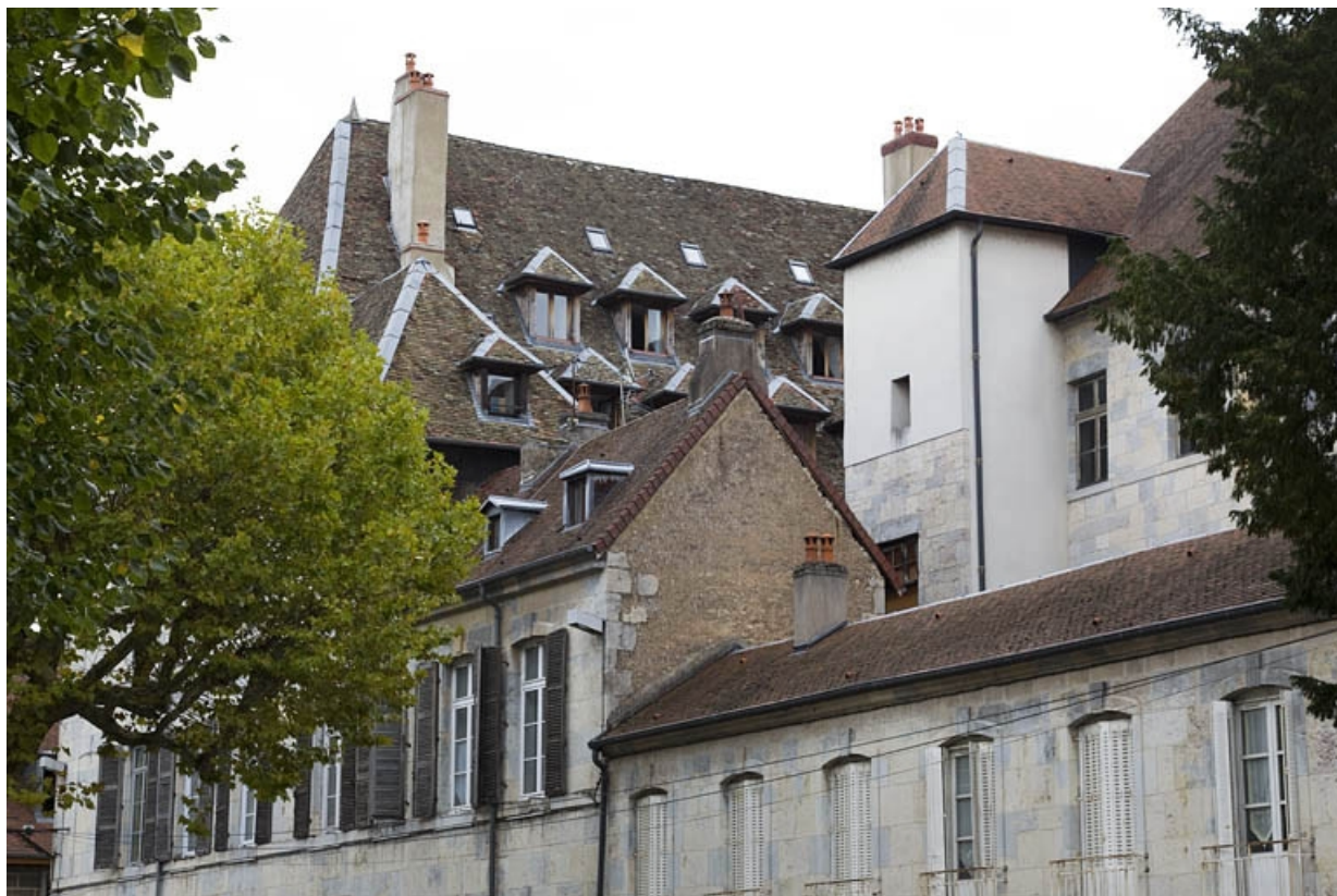
Façade latérale droite : vue d'ensemble de trois quarts droit.

25, Besançon, 6 rue du Lycée, lieudit : îlot Saint-Jacques