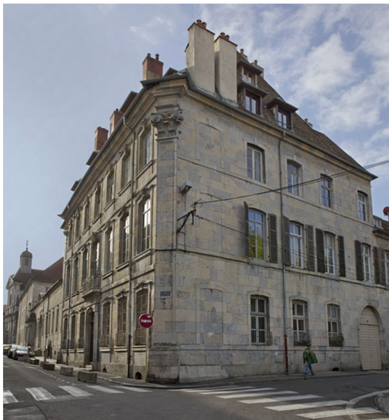
Vue d'ensemble du logis depuis la rue, de trois quarts droit.

25, Besançon, 6 rue du Lycée, lieudit : îlot Saint-Jacques