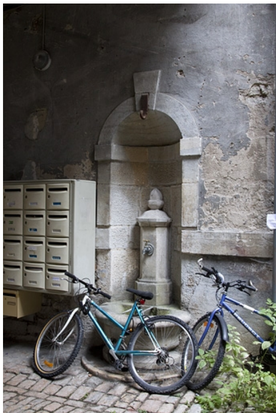
Cour : détail de la borne fontaine.

25, Besançon, 6 rue du Lycée, lieudit : îlot Saint-Jacques