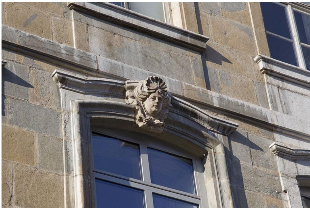
Façade extérieure, rue du lycée, porte-fenêtre du premier étage : détail de la clé décorée d'une tête féminine. 25, Besançon, 6 rue du Lycée, lieudit : îlot Saint-Jacques