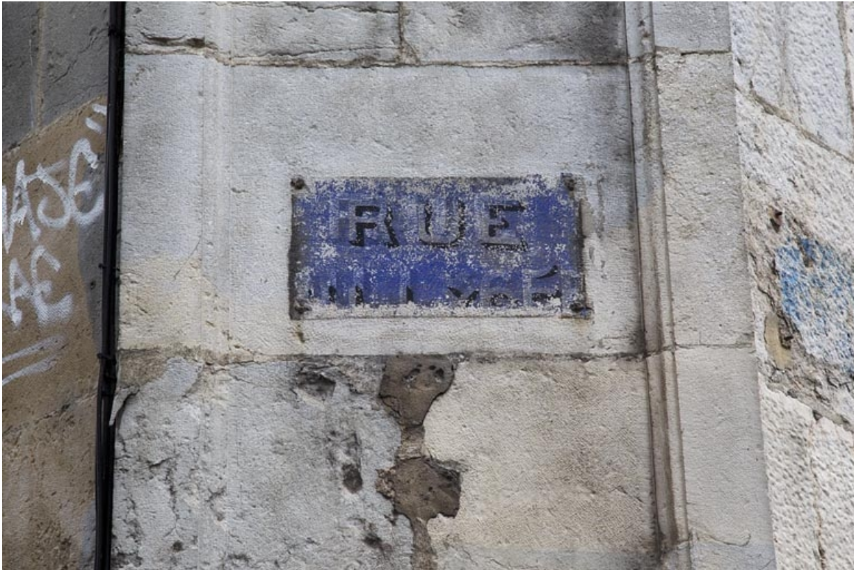
Angle droit de la façade antérieure : plaque peinte de l'ancien nom de la rue.

25, Besançon, 6 rue du Lycée, lieudit : îlot Saint-Jacques