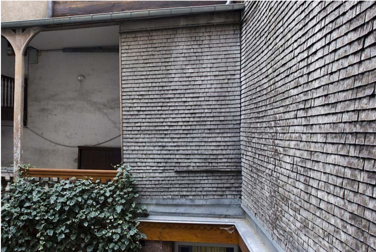
Ailes de l'escalier à cage ouverte et du passage cocher : détail de l'essentage en tavillons.

25, Besançon, 6 rue du Lycée, lieudit : îlot Saint-Jacques