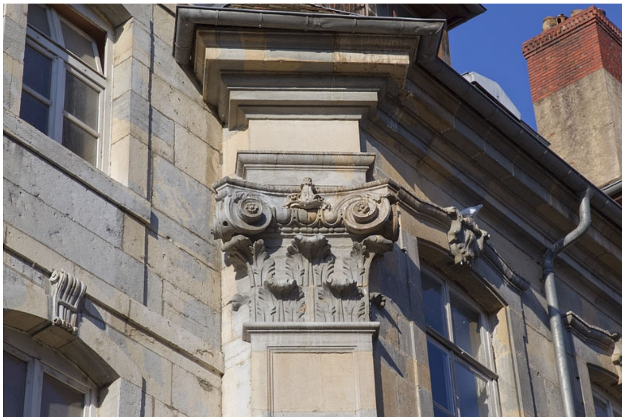
Façade extérieure, rue du lycée : détail du chapiteau corinthien du pilastre d'angle. 25, Besançon, 6 rue du Lycée, lieudit : îlot Saint-Jacques