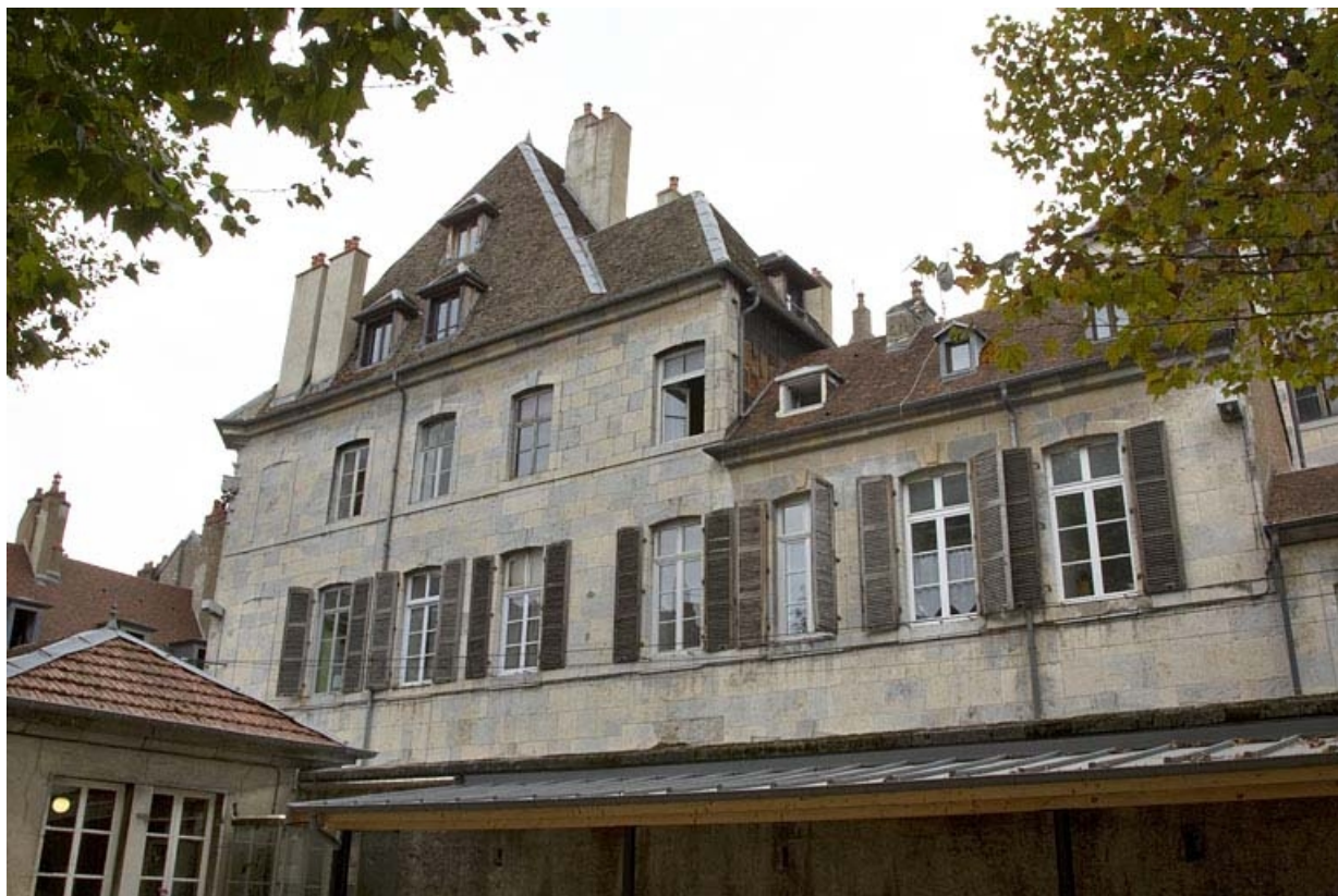
Façade latérale droite : vue d'ensemble de face, depuis la cour du lycée Pasteur. 25, Besançon, 6 rue du Lycée, lieudit : îlot Saint-Jacques