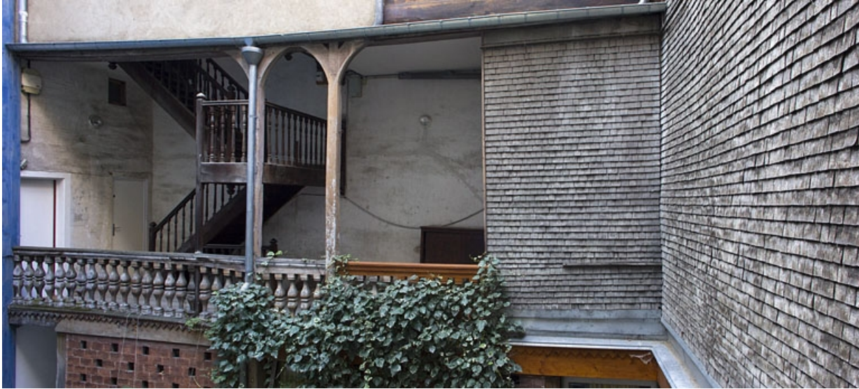
Aile de l'escalier à cage ouverte : détail de la partie supérieure, de face.

25, Besançon, 6 rue du Lycée, lieudit : îlot Saint-Jacques