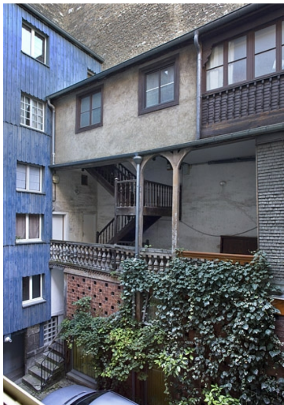
Aile de l'escalier à cage ouverte, de trois quarts droit. 25, Besançon, 6 rue du Lycée, lieudit : îlot Saint-Jacques