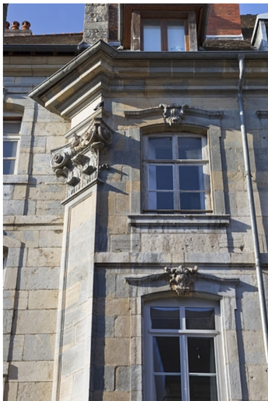
Façade extérieure, rue du lycée : détail du pilastre d'angle gauche.

25, Besançon, 6 rue du Lycée, lieudit : îlot Saint-Jacques