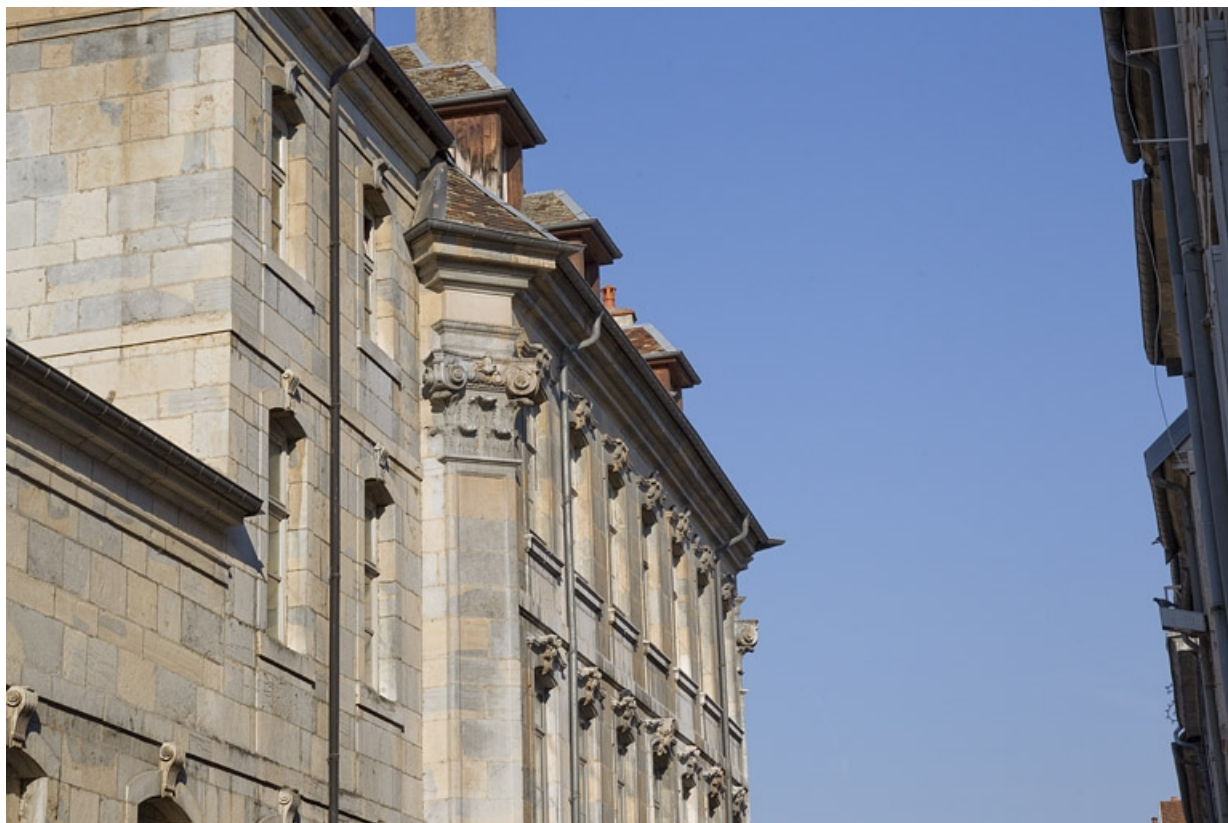
Façade extérieure, rue du lycée : détail des premier et deuxième étages, de trois quarts gauche. 25, Besançon, 6 rue du Lycée, lieudit : îlot Saint-Jacques