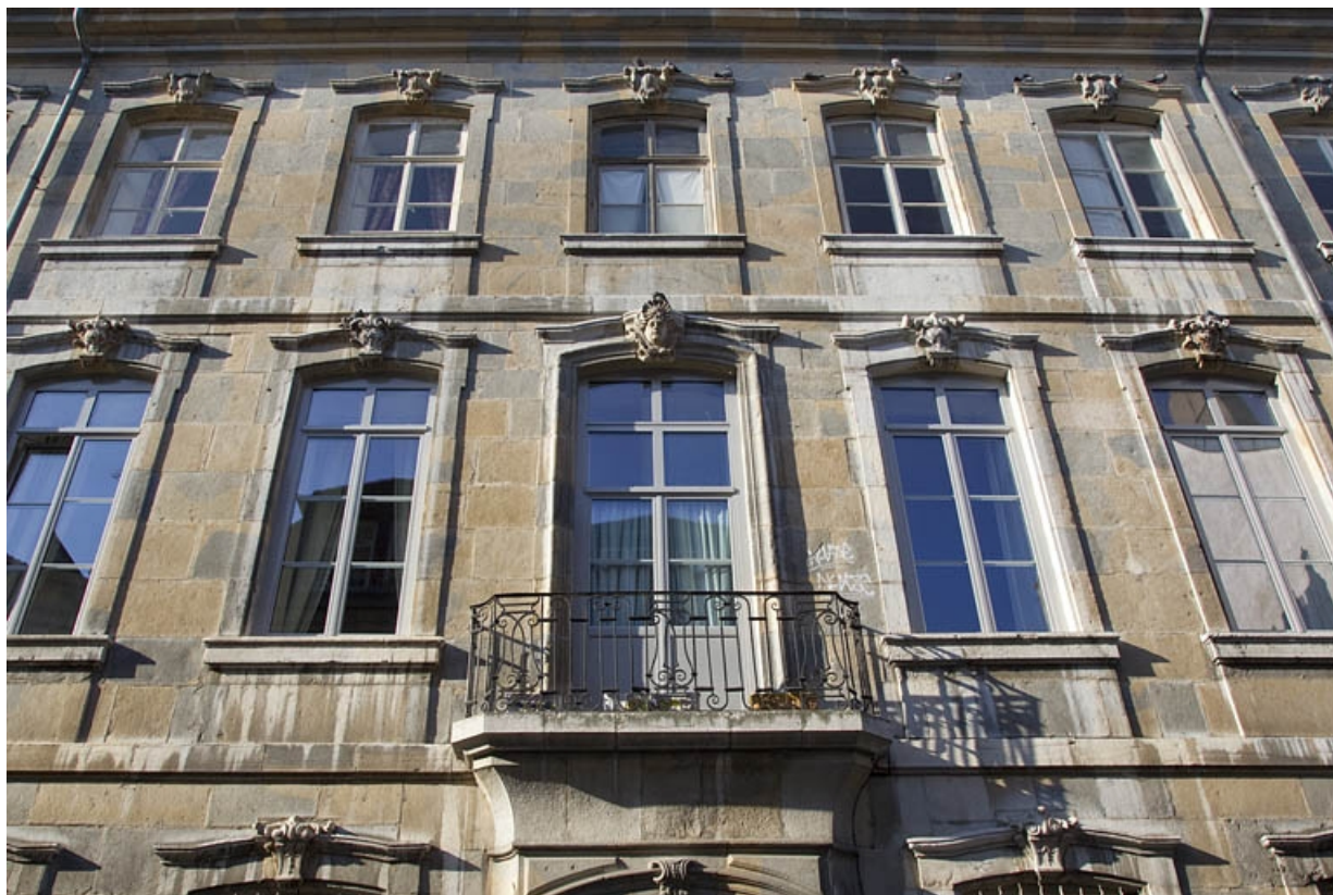
Façade extérieure, rue du lycée : détail des premier et deuxième étages, de face.

25, Besançon, 6 rue du Lycée, lieudit : îlot Saint-Jacques