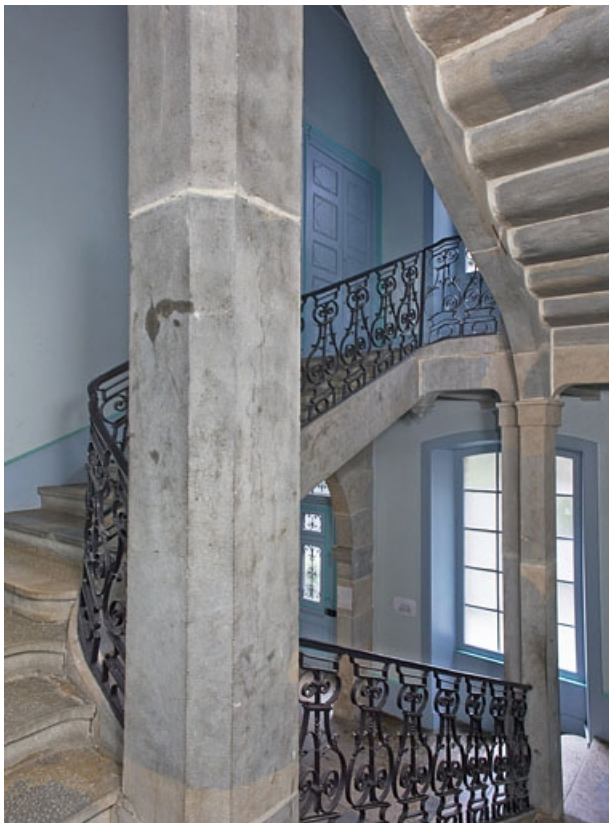
Intérieur : vue d'ensemble de l'escalier, de trois quarts gauche.

25, Besançon, 6 rue du Lycée, lieudit : îlot Saint-Jacques