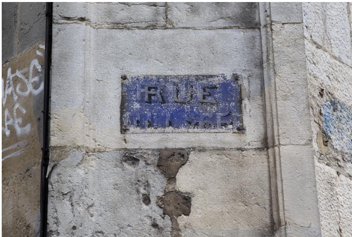
Angle droit de la façade antérieure : plaque peinte de l'ancien nom de la rue. 25, Besançon, 6 rue du Lycée, lieudit : îlot Saint-Jacques