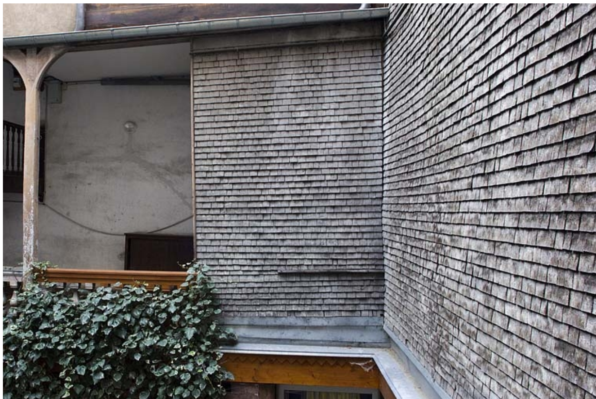
Ailes de l'escalier à cage ouverte et du passage cocher : détail de l'essentage en tavaillons.

25, Besançon, 6 rue du Lycée, lieudit : îlot Saint-Jacques