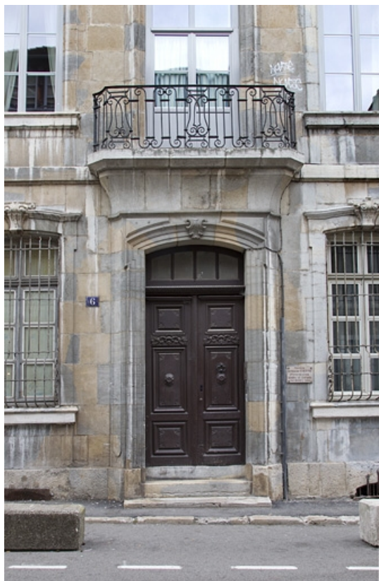
Façade antérieure : détail de la porte d'entrée et du balcon du premier étage. 25, Besançon, 6 rue du Lycée, lieudit : îlot Saint-Jacques