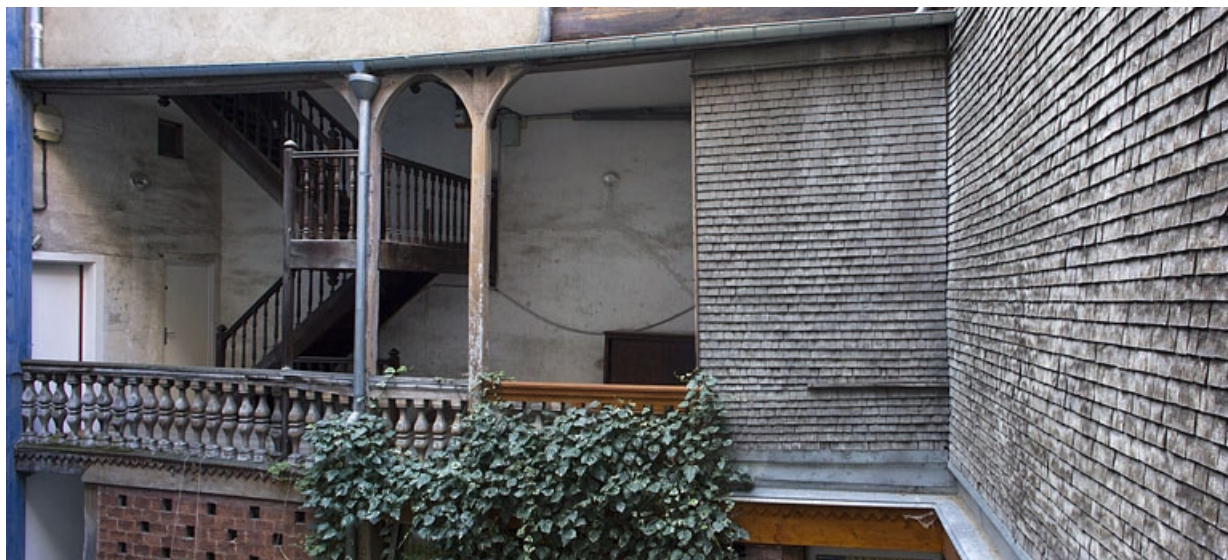
Aile de l'escalier à cage ouverte : détail de la partie supérieure, de face.

25, Besançon, 6 rue du Lycée, lieudit : îlot Saint-Jacques