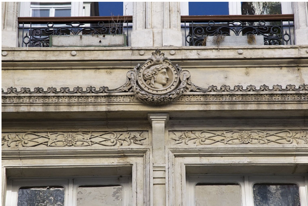
Façade antérieure, premier étage : partie gauche, détail du médaillon décorant la frise. 25, Besançon, 8 rue Morand, lieudit : îlot Proudhon