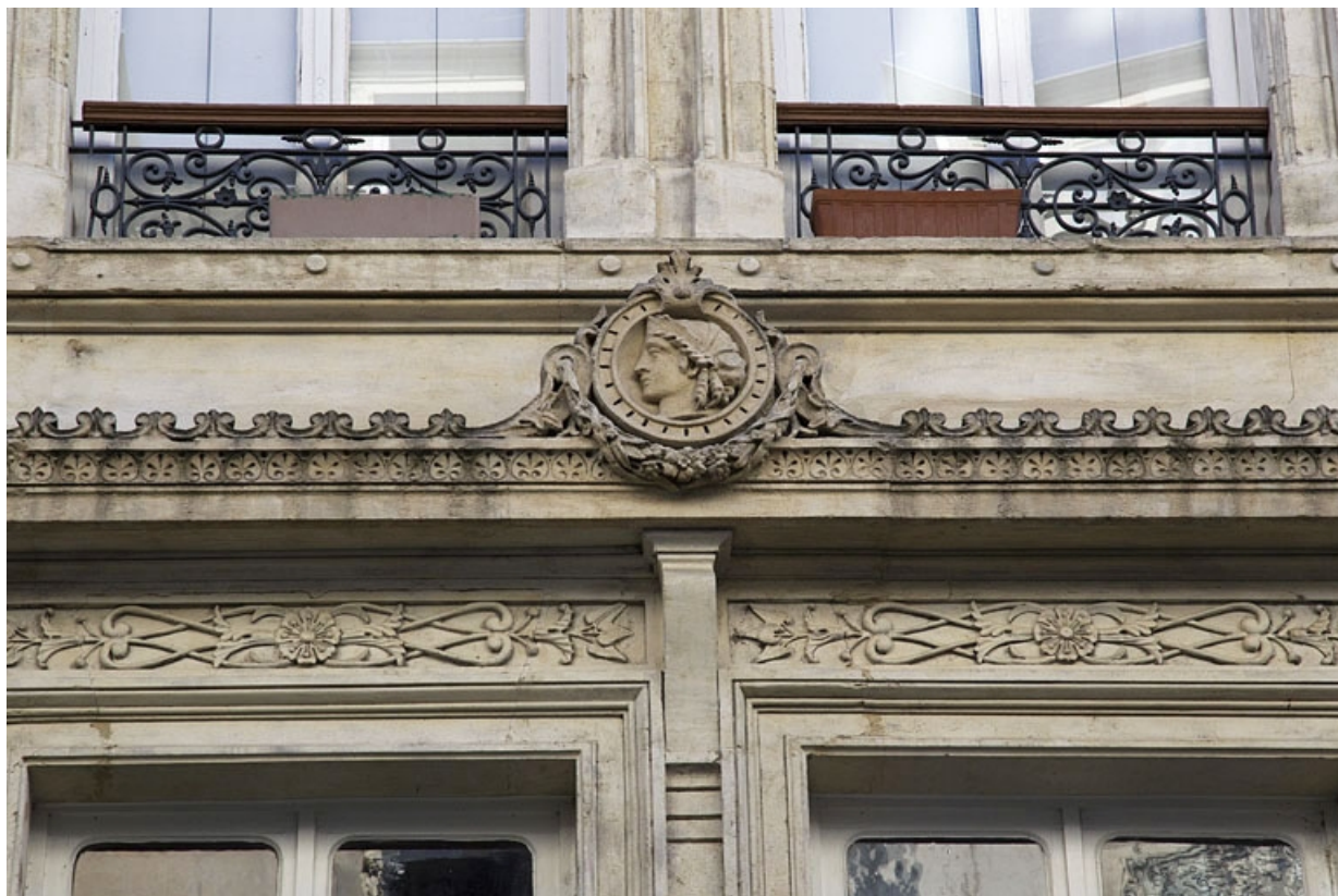
Façade antérieure, premier étage : partie droite, détail du médaillon ornant la frise.

25, Besançon, 8 rue Morand, lieudit : îlot Proudhon