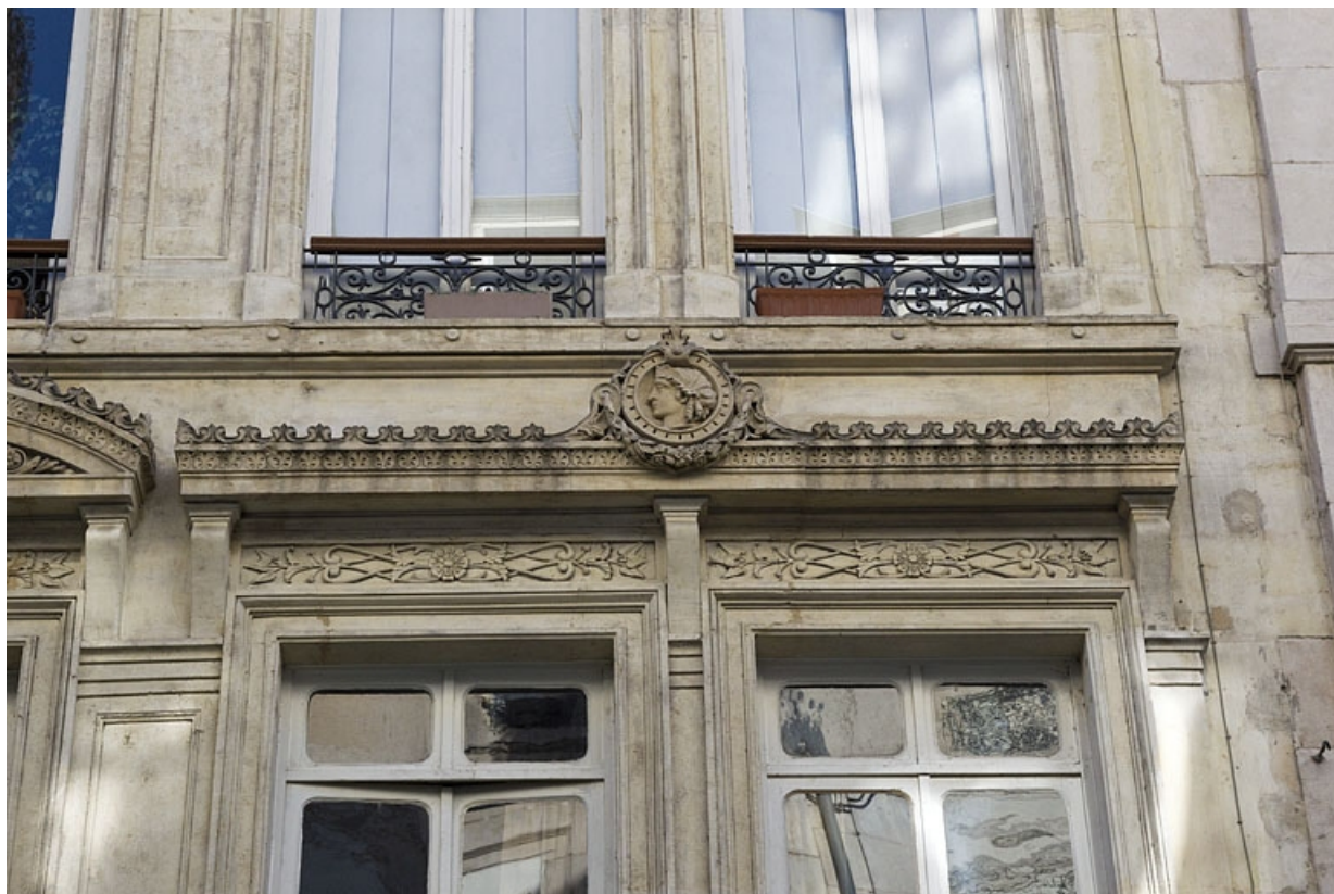
Façade antérieure, premier étage : partie droite, détail de la frise.

25, Besançon, 8 rue Morand, lieudit : îlot Proudhon