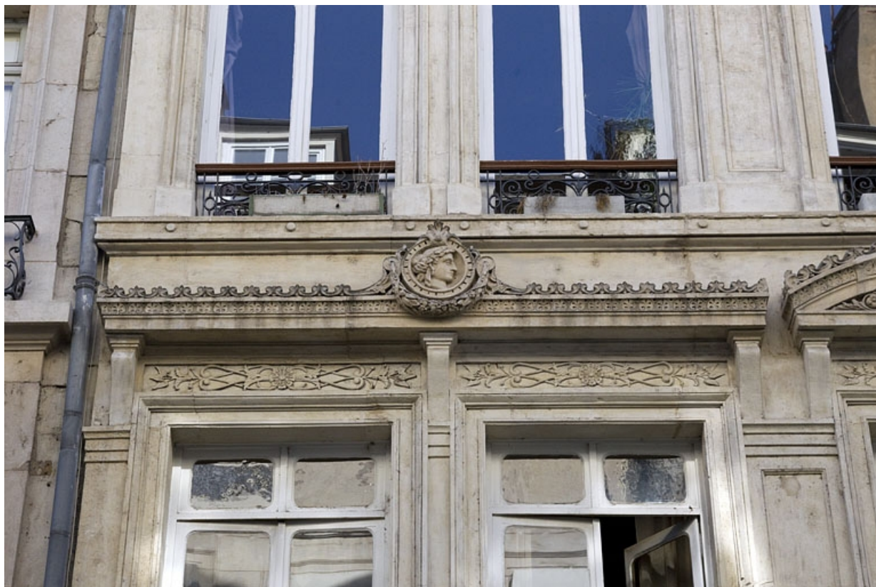
Façade antérieure, premier étage : détail de la frise de la partie gauche.

25, Besançon, 8 rue Morand, lieudit : îlot Proudhon