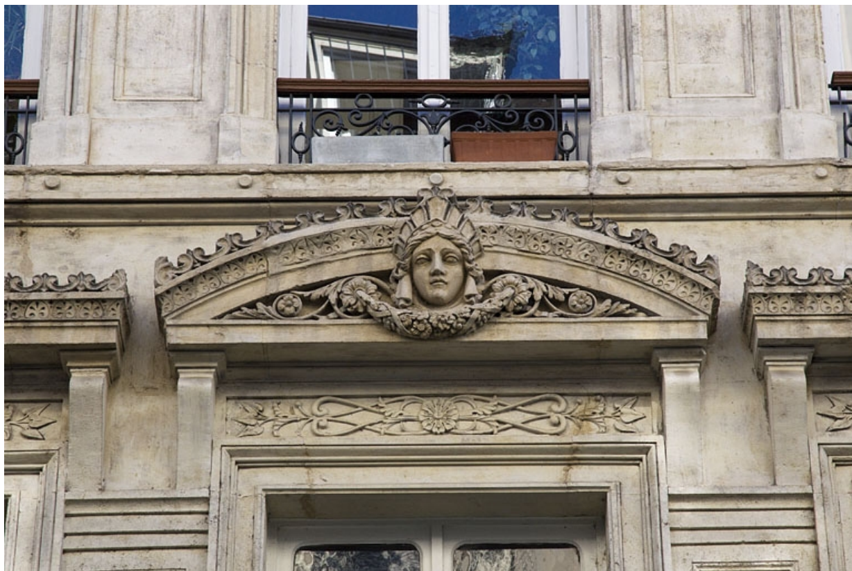
Façade antérieure, premier étage : détail du décor du fronton de la fenêtre centrale.

25, Besançon, 8 rue Morand, lieudit : îlot Proudhon