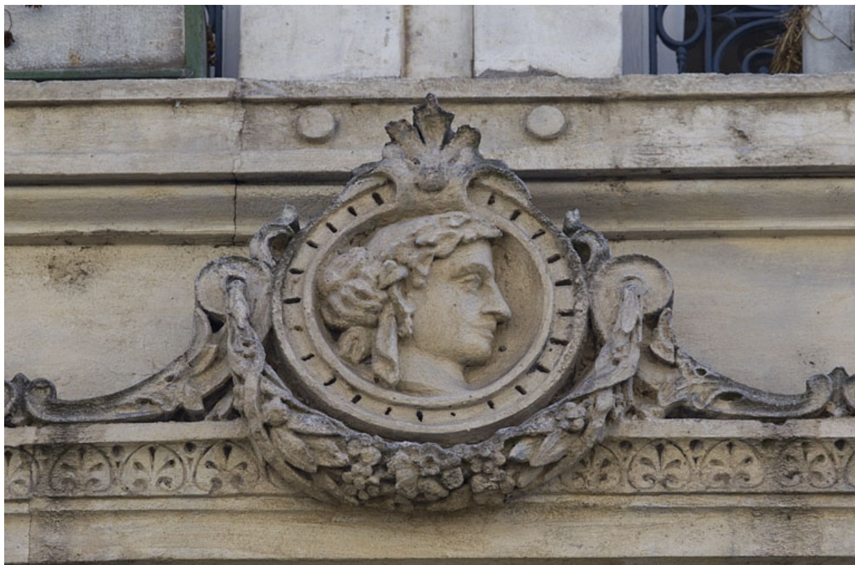
Façade antérieure, premier étage : détail rapproché du décor de la frise gauche.

25, Besançon, 8 rue Morand, lieudit : îlot Proudhon