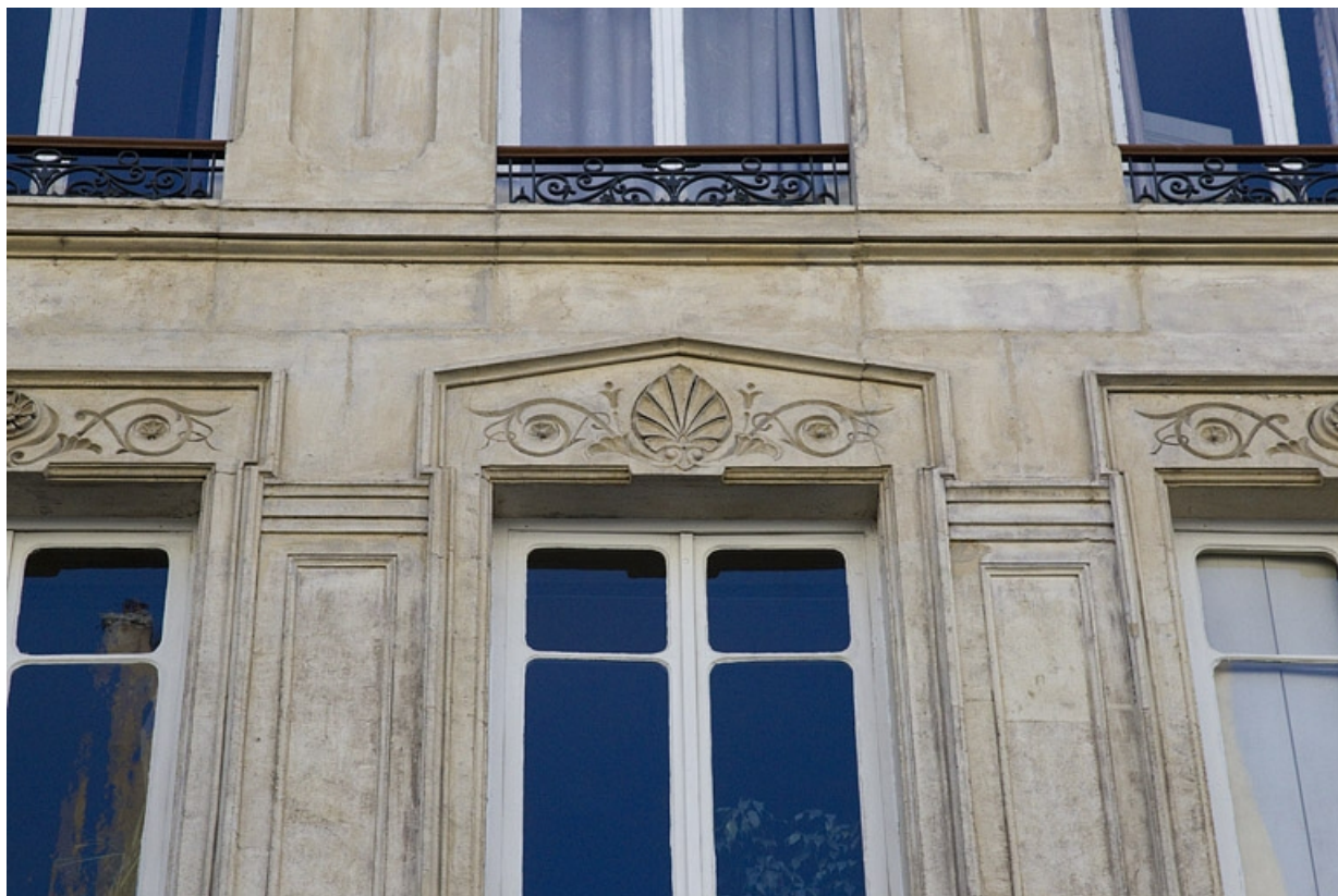
Façade antérieure, deuxième étage : détail du décor de la fenêtre centrale.

25, Besançon, 8 rue Morand, lieudit : îlot Proudhon