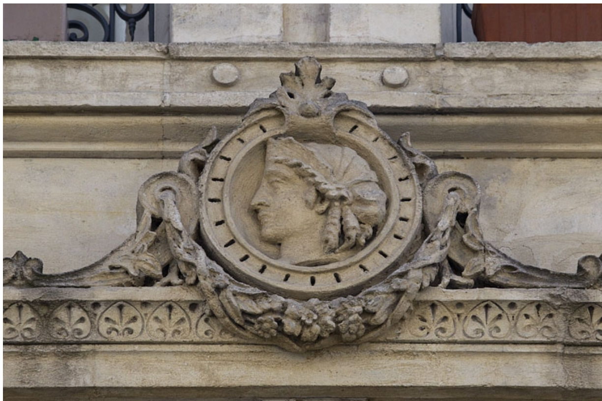
Façade antérieure, premier étage : détail rapproché du décor de la frise droite.

25, Besançon, 8 rue Morand, lieudit : îlot Proudhon