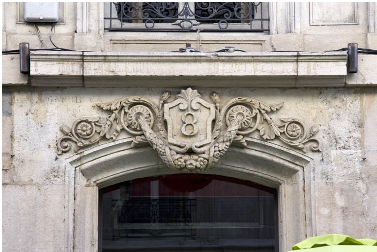
Façade antérieure, porte du couloir : détail du décor du linteau.

25, Besançon, 8 rue Morand, lieudit : îlot Proudhon