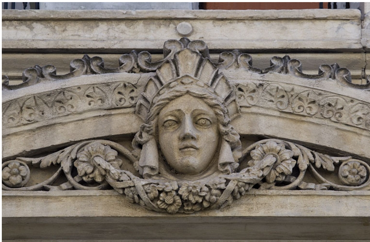
Façade antérieure, premier étage : détail rapproché du décor de la fenêtre centrale.

25, Besançon, 8 rue Morand, lieudit : îlot Proudhon