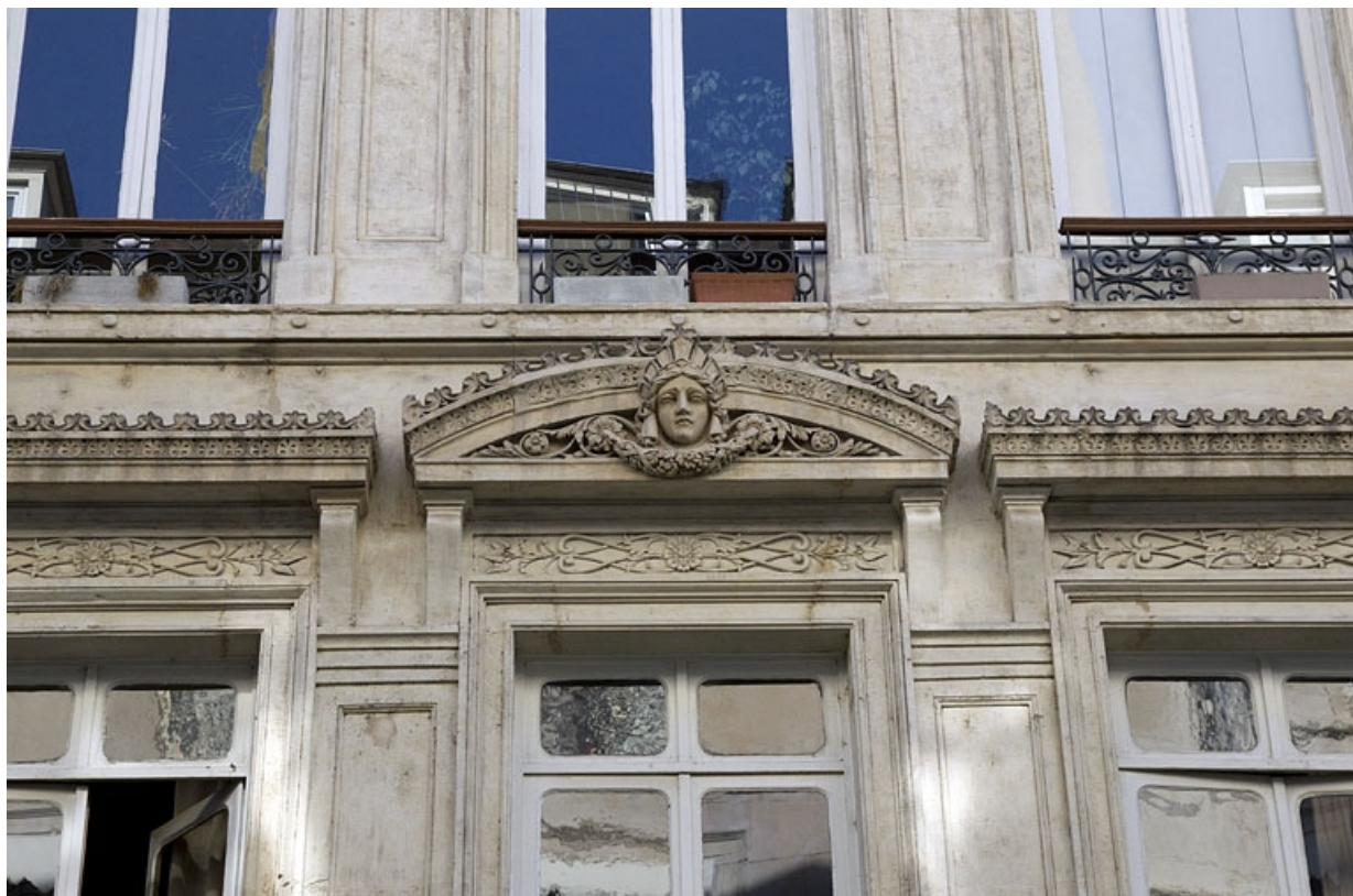
Façade antérieure, premier étage : détail du fronton sur la fenêtre centrale.

25, Besançon, 8 rue Morand, lieudit : îlot Proudhon