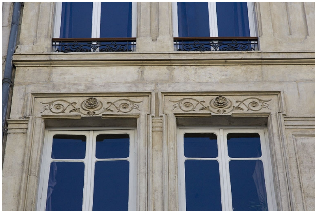
Façade antérieure, deuxième étage : partie gauche, détail du décor de deux fenêtres.

25, Besançon, 8 rue Morand, lieudit : îlot Proudhon